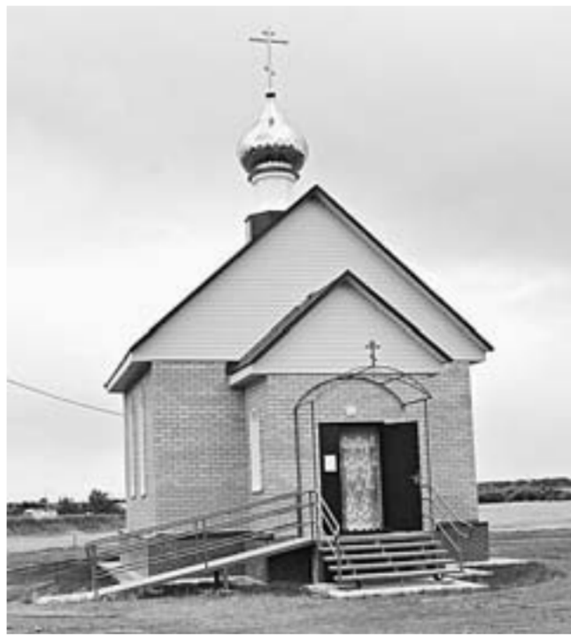
Храм равноапостольного Великого князя Владимира в Солоновке.

В недавно построенном храме равноапостольного Великого князя Владимира, что в Новичихинском районе, только за последний год покрестили 80 человек.