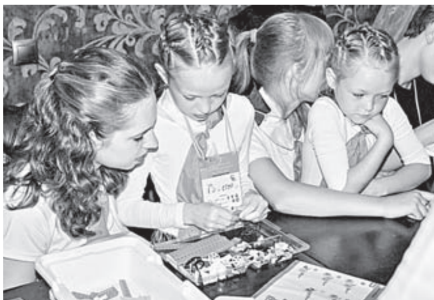
На Электронной неделе конструкторы собирали и дети, и взрослые.