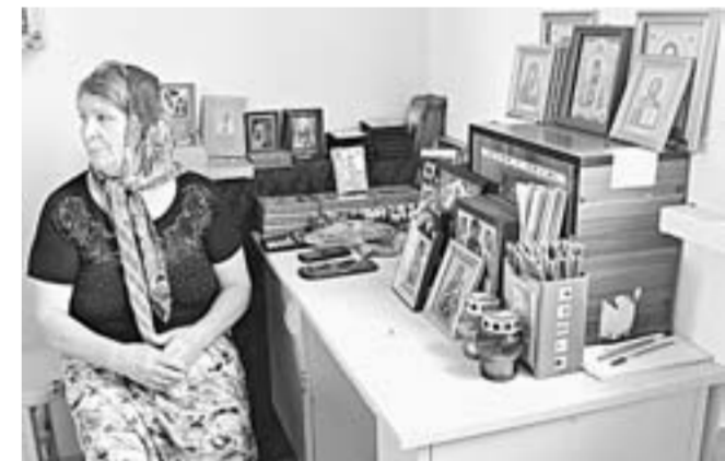
В храме тихо и спокойно, можно купить икону, поставить свечку, помолиться за близких.

– Несколько лет назад с земляками задумались над тем, что падает уровень духовности, люди перестают верить в чудо. Наша задача – возродить историю, сохранить память о предках. Съездила в краевой архив, изучила документы по переписи