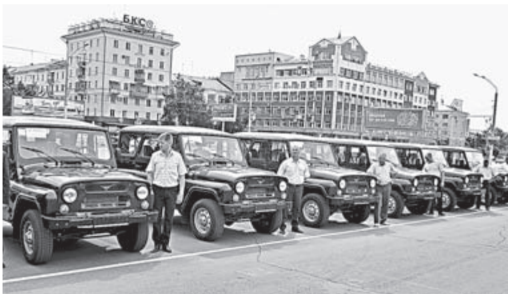
Автомобильный парк обновился!

Сибирского федерального округа. Сегодняшние транспортные средства современные, высокопроизводительные, на них можно прибыть к месту совершенного либо предполагающегося правонарушения очень быстро. Наличие технических