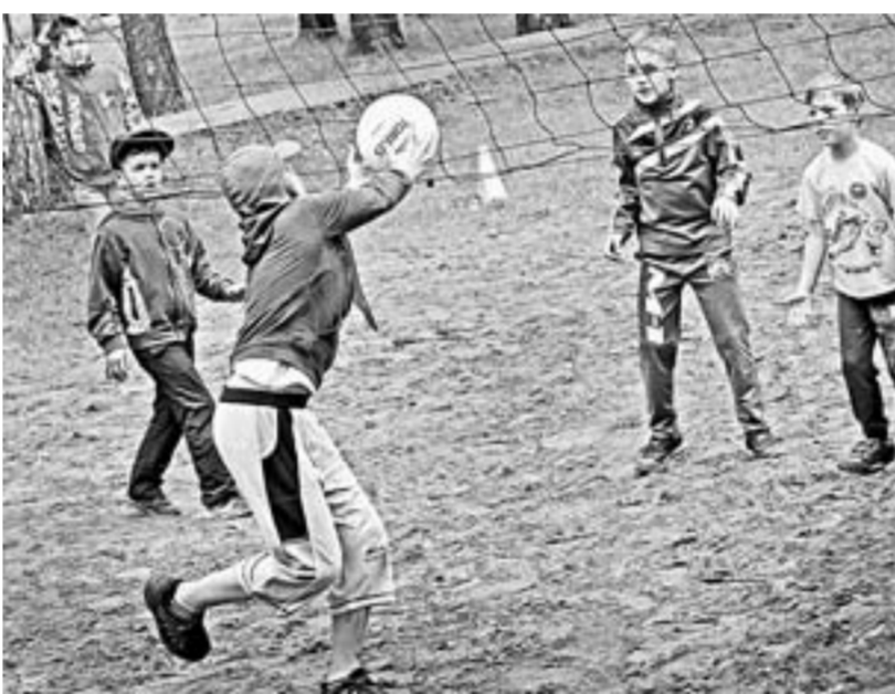
Просто лето. Просто футбол.

В отличие от любой другой летней «подростковой» вакансии, на которую можно попасть «сулиць», помощники вожатых обретают право надевать заветный синий галстук лишь после «курса молодого бойца», который проходит в