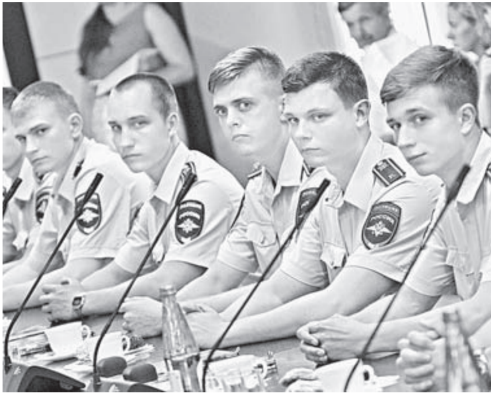
Участники встречи задали губернатору множество вопросов.

– Мы с удовлетворением отмечаем, что в последние годы в Алтайском крае последовательно сокращается уровень уголовной преступности, – подчеркнул Александр Карлин. – Наблюдаются положительные изменения в структуре преступности: сокращаются тяжкие и особо тяжкие преступления, преступления, совершаемые несовершеннолетними. Это говорит о том, что в целом правоохрани-