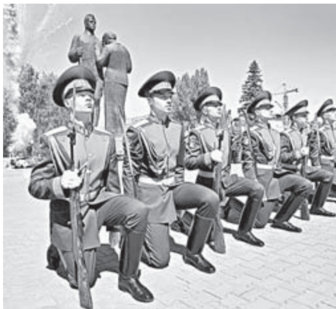
Курсанты БЮИ принимают участие во многих значимых мероприятиях в крае.

В зале научно-представительского центра института губернатор пообщался с курсантами звзда почетного караула и заместителями начальника института. Обсуждали историю и современное положение дел в Алтайском крае и Барнаульском юридическом институте. Сотрудники, курсанты и слушатели вуза в режиме видео-конференции наблюдали за разговором из лекционных аудиторий учебного корпуса.