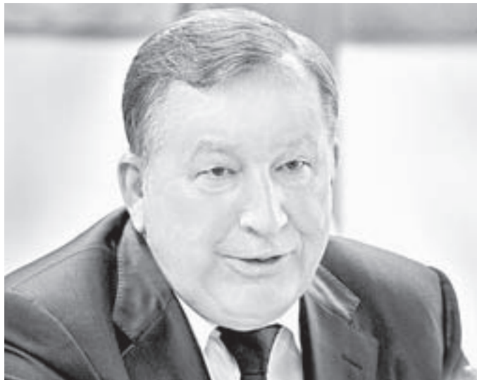
Александр Карлин: «История вуза неразрывно связана с историей края».

Сегодня, 29 июня, Барнаульский юридический институт отмечает 60-летие со дня образования. Сотрудников вуза, ветеранов и курсантов поздравили руководители подразделений МВД России СФО, представители исполнительной и законодательной власти региона и силовых структур.