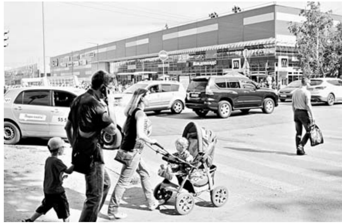
От качества городской среды зависит безопасность ее жителей.