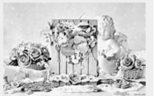
Современный скрапбукинг в павильоне «Открытое небо».

Павильон «Открытое небо», ул. Чернышевского, 55 (библиотека им. В.М. Бабунова), тел. 36-92-51.