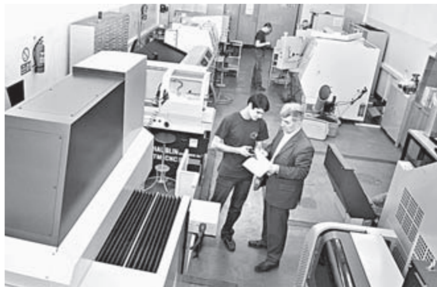
Патронный завод – один из социально-ответственных работодателей края.

Во вторник, 27 июня, состоялось очередное заседание Правительства Алтайского края, посвященное вопросам повышения социальной ответственности работодателей. Открывая его, губернатор края Александр Карлин отметил, что работа в этом направлении в Алтайском крае проводится на системном уровне начиная с 2009 года с участием всех сторон социального партнерства – представителей власти, бизнеса, профсоюзов и самих работников. – Мы решаем непростые задачи по обеспечению эффективной занятости и повышению качества жизни наших земляков, – сказал глава региона. – Придерживаясь курса на модернизацию экономики и инновационное развитие, мы эти задачи решаем достойным