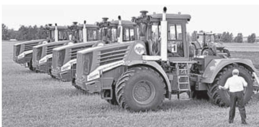
В нынешнем году аграрии региона приобрели уже 110 «Кировцев».