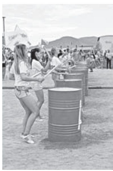
Гостей встречали барабанщицы и ростовые куклы.

По традиции, сложившейся в течение пяти лет, руководители компаний привозят на праздник образцы лучшей воды, на основе которой производят напитки. На главной сцене «АлтайФеста» ими наполняют один большой сосуд, затем эту жидкость добавляют к «эталонной воде», которую собрали на первом фестивале. В этом году эталон чистой и полезной воды