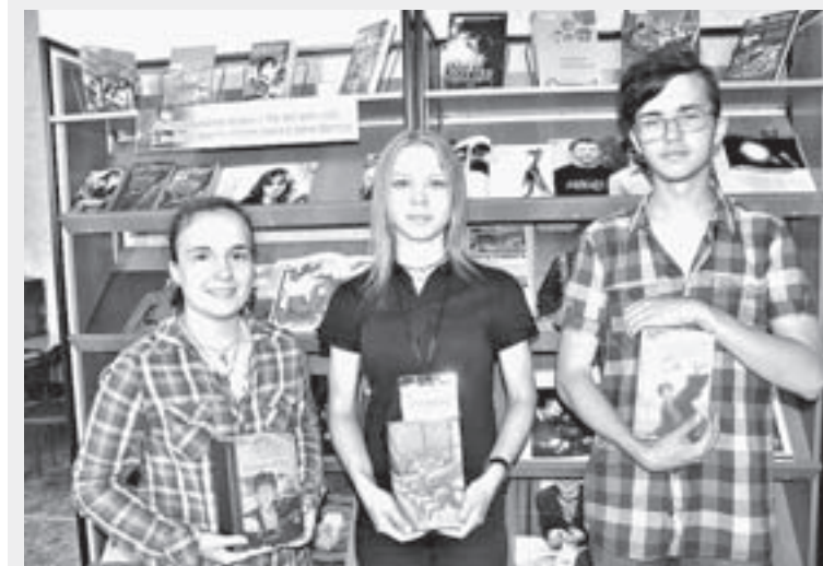
Среди молодежи много поклонников Гарри Поттера.

Немного фантазии и – можно оказаться в школе чародейства и волшебства в Хогвартсе, даже если живешь в Барнауле. В библиотеке им. В.Я. Шнишкова проходит выставка, посвященная 20-летию выхода первой книги Джона Роулинг о Гарри Поттере «Мальчик, который выжил».