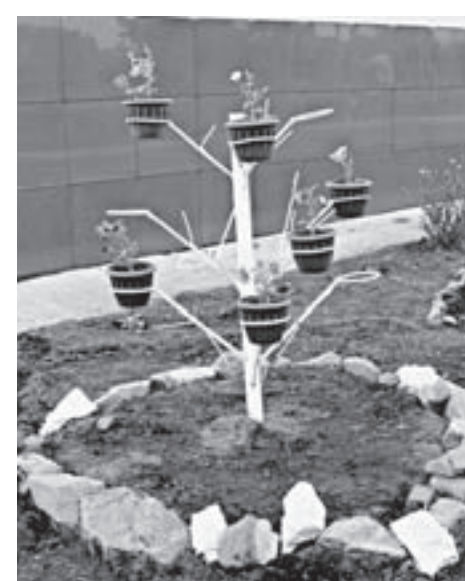
За цветочными клумбами летом следят старшенкласники.

– Должности руководителей организаций в основном занимают люди, которые прожили в селе всю жизнь. Они хорошо знают о проблемах, с которыми сталкиваются местные жители, и готовы их устранять сообща. Большую поддержку оказывают наши фермеры: чистят