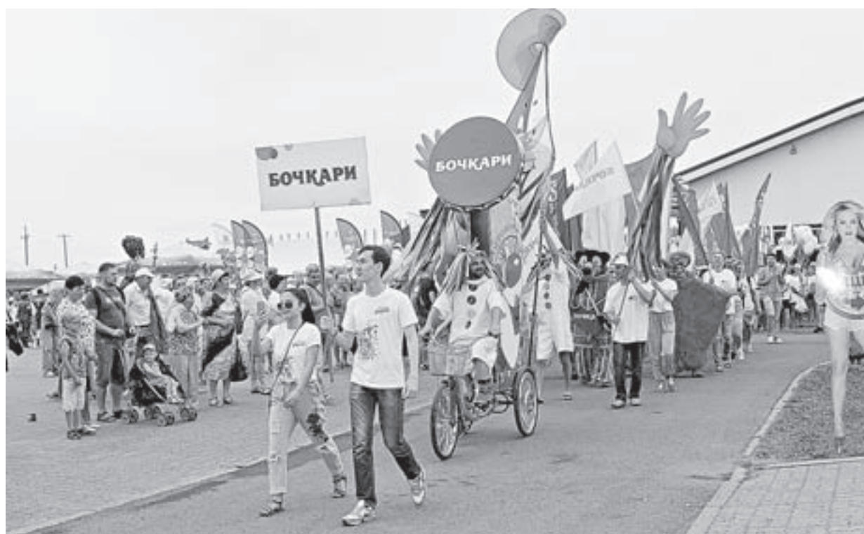
Карнавальное шествие прошло с размахом.

Журналисты «АП» прибыли со свежими номерами «толстушки» на «Сибирское подворье» 24 июня за полчаса до карнавала напитков, как раз в тот момент, когда гости «АлтайФеста» делали селфи на фоне живых скульптур, барабанщиц, оркестра, играли в 3D-головоломки и участвовали в спортивной разминке под веселые команды тренера.