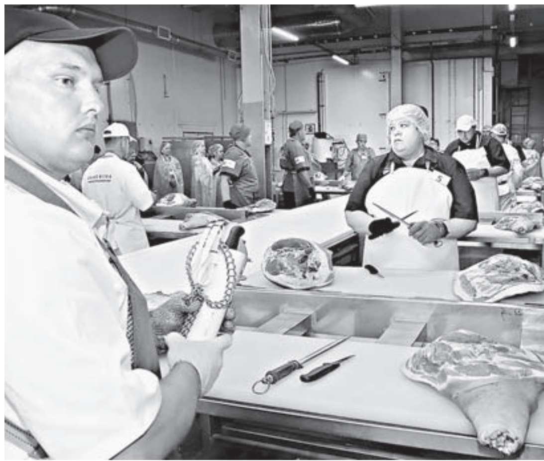
С сырьем у мясопереработчиков проблем нет.

Статистика говорит, что по результатам пяти месяцев производства мясных изделий в крае сократилось на 3 – 5% в сравнении с тем же периодом прошлого года. Эксперты рынка объясняют это возросшей конкуренцией с инорегиональными производителями, снижением покупательной способности граждан и непомерными аппетитами торговых сетей.