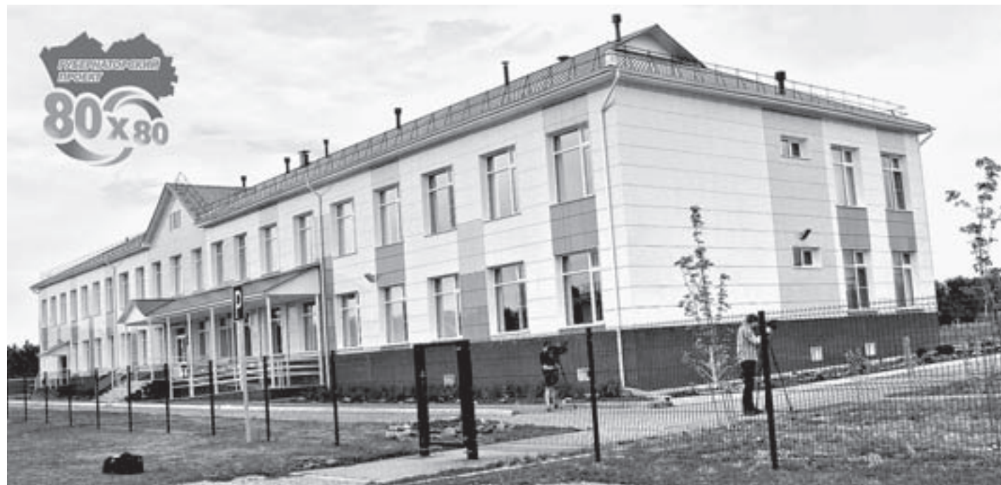
Солоновская средняя школа распахнула двери в 2015 году.

В Солоновской средней школе, построенной по губернаторской программе «80x80», летом жизнь не прекращается.