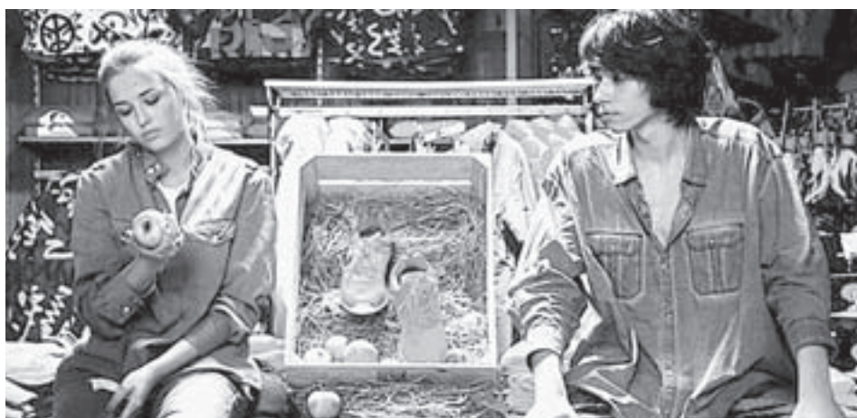
«КЕ-ДЬ» - картина о поиске места в жизни.