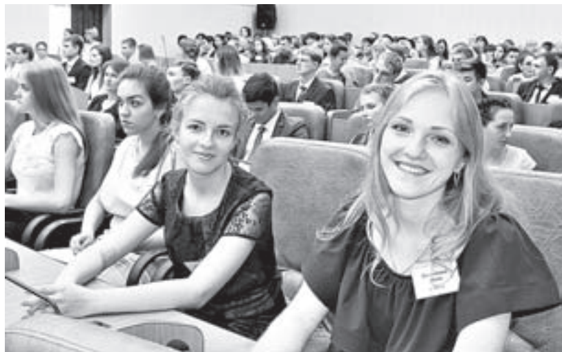
На встречу с губернатором приехали 89 выпускников школ из разных уголков Алтайского края.

Выпускников-отличников Алтайского края с успешным окончанием школы поздравил губернатор Александр Карлин.