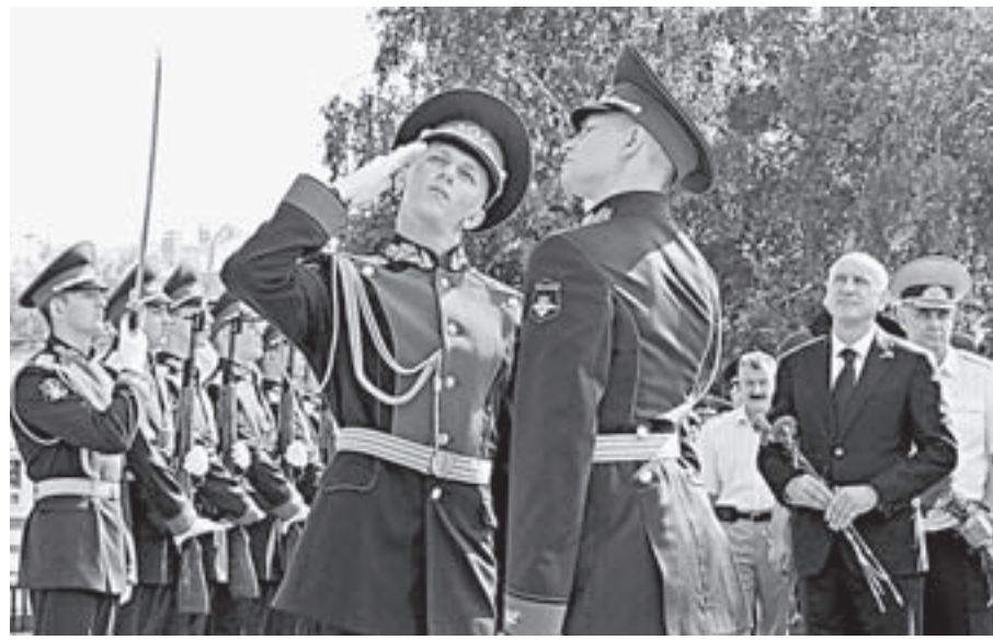
Почётный караул у Мемориала Славы.