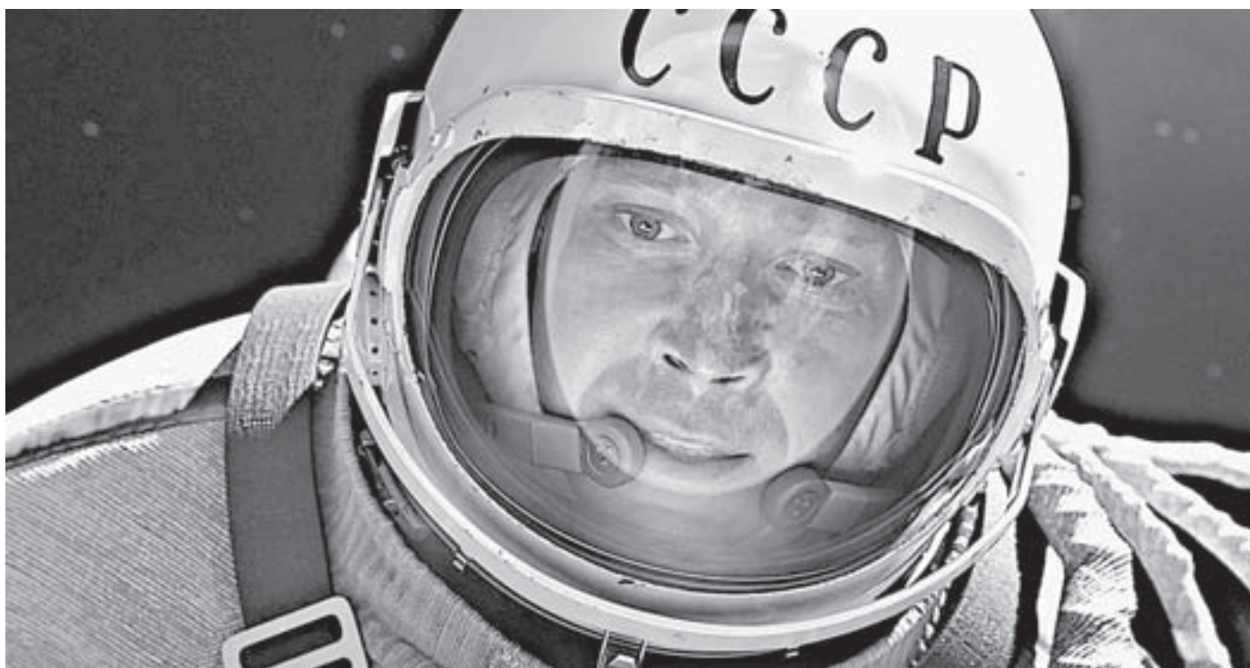
И вновь «Время первых».