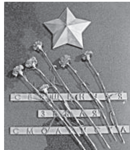
22 июня 2017 года.