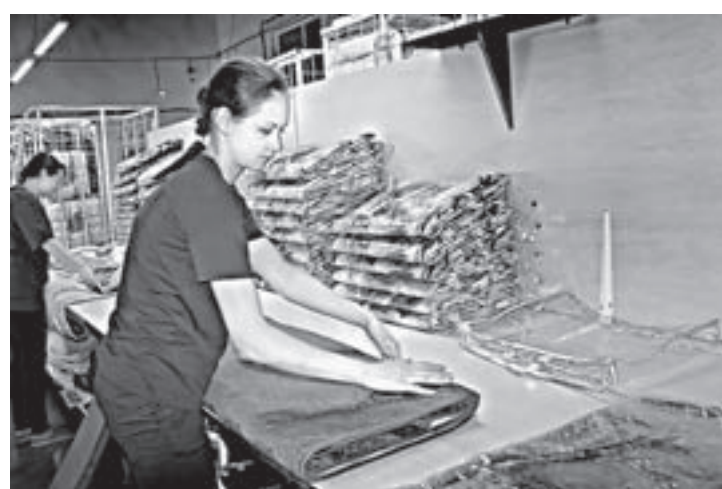
В фасовочном цехе.

Идея заняться мойкой шерсти возникла у предпринимательницы не случайно.