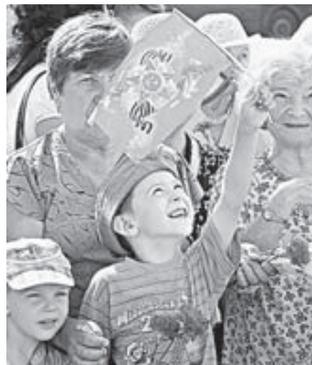
Чтобы дети не знали войны...