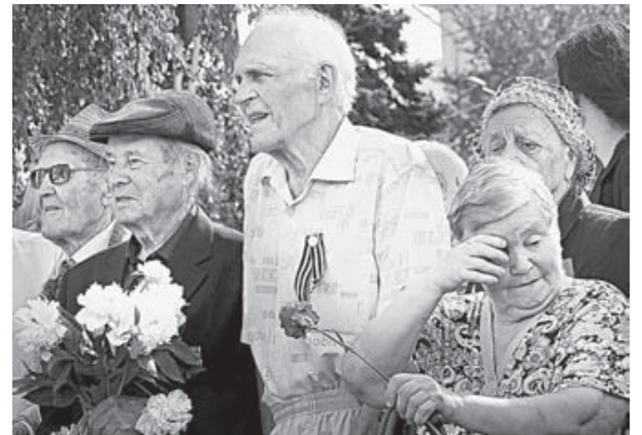
Барнаульцы почтили память погибших.