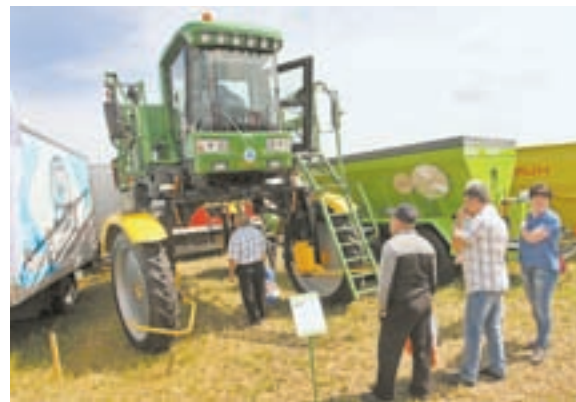
Не техника, а загляденье.

руководства страны, в регионе наблюдается заметный рост в этой отрасли. По линейке выпускаемой продукции, начиная с собираемых на Алтае тракторов К-744Р производства Петербургского завода (с высокой степенью локализации) до почвообрабатывающих машин и механизмов, мы первые в стране. Посевные комплексы, произведенные в нашем регионе, поставляются в десятки российских регионов во многом потому, что наша техника конкурентоспособна по соотношению цены и качества.