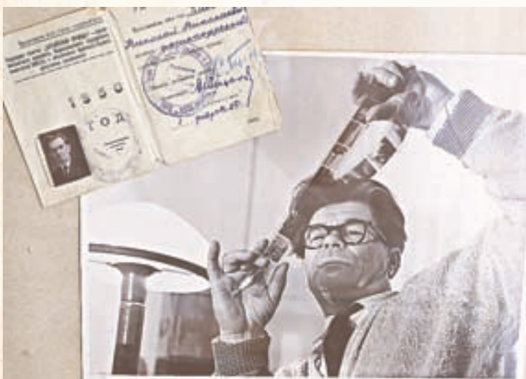
Из жизни советского фотокора.