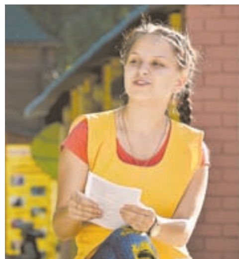
Молодежь читает стихи военных лет.

21 июня программа «Завтра была война» была полна военных песен (которые пели все гости парка!), стихов той поры,