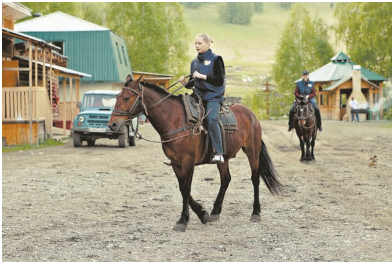
«Бирюзовая Катунь» – это еще и активный отдых.