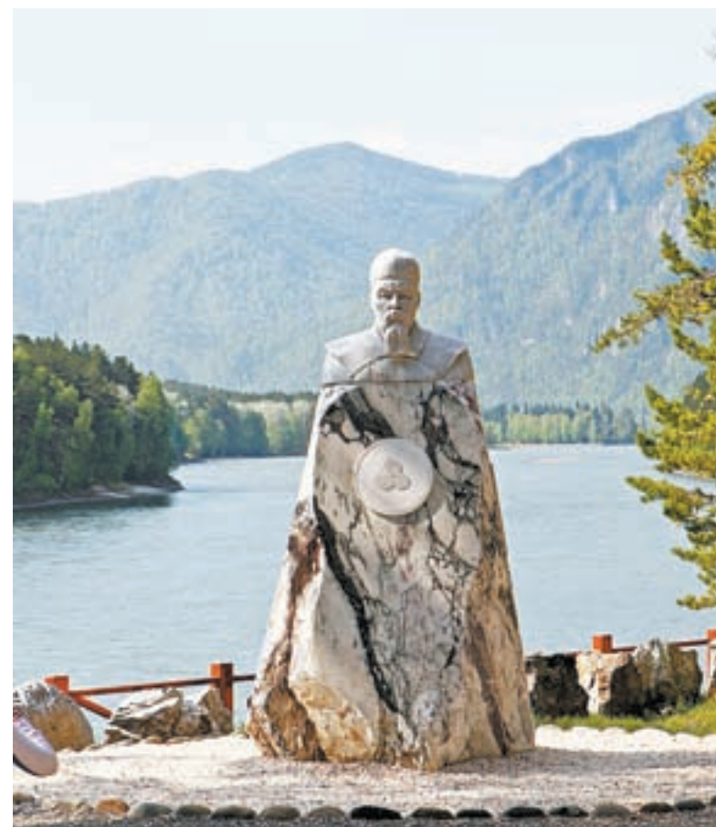
Памятник Рериху – отсюда открывается живописный вид на Катунь и горы.

«Бирюзовая Катунь» – это еще и центр событийного туризма. В августе там пройдут соревнования по триатлону. Площадка стала востребована среди спортсменов-любителей. Ежегодно проходят соревнования по пляжному волейболу, баскетболу. Безусловно, яркий акцент лета на «Бирюзовую Катунь» – музыкальный фестиваль Because of the Beatles, посвященный знаменитой английской четверке. Он пройдет 1 июля. На фестивале сыграют группы из Новосибирска, Горно-Алтайска, Барнаула. Главным гостем станет един-