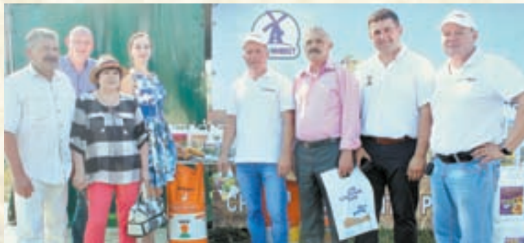
В этом году ООО «Агроинвест» представил сельхозпроизводителям более 30 наименований препаратов.

– Мы занимаемся продажей гибридов кукурузы по всей