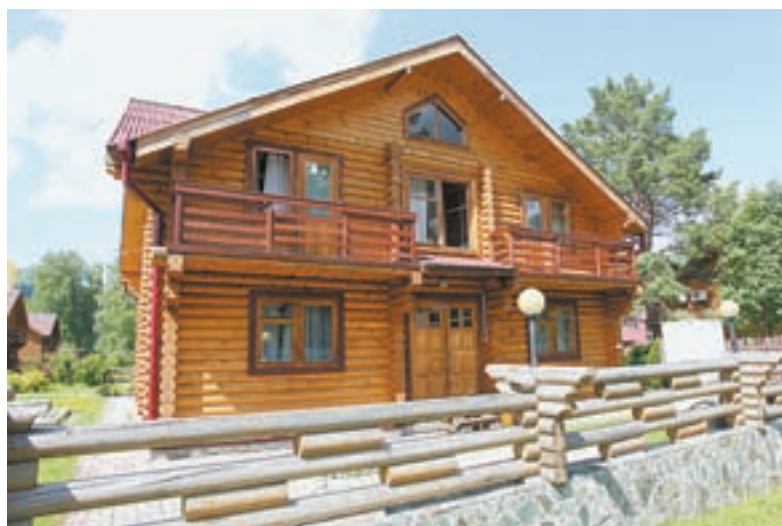
Ежегодно в особой экономической зоне добавляются места для проживания туристов.

Кроме того, как уже сообщала «АП», еще один инвестор «Бирюзовой Катунь» планирует осваивать первый в крае кемпинг-парк. Это будет уже не так называемый дикий кемпинг с минимумом удобств, а хорошая стоянка трейлеров с кухней, благоустроенными сантехническими блоками. Сроки сдачи объекта – 2020 – 2021 годы. Кемпинг такого рода предусматривает определенную инфраструктуру, поэтому сдача объекта будет проводиться поэтапно.