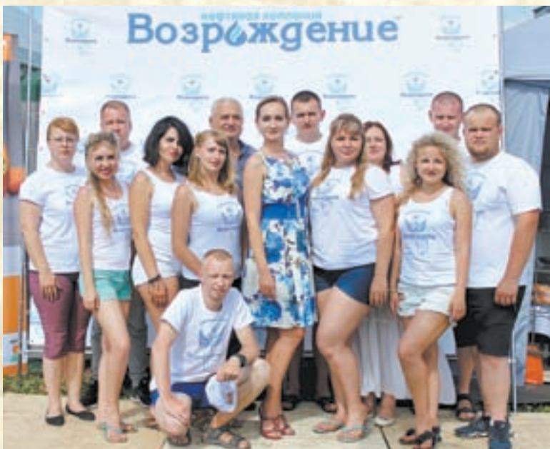
Коллектив ООО «Возрождение» работает как единый организм.

– Мы не ставим задачу нажиться на клиентах, наша сила в правде. В жестком мире конкуренции качество топлива оставляет желать лучшего, поэтому стараемся держать марку, продавать только качественное топливо, клиенты это ценят и остаются верными нам. Как гласит мудрость, разочарование от низкого качества длится дольше, чем радость от низкой цены. Мы поставляем ГСМ прямо с заводов-производителей, причем не работаем с ТУ, ориентируемся только на ГОСТовскую продукцию, – говорит генеральный директор нефтяной компании