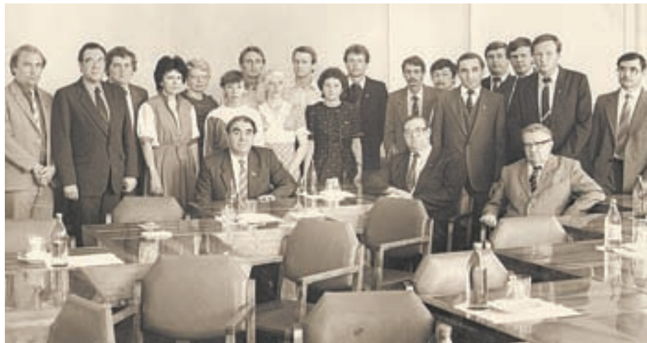
Алтайская делегация перед отправкой на международный форум.

Его по-хорошему удивила делегация из США, состоявшая из 380 человек. Американцы представили 84 молодежные организации. На фестивале было две тысячи советских граждан, однако они демонстрировали гораздо меньше объе-