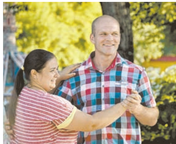
...и первые уроки аргентинского танго.

Бардовские песни и жаркое аргентинское танго, уроки игры на гитаре и в шахматы, советские песни и стихи, игры нашего детства... Библиотека им. В.Я. Шишкова и барнаульский парк «Солнечный ветер» продолжают уникальный проект «Открытая библиосреда».