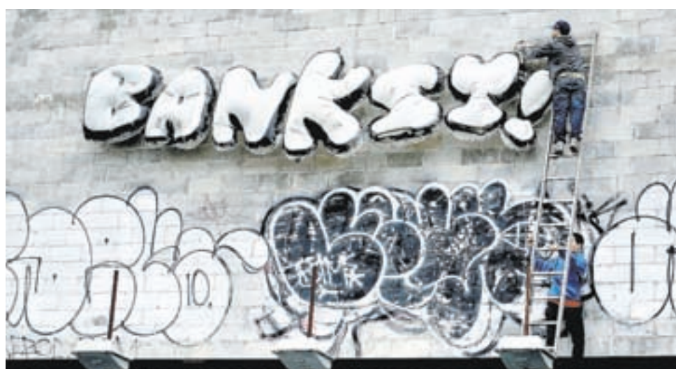
Горожане пытаются украсть работу художника, созданную из воздушных шариков.

знался один из фанатов художника). Причем галеристы, искусствоведы, журналисты и прочая приличная публика вынуждены были отправляться за очередным произведением Бэнкси в такие районы Нью-Йорка, где сроду не бывали: в запущенную промзону на грани сноса, в бывшее гетто, в опасный квартал, где местные ребята стали взимать плату за возможность сфотографировать граффити... «Реакция публики стала частью произведения», – заметил один искусствовед.