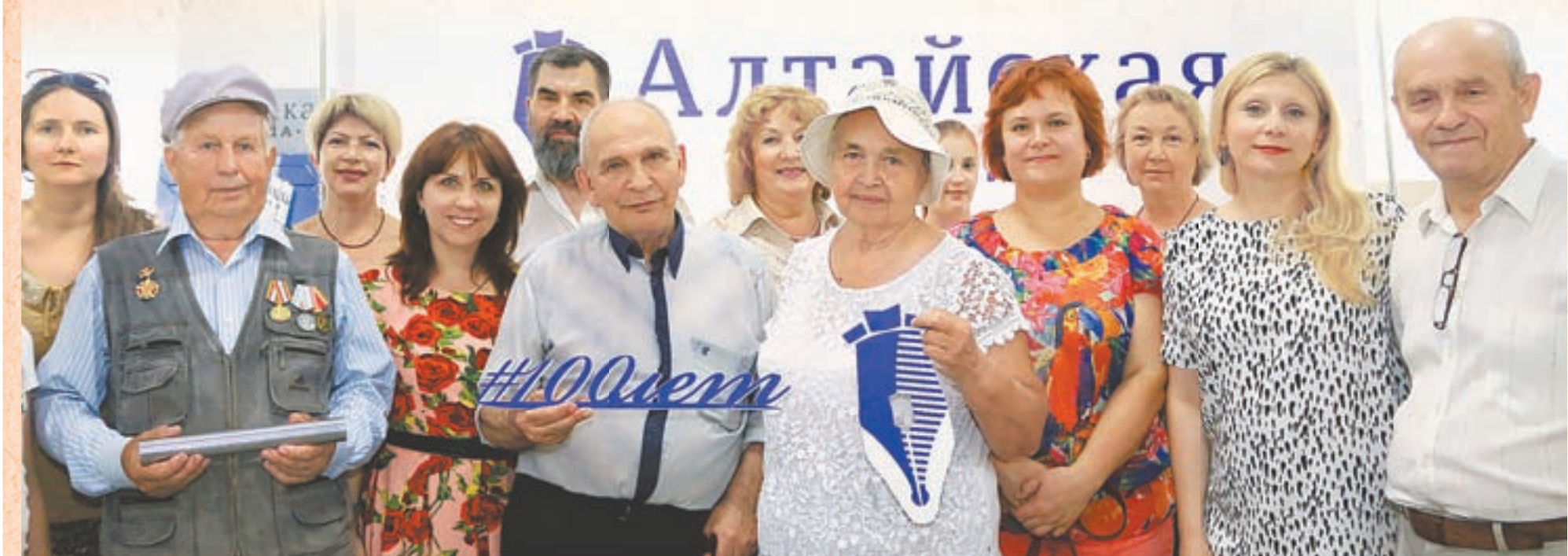
Поздравить газету с юбилеем пришли ветераны, музейные работники и постоянные читатели «АП».

Экспозиция, которая открылась в краевой столице в выставочном зале музея «Город», посвящена 100-летию «Алтайской правды».