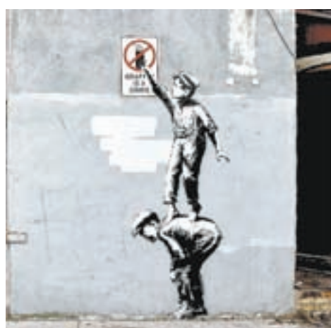
Через несколько часов эту работу Бэнкси полностью закрасил владелец здания.