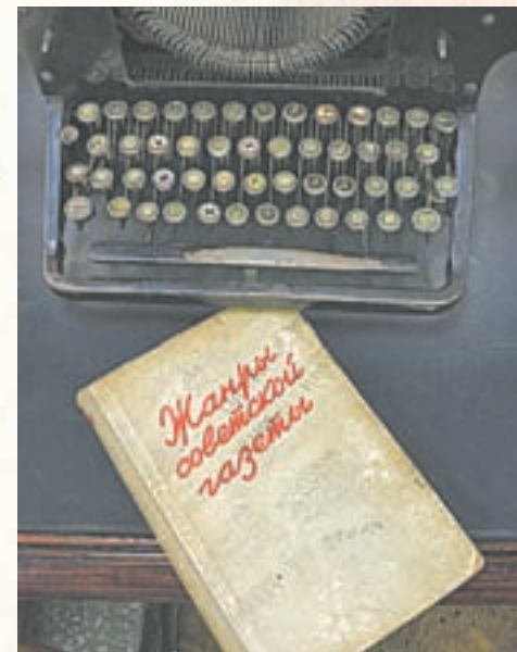
Когда-то оригиналы материалов набирались на печатной машинке.

начав с самого интересного – кабинета редактора, оформленного в стиле 1950 – 1960 годов. В то время неизменным атрибутом кабинета редактора советской газеты были телефоны, один из которых напрямую соединял с крайкомом или горкомом партии. На книжной полке стояли часы в массивном корпусе, изготовленные в годы Великой Отечественной войны для танков Т-34, в мирное время их приспособили к нуждам гражданского населения. Там же, на полке, труды Иосифа Виссарионовича Сталина и Владимира Ильича Ленина, а также «Справочник пропагандиста». По другую сторону стола – радиоприемник «Урал-57» в специальном корпусе, который назывался акустическим ящиком. В кабинете редактора