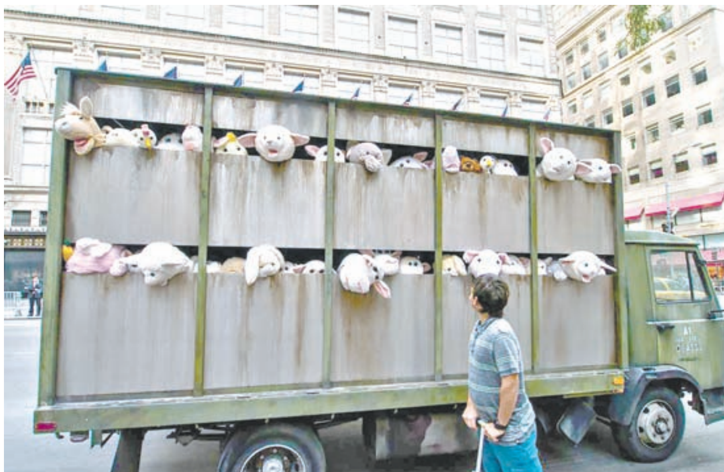
Одна из лучших нью-йоркских работ Бэнкси – грузовик с плюшевыми зверями – призывает задуматься о жестокости по отношению к животным.

Среди специалистов и обычных поклонников стрит-арта это известие вызвало небольшое помешательство: люди стали выслеживать новые творения («Это похоже на охоту за сокровищами», – при-