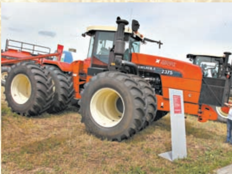
Трактор VERSATILE 2375 участвует в программе «1432».

Нужно отметить, что в последнее время большой популярностью у аграриев, в силу сложившейся экономической ситуации, пользуется трактор VERSATILE 2375. Дело в том, что он реализуется в рамках федерального постановления №1432, которое предполагает субсиди-