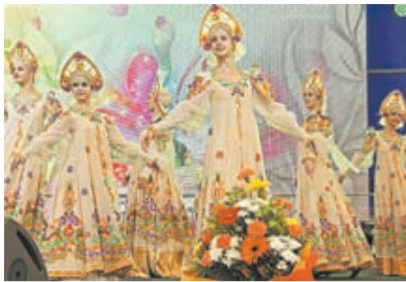
Яркие моменты праздника.