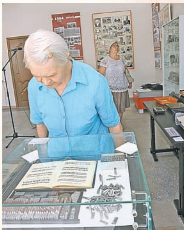
Посетители выставки с удовольствием изучали экспонаты.