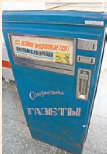
Вот в таких киосках покупали номер «АП» за три копейки...

4 июля в 11 часов на пр. Ленина, 111 состоится встреча ветеранов редакции газеты «Алтайская правда» с читателями «АП»,