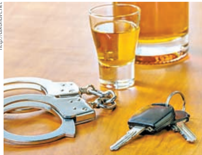
За руль надо садиться трезвым.