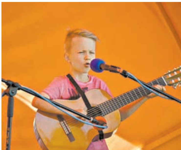
Участники мастер-класса игры на гитаре...