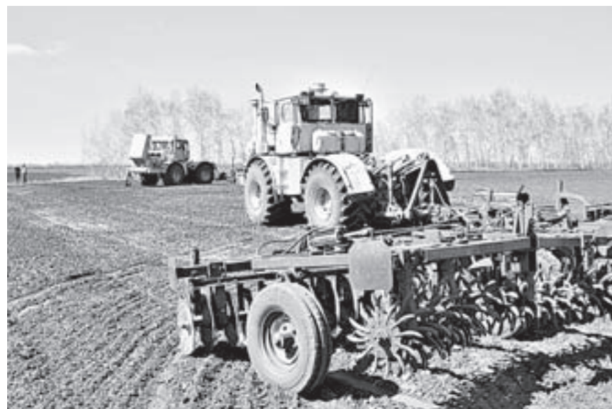
Увеличение сроков действия соглашений Минсельхоза с регионами – хорошая новость для крестьян.

Правительственная комиссия по региональному развитию в РФ поддержала предложение губернатора Алтайского края об увеличении сроков действия соглашений регионов с федеральными министерствами.