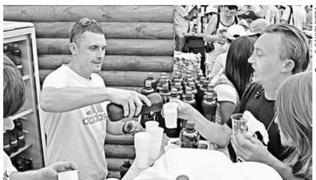
Мероприятие соберет лидеров пивобезалкогольной отрасли.

«АлтайФест» состоится уже в пятый раз на территории ТРК «Сибирское подворье», принадлежащего ЗАО «Курорт Белокуриха». Он стал любимым и ожидаемым событием летнего сезона. Мероприятие ежегодно посещают тысячи гостей. В 2016 году «АлтайФест» вошел в тройку лидеров Национальной премии в области событийного туризма Russian Event Awards из Сибирского и Дальневосточного округов в номинации «Лучший проект в области гастрономического туризма».