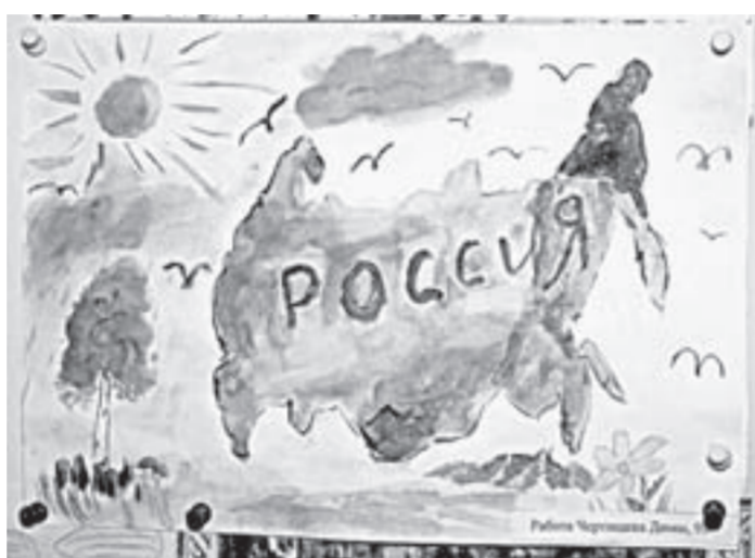
Рисунок одного из призеров конкурса «Россия – Родина моя».