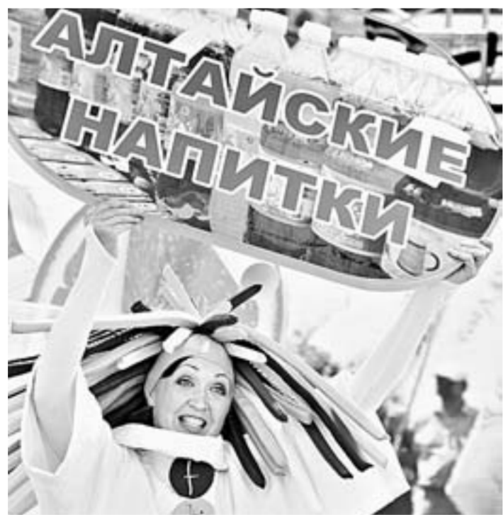
Организаторы приготовили насыщенную развлекательную программу.

В этом году мероприятие соберет на своей площадке лидеров пивобезалкогольной отрасли: Бочкаревский, Волчинский, Барнаульский, Борихинский пивоваренные заводы и другие предприятия по производству напитков, соков, нектаров, минеральной воды, кваса.