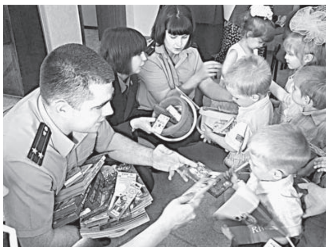
Гости в погонах вручили детишкам подарки.