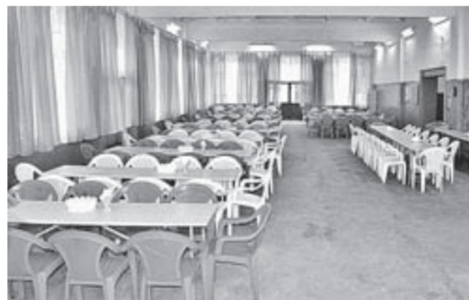
Обеденный зал лагеря «Медвежонок» рассчитан на 150 мест.