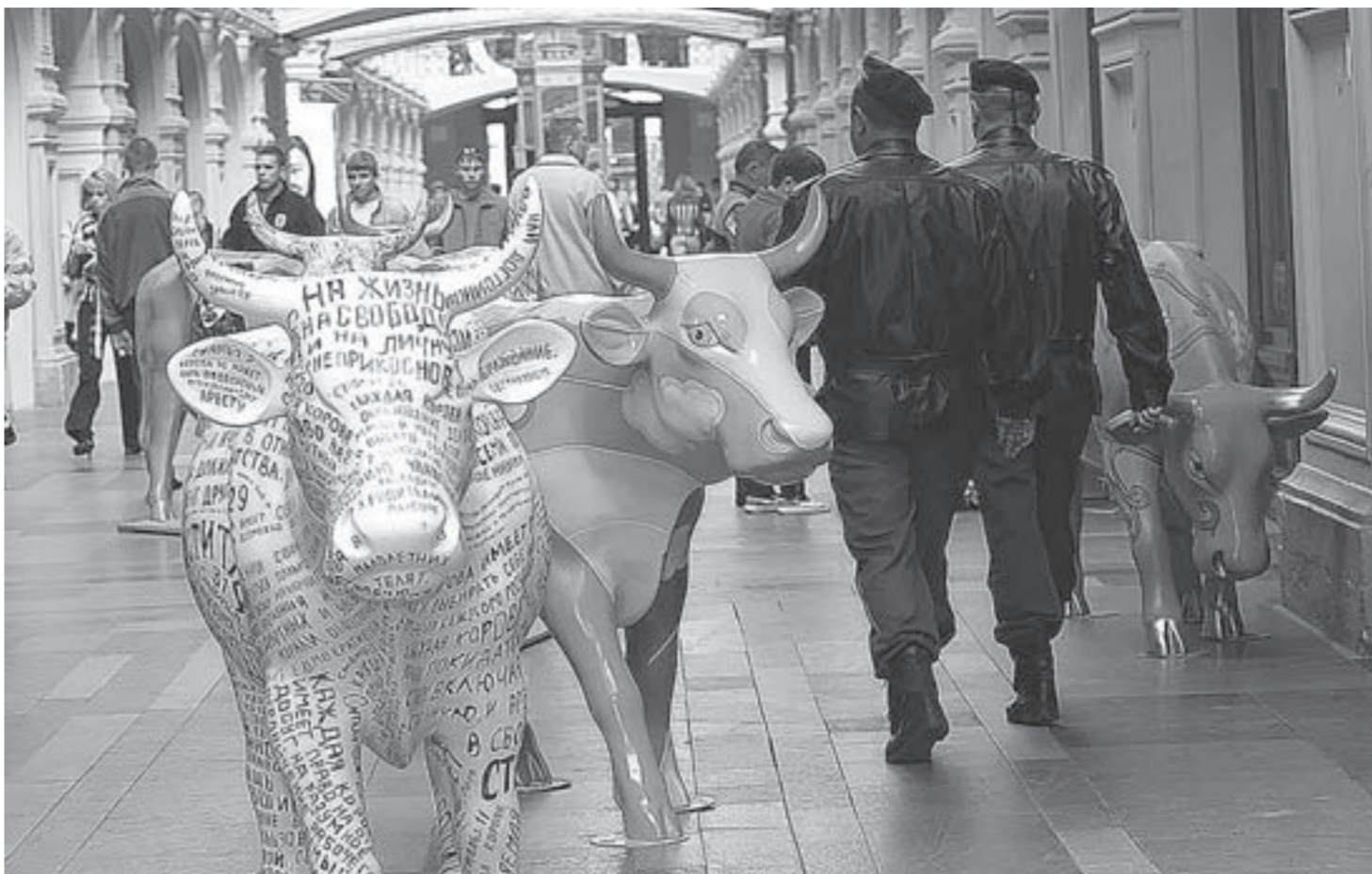
Верхние торговые ряды (сегодня - ГУМ) построены еще при Екатерине Великой. Сегодня это известный столичный центр торговли товарами класса лакшери.

В России начинают возрождать торговые ряды, которые создадут конкуренцию торговым сетям и должны помочь сбить рост цен на товары не только первой необходимости, но и премиум-класса.