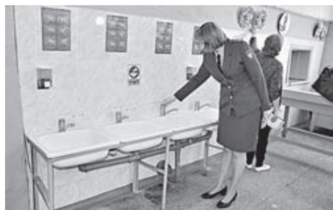
Комиссия проинспектировала столовую и пищеблок.