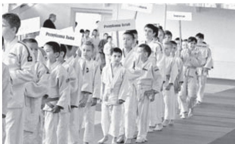
Впереди два дня борьбы.

– Для ребят это значимый старт, в этом возрасте они делают первые шаги в спорте: кто-то начинает с побед, кто-то с пораже-