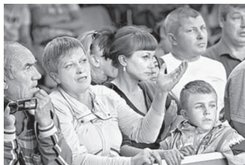
Строгих разборов схваток не избежать.

11 июня он отправится на сборы в Хорватию и будет готовиться к чемпионату мира, который стартует в конце августа в Будапеште. Также в планах алтайского дзюдоиста