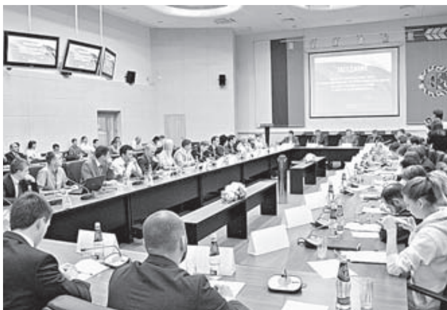
В заседании приняли участие представители власти, бизнеса, молодые предприниматели.