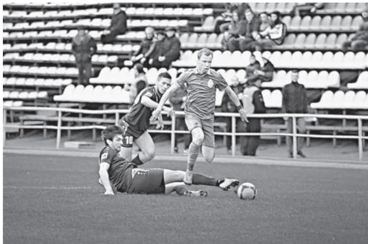
Нынешний турнир называют куцым.

Кризис футбола в восточной группе ПФЛ пользует со страшной