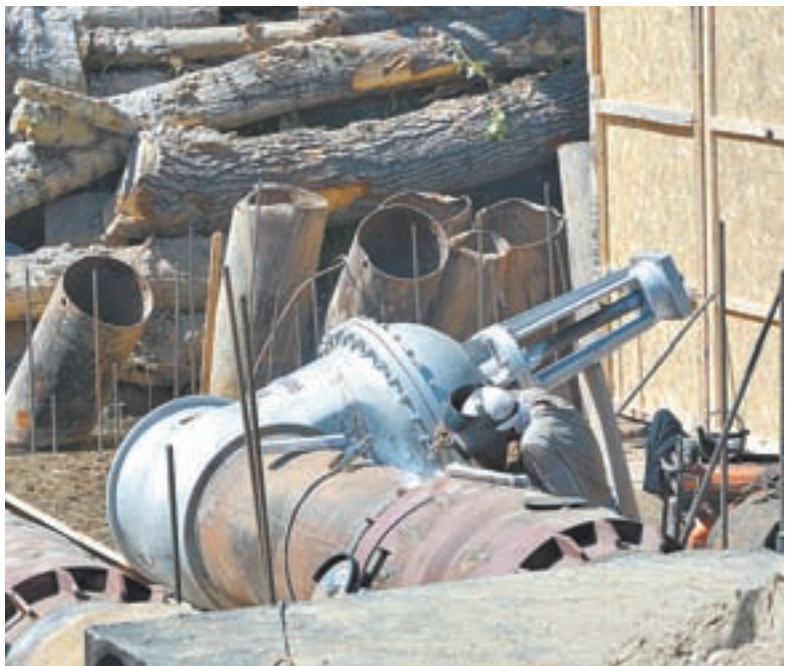
Строительство перемычки между теплосетевыми контурами южной и северной частей Рубцовска.

Еще зимой начались работы по строительству так называемой перемычки длиной более двух километров, чтобы сделать единый сетевой контур для двух обособленных частей города. Для того чтобы Южная тепловая станция могла подавать тепло в северные микрорайоны, также необходимо переложить около четырех километров уже существующих сетей, если считать в одностороннем исчислении, то 13 километров.