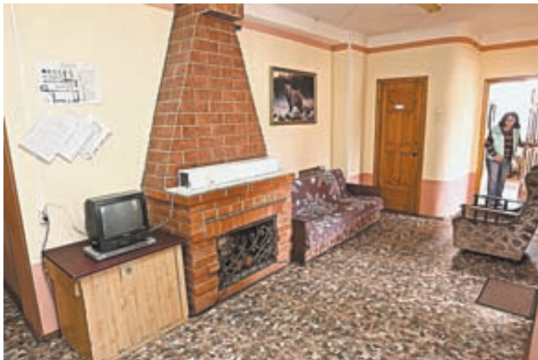
В холле – уютный уголок отдыха.

более комфортные условия, соответственно, и цены за услуги выше. «Зеленый дом» пользовался большим спросом у командированных, в районный центр часто приезжали инспекторы с проверкой в Отделение Пенсионного фонда, Сбербанк, полицию и так далее. Сейчас наполняемость небольшая, так как все филиалы федеральных структур в районе закрылись.