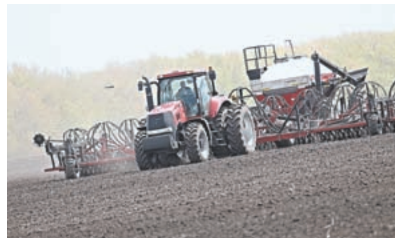
Финансирование сельского хозяйства остается приоритетной статьей бюджета.

рынки возникла необходимость защиты интересов отечественных сельхозтоваропроизводителей. Как перебороть ситуацию, когда наши высококачественные продукты продаются в сегменте дешёвых товаров?