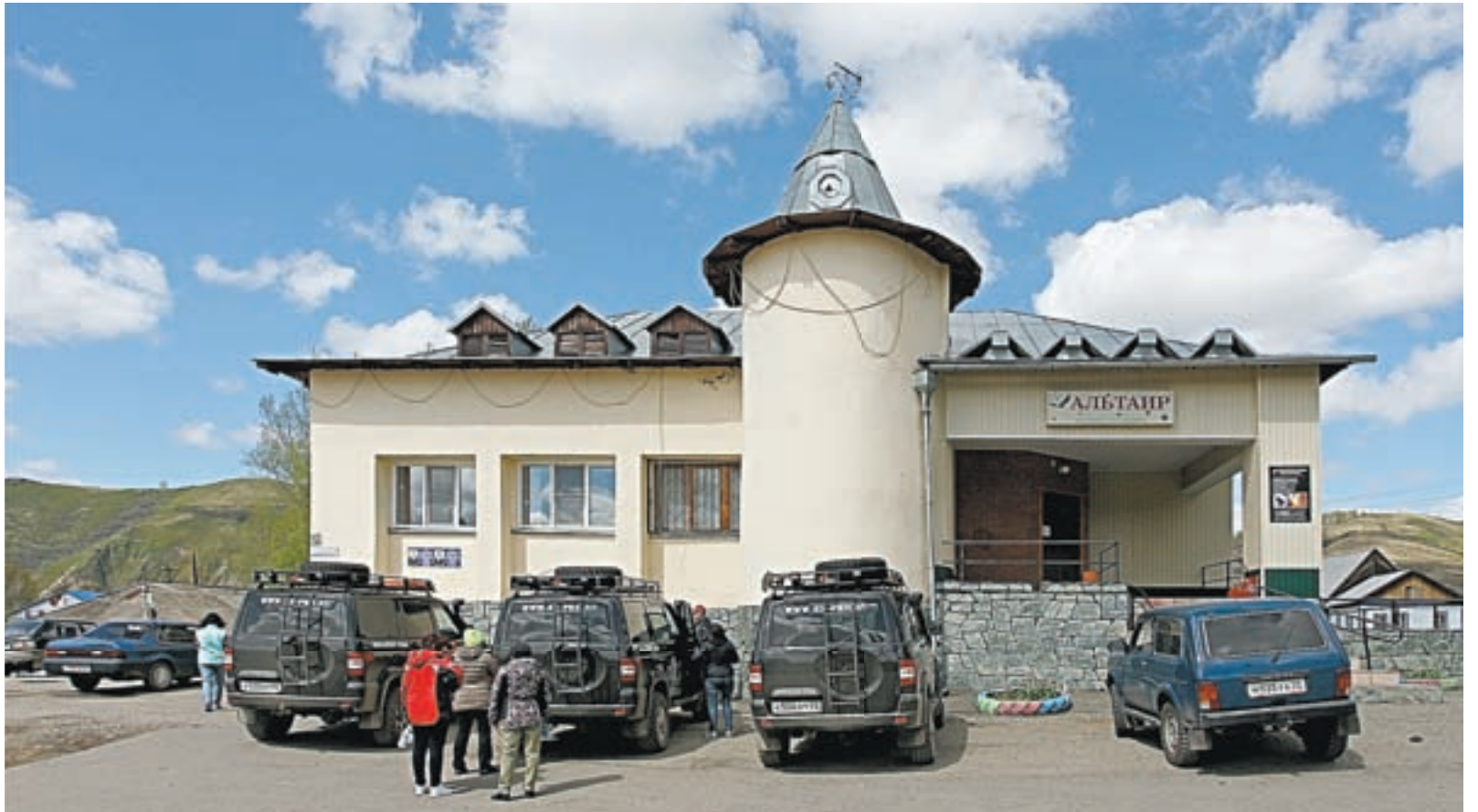
Журналисты «АП» побывали в Солонешенском районе в рамках автопробега.

– На первых порах она пользовалась большим спросом, поскольку остановиться проезжим в районе больше негде было. Цены у нас умеренные, условия, приближенные к домашним, есть кухня, можно приготовить горячую пищу, так что клиент пошел. Мы даже начали расширяться, купили помещение под гостиницу, получилось что-то вроде «зеленого дома». Там