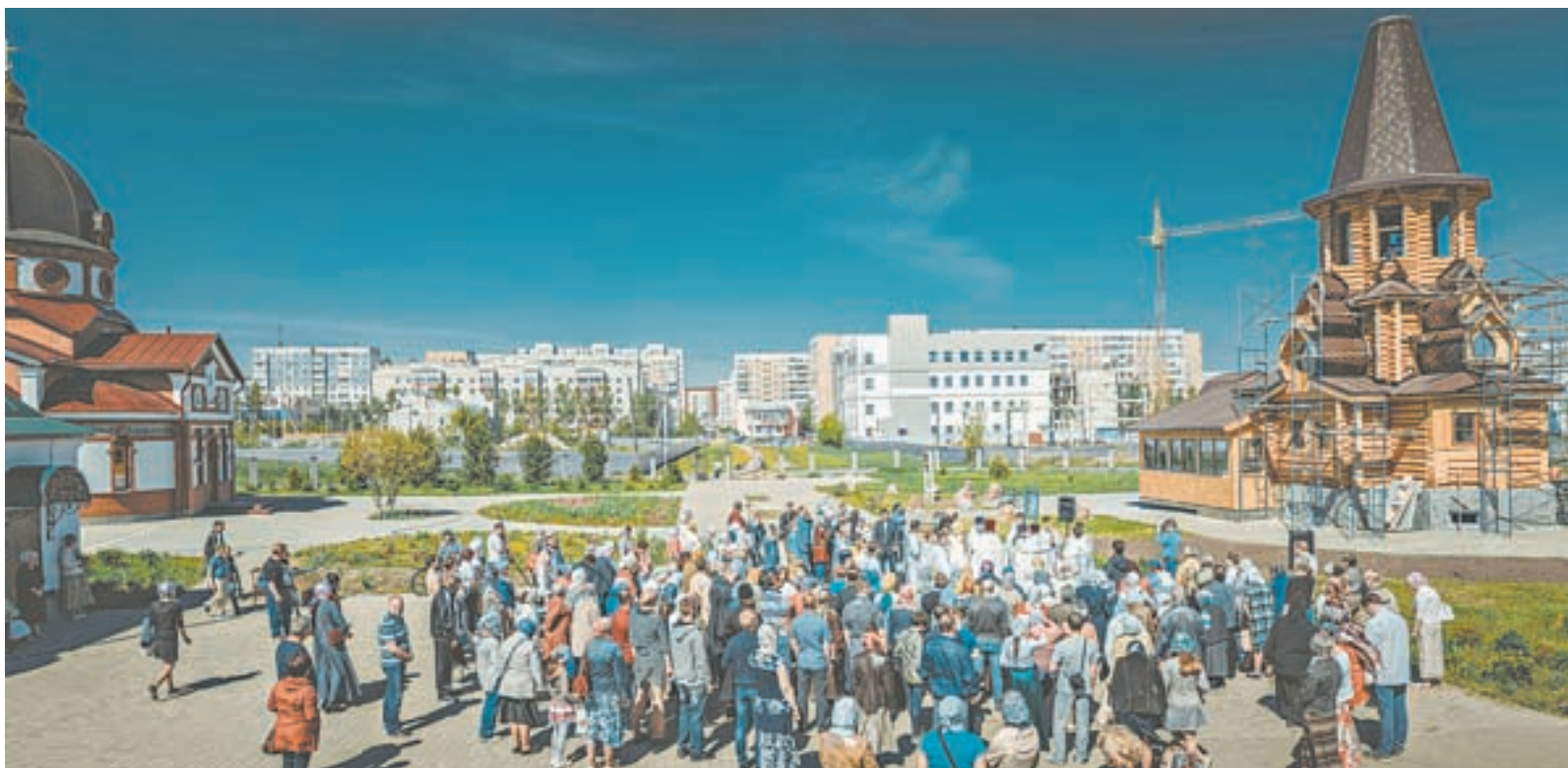
Фестиваль звонарского искусства Сибири прошел на Алтае впервые.