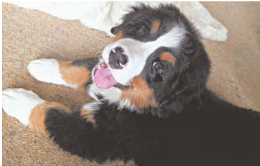
«Я умный и все смогу. Только научите!»

Собака должна знать своё место. Воз- можно, надо начать именно с этого – определиться с местом пёсика. Спать питомец должен не на возвышенности, на диване или кровати, а внизу, на ле- жанке. Подготовьте ему удобный ма- трасик, покажите, дайте понюхать. И