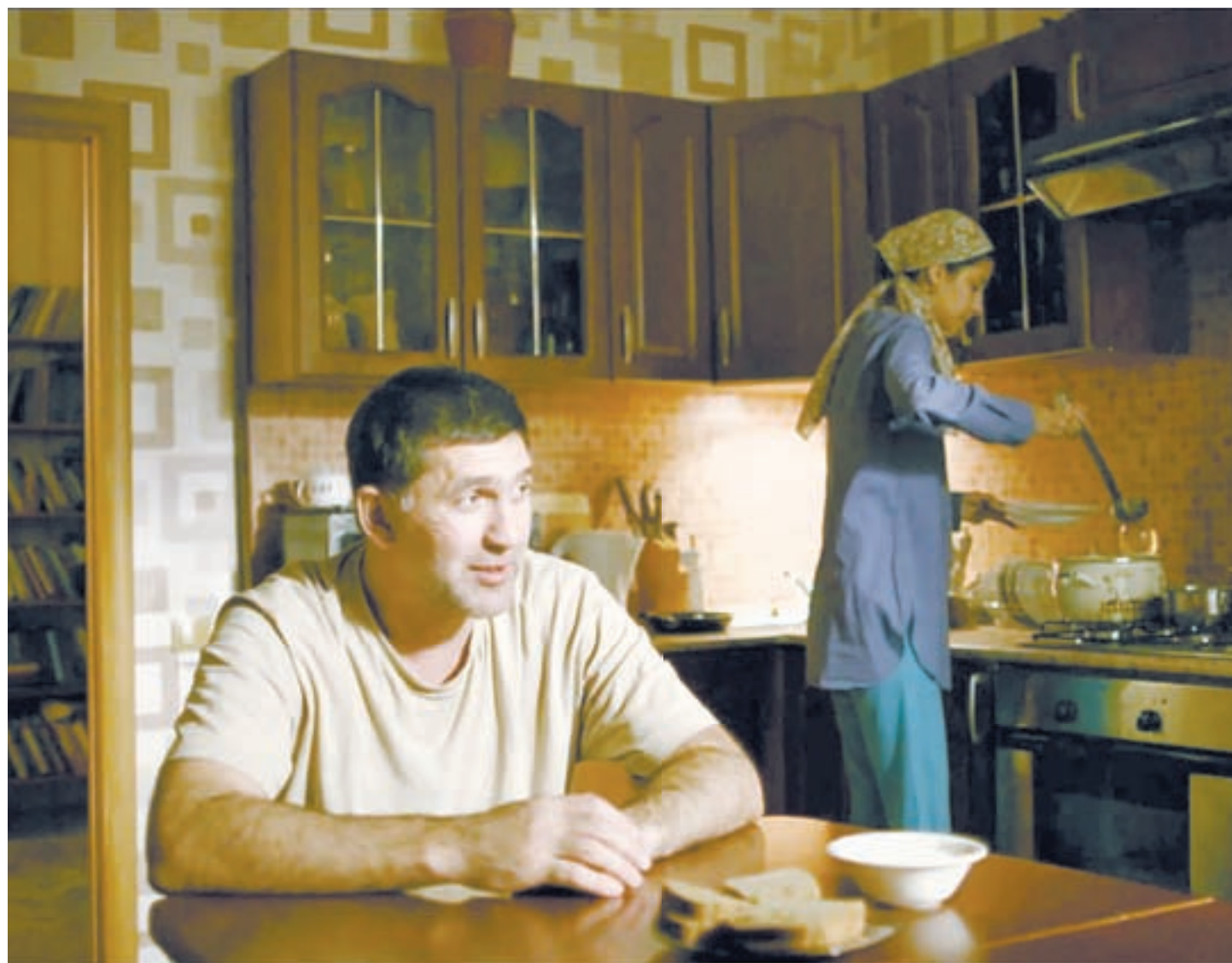
Ностальгические мотивы сильны в этом сериале.

«Дела», за которые берутся наши напарники, не поражают изощренностью. Например, во второй серии они раскрывают мнимое ограбление и убийство соседа, который только