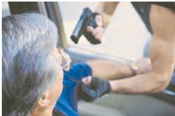
За проезд по дорогам приходилось платить.

Механизм совершения преступлений был отработан четко. При этом группа соблюдала конспирацию, действовала по одной и той же заранее разработанной схеме.