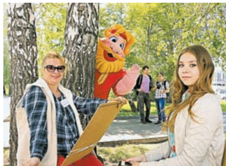
Фестиваль «Алтайский край – территория детства». Здесь можно хорошо провести время всей семьей!