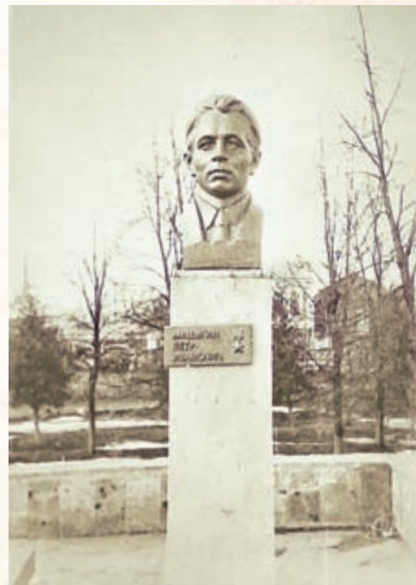
Бюст героя в г. Белинском Пензенской области.

сию получил, сел в машину и... сердце остановилось. Хорошо хоть автомобиль не успел завестись, беды какой не случилось... Было ему всего 64 года.