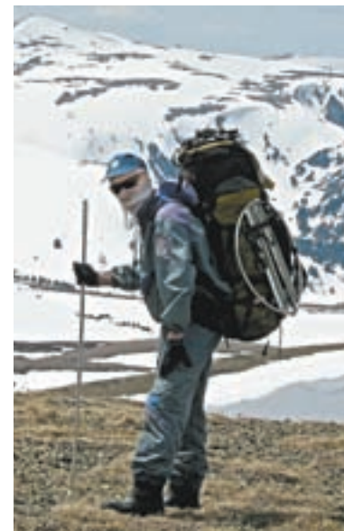
Чарышский район. Коргонский хребет.

– Путешествие в горах (особенно вдали от цивилизации) всегда риск. В пути много неконтролируемых факторов. Можно очень долго готовиться, продумывать различные ситуации и способы их решения, но всё предусмотреть невозможно. В походных условиях нужно рассчитывать в первую очередь на себя, особенно когда ты руководитель группы и несёшь за всех ответственность. И нет возможности просто