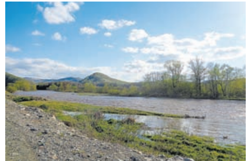
В окрестностях села Солонешного – живописные пейзажи.

– Сначала все шло как по маслу, но когда в район пришла торговая сеть, выручка в продуктовом отделе значительно упала, поэтому переводим его постепенно на хозгруппу, продукты там теперь составляют десятую часть от всего ассортимента. В последнее время наблюдается спад покупательной способности в хозяйственном магазине. Раньше подтоварка была два раза в неделю, сейчас перешли на один. От поставок стройматериалов почти полностью отказались, стали мало строить, видимо, сказывается кризис. Для сравнения, четыре года мы били рекорды по закупкам среди мелких магазинов края.