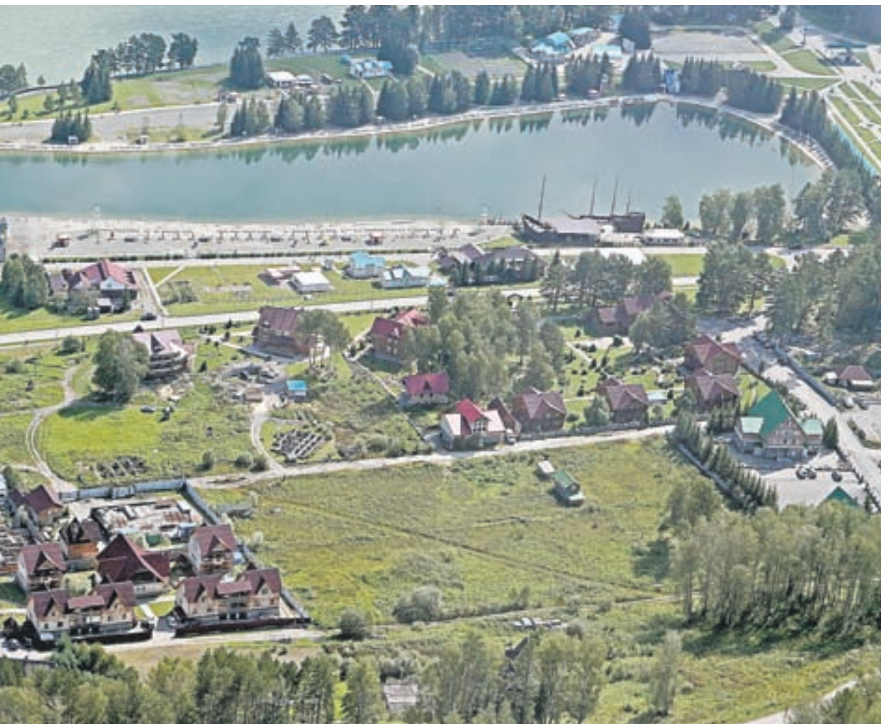
На сегодня в особой экономической зоне туристско-рекреационного типа «Бирюзовая Катунь» зарегистрировано 16 резидентов с солидным объемом инвестиций.

тирован: период их применения, что делать с такой продукцией. Если говорить о европейских подходах, например, по молоку, то когда животным ставят прививки, их владельцы обязаны известить получателей сырья на заводе и определить, что с ним делать. Эти вещи нужно понимать и учитывать в работе, бизнесе, чтобы не подводить тех, кому поставляешь сырье.