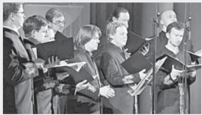
Хоровое пение – это определенная энергетика.

В программу «Свет Валаама» включены как церковные, так и светские произведения.