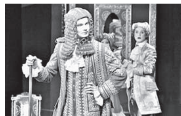
Сцена из спектакля «Тартюф».

Гастроли Иркутского академического драматического театра им. Н.П. Охлопкова.