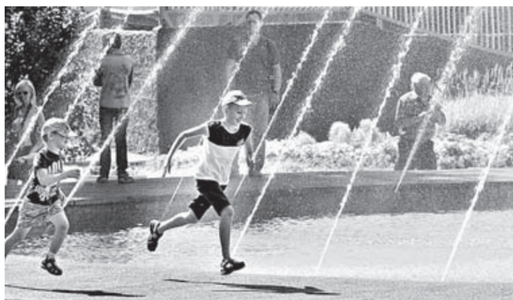
В парке Центрального района дети могут освежиться у фонтана.

В обычные дни здесь тоже царит особая теплая атмосфера. Приятно видеть счастливых, улыбающихся детей, прокатившихся с ветерком на «Хип-хопе»