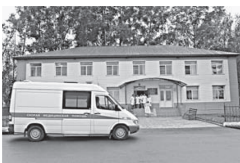
ФАП был отремонтирован при поддержке предприятия.

— Когда говорим о социальной ответственности бизнеса, то в это понятие вкладываем не только создание социальных объектов, — рассказывает глава региона. — Нам, представителям власти, должны быть понятны логика и идеология его развития. Здесь она понятна. Бизнес не преследует цель добиться лишь одной прибыли. Он развивается и в сегментах, которые сегодня важны с точки зрения комплексного развития территории Алтайского края и значимых приоритетов. Это аграрный сектор, им занимается многопрофильная фирма. В планах предприятия — тема молочного скотоводства. Она приоритетная для региона, страны. Также для края важно развитие туристического бизнеса. Компания вкладывает значительные ресурсы для создания предприятий общественного питания высокого уровня.