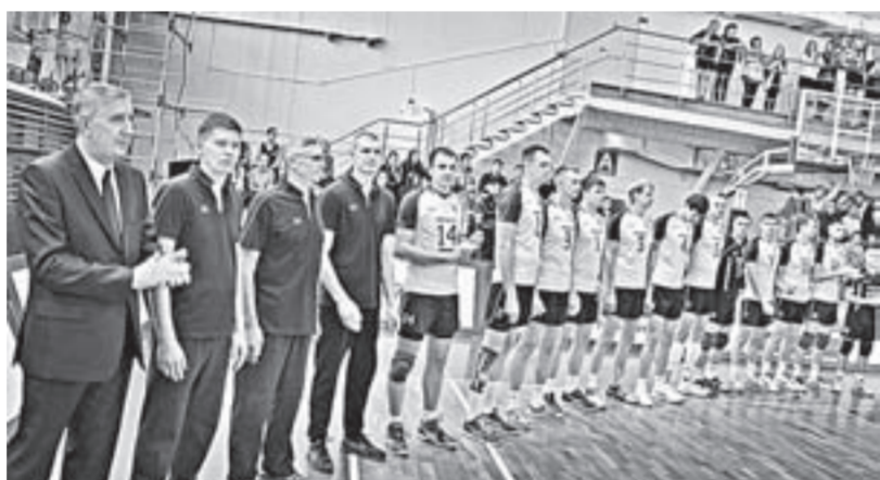
Вся команда «Университета».

команд, выступающих в чемпионате России по волейболу, не имеет в своих рядах волейбольно собственных воспитанников. По этому поводу губернатор Александр Карлин и в шутку, и всерьёз заметил, что Воронков – человек современный: чётко выполняет установку президенту России на импортозамещение. И добавил, что «Университет» показывает всем мальчишкам, которые только начинают заниматься волейболом, что путь в главную команду края для них не закрыт. В нынешнем се-