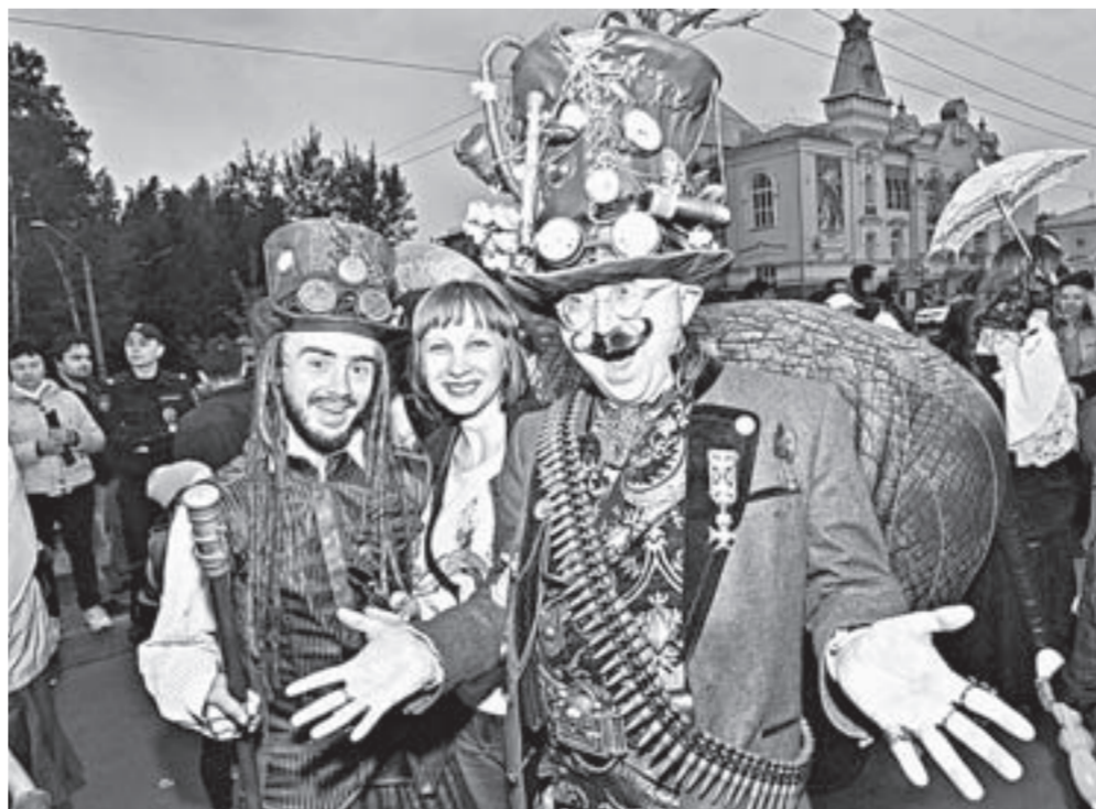
Праздник у музея «Горная аптека».

– Я выражаю двойную благодарность тем взрослым, которые привели сегодня детей. Это будущие патриоты нашего края и России, и если они будут ходить в музей, вырастут достойными гражданами нашей страны. Ибо музей есть прибежище истины,