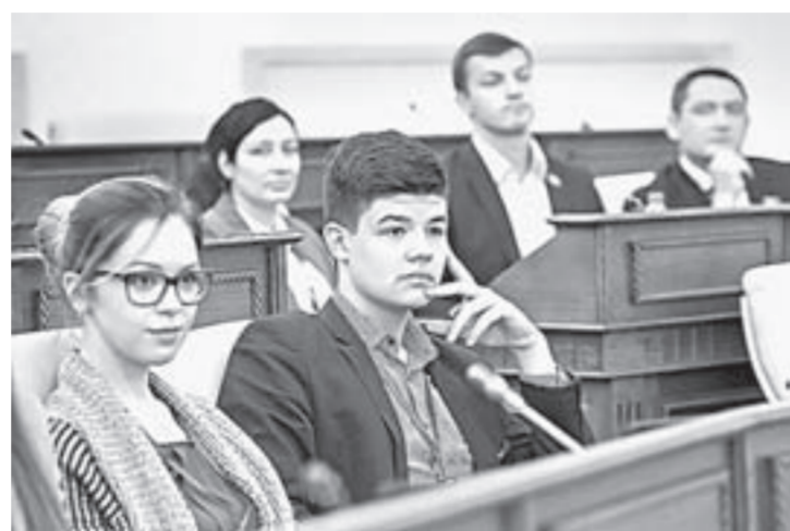
В форуме приняли участие более 50 предпринимателей.