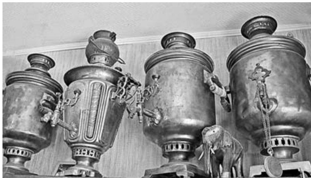
Семейная коллекция самоваров – одна из самых крупных в крае.

– Жалко было такую красоту, отдаваемую за бесценок. Это же не просто сосуд для кипячения воды из меди, латуни, никеля, а предмет достояния рода. Предки-переселенцы их с собой на Алтай издалека везли. Я начал ходить по людям. Звонил, искал, уговаривал. Тогда еще можно было выкупить самовар за две цены, сейчас уже