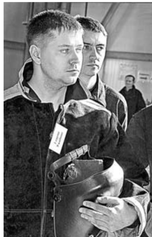
Сварщик – профессия мужественных.