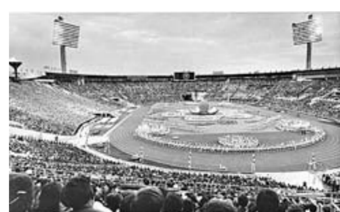
Московские «Лужники». Открытие международного слета в 1985 году.

Екатерина ЗЕЛЕНОВА (фото автора и из личного архива И. Гниденко)