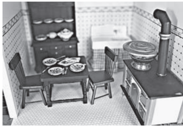
Для создания уюта в кукольном доме важны любые мелочи.

Гордость коллекции, ее самый старинный и ценный экспонат – кукла Галка, ей немногим менее 120 лет. Красотка сделана из фарфора, благодаря хитро устроенным суставам у нее гнутся ручки и ножки. Рядом в витрине несколько Сонечек начала XX века, приехавших из Германии и Франции (приобретая куклол, коллекционеры интересовались именами и не меняли их, так что в экспозиции оказалось много тезок). У них живые блестящие глаза, видны крошечные зубки, они одеты в аутентичные платья, шляпки и чепчики и сидят на раритетных диванчиках или в плетеных креслицах года этак 1930-го, а рядом стоят... напольные часы для кукольного до-