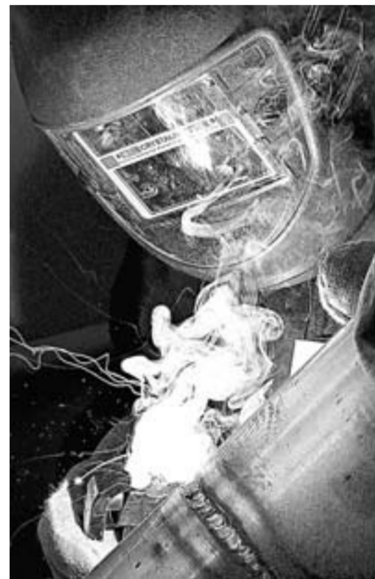
Самый ответственный этап – сваривание стыка.