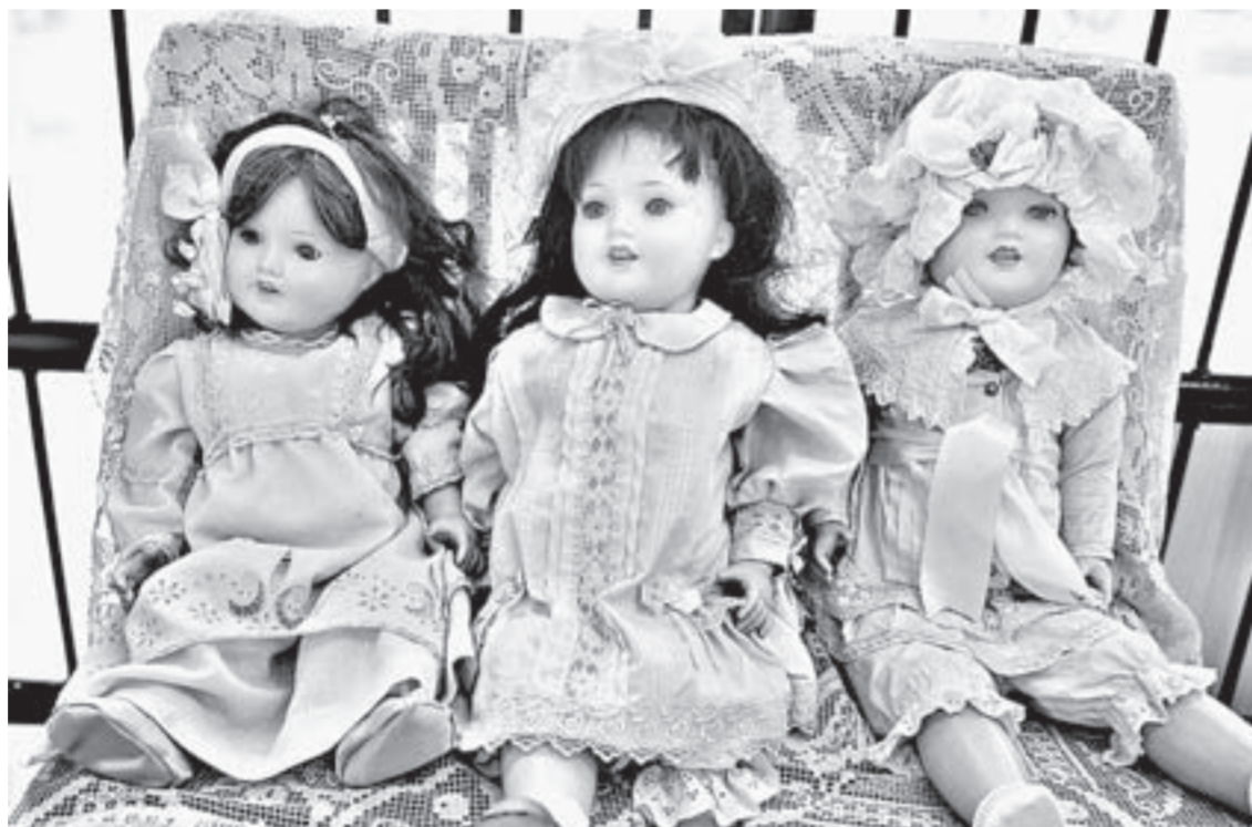
Куклы, произведенные в начале XX века в Германии.