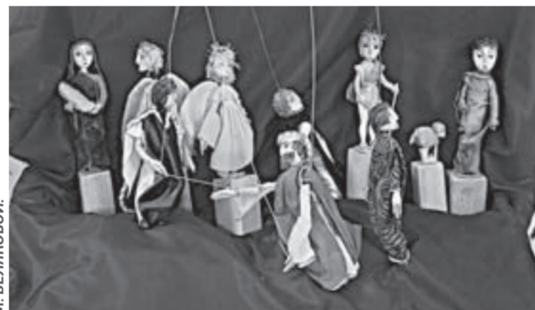
Вертепный театр (автор – И. Генцель).

Одна из витрин полностью посвящена советским 1920-м. Марина Белякова рассказывает, что в те годы нарком просвещения Луначарский запретил производство кукол как «буржуазный пережиток». И возникли артели, которые стали изготавливать игрушки почти подпольно. В одной такой московской артели под названием «Все для ребенка»