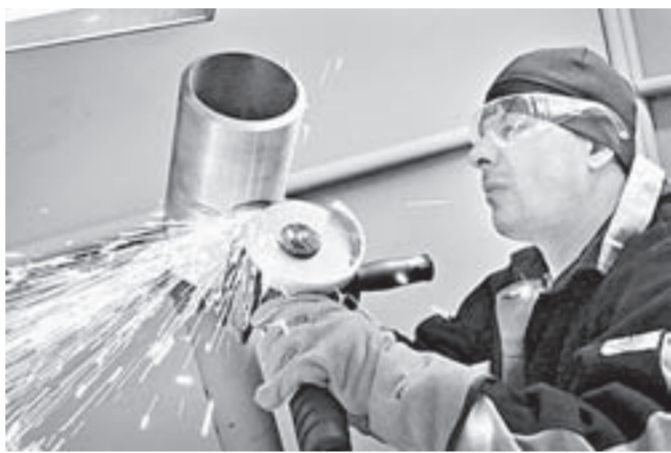
Перед тем как варить стык, его нужно было зачистить болгаркой.

сварки и теперь участвует в изготовлении запорной арматуры на Барнаульском котельном заводе. Работа очень ответственная, так как эта арматура должна выдерживать высокие температуры и давление. «Если шов лопнет, то могут быть жертвы, поэтому стараемся не допускать огрехов, – рассказывал специалист, – а для верности нас контролируют ультразвуком и рентгеноскопией».