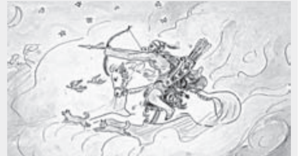
Григорий Гуркин. «Из алтайского эпоса». Художественный музей.

29 апреля. 14.00 – экскурсия для детей с родителями «Барнаул купеческий» (6+).