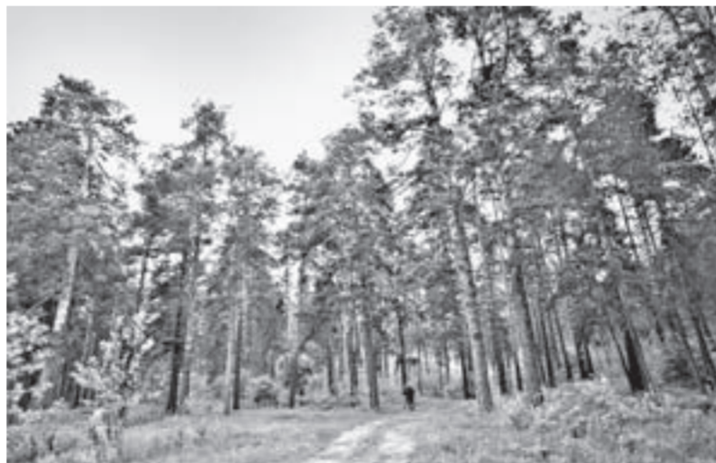
Главная задача — сохранить богатство природы.

Разоблачено 388 случаев самовольных рубок леса. Объем незаконно заготовленной древесины составил 6,4 тысячи кубометров, что на 14,6% меньше, чем в 2015 году. Это свидетельствует о том, что повысилась эффективность