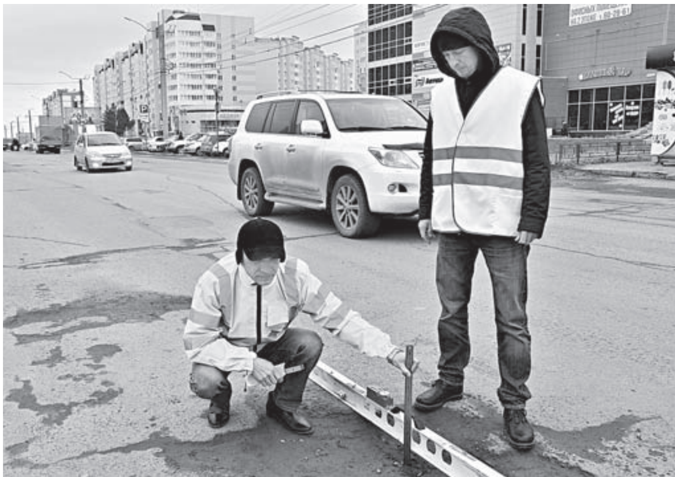
Тестирование дорог происходит с помощью передвижных дорожных лабораторий.

Прежде чем окончательно утвердить перечень дорог, подлежащих ремонту в этом