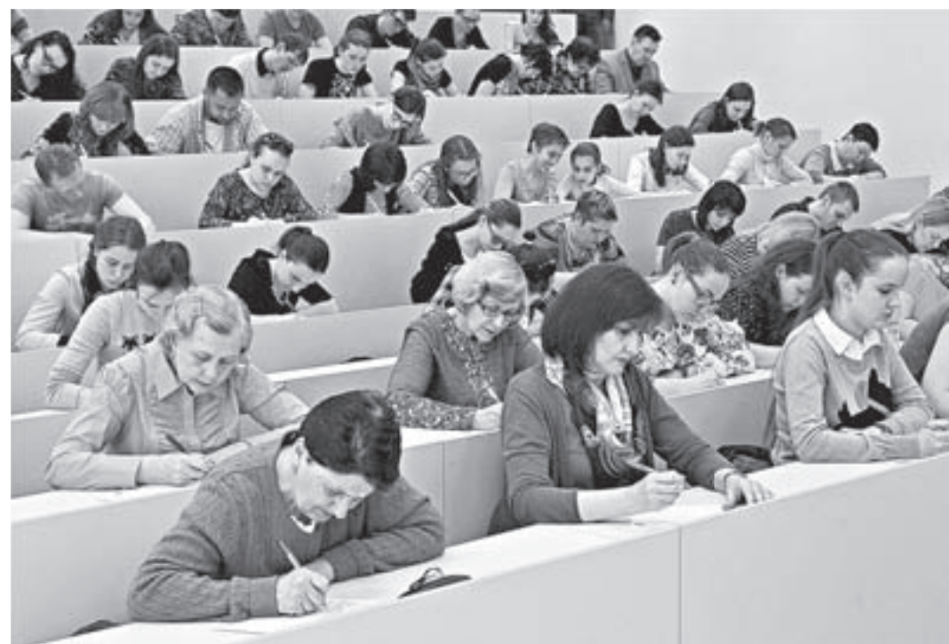
«Тотальный диктант» прошел на нескольких площадках, в том числе в учебном корпусе АлтГУ.

Общедоступный региональный телеканал «Катунь 24» провел прямое включение с «Тотальным диктантом» в Алтайском государственном университете.