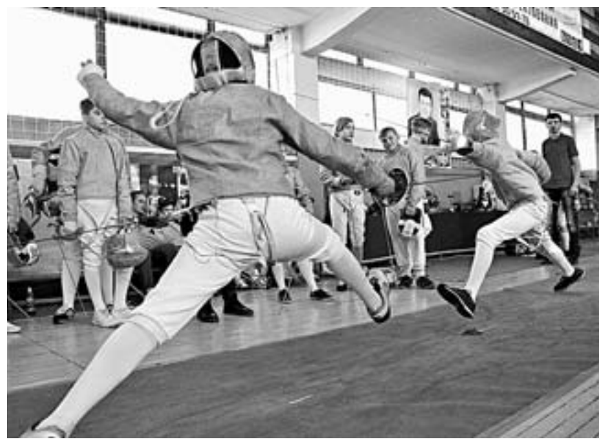
Зал с пятью дорожками уже мал.