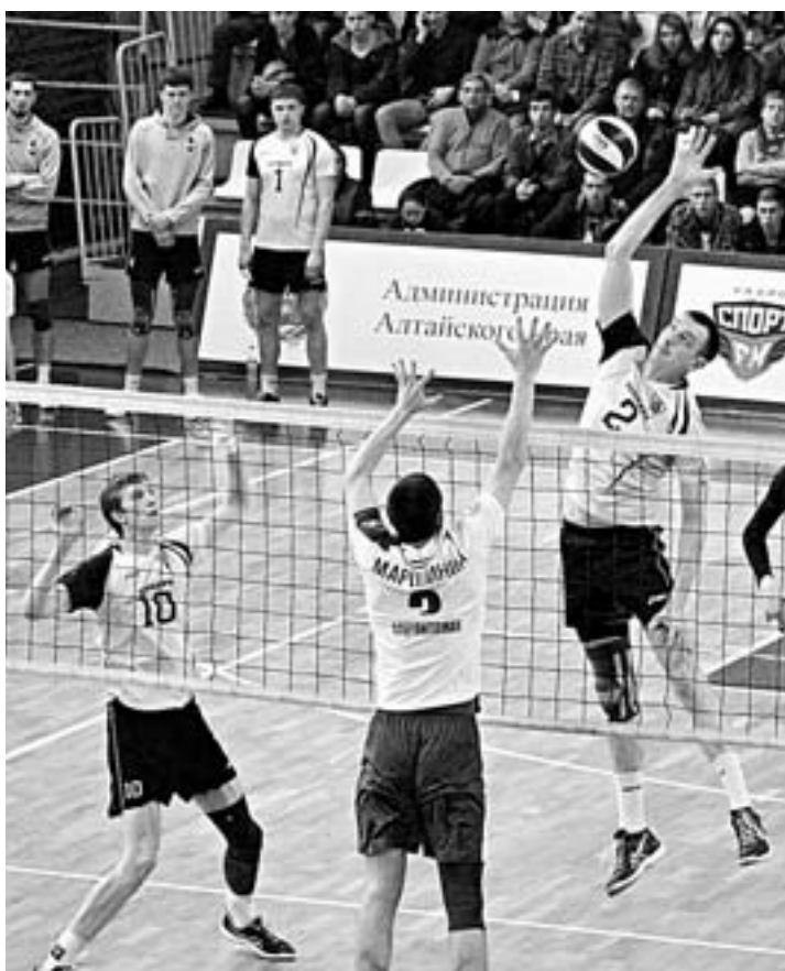
Атак «Университета» неотразима.

Волейболисты «Университета» заняли второе место в высшей лиге «А» и готовятся сыграть в переходном турнире за путёвку в суперлигу.