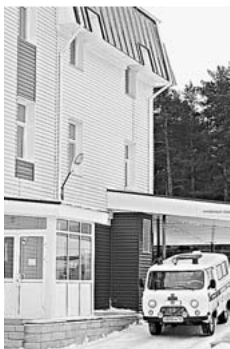
Основная задача в системе здравоохранения – повышение доступности первичной медпомощи.

– К созданию условий относится очень много и других факторов, без которых оказание медицинской помощи становится затруднительным. Это и транспортное