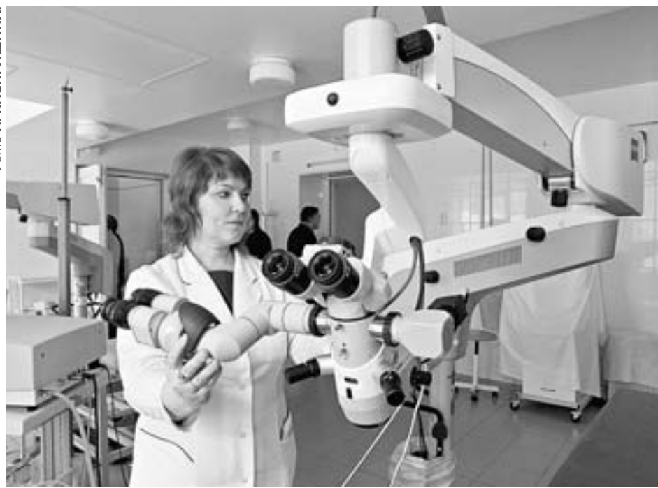
Здравоохранение края сделало значительный скачок из области специализированной помощи в высокотехнологичную.

В Алтайском крае подвели итоги здравоохранения прошлого года. Коллегия регионального Минздрава была посвящена результатам деятельности отрасли в 2016 году и задачам на 2017 год.