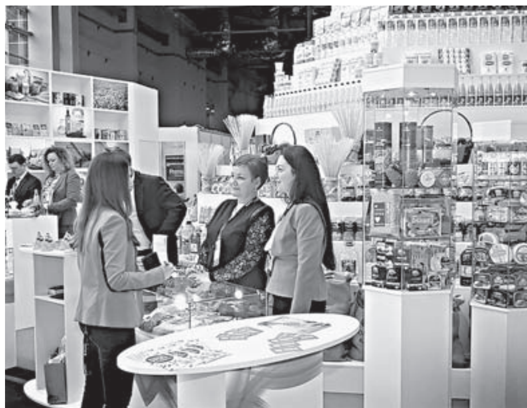
Экспозиция Алтайского края была одной из самых посещаемых.

Мы считаем работу на форуме оправдавшим себя средством оптимизации системы государственного и муниципального заказа, более рационального использования бюджетных средств, – сказал