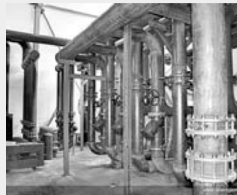
Новая котельная в г. Камень-на-Оби. Результаты КАИП-2016.

ОБЪЕМ ФИНАНСИРОВАНИЯ – 289,7 МЛН РУБЛЕЙ.