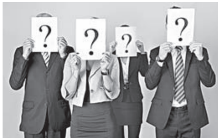
Все тайное рано или поздно становится явным.

За прошлый год по статье 173.1 УК РФ в Алтайском крае