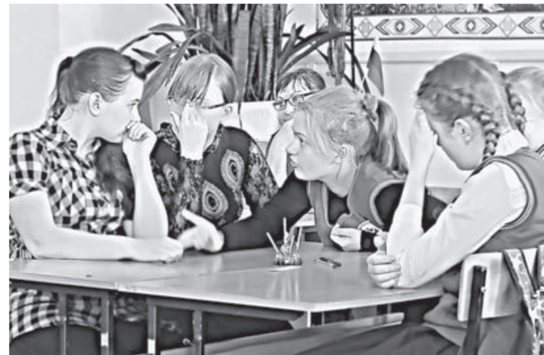
Команда кытмановской средней школы № 1.

Кто из русских царей имел особое пристрастие к бурлинской соли? Почему Бикатунская крепость была поставлена именно на месте слияния