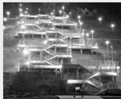
Лестница Назорного парка в г. Барнауле. Результаты КАИП-2016.

ОБЪЕМ ФИНАНСИРОВАНИЯ – 1 024,9 МЛН РУБЛЕЙ.