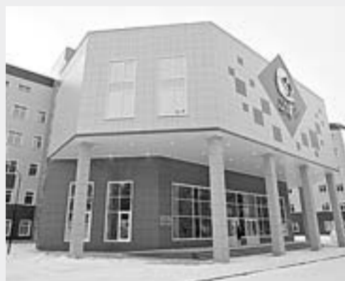
Краевой перинатальный центр «Дар». Результаты КАИП-2016.

ОБЪЕМ ФИНАНСИРОВАНИЯ – 1 062,4 МЛН РУБЛЕЙ.