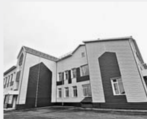
Новая средняя общеобразовательная школа в с. Устьяна Бурлинского района. Результаты КАИП-2016.

ОБЪЕМ ФИНАНСИРОВАНИЯ – 959,6 МЛН РУБЛЕЙ.