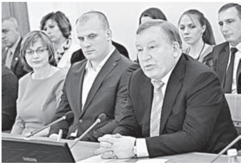
Глава региона Александр Карлин обсудил с участниками встречи перспективы развития алтайского спорта.

В Алтайском крае уже несколько лет действует государственная