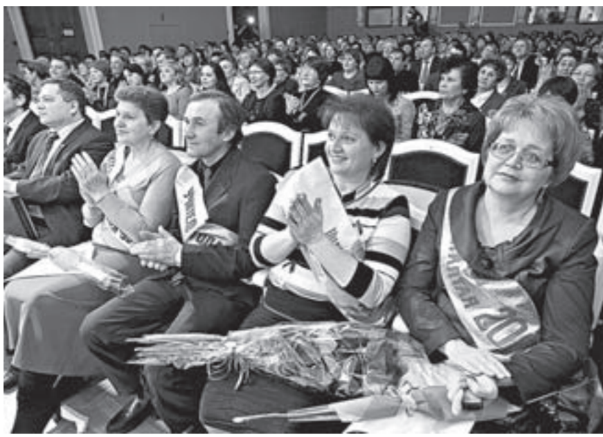
Учитель всегда в центре образовательного процесса.

В малом зале АКЗС прошел «круглый стол», организованный комитетом АКЗС по социальной политике совместно с фракцией «Единая Россия». На встрече речь шла об обеспечении кадров системы образования.