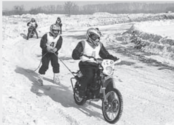
Спортсмены сначала боролись со снегопадом, а потом с потеплением.

Мототуристы Алтая завершили зимний сезон краевыми соревнованиями по спортивному туризму. Они прошли в Топчихинском районе.