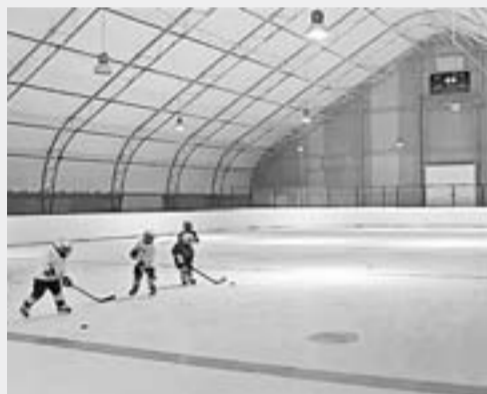
Ледовая арена «Бил» в г. Бийске. Результаты КАИП-2016.

ОБЪЕМ ФИНАНСИРОВАНИЯ – 198,1 МЛН РУБЛЕЙ.