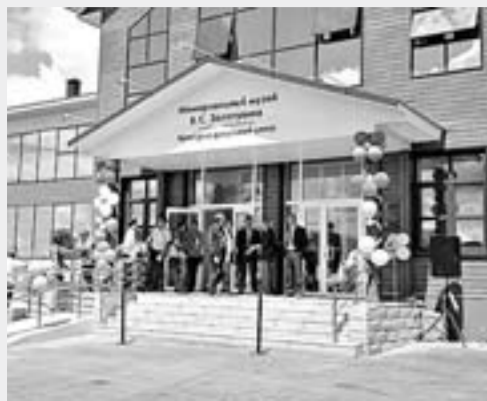
Мемориальный музей В.С. Золотухина в с. Быстрый Исток. Результаты КАИП-2016.

ОБЪЕМ ФИНАНСИРОВАНИЯ – 365,4 МЛН РУБЛЕЙ.