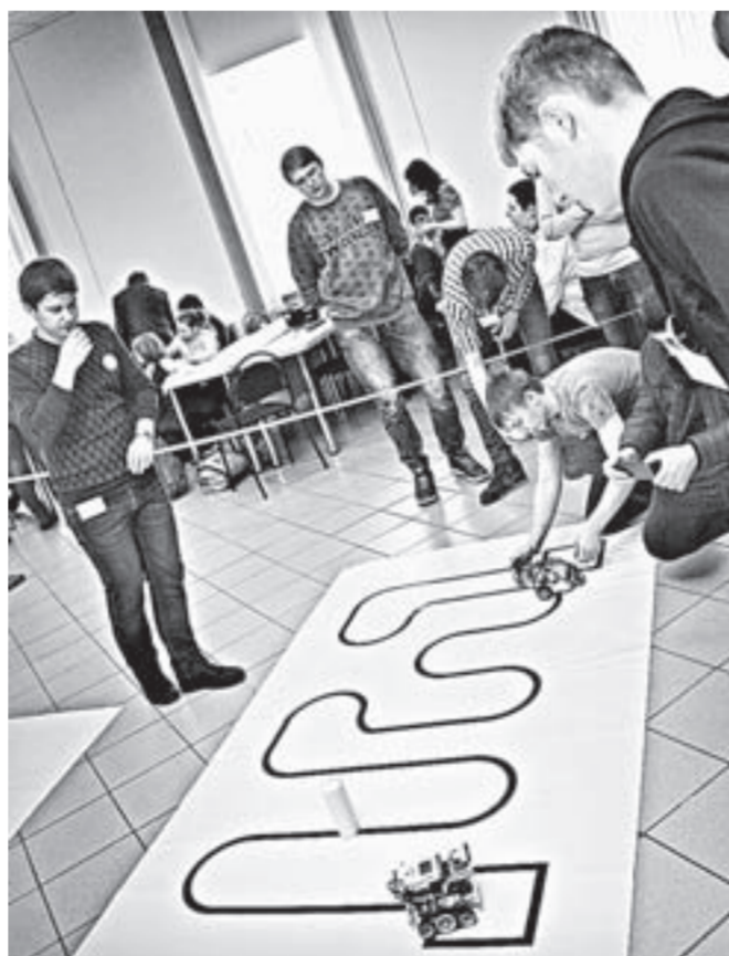
Пройти путь, не сбив неглю, – задача не из легких.

Благодаря соревнованиям по робототехнике корпус АлтГУ на проспекте Ленина оказался оккупирован шумными младшими школьниками – самой многочисленной, энергичной и азартной категорией участников. Они сначала представляли домашние проекты – роботов-помощников на все случаи жизни, затем воспроизводили робота по фотографии, не зная точно его свойств и конструктивных особенностей, а дальше создавали и программировали своего робота мечты из конструктора LEGO WeDo. У ребят постарше, занимающихся на более продвинутых моделях конструкторов, и задания сложнее: их роботы должны были пройти слож-