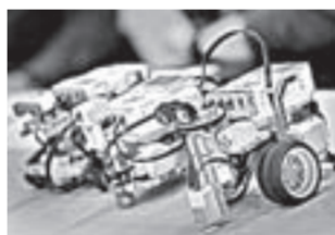
Интерес к робототехнике в крае растет.

– Зачем это все университету? – спрашивает замести-