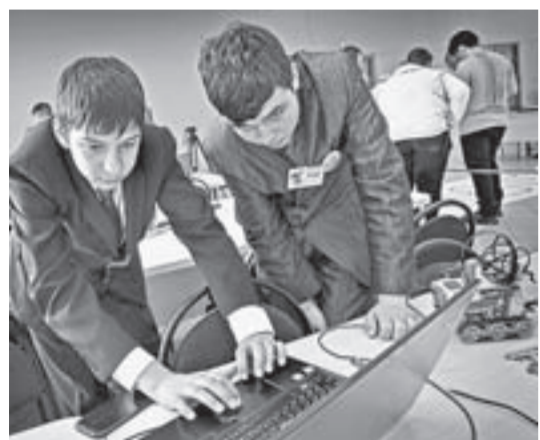
В программировании работа главное — выигрышная стратегия.