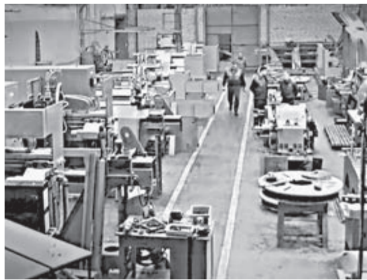
Капитально отремонтированных линий на заводе будет больше.

На Барнаульском патронном заводе в этом году будут модернизированы 15 автоматических роторных линий.