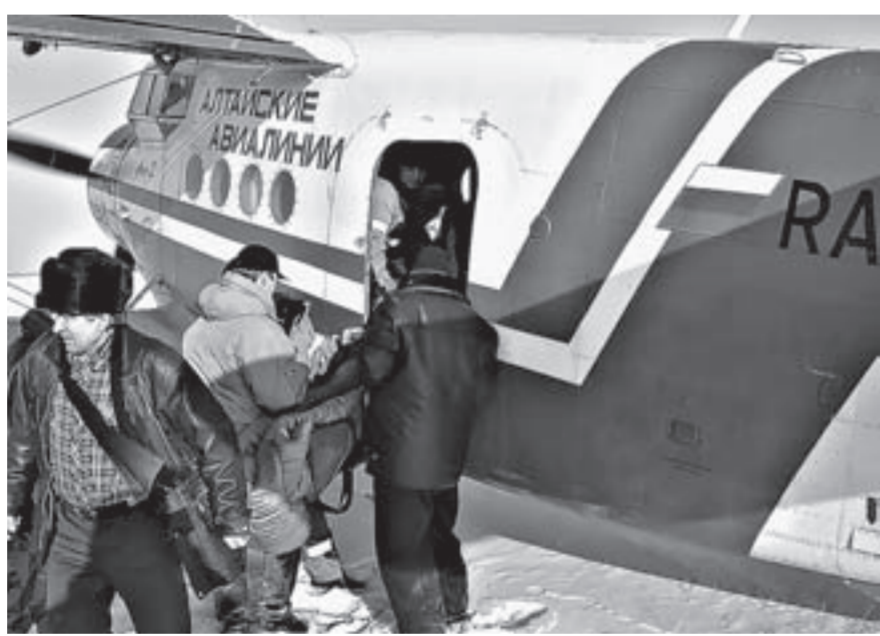
Медики Алтай ждут новые машины санитарной авиации.

Еще одним из вопросов, освещенных в ходе мероприятия, стало оказание первичной медицинской помощи на селе и подъем заболеваемости. По