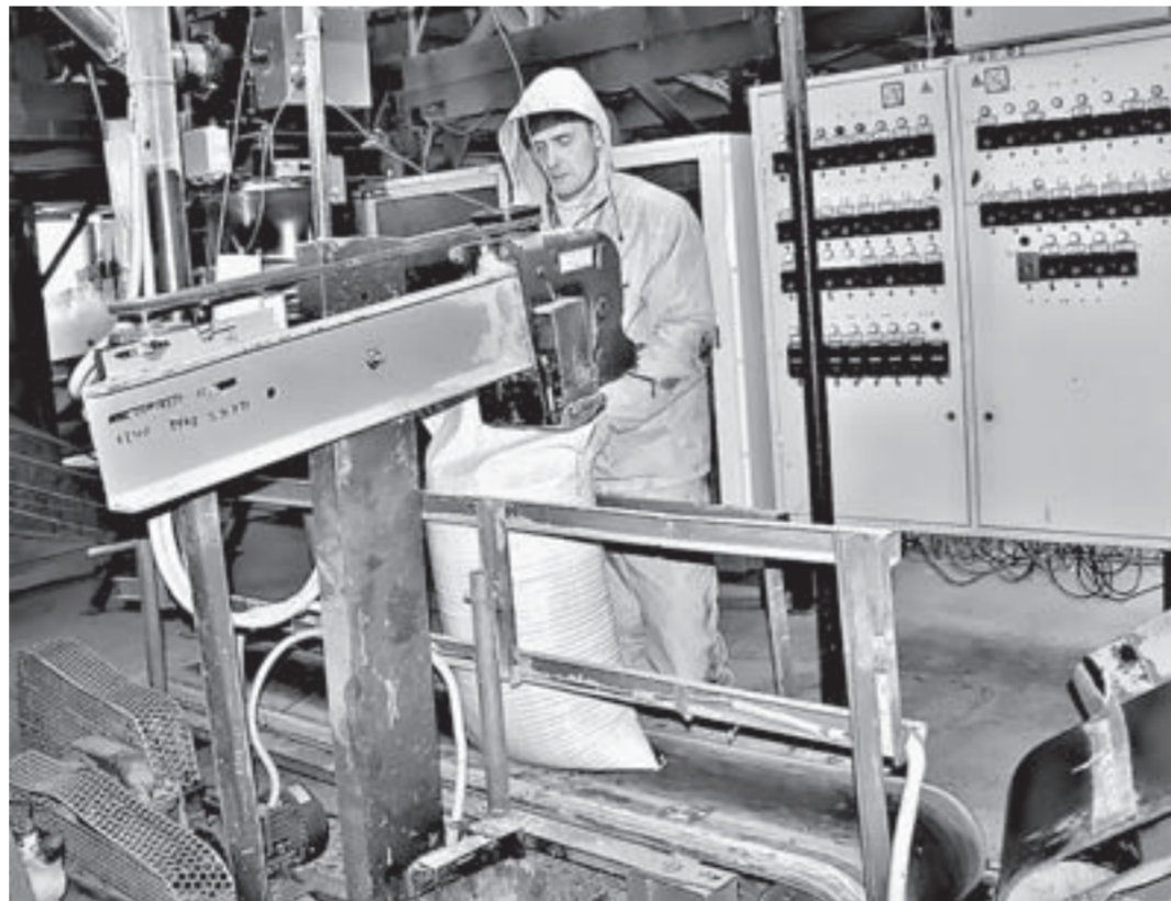
«Алтайагросоюз», как и многие другие предприятия края, работает с господдержкой.

программы развития предпринимательства в 2017 году сделаны на сервисные услуги для бизнеса через институты сопровождения бизнес-проектов: центр поддержки пред-