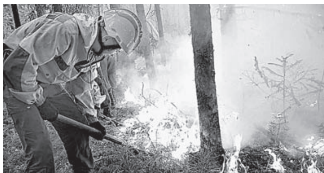
За последние 20 лет в Алтайском крае ликвидировано более 20 тысяч лесных пожаров.

— Пожары наносили и продолжают наносить серьезный ущерб лесам края, — сказал Александр Карлин. — Только за последние 20 лет в регионе ликвидировано более 20 тысяч лесных пожаров, в том числе 108 крупных. Совокупная площадь лесов, пройденная пожарами за эти годы, превысила 250 тыс. гектаров. Из 4,4 млн гектаров лесов на территории края 57%