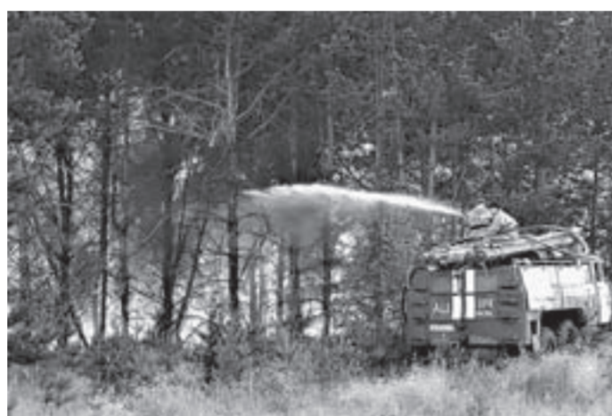
Ежегодно в лесах края происходит около 400 пожаров.

— Все эти и другие факторы обуславливают необходимость принятия дополнительных организационно-распорядительных, финансовых мер, которые позволят нам снизить ущерб от лесных пожаров, предотвратить их возникновения, — подчеркнул Александр Карлин. — На охрану лесов ежегодно мы расходует в крае более 250 млн