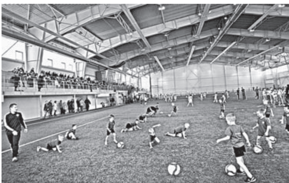
Матч для алтайских футболистов теперь состоится в любую погоду.