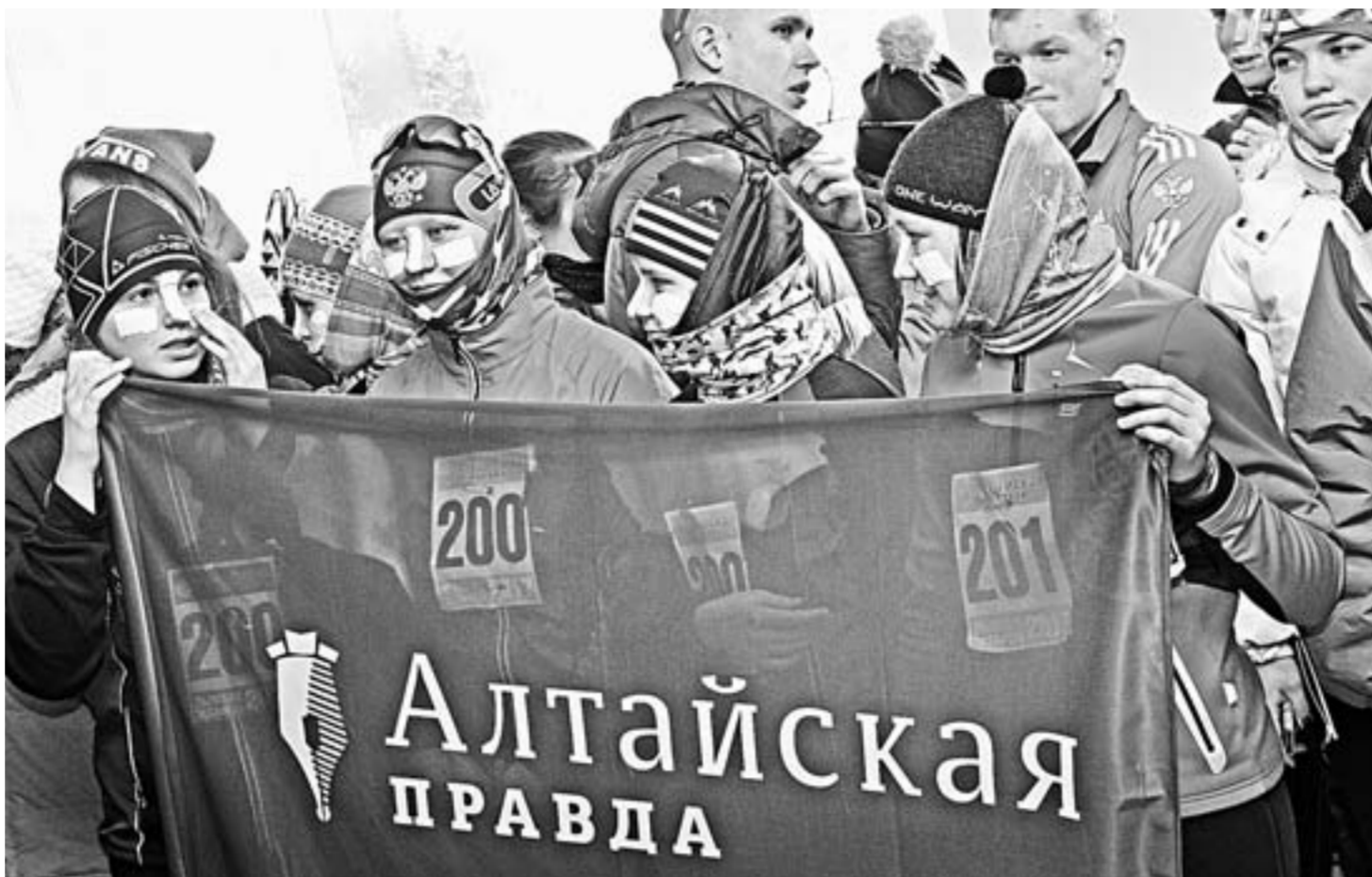
Лыжницы экипировались так, что лиц почти не было видно.