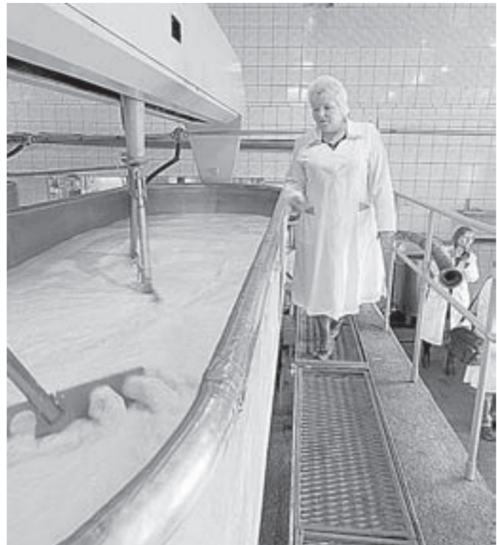
Технологии сыроделия старые, классические, оборудование — новое.

Алтайские маслосырзаводы проводят сервизную модернизацию, готовясь к производству «большого молока».