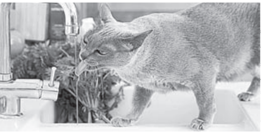
Чистая водичка и кошке приятно.

В ответ на просьбы села и администрации Топчихинского района из краевого бюджета было выделено 2 миллиона 800 тысяч рублей. На эти средства специалисты организации «Востокбурвуд» пробурили в Чистюньке две скважины, был установлен небольшой павильон, а в нем – насос с частотным преобразователем. Старые скважины с двумя изрядно обветшавшими водонапорными башнями демонтировать не стали,