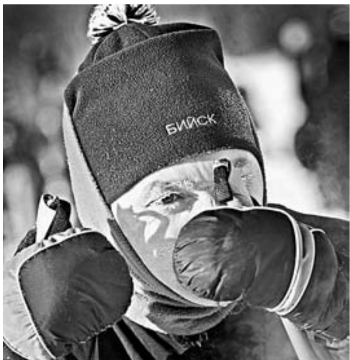
Девиз эстафет «Кто не победит – согреется» был особенно актуальным.