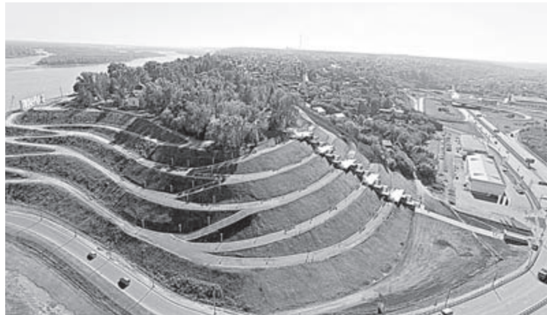
Комплекс «Нагорный парк». Террасирование склонов парка с водоотведением.