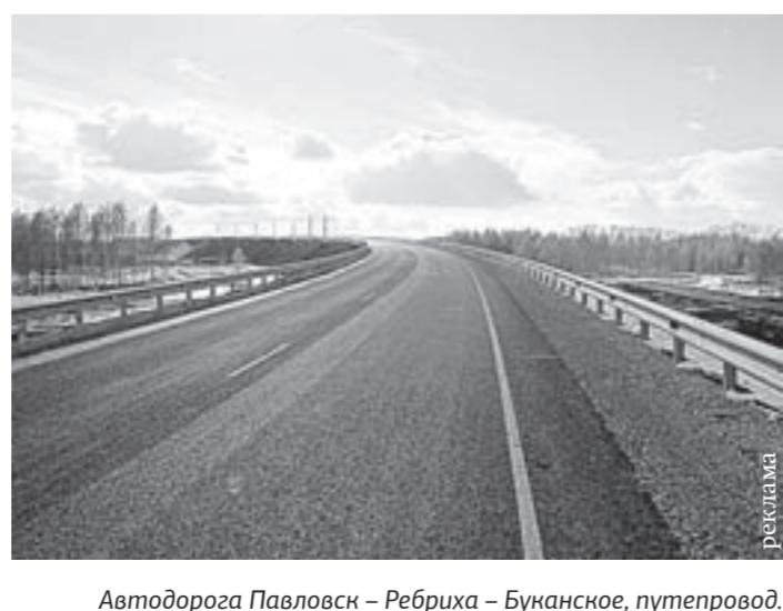
Автомобильная дорога Павловск — Ребриха — Буканское, путепровод.

Современные технологии использовались специалистами «Барнаульского ДСУ-4» и при