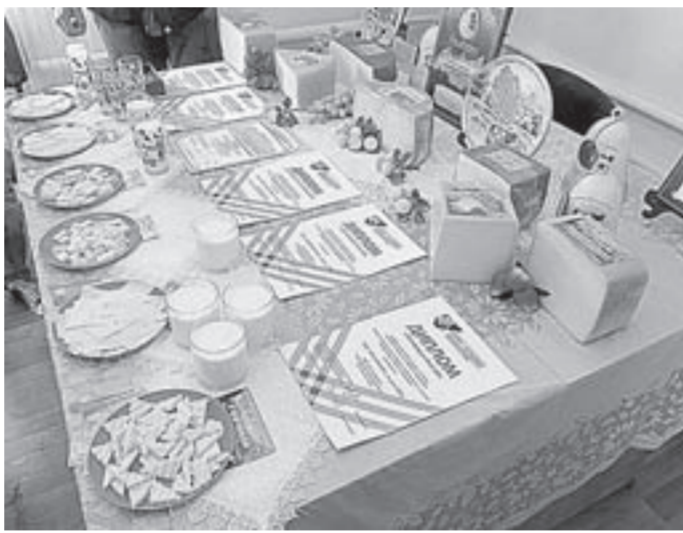
На Алтае умеют делать сыры и угощать.