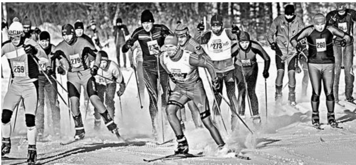
На дистанциях было жарко.