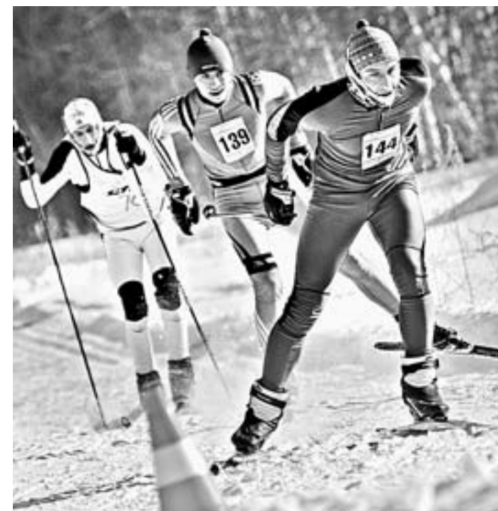
Не безум – летям!