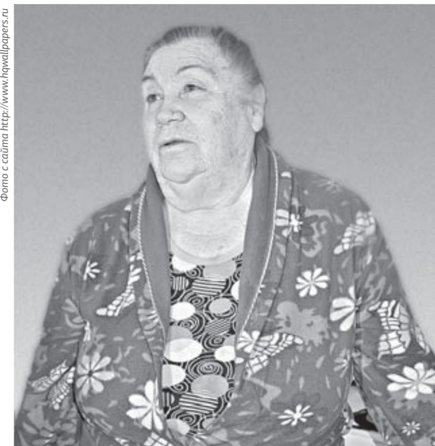
Любовь Русланова: «Теперь и дождя ждать не нужно».