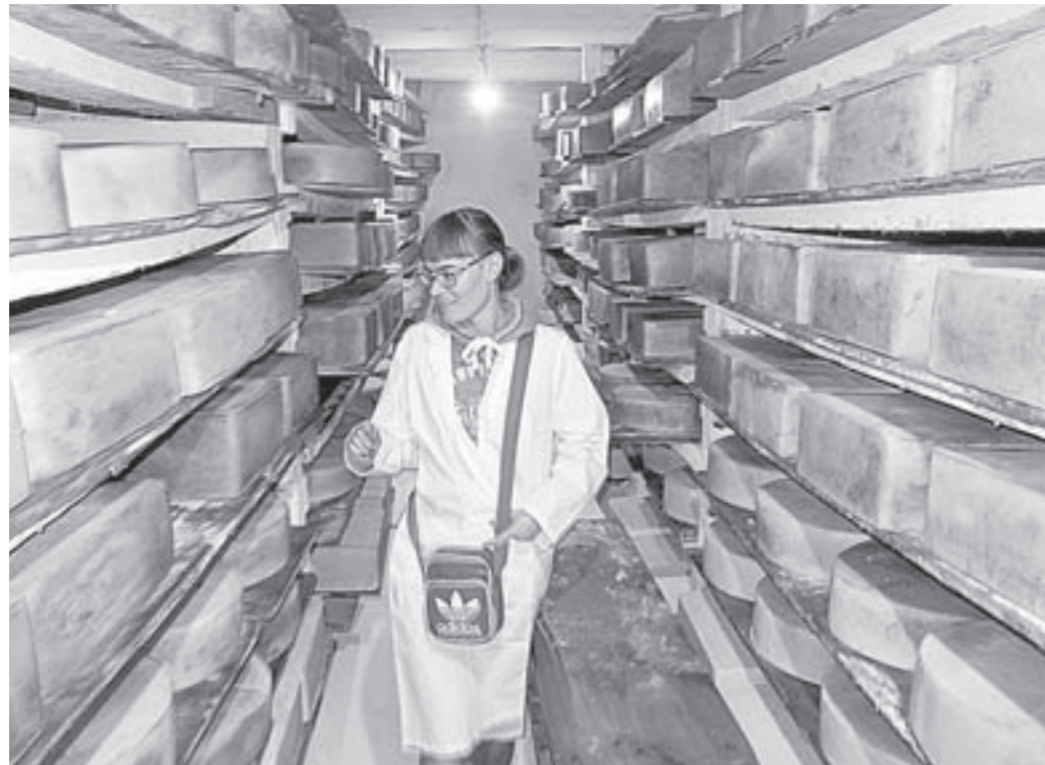
Продукция АХК «Ануйское» готова к отправке потребителям.