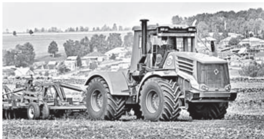
Производство комплектующих для сельхозтехники становится перспективным направлением работы.

Алтайский шинный комбинат и завод механических прессов увеличивают объемы производства, осваивают новые направления и готовы к совместному развитию кооперационных связей. Сейчас Алтайский шинный комбинат заканчива-