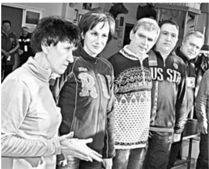
На торжественном открытии соревнований.