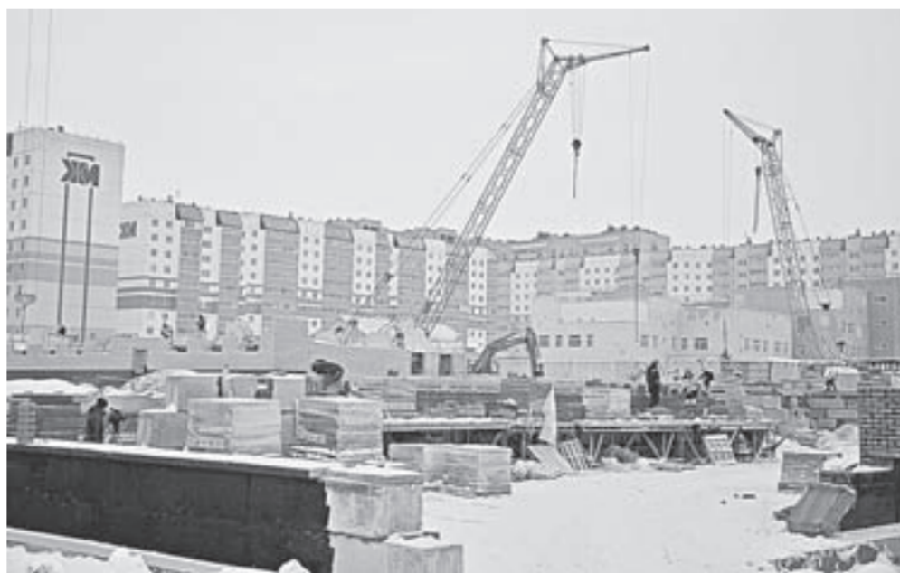
Новая школа в квартале 2034 возводится рядом с детским садом.

Строительство новой школы в квартале 2034 Индустриального района Барнаула проинспектировали представители краевого правительства и депутат Государственной думы Даниил Бессарабов. Здание на 550 обучающихся, которое возводится рядом с детским садом «Маленькая страна», должно обеспечить комфортными условиями обучения детей микрорайона Дружный.