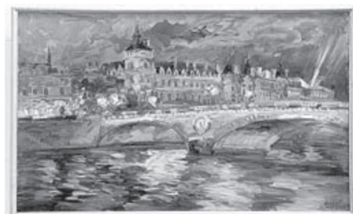
Парадокс: работы темные, но буквально светятся.