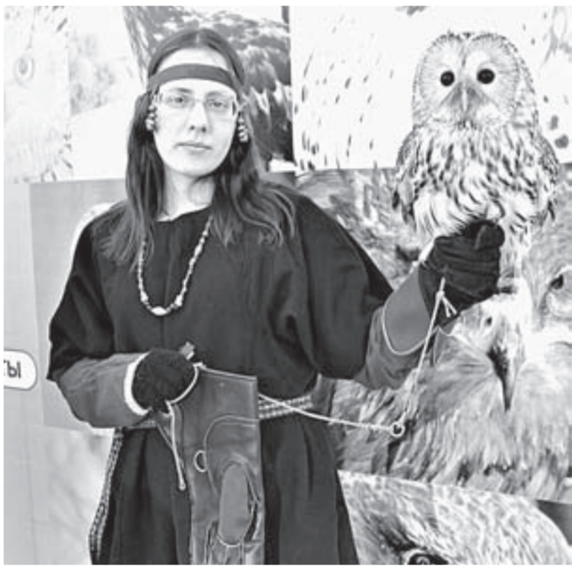
В этот день нарядный мого сфотографироваться с птицами из университетского питомника.

Изюминкой встречи стало награждение научных и творческих коллективов, молодых ученых университета особым знаком – статуэткой «Пламя науки» (ее в шутку прозвали «Оскар»). Было представлено несколько номинаций. Например, лучшим коллективом года признали команду энтомологов АлтГУ под руковод-