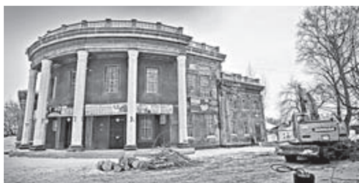
Благодаря программе «80х80» и партийному проекту театр изменится кардинальным образом.

губернаторскую программу «85х85». То есть в ближайшие годы центральная площадь города изменится кардинальным образом в лучшую сторону. Это касается и Рубцовского драматического театра. За счет средств партпроекта «Театры