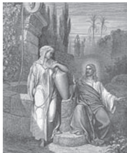
Гюстав Доре. «Иисус и самаритянка» (выставка «Гюстав Доре. Все оттенки света» в Художественном музее).

«Чарующие ночи» – выставка живописи Андрея Арестова. До 19 февраля. Межрегиональная выставка «Гобелены Сибири» (0+).