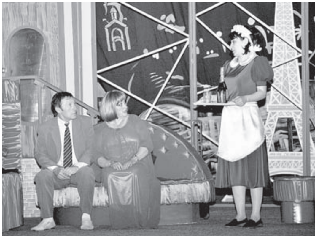
Актеры театра ждут средства на постановочные расходы.

Кстати, на площади Ленина есть еще один объект, который нуждается в ремонте, – Дворец культуры «Тракторостроитель». С учетом пожеланий рубцовчан он попадает в новую