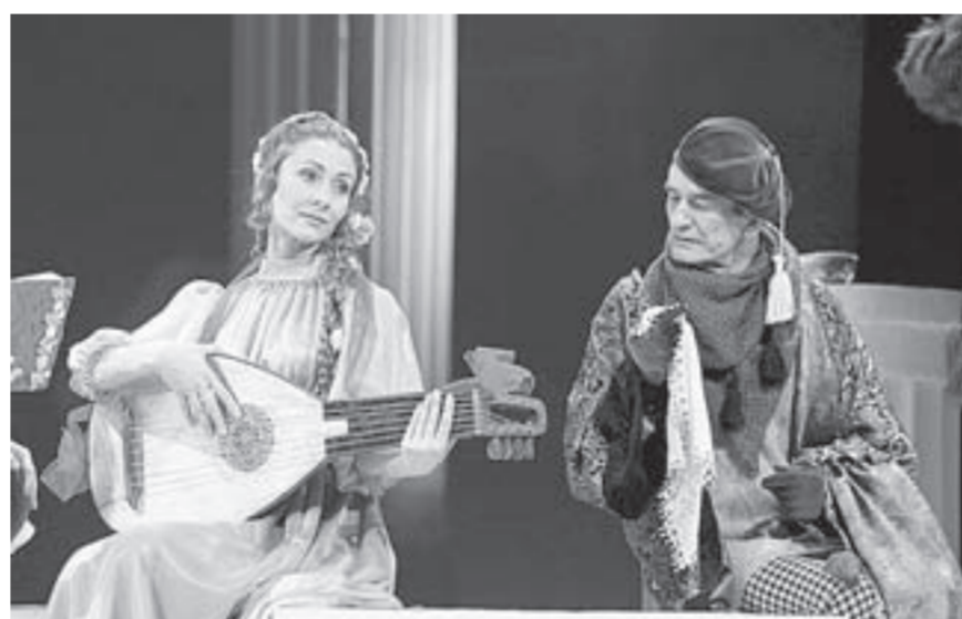
«Укрощение строптивой» (театр драмы им. В.М. Шукшина).

Выставочный зал музея «Город», пр. Ленина, 111, тел. 22-64-05.