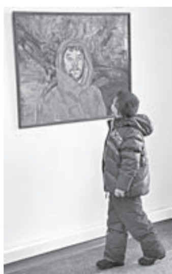
Автопортрет – часть диптиха.

картины: «Это был не просто один сеанс. Он занесет работу с улицы в мастерскую – а она в электрическом свете совсем другая. И на следующий вечер он опять шел на то же место. Хотя за это время можно было бы и четыре разные работы сделать».