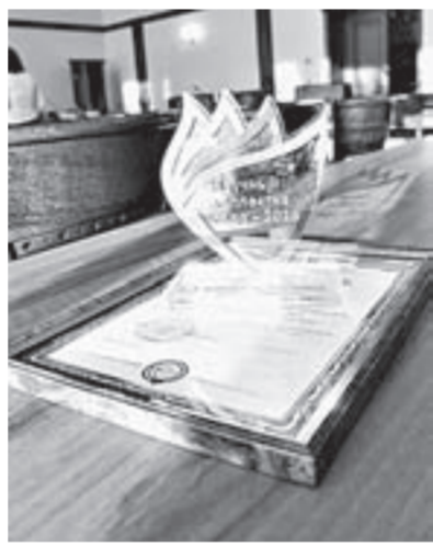
В классическом вузе наградили лучших ученых.

В данный момент реализуем два особо значимых проекта: первый совместный с коллегами из Республики Беларусь – изучаем фауну болот в Восточной Европе и Западной Сибири, ищем между ними взаимосвязь. В рамках второго проекта, поддержанного