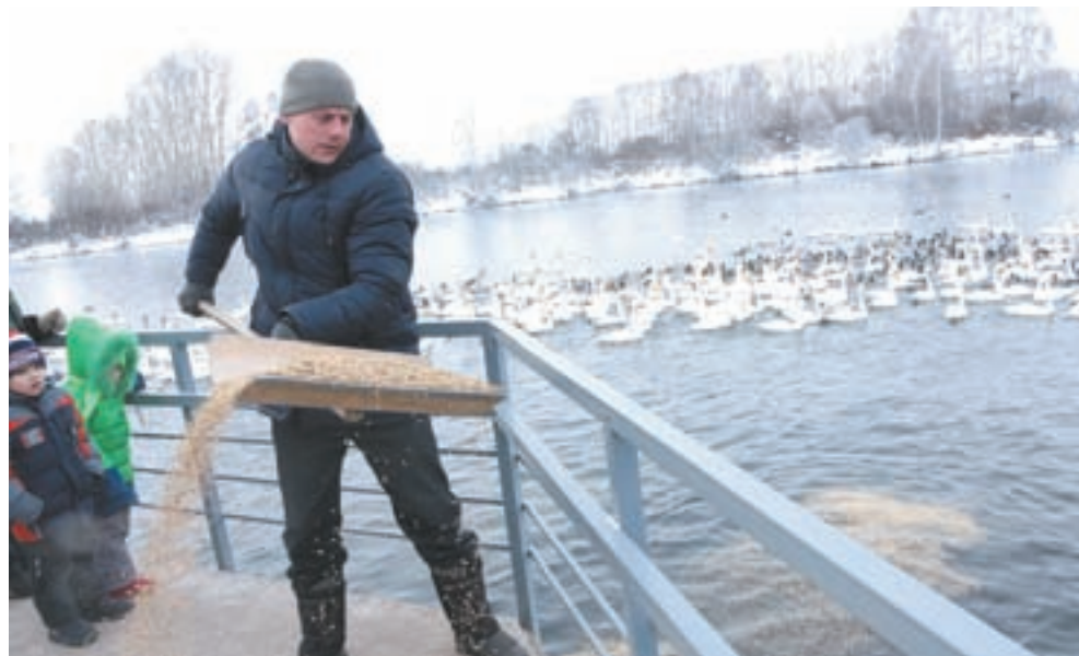
Детям очень интересно наблюдать, как кормят птиц.

2009 год. Февраль начался с морозов. Что самое опасное, так это когда в такие