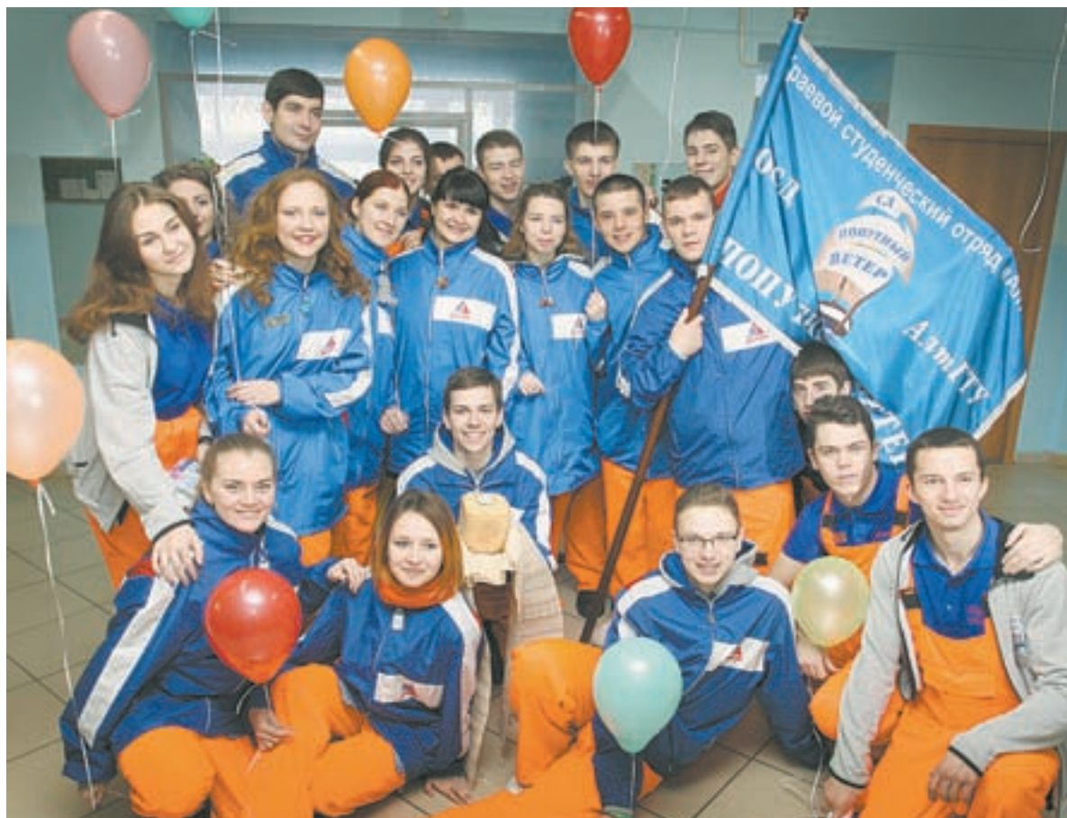
Отряд «Попутный ветер» в нынешнем году работает в Ребрихинском районе.

– С «десантниками» познакомился пару лет назад, когда они приезжали с кукольным театром. Мы так сдружились, несколько человек добавил в друзья в социальных сетях. До сих пор поддерживаем связь. Например, могу поделиться тем, что получил плохую отметку по математике или поругался с другом. Бойцы дают хорошие советы и поддерживают. Теперь хочу поближе пообщаться с «Попутным ветром». Когда вырасту и стану студентом, тоже буду посещать разные села и помогать людям.