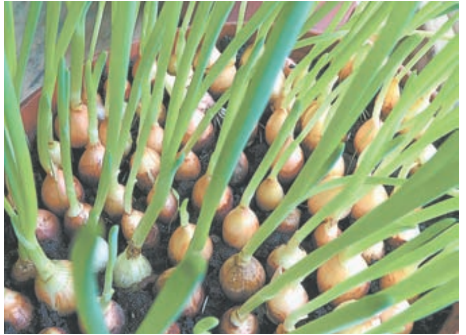
Посадила севок – и вскоре такая радость!

Эту тему затронула не только Светлана. Например, женщины спрашивают, с чего начать? Пусть на вопросы ответят сами «комнатные огородницы», как назвала одна из читательниц женщин, у которых нет возможности заниматься грядками на земле. Нет садового участка, или здоровье не позволяет.