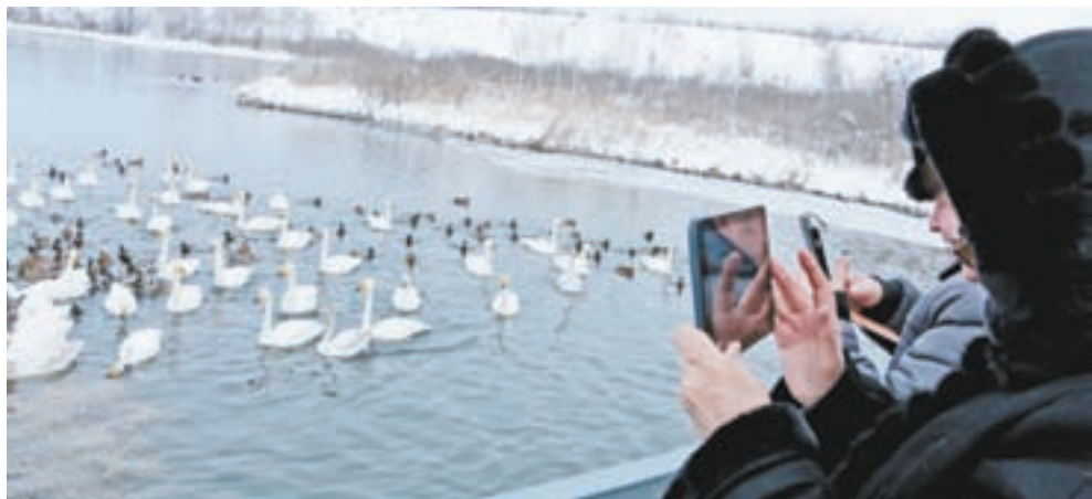
(Начало на 1-2 стр.)

Через год ситуация повторилась. Декабрь 2005 года выдался еще суровее. Дело осложнилось тем, что крайохоотуправление было реорганизовано. После заметки «Егерь сокращен, кормить кликунов нечем» («АП» за 17 декабря 2005 года) управлением Россельхознадзора по Алтайскому краю и Республике Алтай принято решение незамедлительно помочь заказнику, изыскана возможность через некоммерческую организацию вернуть к работе егеря.