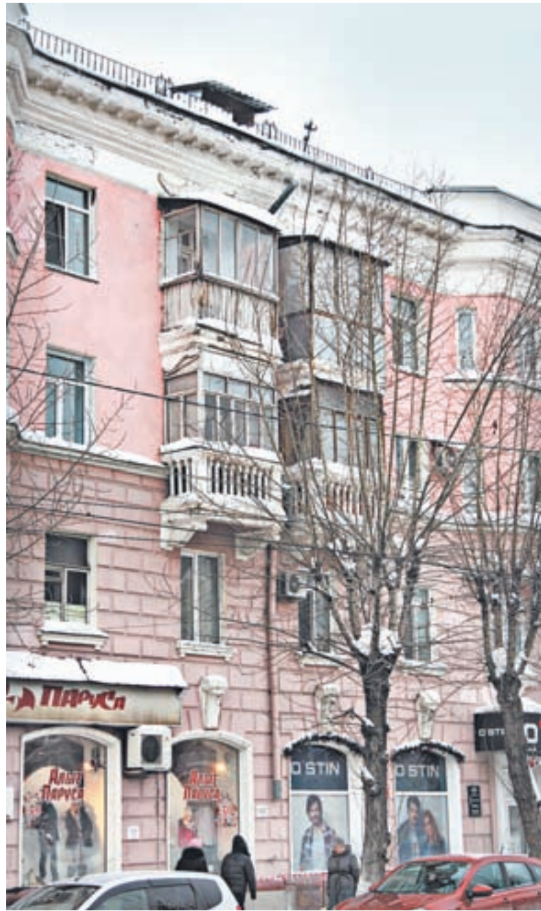
О квартире в таком доме в советское время мечтали многие.

Арбитражным судом Алтайского края принято решение о взыскании в солидарном порядке с ООО «СТК плюс», ООО «Супра» и ООО «Меридиан» в пользу мун-