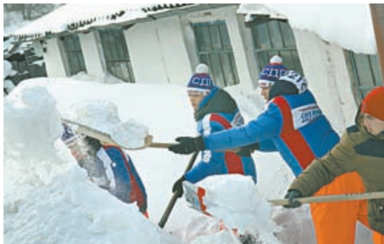
Шефская помощь – одна из главных задач участников акции.

Для старшеклассников студенты провели профориентационные занятия, рассказали, как выбрать профессию по душе. В соседнем кабинете организовали бесплатные правовые консультации. За пять дней в разных районах региона за помощью к специалистам обратились более ста человек. Работа ведется совместно с сотрудниками организации «Юристы – населению», юридическими клиниками Алтайского государственного университета, регионального филиала Российской академии народ-