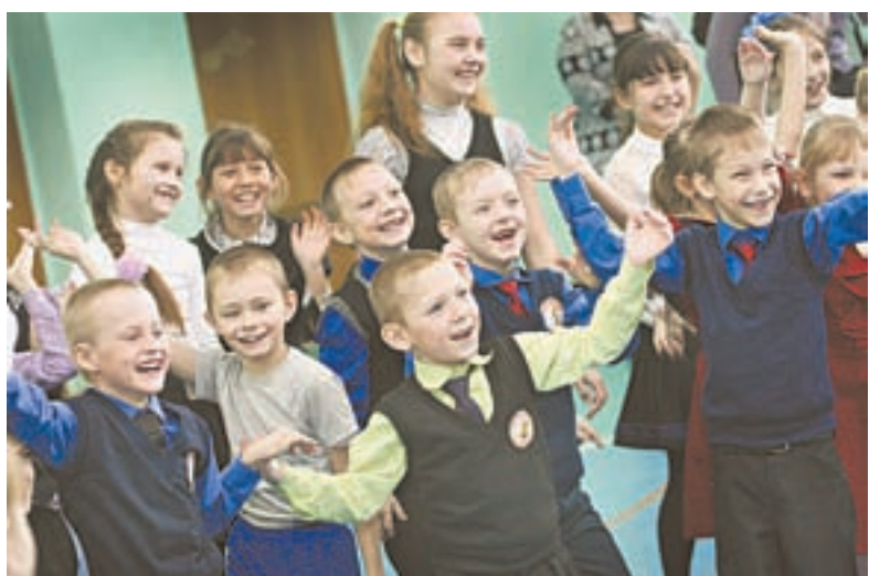
Школьники были рады знакомству с «десантниками».

Екатерина ЗЕЛЕНОВА, Евгений НАЛИМОВ (фото)