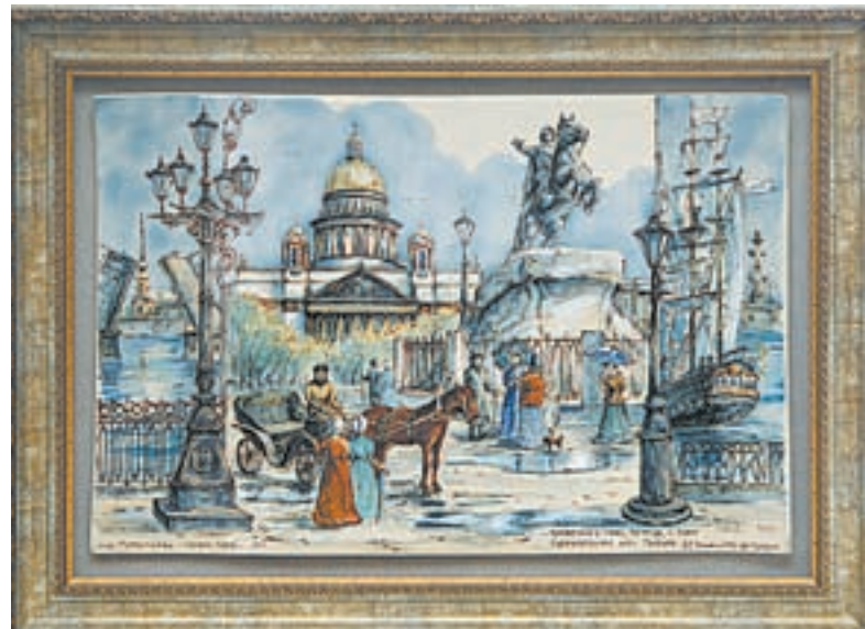
«Красуйся, град Петров...»

– Я просто люблю рисовать, поэтому работаю в том жанре, какой мне в данный момент интересен, или в зависимости от того, на какую работу поступил заказ. Разница