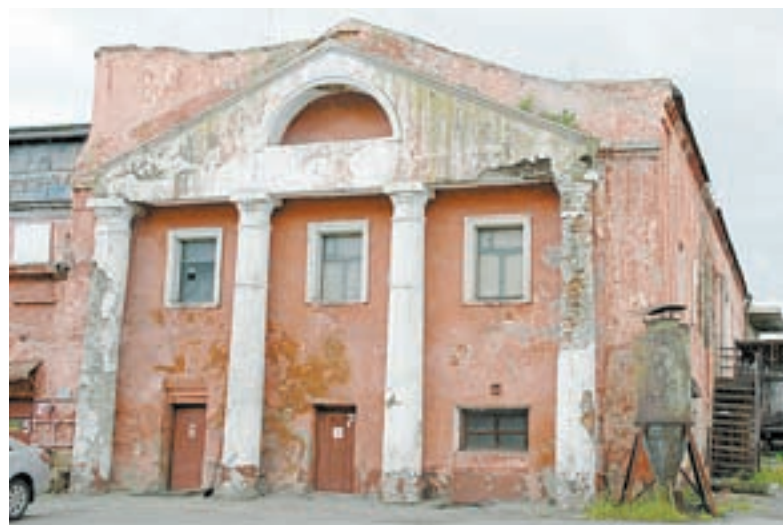
Ждет своих инвесторов здание бывшего сереброплавильного завода.

В этом году городские власти рассчитывают завершить строительство набережной под мостом через Барнаулку под проспектом Ленина, строительство ливневки на улице Мало-Тобольской, очистных сооружений на ул. Чехова, 26, комплексное благоустройство ул. Льва Толстого от пр. Ленина до Социалистического, создание пешеходной торгово-развлекательной зоны на ул. Мало-Тобольской. На ней планируется установить декоративные чугунные фонари, скамейки, урны, вазоны, выса-