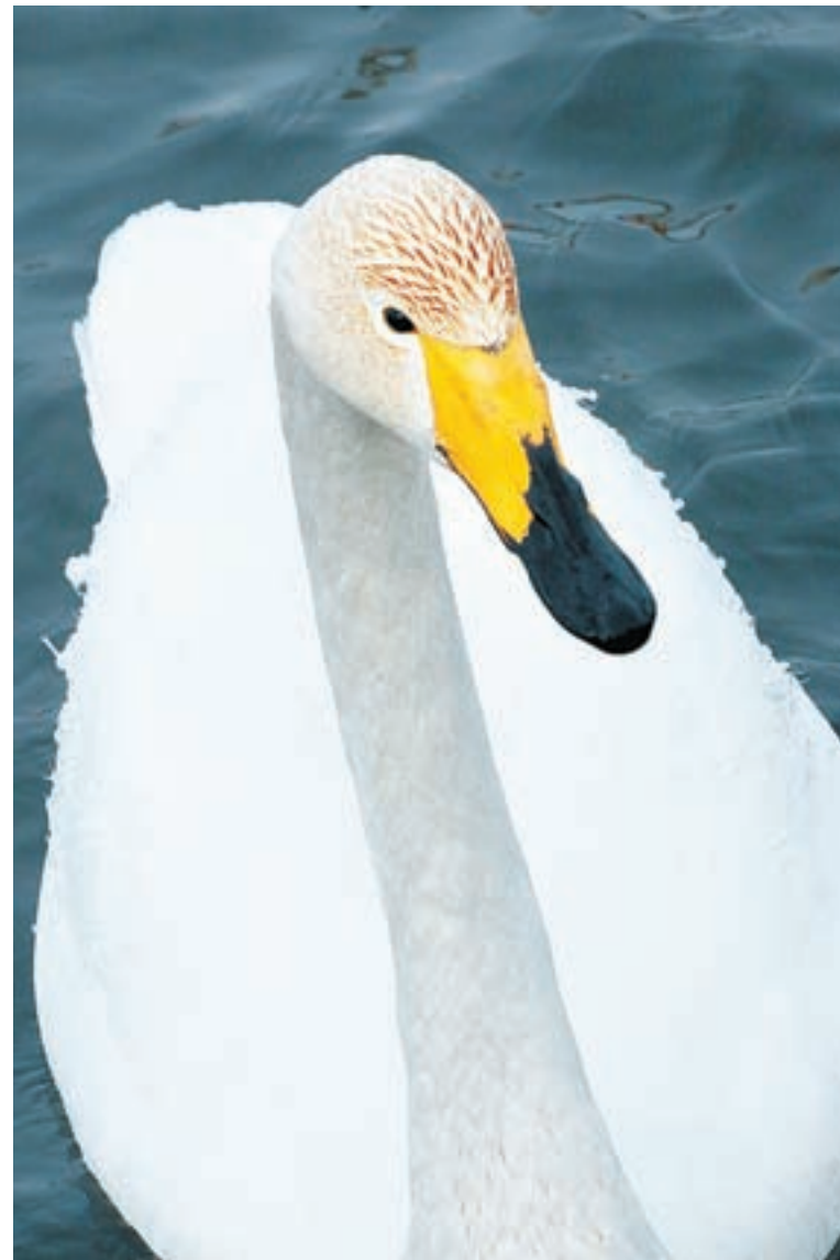
Молодой, но уже красивый.

Обратила внимание на то, что лебеди стали осторожнее. Ещё несколько лет тому назад они смело подплывали к самой кромке озера, когда егерь ссыпал зерно с мостков, а сейчас будто выжидают. Кто знает, может, есть причина, чего-то испу-