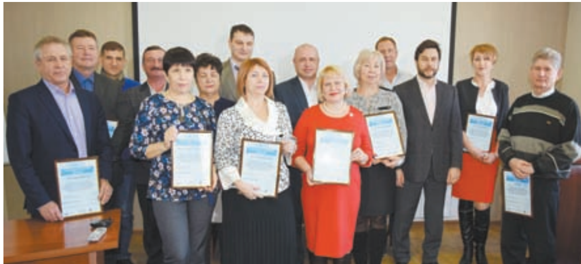
Победители, вошедшие в шорт-лист по итогам 2016 года.