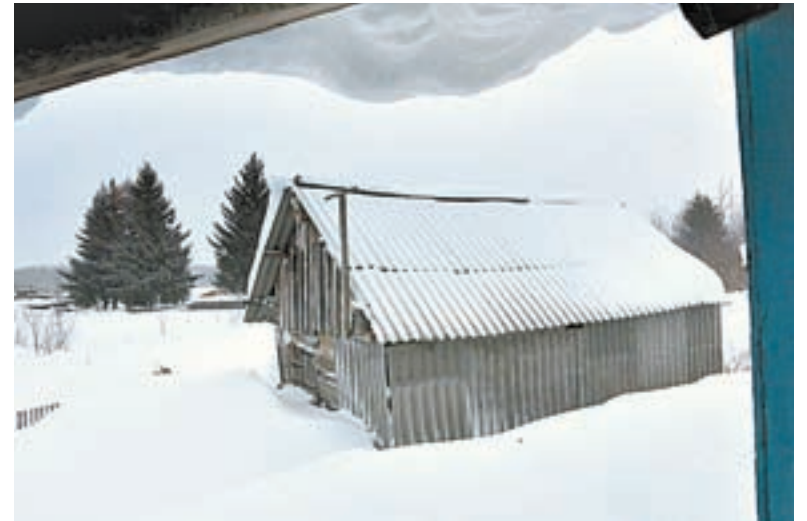
Снегом в этом году завалило многие сельские усадьбы.

30 соцработников Залесовского филиала обслуживают на дому 199 человек, в том числе и людей, достигших 80-летнего возраста.