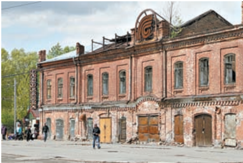
Это старинное здание на ул. Мало-Тобольской будет отреставрировано.

Предприниматели хорошо реагируют на такие предложения властей, они открывают в турзоне гостиницы, сувенирные магазины, рестораны и другие объекты, в итоге отремонтировав 13 исторических зданий. Стараниями частных инвесторов преобразилась улица Льва Толстого