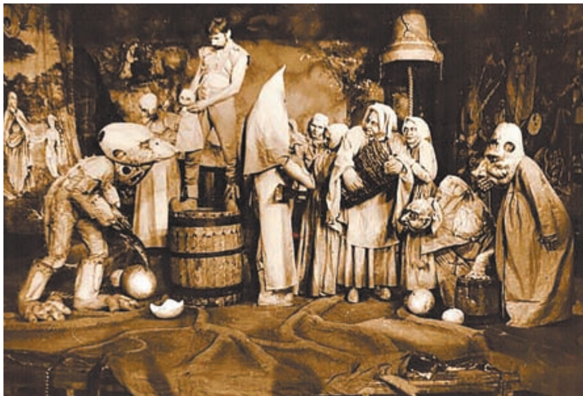
«Куклы, сбежавшие от Босха». Мизансцена спектакля «Тиль». Театр «Сказка», 1982 год.