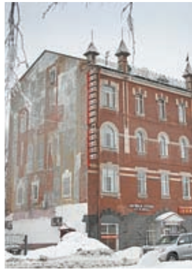
Здесь больше ста лет назад был доходный дом.

на участке от пр. Ленина до Социалистического. Они отремонтировали фасады зданий, вывески стилизовали под старину, подключали здания к новой канализации. В перспективе там должны открыться кафе, рестораны, магазины.