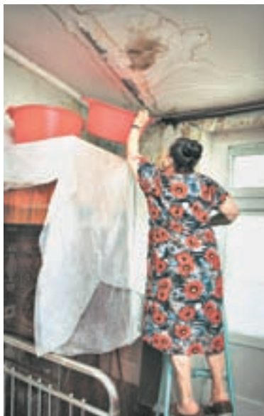
Для жильцов дома на пр. Ленина, 67-а тазы на шифоньере – дело привычное.

Они нам сообщили, что капитальный ремонт фасада и крыши