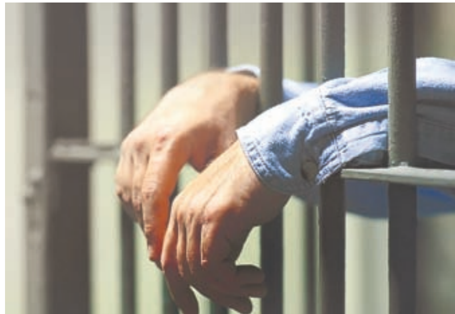
Рубцовский Отелло проведёт в колонии 12 лет.