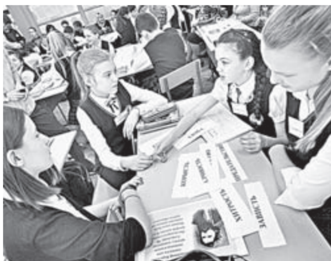
Обсуждение героев повести Короленко на уроке литературы.