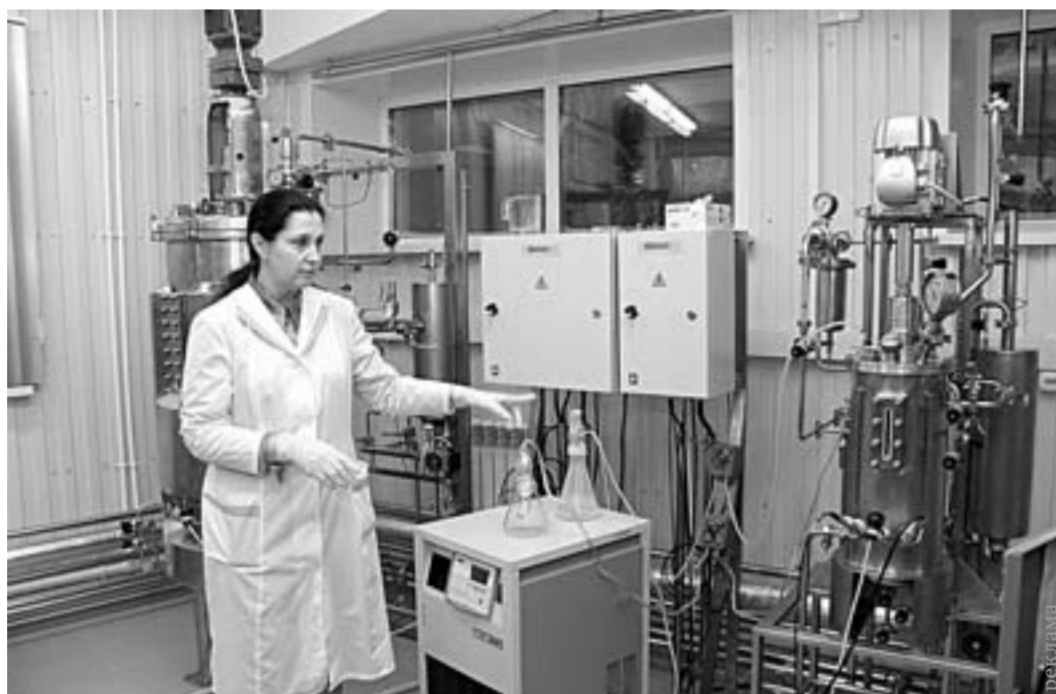
На этой установке в ИЦ «Промбиотех» АлтГУ получают эффективный пробиотик для КРС.

Одним из таких научных направлений вуза является международный проект «Кулунда», в рамках которого усилиями ученых АлтГУ