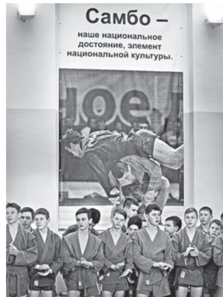
В турнире состязалось более полутора сотен мальчишек.

урочили межрегиональный турнир на призы группы компаний «ТАЛТЭК». На ковёр вышли 170 борцов 14–15 лет из Кемеровской, Новосибирской, Томской областей, Республики Алтай и Алтайского края. Юноши с интересом