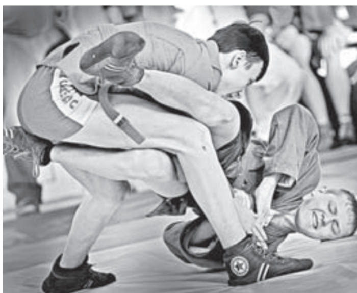
Из такого захвата уже не вырваться.