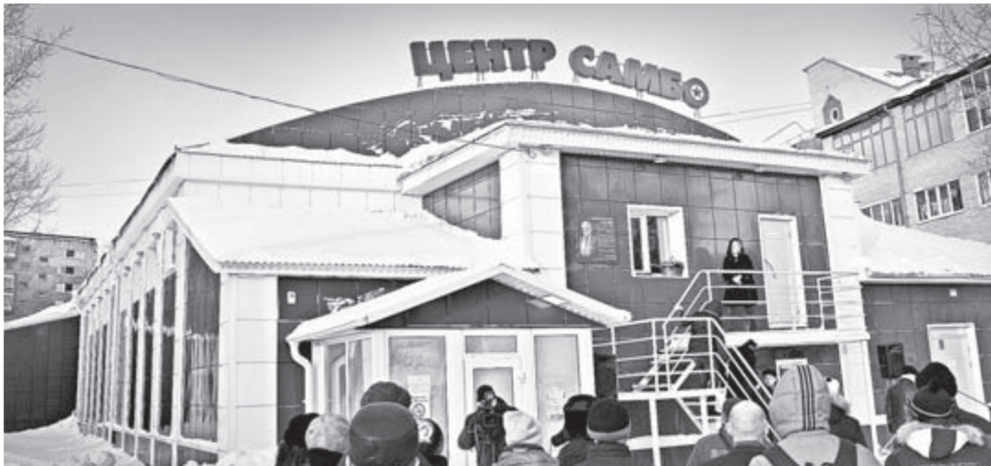
Этот борцовский зал – место притяжения всех местных мальчишек.

К памятной дате, а также к годовщине открытия Алтайского центра самбо при-