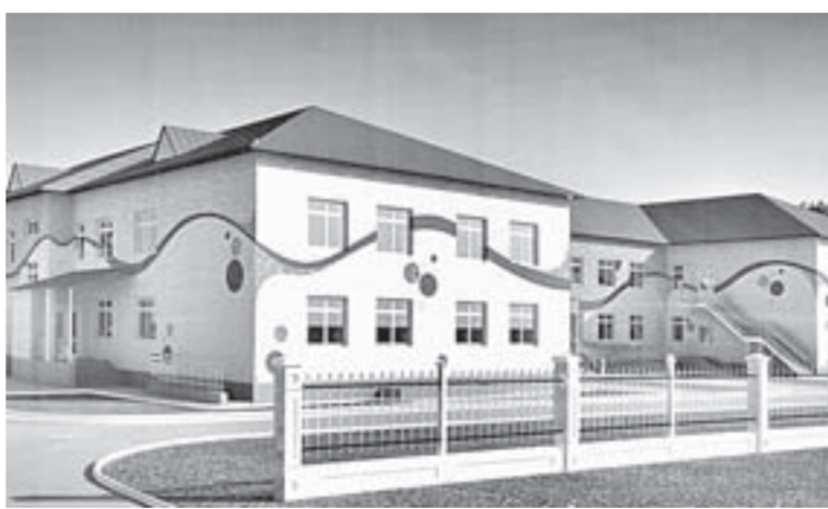
Детский сад в Поселихе построен по губернаторской программе «80х80».

Отвечая на вопрос о газификации юго-западной и западной частей региона, губернатор отметил, что работы идут по графику, по согласованию с «Газпромом». Подрядчик зашел на площадку, завозятся расходные материалы, трубы, подготовлена площадка под монтаж ГРС. «У меня прошли телефонные переговоры с руковод-