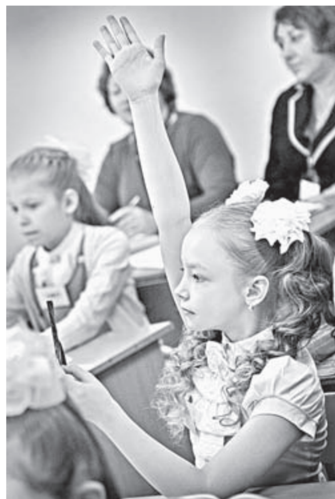
Молодые педагоги говорят, что учащиеся гимназии №79 стали их помощниками.

Дети разделились на команды, причем каждая выбрала себе своего героя, а ребята, которым по состоянию