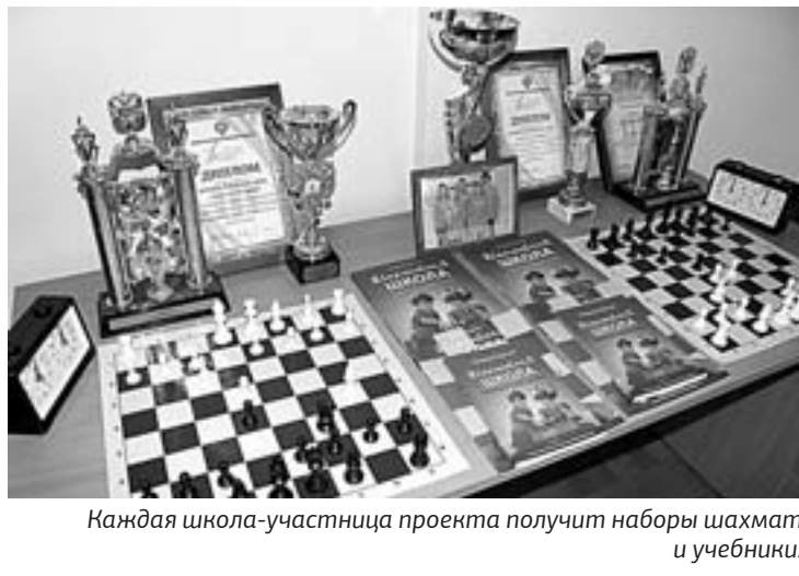
Каждая школа-участница проекта получит наборы шахмат и учебники.