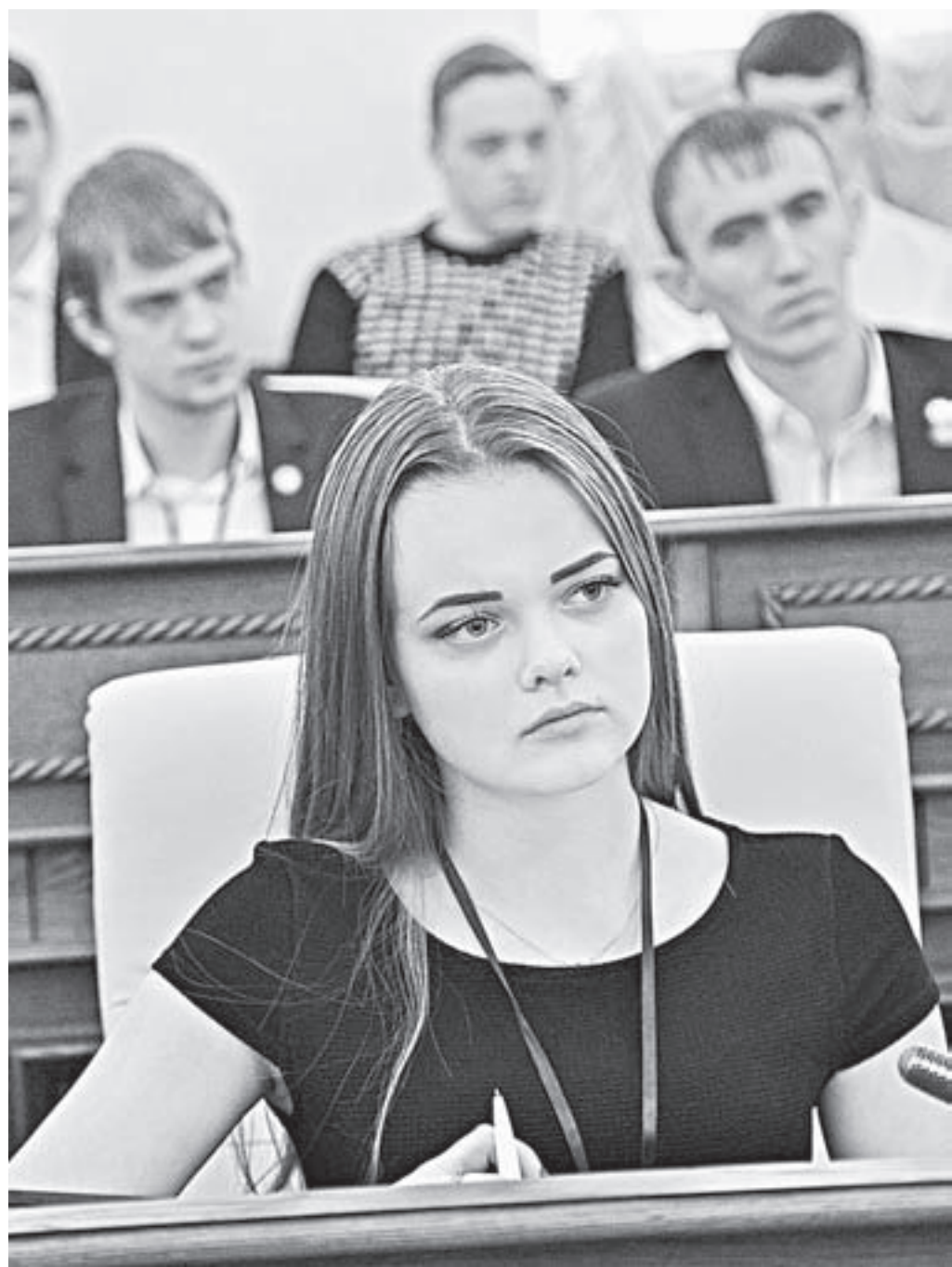
Молодые, перспективные, красивые.