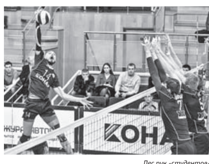
Лес рук «студентов».

В очередном туре чемпионата России по волейболу в Высшей лиге «А» барнаульский «Университет» в гостях поделил очки с челябинским «Торпедо».