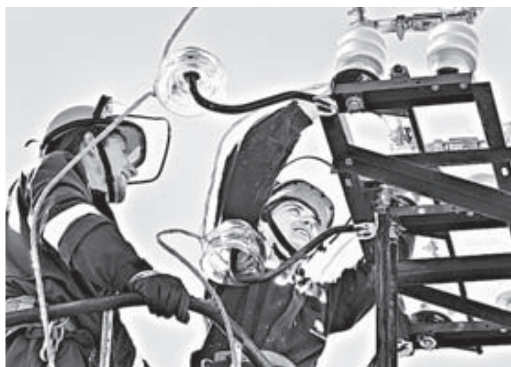
Бесхозных сетей в крае – меньше процента.

– Бесхозные сети – это наследие прошлых реформ в электроэнергетике, – сказал Александр Карлин. – Этот вопрос мы последовательно ре-