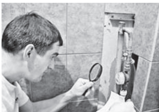
Проверять приборы учета будут раз в три месяца.

Прежде всего изменится начисление платы за ОДН. До последнего времени она определялась как разница между показаниями общедомового прибора учета, показаниями индивидуальных приборов учета и нормативами потребления, начисленными для потребителей, не имеющих индивидуальных