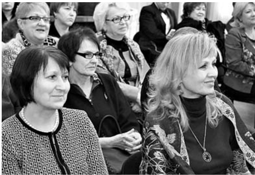
Женщины были единодушны: для счастья нам всем нужны мир, стабильность, мудрость власти, безопасность и крепкая семья.

Традиционное событие собрало известных женщин края в Государственном музее истории, литературы, искусства и культуры Алтая (ГМИЛИКА).