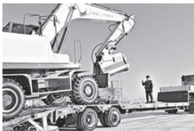
Новая техника будет работать на самых проблемных дорогах края.

Около 100 единиц новой спецтехники стоимостью 700 миллионов рублей поступит до февраля 2017 года в шесть ДСУ края. Средства на обновление машинно-тракторного парка выделил краевой дорожный фонд. Последний раз такое количество поступало на Алтай в 2000-е, когда строили дорогу Алтай – Кузбасс.