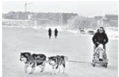
Катание на собачьих упряжках вошло в программу праздника.