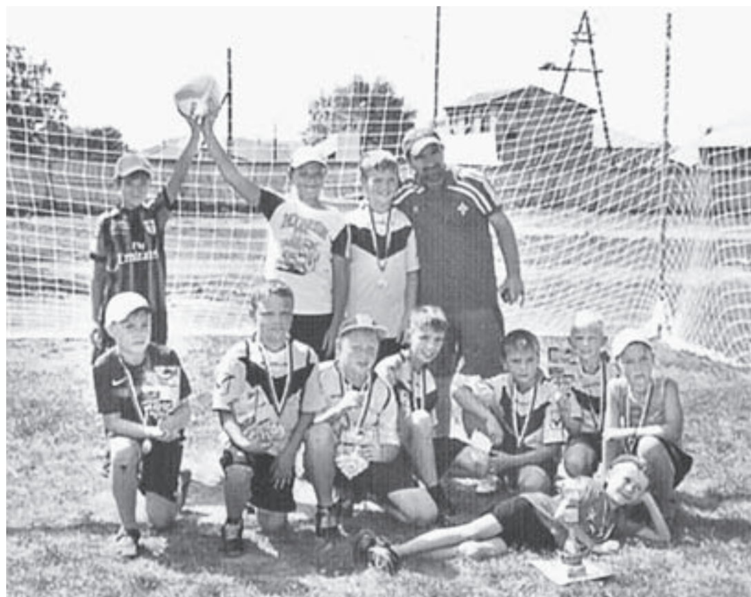
Многие начинали играть в таких дворовых командах.