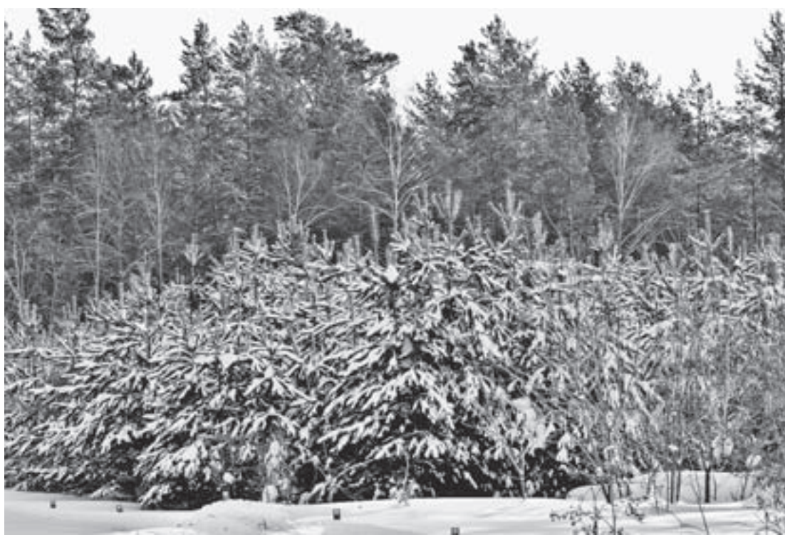
Зеленые массивы охраняют и на земле, и в воздухе.