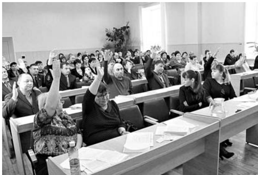
Бюджет Каменского района депутаты приняли единогласно.

Городской депкорпус численным преимуществом добился сокращения этих доплат городским пенсионерам, ранее замещавшим муниципальные должности, более чем в два раза, на чем сэкономил 833 тысячи бюджетных рублей. Казалось бы, из благих соображений – бюджет города настолько скуден, что не до жиру. Одних долгов ликвидирующаяся городская администрация оставила после себя 260 миллионов (еще не все кредиторы встали в очередь) – это практически четыре бюджета Камия на 2017 год. Только на обслуживание муниципального долга городу придется потратить девятую часть своих доходов в 2017 году. При этом на социалку