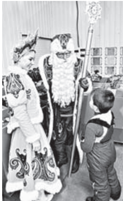
Дед Мороз. Новый год, жизнь и другие чудеса.