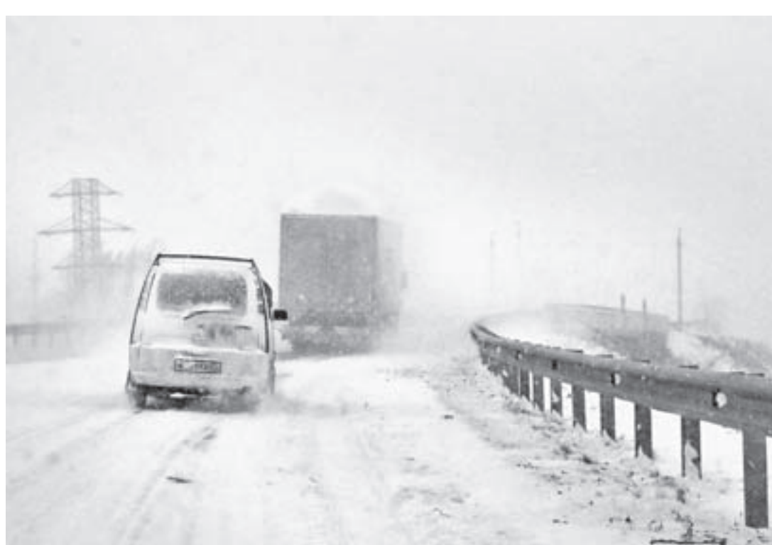
Начало января. Алейская трасса.

Полиция и следователи выясняют все обстоятель-