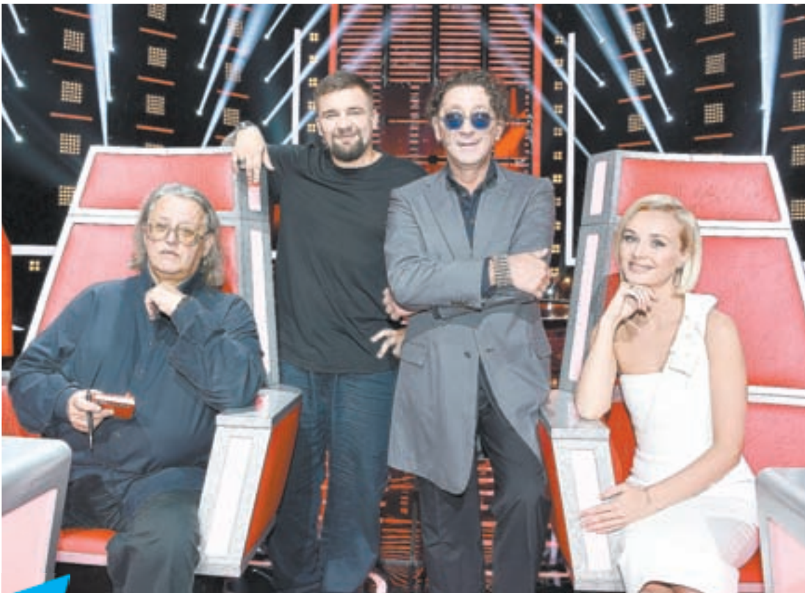
16.10 Док.ф. «ГОЛОС». НА САМОЙ ВЫСОКОЙ НОТЕ» (12+)

06.00 Утренний канал (12+) 06.15 Мультфильмы (6+) 06.25 Утренний канал (12+) 06.45 Мультфильмы (6+) 07.00 Утренний канал (12+) 07.15 Мультфильмы (6+) 07.25 Утренний канал (12+) 07.45 Мультфильмы (6+) 08.00 Утренний канал (12+) 08.15 Мультфильмы (6+) 08.25 Утренний канал (12+) 08.45 Мультфильмы (6+) 09.00 Утренний канал (12+) 09.15 Мультфильмы (6+) 09.25 Утренний канал (12+) 09.45 Мультфильмы (6+) 10.00 Ералаш (6+) 10.40 Х.ф. «Три королевства. Возвращение дракона» (0+) 12.30 Концерт школы танца «Лариса» (0+) 13.00 Среда обитания: «Продукты бывшего СССР» (16+) 14.00 Х.ф. «Возвращение Будулая», 2-я серия (6+) 15.20 Интервью дня (12+) 15.30 Ваша партия (12+) 16.00 Встречи с губернатором (12+) 16.45 Х.ф. «Янтарные крылья», 1-2-я серии (12+) 18.30 Док.ф. «Я занята, у меня елки» (16+) 19.30 Концерт группы «Садко» (0+) 21.30 Неизвестная версия: «Вечера на хуторе близ Диканьки» (16+) 22.30 Неизвестная версия: «Карнавальная ночь» (16+) 23.20 Интервью дня (12+) 23.30 Рождественское ночное богослужение 03.00 Концерт Архирейского мужского хора (0+) 04.05 Торжественное мероприятие краевого благотворительного марафона «Поддержим ребенка» (0+) 06.40 Музыкальный спектакль «Бабий бунт» (0+)