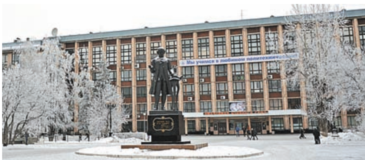
Алтайский государственный технический университет активно готовится к 75-летию. Празднование состоится в начале марта 2017 года.

Важно, что во время реорганизации удалось сохранить практически весь профессорско-преподавательский состав. Педагоги, которые ушли с кафедр, не прошедших аккредитацию, вместе со своим студентами сменили траекторию, переключились с гуманитарных направлений на экономические.