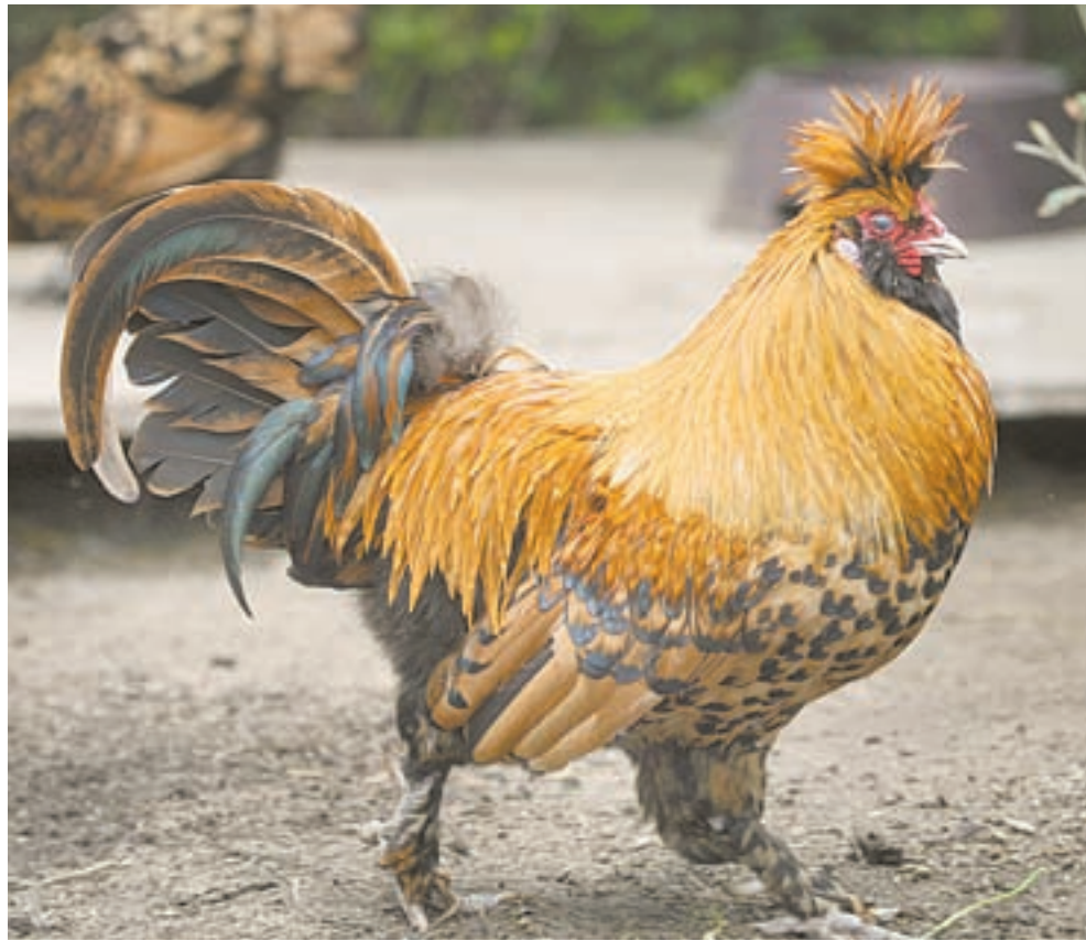
Этот красавец – павловский петух.

– Например, петух породы онагатори славится своим невероятно длинным хвостом,