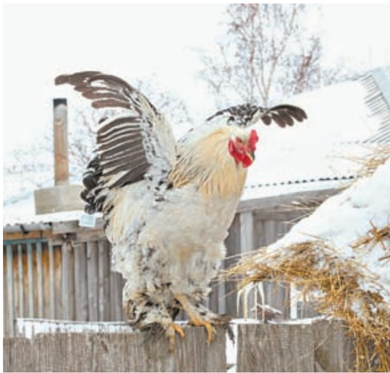
К лету петухи станут настоящими красавцами.