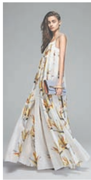
Цветы, бабочки, птички на тканях создают хорошее настроение и у окружающих.

давали раньше очарование дамским блузам и девичьим платьям.