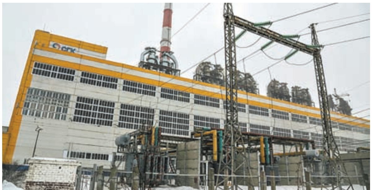
Барнаульская ТЭЦ № 3 – фабрика по производству энергии.

Группа «Сибирская генерирующая компания» – энергетический холдинг, занимающийся производством тепло- и электроэнергетики и ее передачей на территории Кемеровской области, Красноярского и Алтайского краев, Республики Тыва. Численность персонала СГК – около 20 тысяч человек, в структуру компании входят тепловые сети протяженностью 4956 километров, одна ГТЭС, четыре ГРЭС и двенадцать ТЭЦ общей установленной мощностью 7855 МВт и тепловой мощностью 15603 Гкал/час. На долю станций СГК приходится 17-20% всей сибирской генерации. ТЭЦ Барнаульского филиала компании выработали за 2016 год 3 млрд 843 Квт/часа, прирост за год составил 8,8%. Выработка тепла выросла до 5 млн 122 тыс. Гкал. Зарегистрирован и рекорд. На Барнаульской ТЭЦ-3 выработано 2 млрд 580 КВт/часов, это исторический максимум за 35-летнюю историю станции.