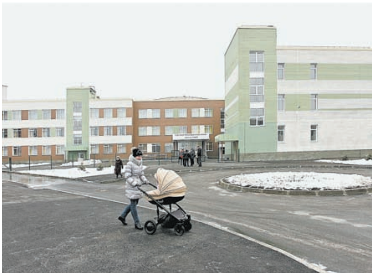
В крае все больше новых школ, оснащенных самым современным оборудованием.

– Объемы средств на социальные выплаты не только многодетным семьям, но и остальным льготникам будут увеличены. Если в текущем году на эти цели выделялось 17,9 млрд рублей, то в следующем – уже 18,8 млрд, в том числе на поддержку материнства и детства 5,1 млрд рублей. Но в соответствии с установками главы государства и с пониманием справедливости распределения социальной поддержки будем уделять больше внимания адресности оказания помощи. Ваш пример слишком гипотетический. Нужно разбираться более