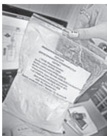
Биопрепарат гарантирует отличный привес молока.

изводство, проектный офис и подразделения по проведению промышленных испытаний. В коллективе 20 человек: инженерные кадры, научные сотрудники, специалисты по проведению испытаний