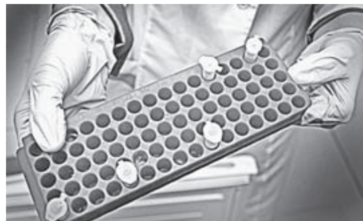
В холодильнике таким образом хранятся культуры.

проведения испытаний производились в Москве на базе опытного производства ФИЦ ФОБ РАН, это научный партнер «Промбиотеха». В ближайшие два года планируется значительно расширить программу промышленных испытаний. В частности, речь идет о биоком-