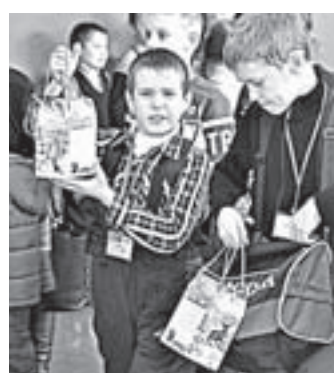
Более 122 тысяч сладких подарков получат школьники края.

Кроме того, губернатор в этот день пообщался с отличниками, победителями и призерами краевых и всероссийских олимпиад и конкурсов. Участники этой встречи занимаются спортом, искусством и техническим творчеством, причем особенно активны были юные робототехники. Они спрашивали главу региона, интересовался ли он сам в детстве роботами (губернатор ответил, что в фантастической литературе его детства больше писали о господстве электричества или покорении космоса), какого робота хотел бы себе домой (помощника по хозяйству), а также можно ли будет посещать будущий детский технопарк. – После того как технопарк откроется, нужно будет прийти