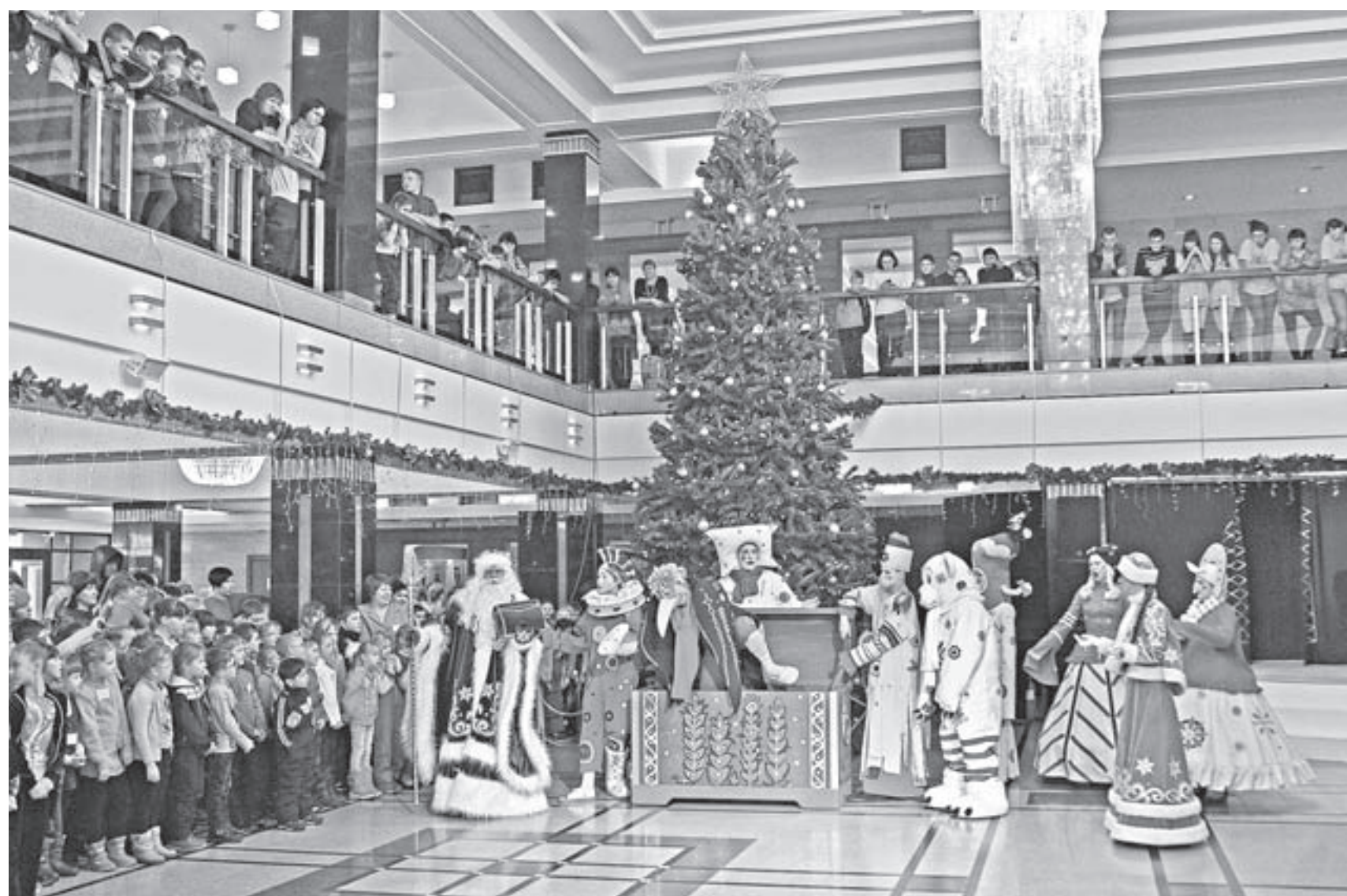
Главная ёлка края встречает гостей.