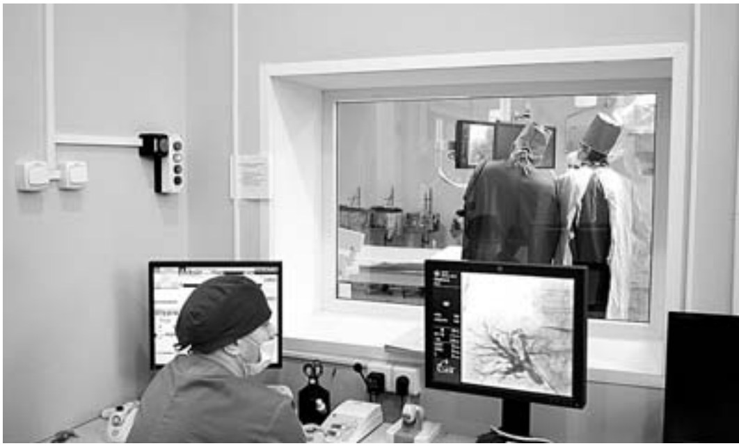
Новейшее оборудование дает возможность проводить операции на сосудах.