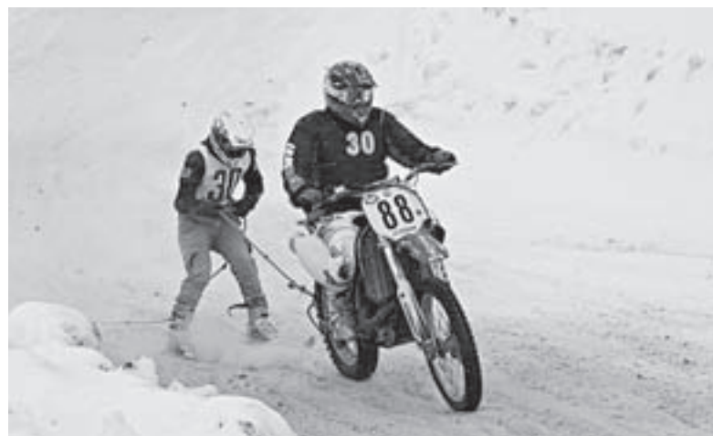
На лыжах за мотоциклом.

В Бийске прошли краевые соревнования мотолыжных экипажей в рамках праздника «Алтайская зимовка».