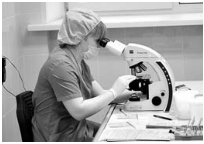
Лаборатория гарьболницы №5 оснащена по последним требованиям.

С основным докладом на расширенной коллегии выступила руководитель Главного управления Алтайского края по здравоохранению и фар-