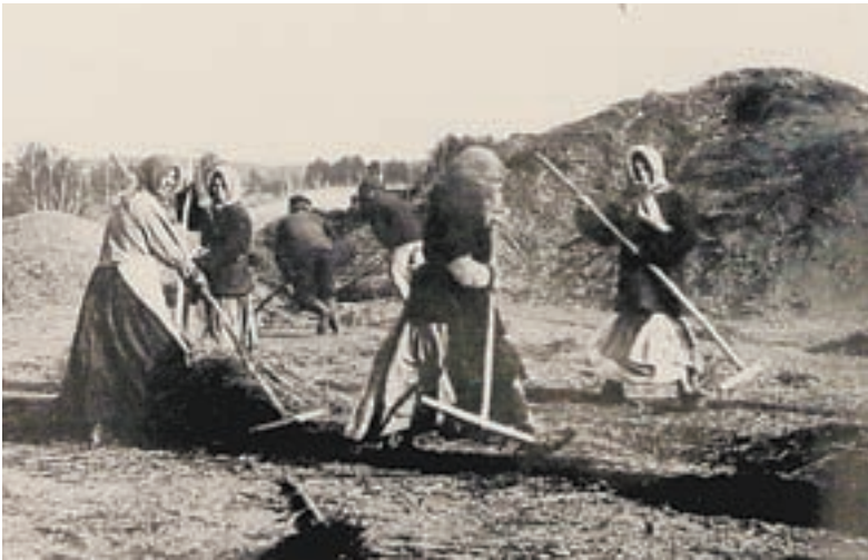
После отмены крепостного права заводское население и приписные крестьяне получают свободу и расселяются по всему округу.

Одна из ведущих экспозиций Государственного архива Алтайского края в 2016 году – «Экономика Алтая на изломах истории», приуроченная к 60-летию награждения региона орденом Ленина за большой вклад в освоение целинных и залежных земель. Неравнодушный посетитель обязательно заметит исторические параллели расцвета предпринимательства конца XIX – начала XX века – и начала XXI.