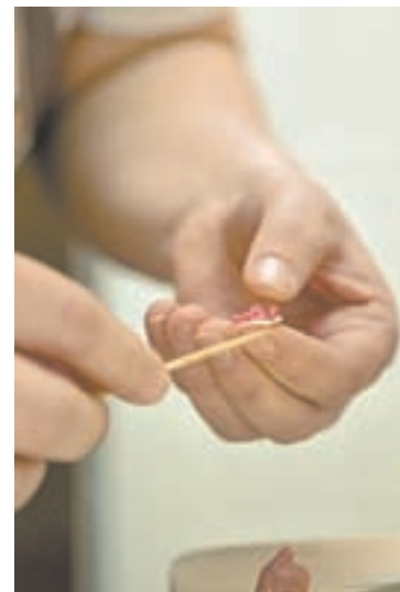
Так лепили мировой рекорд весом 0,0016 грамма.

– Да простят меня организаторы таких акций, это самопиар, не более того. Китайцы так и не сварили свой «рекорд» и в конце концов просто его «разо-