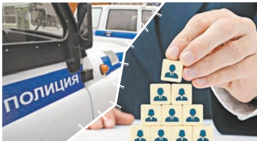
Мошенник набрал займов на 46 миллионов рублей.

В конце апреля 2015 года, когда она в очередной раз ему отказала, начал спрашивать о ее жизни. Предпринимательница рассказала про дочь, что та не может трудоустроиться, а ей хочется работать в банке. Собеседник сказал, что у него есть знакомый по имени Максим, стоит только тому позвонить, как всё будет решено. Через какое-то время сообщил, что договорился, тот устроит ее дочь, но Максима надо выручить. Она пообещала дать деньги. Мужчина пояснил, что они нужны на покупку крупных партий заморозки, при ней ему на телефон даже поступил звонок якобы от