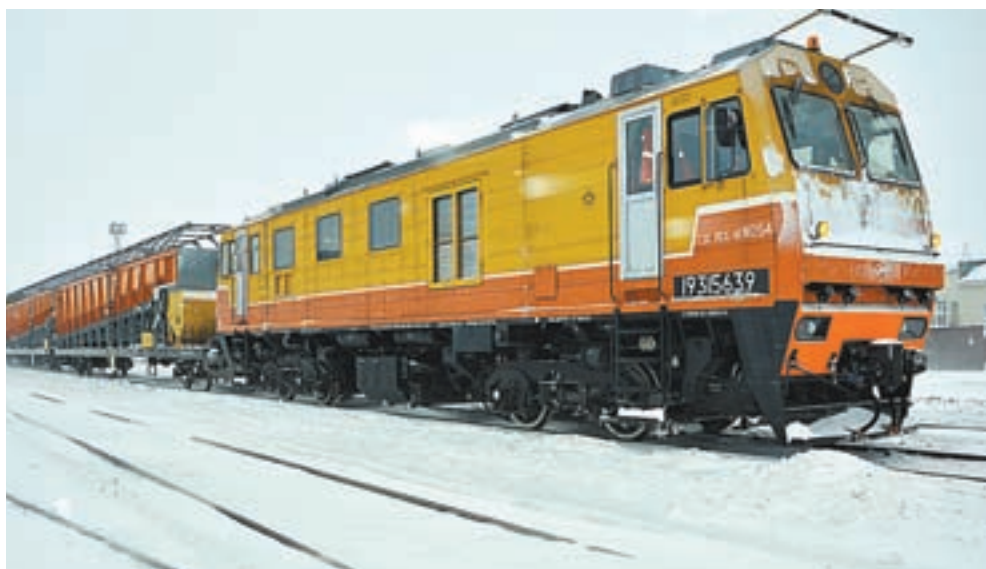
Снегоочистительная машина ПСС-1К обеспечивает бесперебойность работы железной дороги в зимний период.