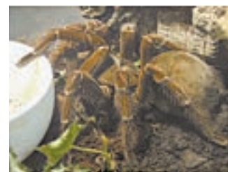
Птицеед-голиаф – самый большой паук выставки.

Еще среди экспонатов представлен паук кравшай, он же паук-бабуин. Этот вид тоже