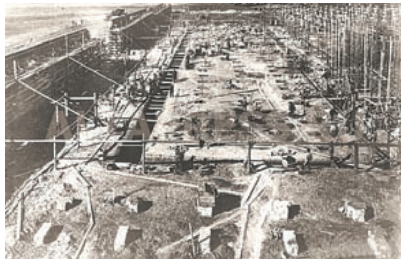
Строительство меланжевого комбината.