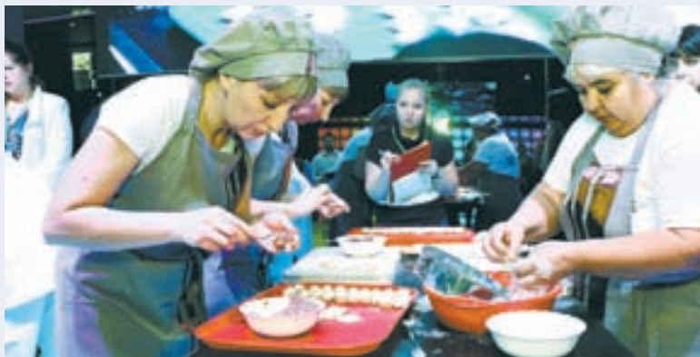
Пельменное «легкомыслие» всколыхнуло всю Россию.

– Любый врач подтвердит, что главное в еде – умеренность. Не думаю, что 20 – 30 пельмешков в обед повредят взрослому здоровому мужчине. Состав продукта идеальный, ничего лишнего. Тесто без дрожжей из простых ингредиентов. В фарше только свежее мясо и специи. Опять же пельменная классика – это отваривание, а не жарка. Конечно, мы говорим сейчас о качественном продукте домашней лепки либо магазинном, но премиум-, а не эконом-класса. Я как-то провел эксперимент. Угощал своих друзей покупными пельменями, но им сказал, что это мы с женой налепили. Гости хвалили, сразу, мол, видно, что свои. А когда ту же марку на их глазах высыпал из пачки в кипяток, уверяли, что домашние лучше.