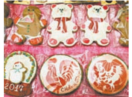
Печенье сделано своими руками.

специй (корица, имбирь, ванилин). Тесто должно полежать ночь, потом его можно раскатывать и раскладывать по формам.