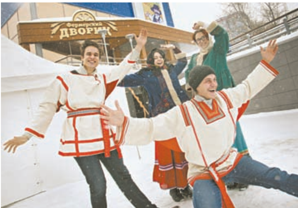
Гостей ярмарки развлекали веселые и озорные артисты.

По словам барнаульской мастерицы, приготовить его несложно, в Интернете есть много рецептов. При изготовлении обычно используют сливочное масло, яйца, сахар, мед, муку и, конечно, набор