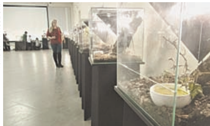
Выставка пауков продлится до 31 января.

В Барнауле в музее «Город» открылась любопытная выставка «Удивительный мир пауков».