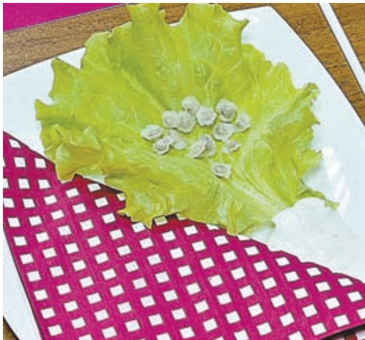
Такая порция из 15 пельмешков талии не повредит.

– Изучение гастрономических традиций региона едва ли не самый приятный момент для путешественника. И потому в такие туры по Алтаю мы включили пельменинг. Лепить качественно быстро и много – большое мастерство. В этой точке все и срослось. Чемпи-