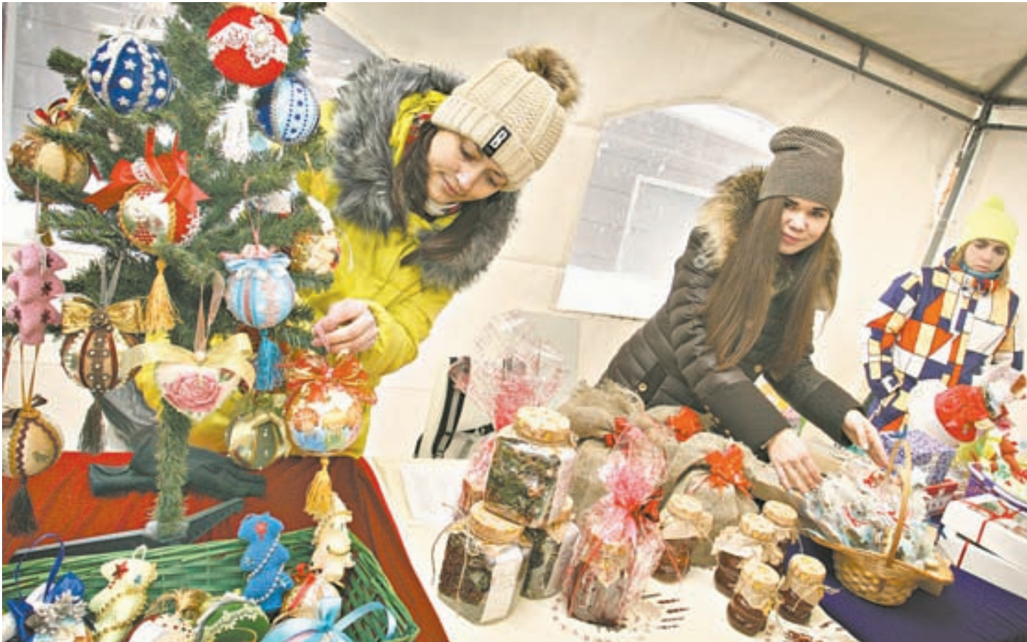
Мастерицы из краевого центра представили гостям выставки сувениры на елку и вкусности.