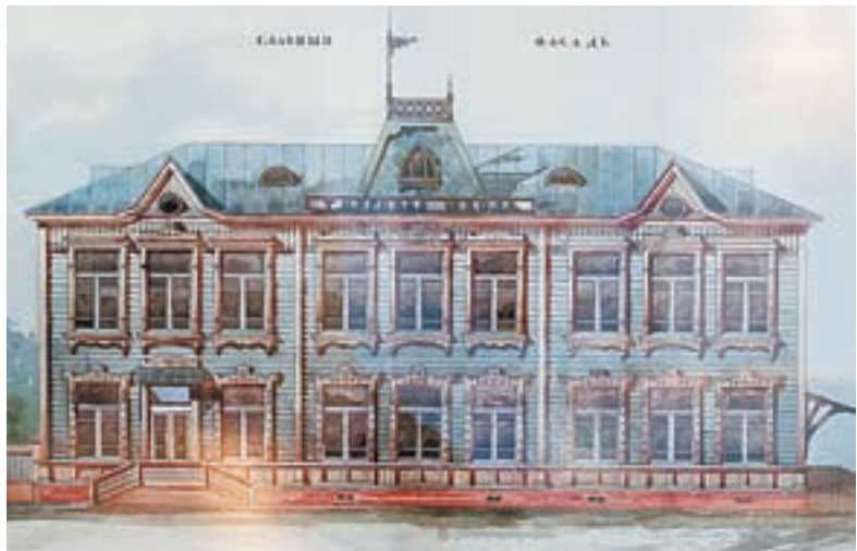
Проект главного фасада торговой школы. 1910 г.