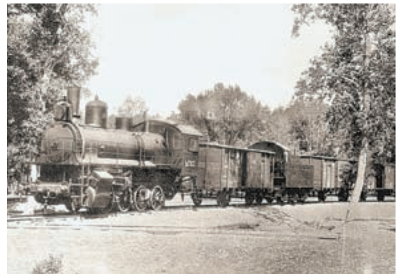
Проблемы транспортировки продовольствия решались с развитием железной дороги и пароходства.

Развивалось речное пароходство, удобный и недорогой вид транспорта. Им доставляли грузы, ходили по рекам «переселенческие» пароходы.