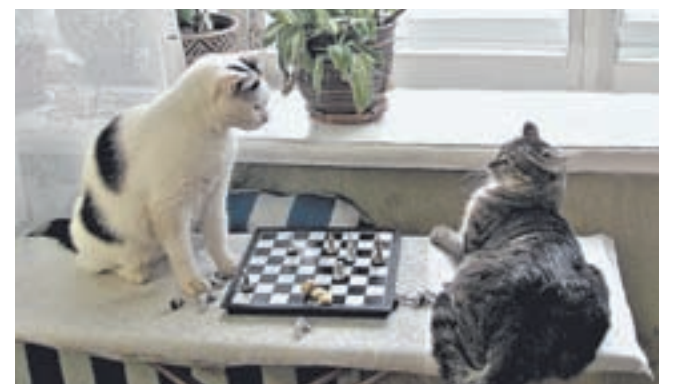
Очередная турнирная схватка домашних любимцев шахматного обозревателя «АП».