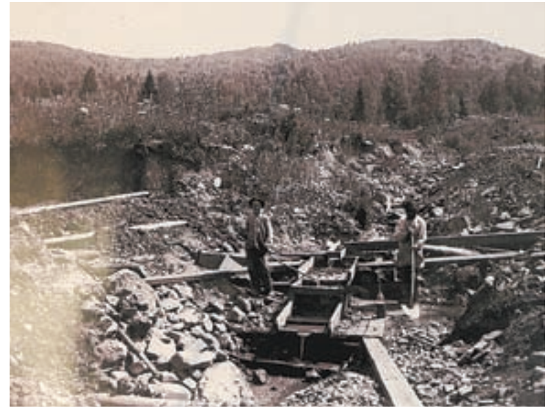
Добыча золота на Карачинском прииске. Начало XX в.

Расцвет перерабатывающей отрасли и производства муки,