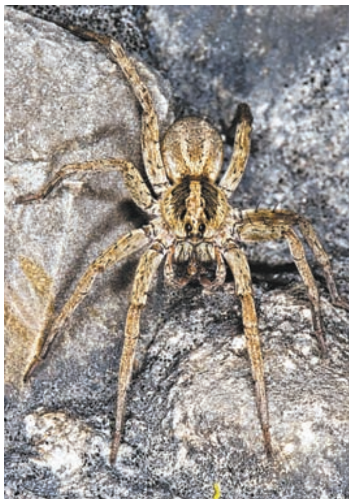
Паук-волк живет в странах с теплым климатом.