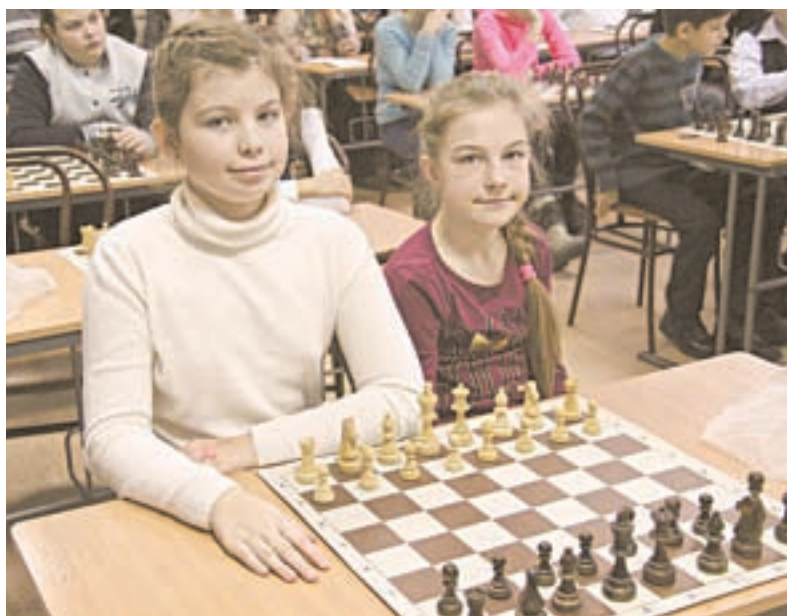
Девочки играют не хуже мальчиков.