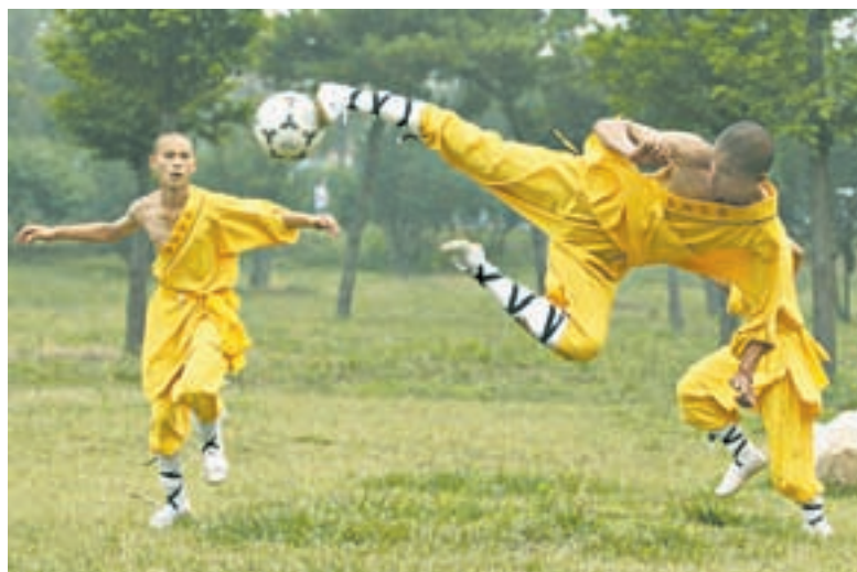
Над законами физики и собственными возможностями.

подчинилось. Иголка, посланная натренированной рукой с нужной силой, пробивает стекло – это «Железная рубашка». Толстая палка ломается, словно спичка, о руку или ногу бойца. Ничего невозможного нет, но это огромный труд. Три интенсивных тренировки в день, работа с дыханием, концентрация энергии – год за годом, всю жизнь. Для нас норма – дышать пятками и макушкой. А после вечерней тренировки прилив энергии такой, что уснуть невозможно. Поэтому китайцы занимаются тайцзи и цигун по утрам в парках – это национальная традиция.