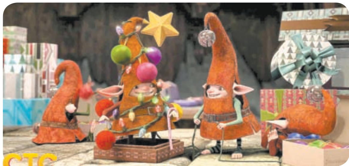
16.55 М.ф. «ХРАНИТЕЛИ СНОВ» (0+)

06.00 Интервью недели (12+) 06.50, 02.00 Рецепт дня (12+) 07.00 Интервью недели (12+) 08.00 Мультфильмы (6+) 10.00, 20.30 Новости. Итоги (12+) 10.30, 19.30, 04.00 Хлебный край (12+) 11.00 Сериал «Одна ночь любви» (12+) 12.40 В наше время (16+) 13.30 Х.ф. «Письма к Джульетте» (12+) 15.20 Их Италия (16+) 16.10 Х.ф. «Желание» (16+) 18.00, 03.20 Ваша партия (12+) 18.30, 02.20 Ваш вопрос (12+) 20.00 Время культуры (12+) 20.15 Стратегия успеха (12+) 21.00 Гала-концерт «Золотая нота» (0+) 23.00 Х.ф. «Помни меня» (16+) 01.00 Тайны века: «Убийство под грифом «Секретно» (16+) 02.05 Алтайский край в лицах (12+) 03.50 Интервью дня (12+) 04.30 Стратегия успеха (12+) 04.40 Время культуры (12+) 04.50 Былое (12+) 05.00 Встречи с губернатором (12+) 05.30 Медиалог (12+)