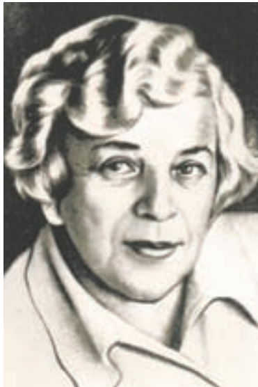
Знаменитая уроженка нашего края.

В прошлом году в «Шишковке» проходили «Дни сибирской книги». Тогда томичи привезли в подарок краевой библиотеке «Томскую классику» – в этот многоотомник наряду с творениями других земляков вошла и кни-