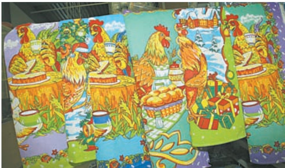
Новоалтайская компания «Свит» выпустит 450 тысяч полотенец с символом года.

Татьяна КОЧЕТЫГОВА, Евгений НАЛИМОВ (фото)