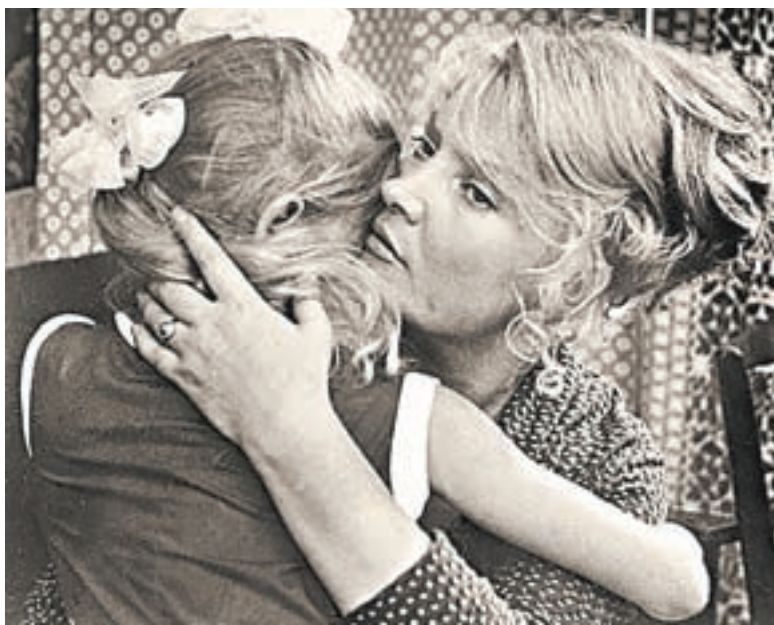
Замечательную картину, главную роль в которой исполнила Татьяна Доронина, любят и сегодня.