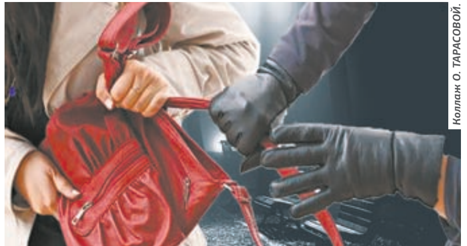
Коллаж О. ТАРАСОВОЙ.

Жительница Барнаула возвращалась с работы домой после второй смены 16 февраля 2016 года. Она вышла из служебного автобуса на улице Попова в Барнауле на остановке «Взлетная», перешла трамвайные пути и направилась в сторону своего дома. В руках несла пакет с рабочей формой и сумку, где были сотовый телефон, деньги, другое имущество. Пройдя метров 20 от улицы Попова, обратила внимание, что за ней следом идет какой-то