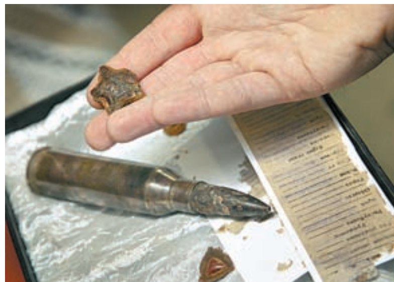
Личные вещи солдат, погибших на полях сражений.