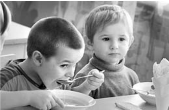
Директор школы заранее знает будущих первоклассников.

объекты располагаются буквально по соседству: детский сад сейчас делит большое здание с клубом и ФАПом и находится в минуте ходьбы от школы. «Если в садике что-то происходит, воспитатели просто звонят мне и я тут же прихожу», – говорит директор.