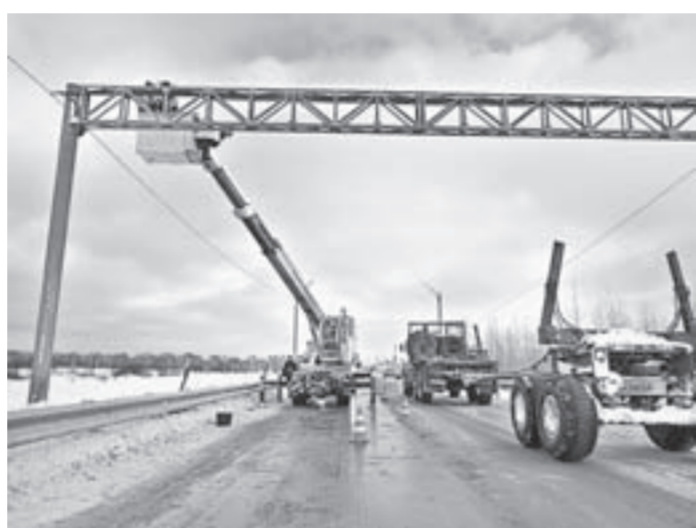
Монтаж автоматического пункта весового контроля в Залесово.

верхности, как автодорога Алтай – Кузбасс. На ней несколько выдулов и очень плавные повороты – еще бы, ведь по ней должны были следовать тяжеловесные составы суглуп в сторону Урала. Теперь вместо