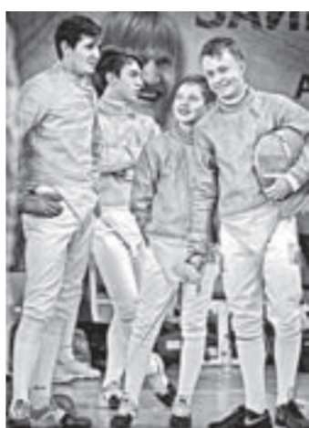
Один за всех!

делегация из Казахстана: прибыли спортсмены из четырёх регионов Республики,