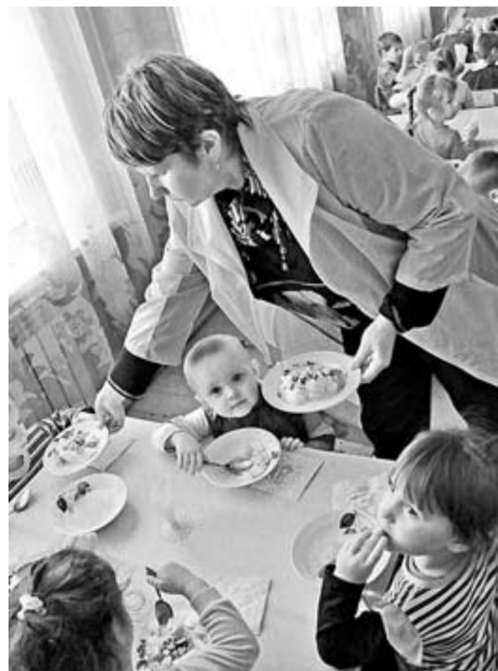
Пока группа одна, в неё ходят дети начиная с двух лет.

Детский сад села Урюпино Алейского района в 2016 году был присоединен к местной средней школе. И это не первый такой случай: в настоящее время в крае уже 107 детских садов работают как структурные подразделения общеобразовательных учреждений.