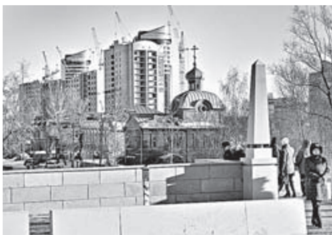
Мост стал украшением центра города.

Для выполнения заказов Кольванский камнерезный завод последние несколько месяцев работал в три смены. Специалисты предприятия поставили уникальную продукцию – различные элементы из гранита, в том числе плиты и шары для парапетов, бордюры и ступени. Свой вклад внесли специалисты Каменского металлозавода,