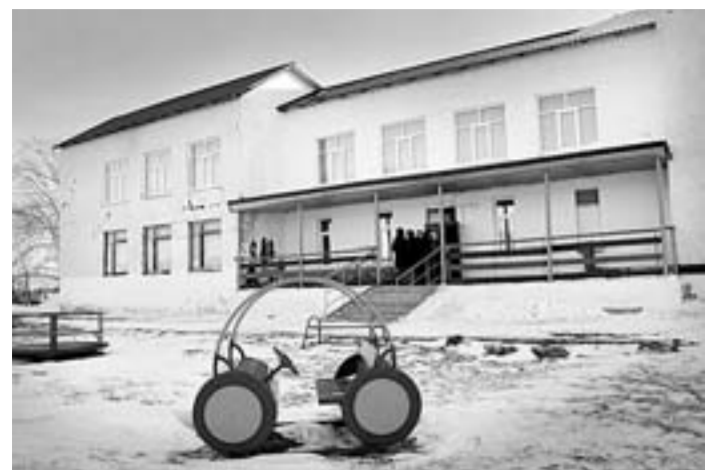
Детский сад в селе Урюпино находится в минуте ходьбы от школы.