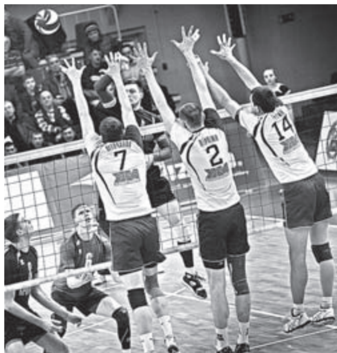
Фирменный блок в исполнении «Университета».

«Университет» выиграл заключительные домашние матчи в уходящем году, вернувшись в тройку лучших команд высшей лиги «А».