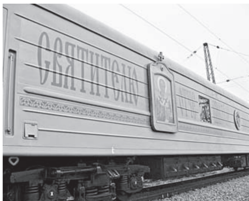
За время поездки храма-вагона его посетили 130 человек.