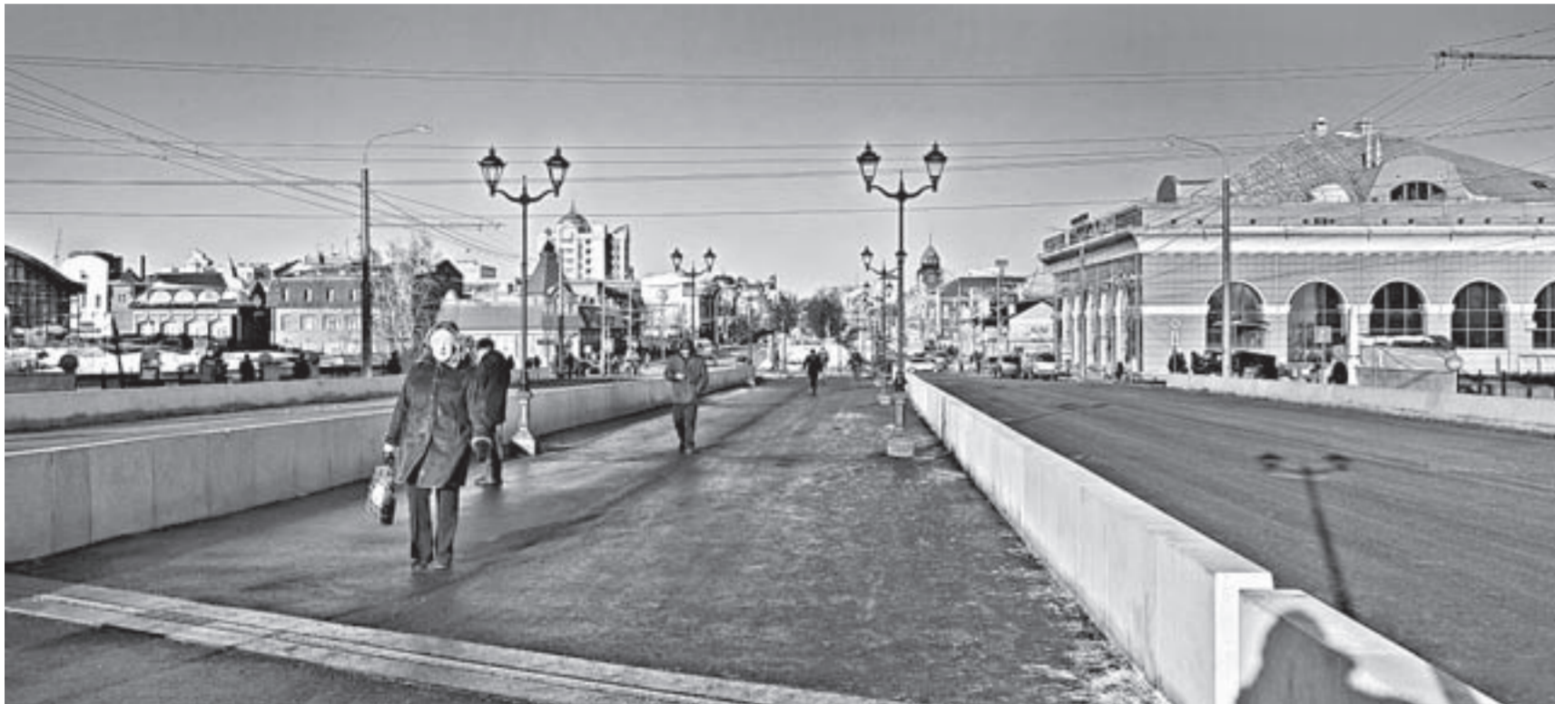
Горжане уже оценили построенный в рамках туркластера новый объект.

Вчера в краевом центре открыли мост через реку Барнаулку на проспекте Ленина. С учетом месторасположения и значимости объекта его реконструкция проводилась в сжатые сроки.