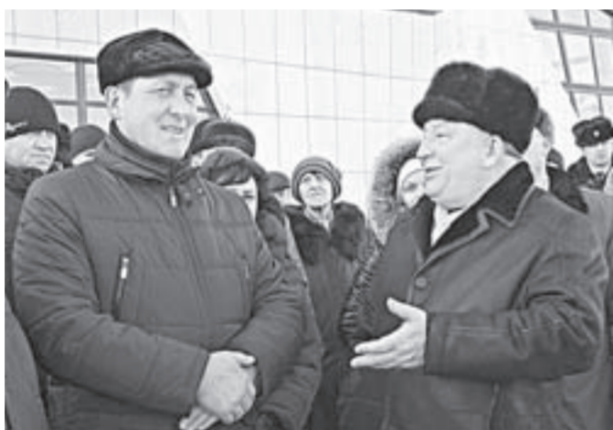
Губернатор Александр Карлин и глава администрации Барнаула Сергей Дугин.

В изготовлении элементов оформления моста приняли участие крупные предприятия Алтайского края – Кольванский камнерезный