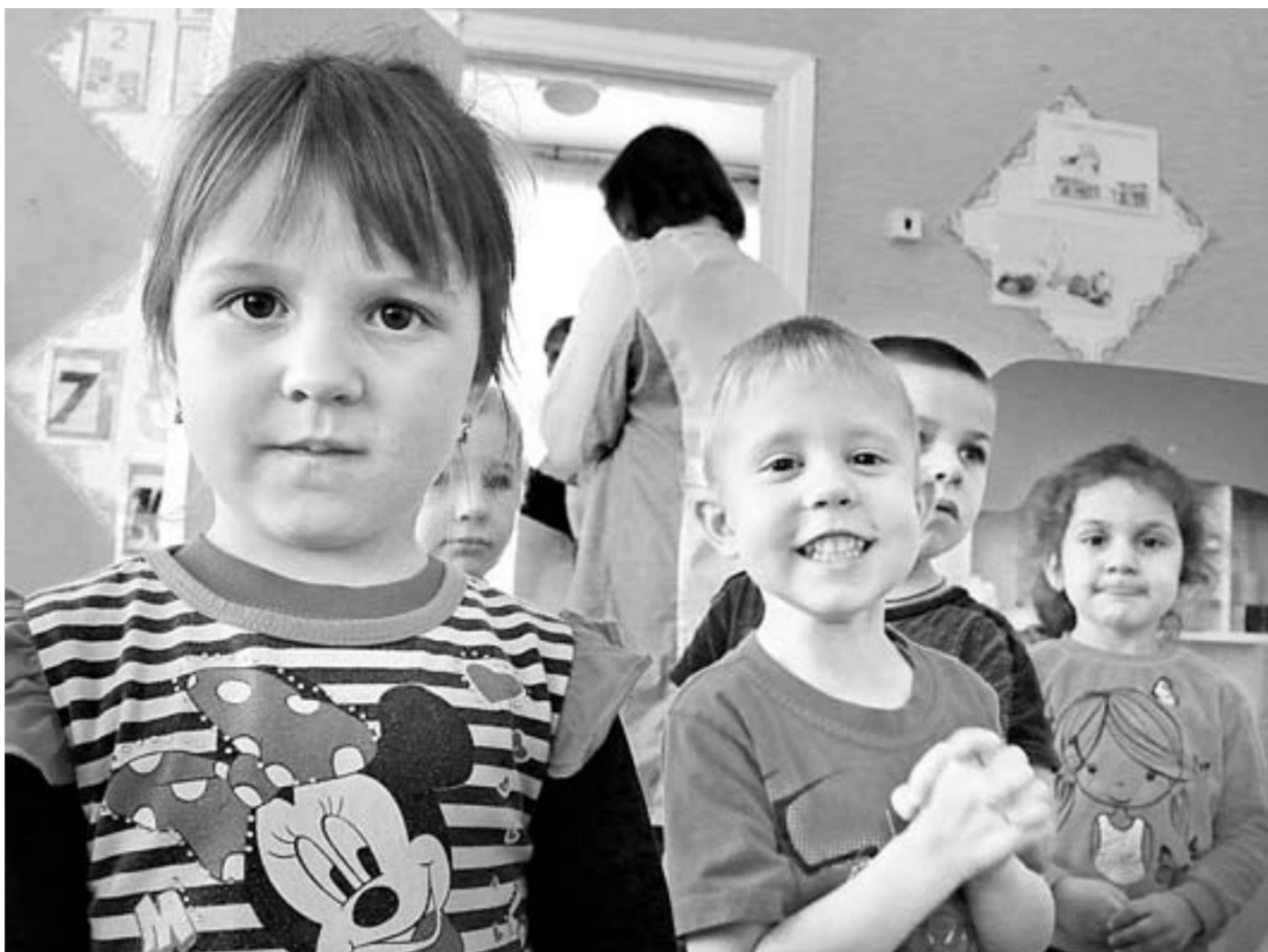
В новом году в этот садик будет ходить в два раза больше детей.

– Сейчас приняты федеральные государственные образовательные стандарты дошкольного образования, так что фактически детский сад стал первой ступенью образования. Объединение позволяет мне выстраивать преемственность между этими двумя уровнями. Мы