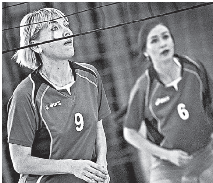
С такими девушками из крайздрави можно хоть в разведку ходить!

второй они также лидировали с большим отрывом – 18:12, но затем фортуна от них отвернулась. Работники крайздрави шаг за шагом принялись отыгрывать отставание. А в нервной концовке и вовсе вырвались вперёд – 25:22, после чего поймали кураж и сломили сопротивление соперников в третьем решающем сете.