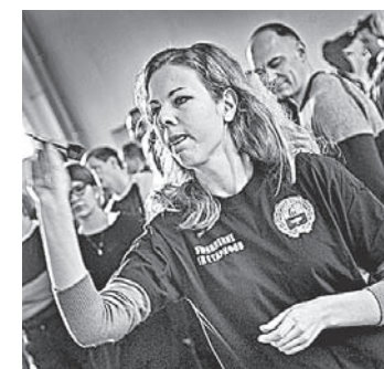
В дартс можно наловчиться играть и в рабочем кабинете.

Среди федеральных органов исполнительной власти в очередной раз с большим отрывом выиграла сборная управления налоговой службы по Алтайскому краю. Налоговики выиграли в волейболе, стритболе, плавании, шахма