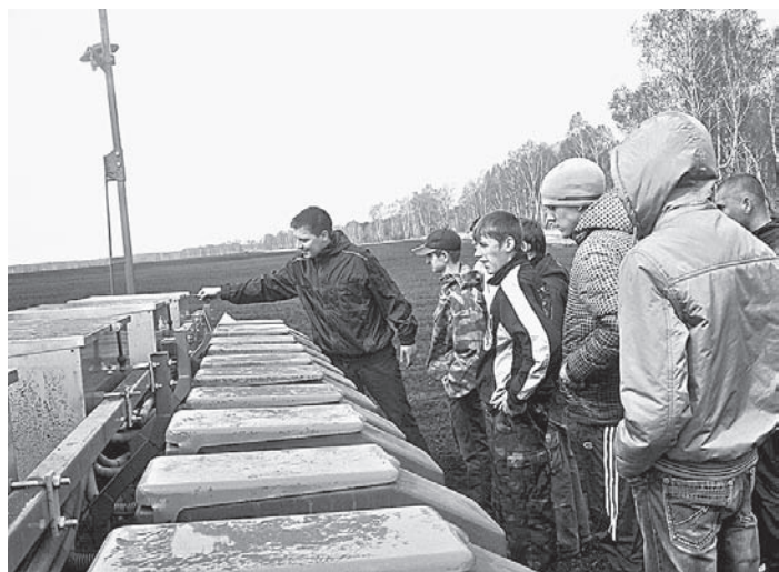
На производственной практике.

Обучение проходит три года, и уже в конце первого курса, изучив теоретический цикл, ребята выходят на посевную, затем на уборку. На 400 гектарах студенты выращивают и убирают рожь, яровую пшеницу, гречиху.