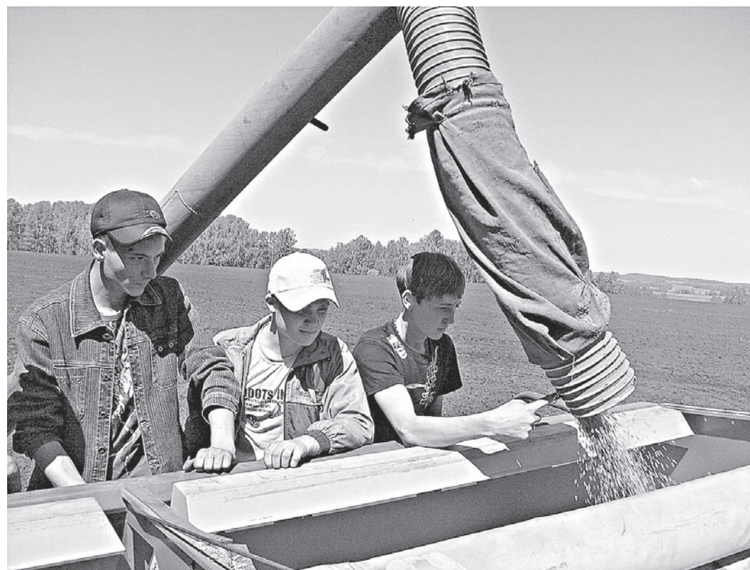
Показатели по сбору урожая в учебном хозяйстве на уровне районных.

профессии: подойдет им эта работа или нет. Бывают случаи, когда ребята не могут ужиться в рабочем коллективе или не выдерживают нагрузки из-за ослабленного здоровья. В основном лицам нравится знакомиться с производственной жизнью, работодатель им создает все условия для труда. Они бесплатно питаются, получают зарплату. В последние годы сложилась такая практика, что 30 процентов выпускников после армии возвращаются в село и остаются работать в тех фермерских хозяйствах, где раньше проходили практику. Чтобы закрепить молодые кадры за собой окончательно, фермеры строят им дома, решают и другие социальные вопросы, актуальные в селе.