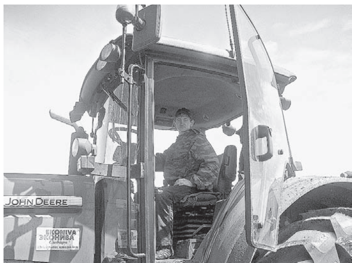
Современную технику студенты осваивают в фермерских хозяйствах.