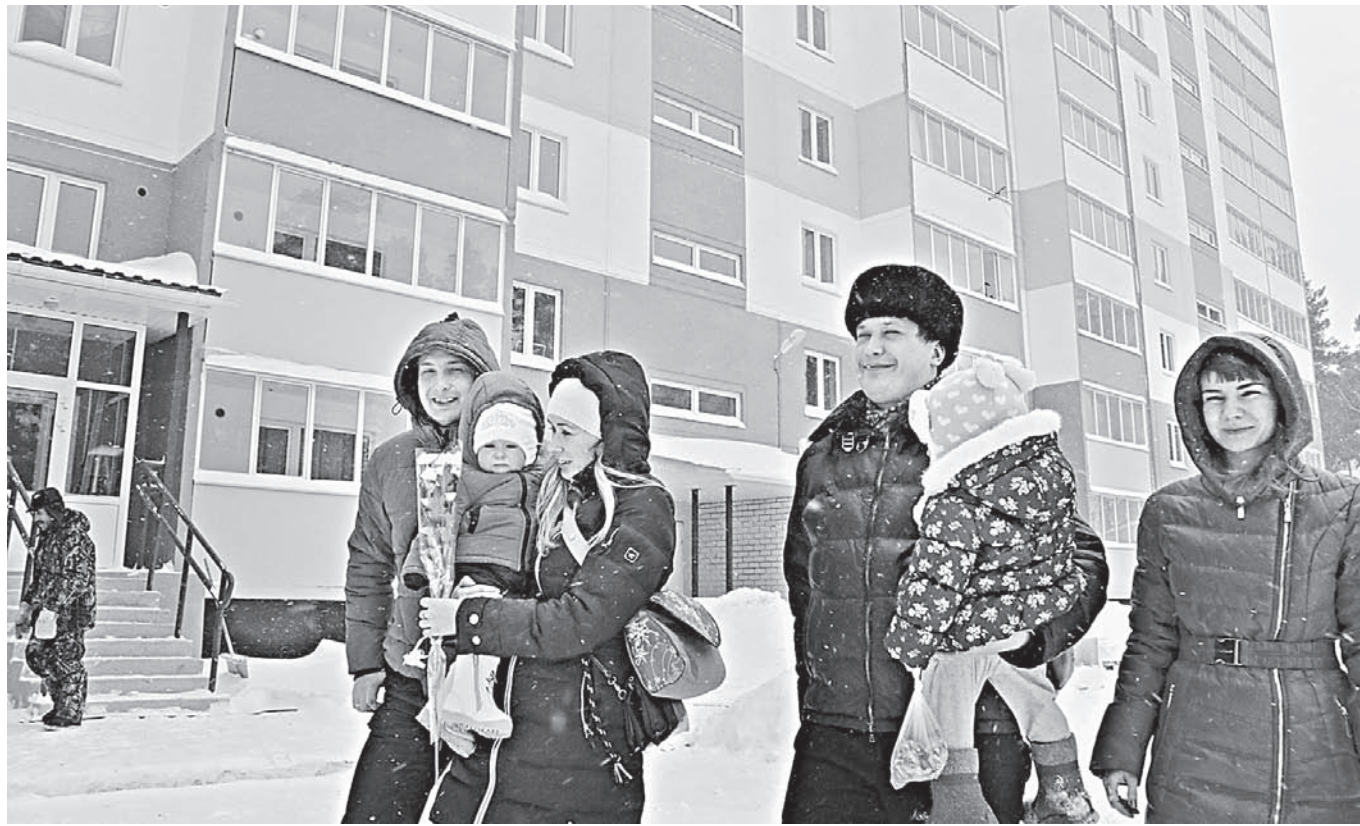
Медики пришли взглянуть на дом, в котором вскоре поселятся.