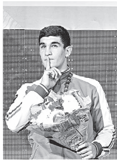
Рубцовчанин призывает зрителей не свистеть.

Тем не менее воспитанник СДЮШОР «Алтайский ринг» не поддался на хитрые уловки соперника. Он смотрелся сильнее и решительнее в первом раунде и даже отправил соперника на настил ринга. Второй раунд прошёл в обоюдных атаках, а в третьем вновь чуть точнее дей