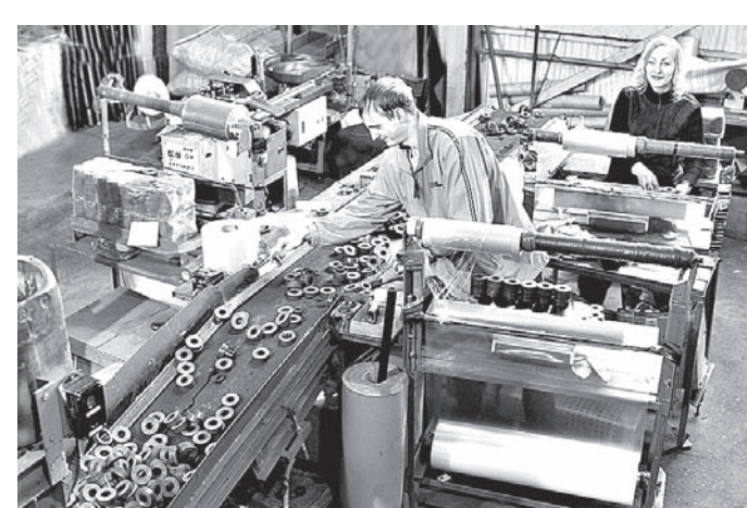
«Полимерпласт» активно пользуется государственной поддержкой.

Вначале фонд выделяет половину выигранных средств, к ним участник должен при-