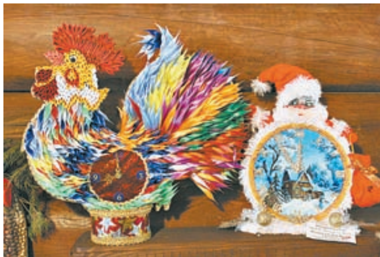
Часы-петушок не бьют, а кукарекают.

лее 50 часов. Проект поддержали школы искусств, районные Дома творчества.