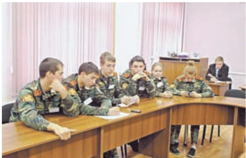
Бийские кадеты успешно постигают азы финансовой грамотности.

В 2017 году ученики одной трети школ края, всех средних специальных учреждений и центров социальной помощи семье и детям начнут изучать основы финансовой грамотности.