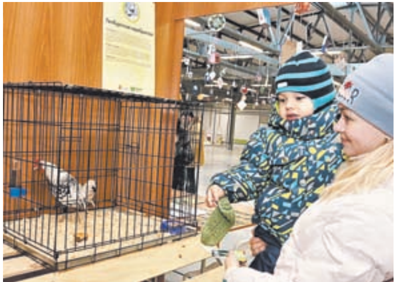
Выставка продлится почти два месяца. Посетить ее могут дети и взрослые.