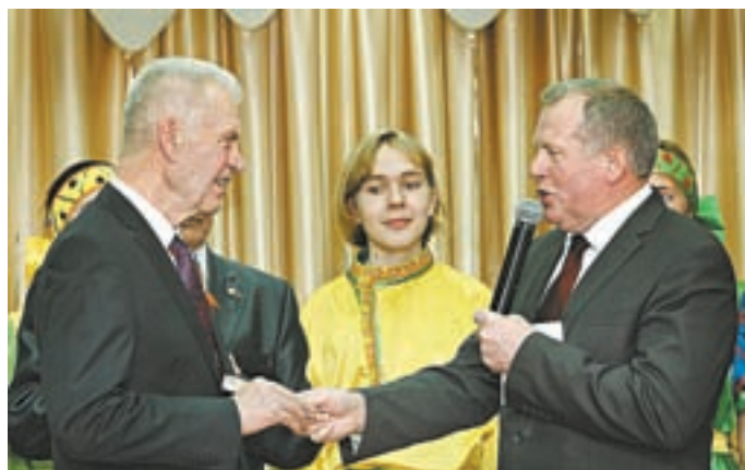
Депутат Государственной думы Иван Лоор вручил юбиляру памятный адрес.