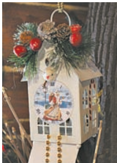
Домик показывает время.