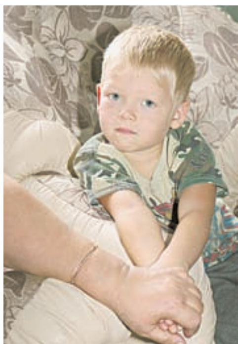
«Я – мамин».

Врачи и педагоги честно предупреждают об этом потенциальных опекунов.