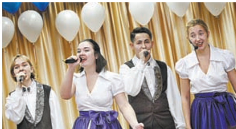
С музыкальным подарком выступил ансамбль «Лорелей».