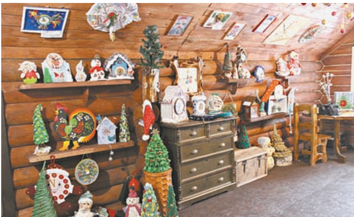
Алтайская резиденция Деда Мороза стала похожа на музей часов.