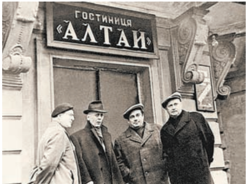
1962 год. Иван Пырьев (второй слева) – на фестивале киноискусства в Барнауле.