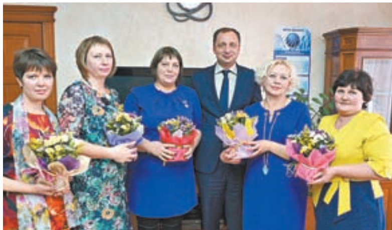
Гости уехали домой с цветами и подарками.