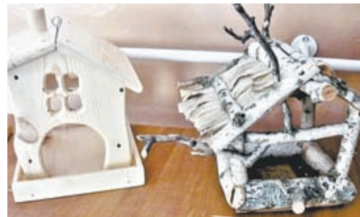
Эти кормушки смастерили дети.

мушки переехали на пришкольный участок и во дворы домов. Птичьи столовые дети