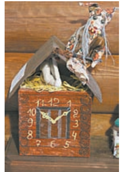
Вместо кукушки – Баба-яга.

– Вообще-то, я каратист, с пяти лет хожу в бойцовскую секцию и никогда ничего не клеил и не лепил. Но в школе нам учительница рассказала, что Дедушка Мороз хочет, чтобы дети сделали ему часы, и я решил его за-