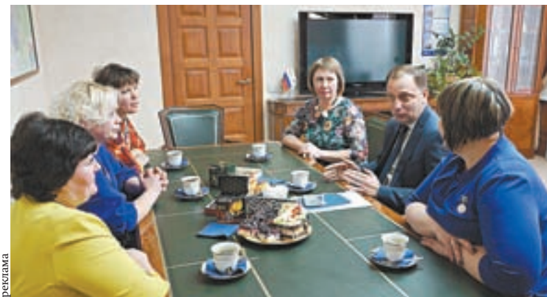
Нечасто можно посидеть за чашкой чая с директором.