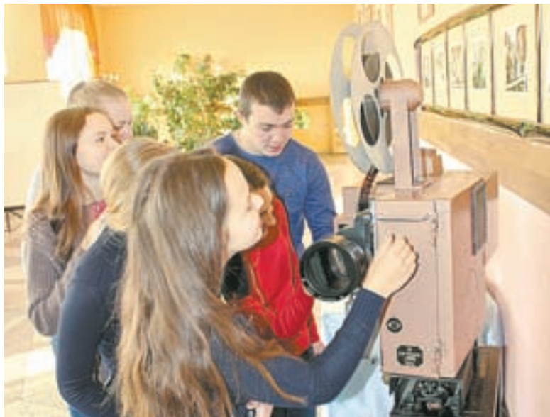
На выставке киноиндустрии советского периода.

17–18 ноября в Камне-на-Оби, на родине известного советского кинорежиссера Ивана Пырьева, прошли юбилейные торжества, посвященные 115-й годовщине со дня рождения знаменитого земляка.