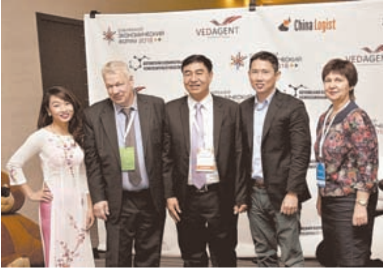
Вьетнамская делегация и российские партнеры.

В новосибирском «Экспоцентре» вот уже в третий раз прошел Сибирский экономический форум «Россия и Большая Азия». Его информационным партнером выступила газета «Алтайская правда», стратегическим – компания VEDAGENT, член Алтайской торгово-промышленной палаты.