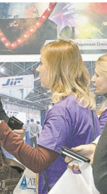
Информационный партнер СЭФ.