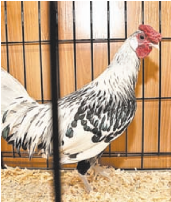
Петух гамбургский серебристый.