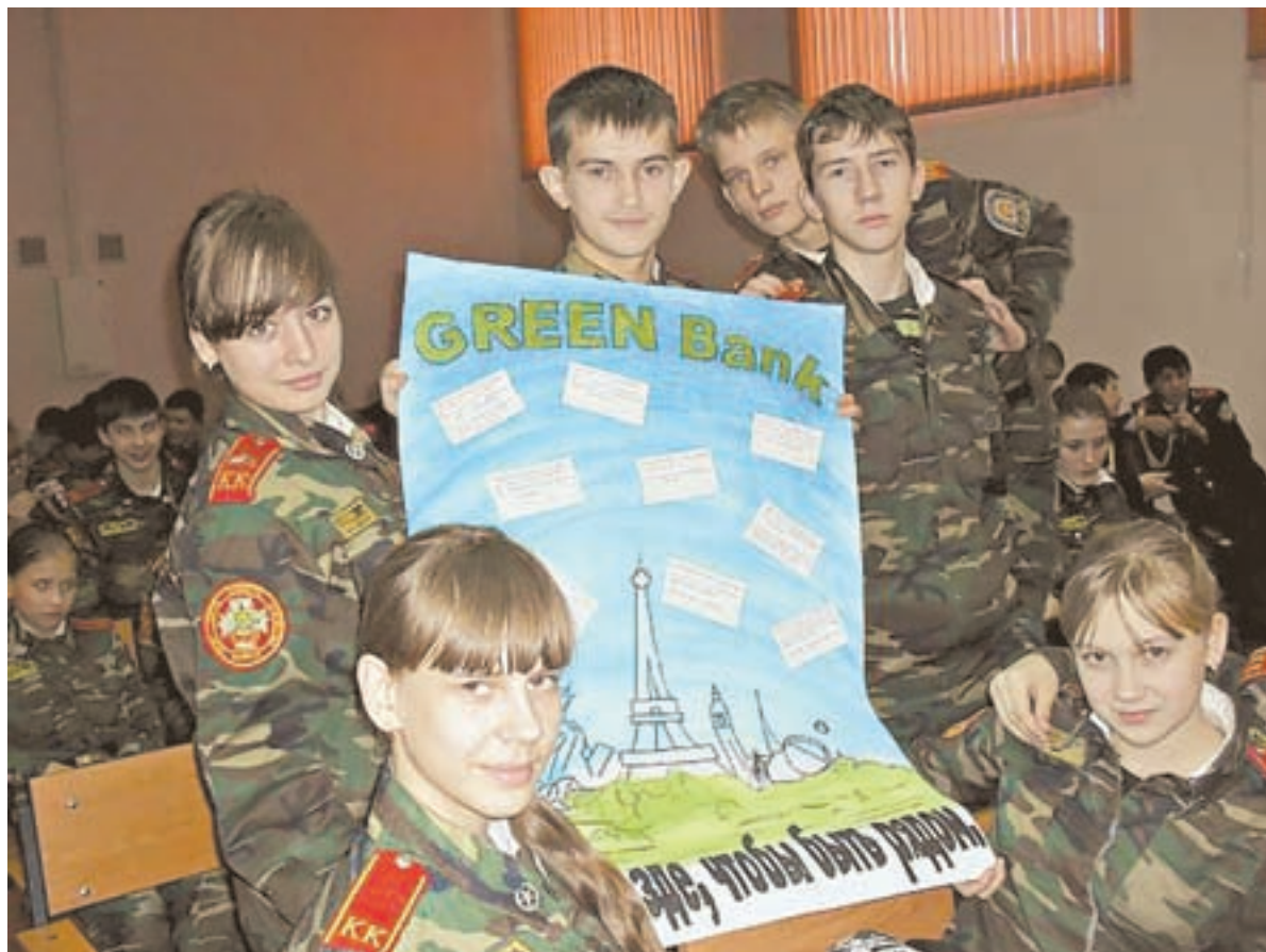
Предприниматели отмечают высокий уровень знаний кадетов.

– В прошлом году обучение финансовой грамотности в нашей школе прошли шестые, девятые и десятые классы. Мы старались преподавать предмет нетрадиционно, в форме деловых игр. Привлекали в жюри предпринимательское сообщество, банкиров, экономистов. Их поразил уровень подготовки детей. Старшеклассники подрабатывают на каникулах, поэтому знакомы с