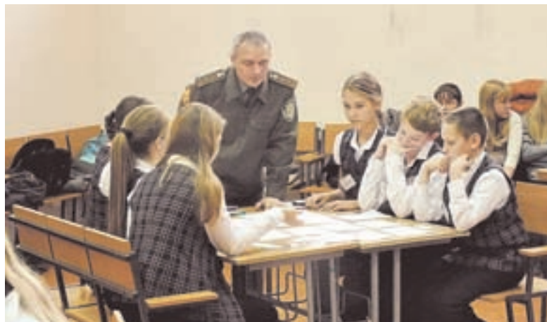
Фрагмент деловой игры в Кадетской школе.

условиями устройства на работу, договорными отношениями, финансовой стороной вопроса и т. п. Неплохо осведомлены в финансовых вопросах и шестиклассники. У нас была игра «Финансы, здоровье и безопасность». Там предлагалось обсудить несколько видов заработка, среди них были и криминального характера. Когда дети 10 лет безошибочно выделили законные способы заработка от незаконных да еще хорошо разыграли социальные роли в сценках на эту тему, предприниматели сказали, что в их возрасте они мяч по двору гоняли, а о финансовой грамотности слыхом не слыхивали.