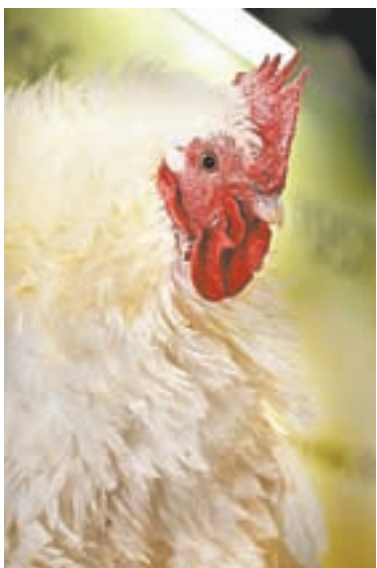
Японская пуховая порода кур.

– Сюрпризы к следующему волшебному зимнему празднику по традиции готовлю заранее. Во время январских каникул в честь года