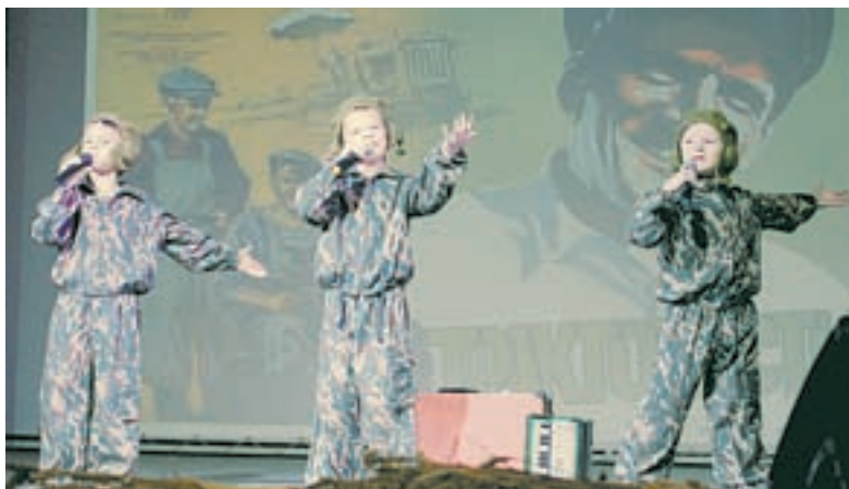
Ансамбль «Курносики» исполняет песню «Три танкиста» из фильма «Трактористы».

Каменинцы не забывают своего земляка. И хотя дом, где родился и жил в детстве Иван Пырьев, сохранить не удалось, в Камне много памятных знаков в его честь. В 2001 году, когда на столетие режиссера в Камень приезжала послед-