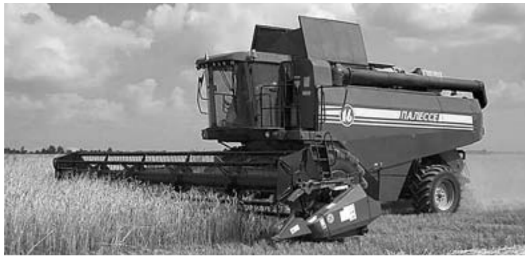
Комбайны «Палессе» хорошо себя зарекомендовали в крае.