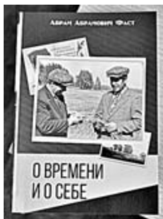
Одна из последних книг краеведа.