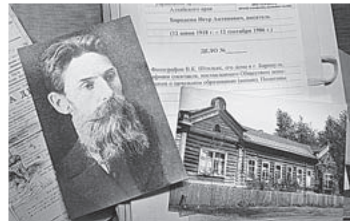
Фото и документы из музея.