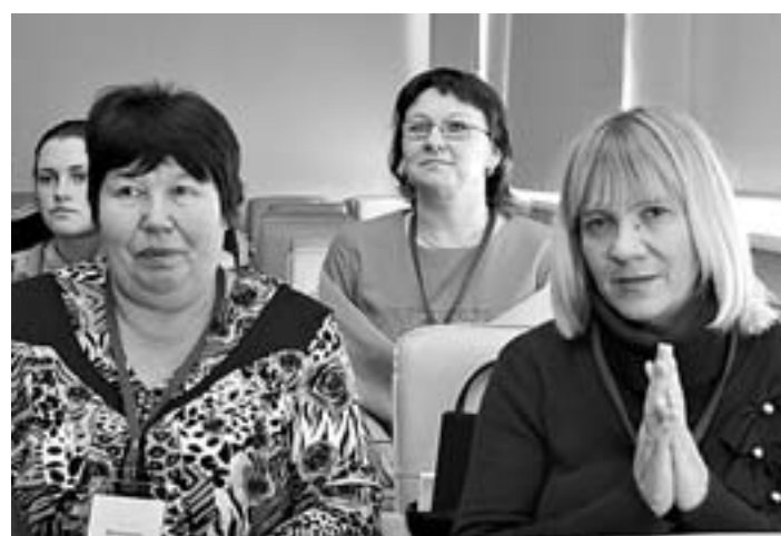
Конкурс создан для обмена опытом.

успели многое друг другу подсказать. И кое-что мне хочется внедрить в свою работу».