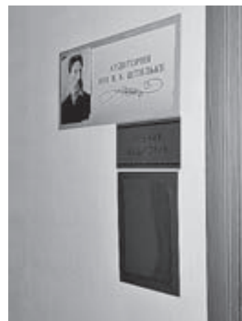
Аудитория имени Василия Штильке.

В Алтайском краевом институте повышения квалификации работников образования открылась аудитория имени Василия Штильке и презентация пособия «Культура Алтая».