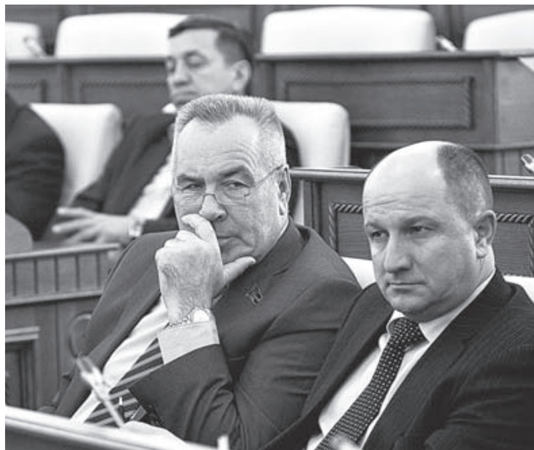
Депутаты внимательно слушали доклад.

предложила выстроить бюджетный процесс так, чтобы увязать выделение средств на программы с конкретными измеримыми результатами их выполнения. Сегодня в большинстве случаев это увязка не обеспечивается, а итоговая оценка эффективности реализации программных мероприятий за предыдущие периоды не оказывает влияния на будущие параметры