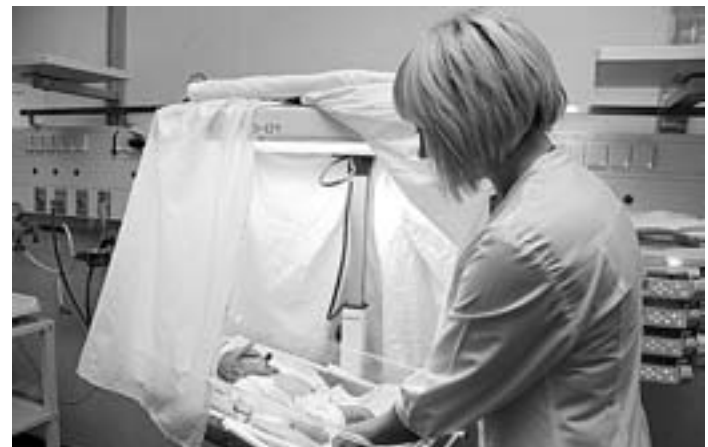
Алтайские специалисты показывают, как выхаживают младенцев у нас.

Алтайские и китайские специалисты в области родовспоможения обменялись опытом.