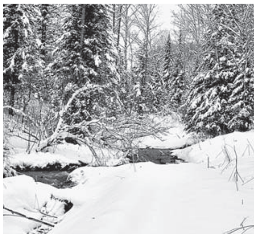
Сохраняем редкую красоту природы нашего края.

«Что показывают общественные слушания? Результаты разные. Мнение общественности в данных вопросах мы просто обязаны учитывать», – подчеркнул председатель Общественного совета, – и уже в соответствии с этим и выстраивать дальнейшую работу».