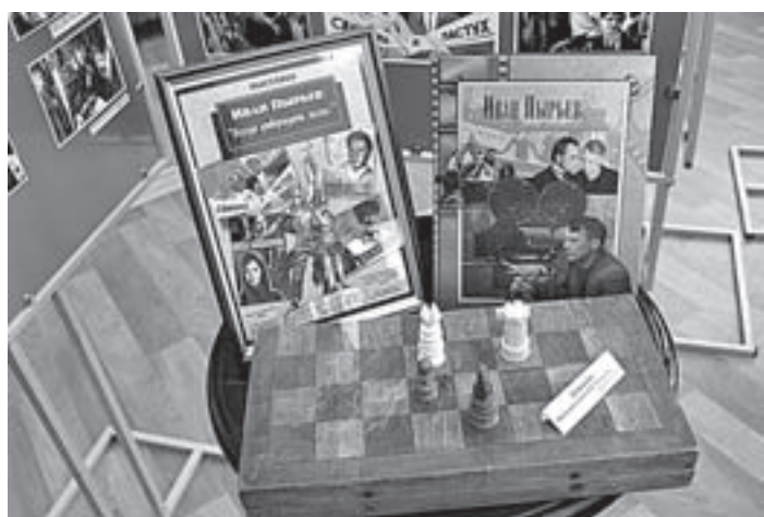
Шахматы Ивана Пырьева – экспонат ГМИЛИКА.

В этом году на Алтае широко отмечают 115-летие со дня рождения Ивана Александровича Пырьева. Будущий режиссер таких картин, как «Свинарка и пастух», «В 6 часов вечера после войны», «Братья Карамазовы» родился в селе Камень (сегодня – город Камень-на-Оби). Как актер он снялся только в небольшом короткометражном фильме «Дневник Глумова», зато сыграл огромную роль в становлении советского кинематографа. Пырьев был не только выдающимся режиссером и блестящим сценаристом, он – основатель и первый председатель Союза кинематографистов СССР. Иван Пырьев открыл в кино много звезд. Так, например, именно он привел на «Мосфильм» Владимира Зельдина, предложив ему главную мужскую роль в картине «Свинарка и пастух».