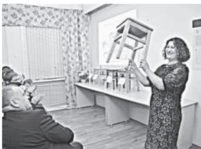
Кому «золотую» табуреточку? Начальная цена — 1000 рублей.

принес на аукцион табуретку, которая привлекла внимание всех без исключения посетителей. Расписанная зимними узорами, с птицами, она отличалась от всех прочих изделий. Говорит, что раньше стюардкой никогда не занимался, поэтому опыт был для него интересным. Он табурет изготовил, а коллега помогла с росписью.