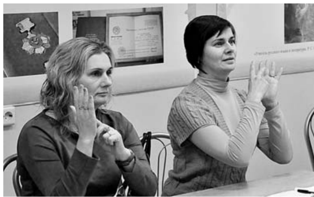
Освоить жестовый язык не просто.

За парты сели сразу 30 человек. Никто из них раньше с жестовым языком не сталкивался. Преподаватель – доцент кафедры социализации развития личности института