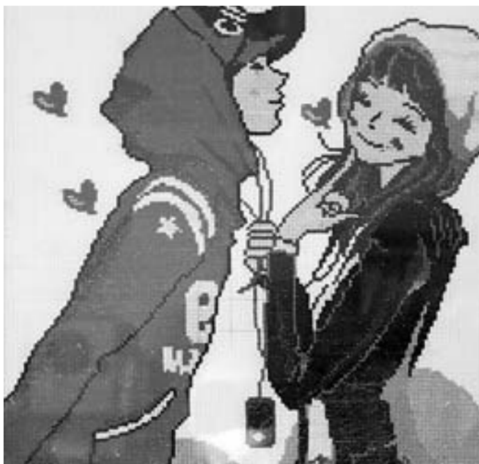
Иные вышивки заставляют улыбнуться.

– Посмотрите, какая кропотливая работа – икона Николы Чудотворца. – проводит для нас экскурсию по домашней