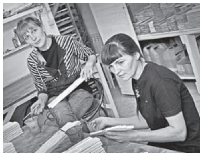
На покрасочном участке.

Недавно он открыл собственное дело – занимается изготовлением каминов все с той же гипсовой отделкой, своим камнем. Создает серьезную конкуренцию каминам китайского производства, которые сегодня превалируют на нашем рынке. Работы много, и времени на отдых остается мало. Любят они с женой вместе ходить в