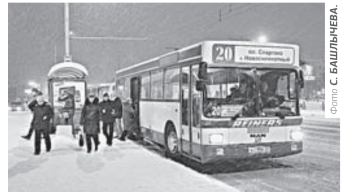
Вчера в Барнауле на линию по плану вышли все автобусы.

Как пояснили в городском комитете по дорожному хозяйству, благоустройству, транспорту и связи, в пятницу утром на линию по плану вышли все автобусы муниципальных маршрутов, трамваи и троллейбусы.