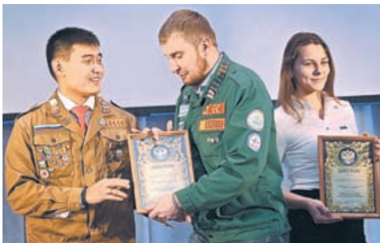
Во время награждения победителей конкурса студенческих отрядов вузов Минсельхоза России.