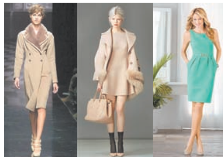
Пальто и элегантное платье.

Золотой петушок-гребешок. Шёлкова бородушка, хвост – все цвета радуги. Какого цвета перья? Смотрим: изумрудный, красный, алый... Можно догадаться, что выберет предстоящий год и порекомендует женщинам. Говорят, что все оттенки красного и есть главный мотив цвета года. Но мы – за натуральность.