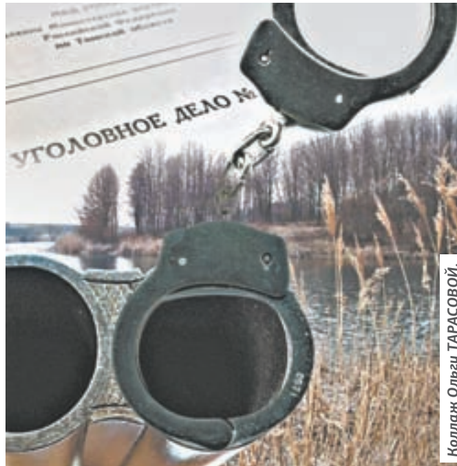
Коллаж Ольги ТАРАСОВОЙ.

Остановив свой автомобиль почти параллельно «Ниве», инспектор вышел. Его попутчик оставался внутри. В это время Кирилловский молча повернулся и внезапно выстрелил из обреза. Дробь попала в плечо и шею инспектора, и он упал. Кирилловский попытался перезарядить оружие, что-