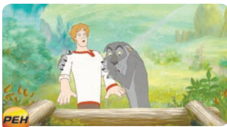
18.30 М.ф. «ИВАН ЦАРЕВИЧ И СЕРЫЙ ВОЛК» (0+)

07.00 М.ф. «Том и Джерри. Мотор!» (12+) 09.00 Дом-2. Live» (16+) 10.00 Дом-2. Остров любви (16+)