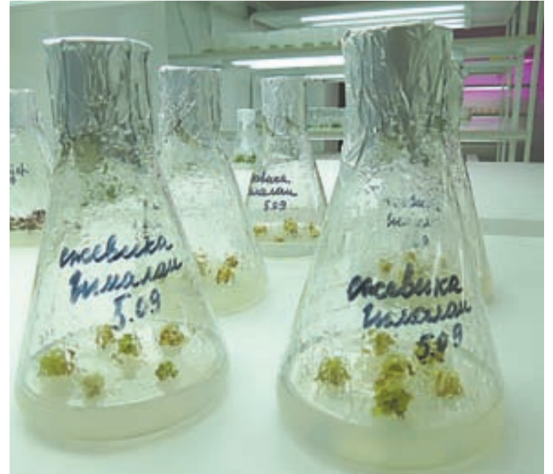
«Ежевика 2.0»: «детки» растут.

Это еще не успех, а только первый шаг к нему. Дело это не быстрое. Нужно будет соблюсти ряд жестких требований. Мини-клубни надо будет высадить на специальном полевом участке, где никогда не было картофеля и который удален от ближайших посадок картофеля на 2 – 3 км. Не говоря уже о жестком соблюдении технологий и