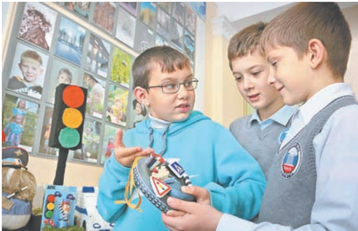
Обучение школьников края безопасному поведению на дорогах – одно из приоритетных направлений.

В 1978 году пионеры встречались с космонавтом Германом Титовым (фотографии представлены на выставке), в 1980-м – с артистом Евгением Леоновым. В этом же здании когда-то прошел единственный концерт Высоцкого, хотя формально речь идет все-таки о бывшей сцене ТЮЗа. Наконец, здешний клуб интернациональной дружбы