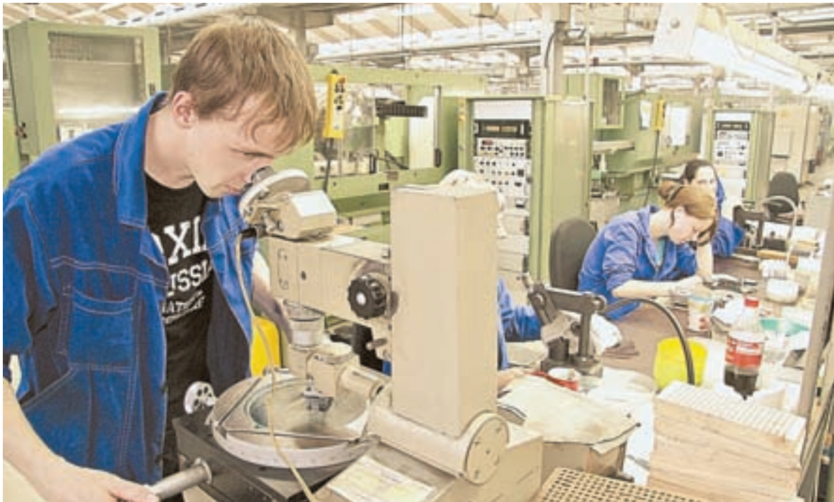
АЗПИ. Сделано на Алтае – работает на весь мир.

На экономическом развитии Алтайской губернии в конце 1920-х годов сказало окончание строительства Туркестано-Сибирской железной дороги. Для переработки среднеазиатского хлопка был сооружен Барнаульский меланжевый комбинат – первое крупное текстильное предприятие Сибири.