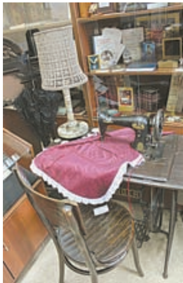
Хорошей хозяйке не обойтись без фартука.