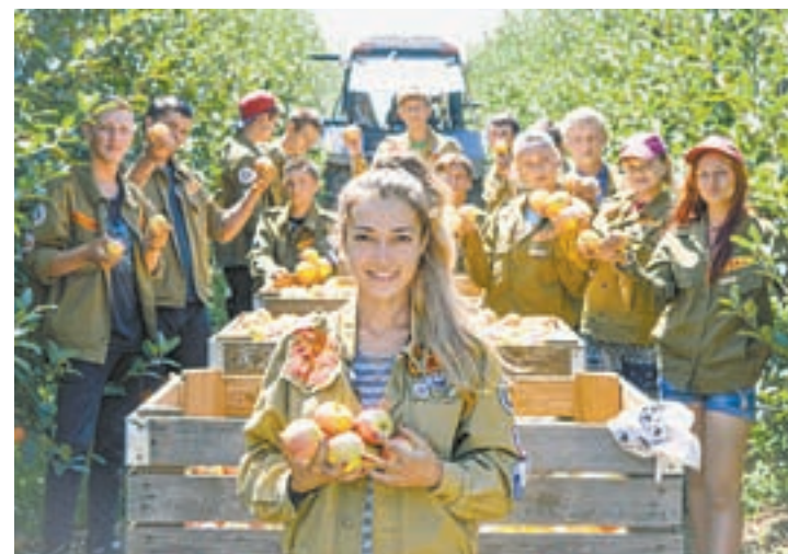
Отряд АГАУ «22 регион» летом трудился в Крыму.

На сто процентов выложились этим летом представители стройотряда «Витязь» из технического вуза. Они трудились на Всероссийской студенческой стройке «Поморье». В свободное время демонстрировали способности из других областей. Так, на фестивале СО, проходившем на озере в селе Дениславье, «Витязь» взял несколько призовых мест, в том числе в соревнованиях