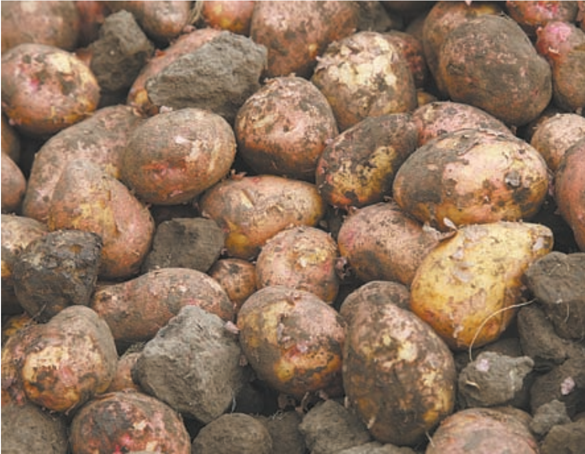
Пока мы покупаем кота в мешке и не знаем, сгниёт картофель в погребе или доживет до весны.

Алтайские ученые применяют инновационные технологии для улучшения урожайности и свойств сельхозкультур и растений.