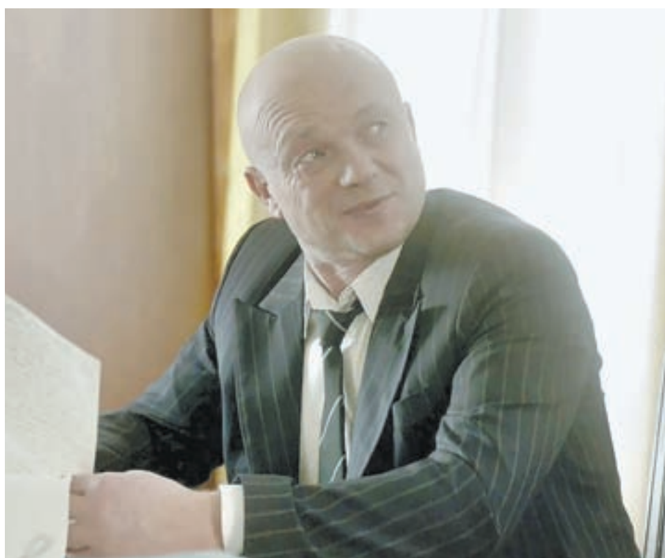
Майор Черкасов из МУРа – ампула Андрея Смолякова.

Сюжет, конечно, вымышленный. Википедия пишет, что не было такого в