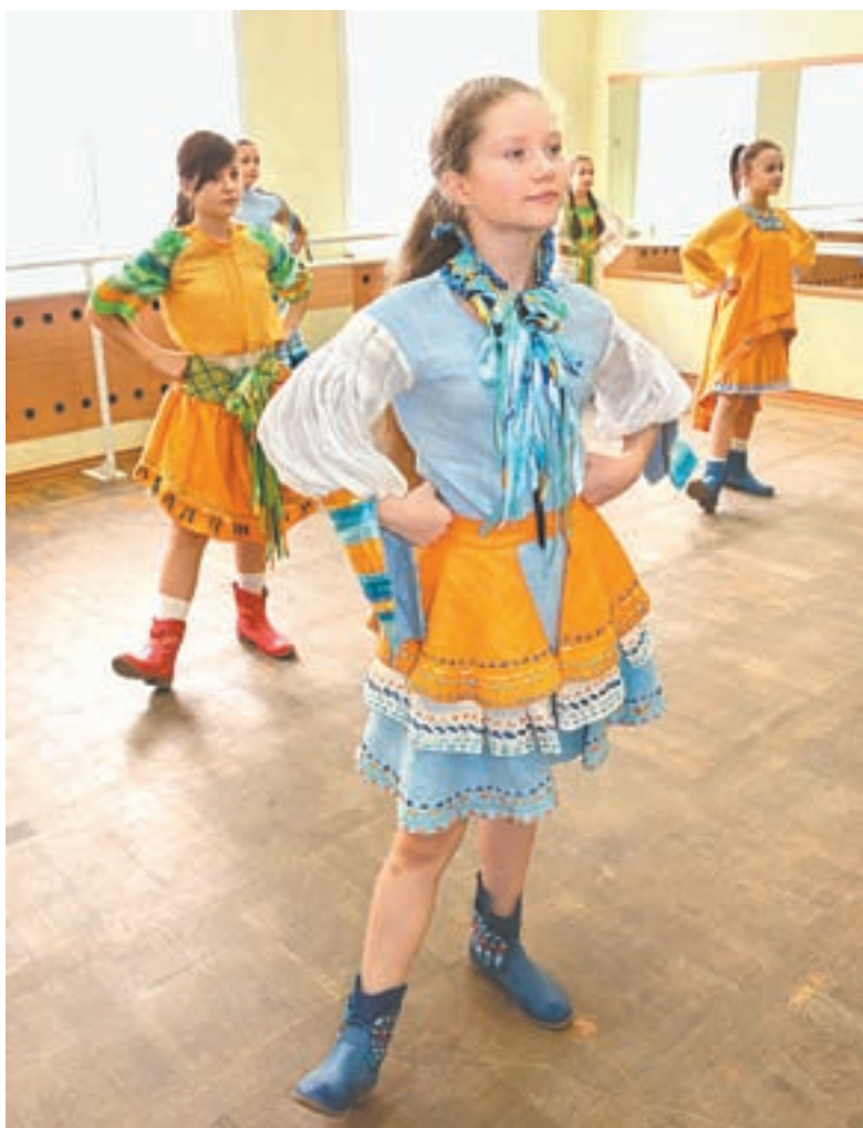
На национальном конкурсе «Золотая игла» эта коллекция школы моды «Светлана» заняла призовое место.

состоял в переписке с Индирай Ганди – и в АКДТДиМ хранят ее ответное письмо алтайским пионерам.