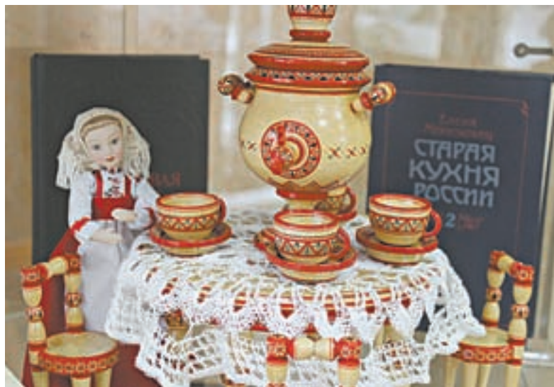
На выставке царит особая атмосфера уюта.

ее для экспозиции. Издание очень интересное, в XIX веке эта книга стала настоящим кулинарным бестселлером, ее переиздавали 28 раз! Под скромной обложкой более 1500 уникальных рецептов русской кухни. От самых простых до изысканных. Автор не только делится секретами приготовления блюд, но и дает дельные советы, как обустроить кухню, встречать гостей, здесь можно найти даже прообразы рекламы – на страницах показаны новые для того времени виды кухонной посуды и рассказано, как ею пользоваться. Книга дает возможность окунуться в эпоху XVIII – XIX веков, узнать быт и предпочтения дворянских сословий. Вот, например, интересный факт. Все мы знаем десерт «ромовая баба» – сладкая булочка в ромовом сиропе. Но оказывается, в дореволюционной России было много видов различных хлебных «баб». В книге Молоховец мы нашли их