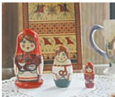
Даже матрешки здесь угощают чаем.

В Барнауле в музее редкой книги, что расположен в библиотеке им. Ядринцева, открылась очень «вкусная» выставка – «Кулинарные истории».