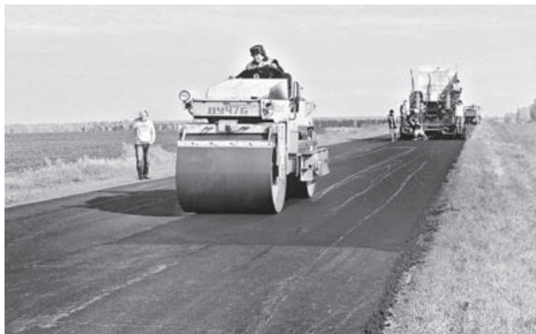
На пятикилометровом участке работают порядка 30 дорожников и 20 единиц техники.

14 улиц. Самые большие объемы – на улицах Колесникова и Крылова. В городе работать сложнее – коммуникации ве-