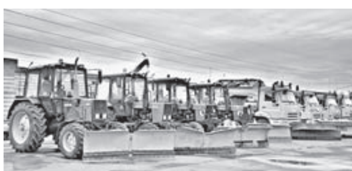
Часть парка снегоочистительной техники в Первомайском районе.

– Соль привозят в основном из Бурлы, а песок местный, с Оби. В целом на песчано-соляную смесь и другие противогололедные материалы в год тратится более 50 миллионов рублей. Готовят смесь из расчета 1 часть соли к 5 частям песка. В современных пескоструйных машинах имеются специальные баки, в которых находится рассол (вода с песком) для полива смеси. Это повышает эффективность борьбы с гололедом, активизирует работу смеси: лед начинает плавиться через минуту.