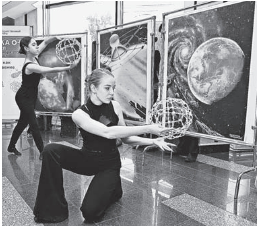
В фойе концертного зала «Сибирь».

37 площадок, 600 мероприятий, тысячи участников. В Алтайском крае с размахом прошёл Фестиваль науки-2016.