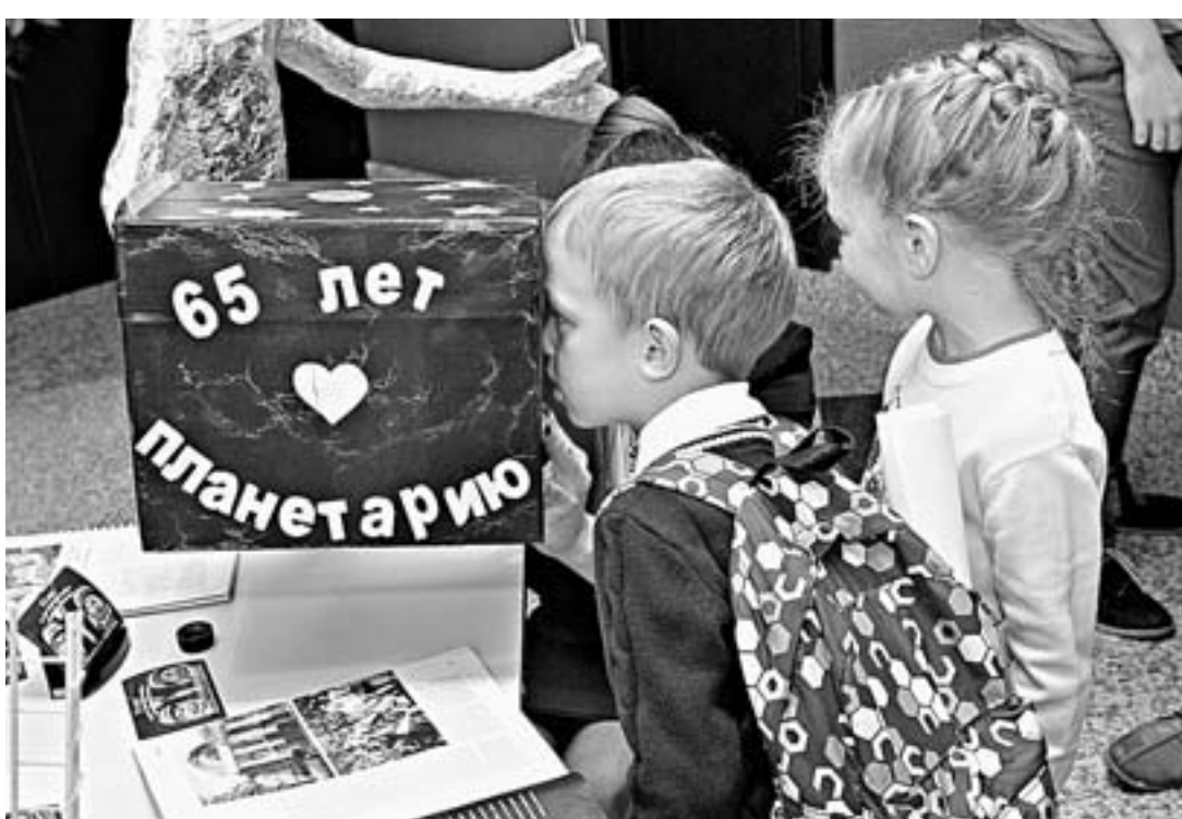
«Интересно, что там?»

– В нашей лаборатории представлен ряд артефактов. Например, фоссилии – различные отпечатки ископаемых