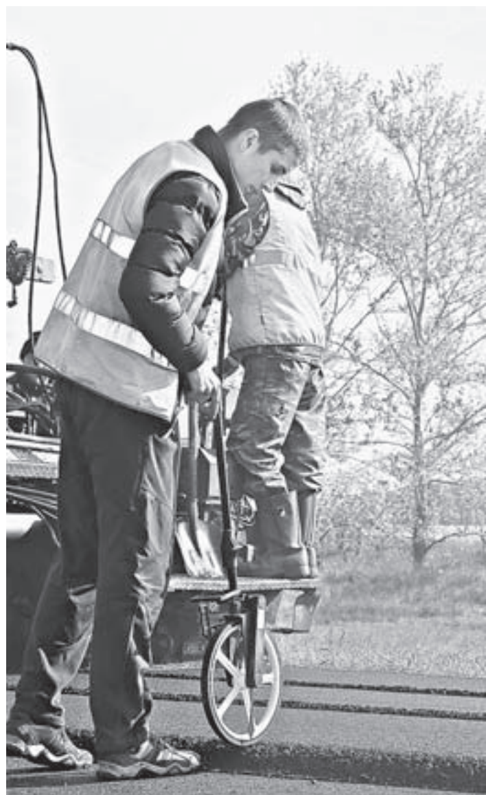
Рабочие контролируют соблюдение нормативов ширины проезжей части обновленной дороги.

В этом году подразделениями «Алтайавтодора» в планах дорожных работ ведется ремонт пяти локальных участков автомобильной трассы Романово – Завьялово – Баево – Камень-на-Оби. Работы рассчитаны на два года. Всего будет отремонтировано 19 километров. В текущем сезоне Центральное ДСУ силами трех своих филиалов отремонтирует 5 км этой дороги в Каменском районе.