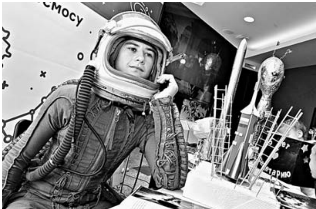
Детей и взрослых приветствует космонавт из Алтайской школы-интерната с первоначальной летной подготовкой.

Екатерина ЗЕЛЕНОВА, Андрей КАСПРИШИН (фото)