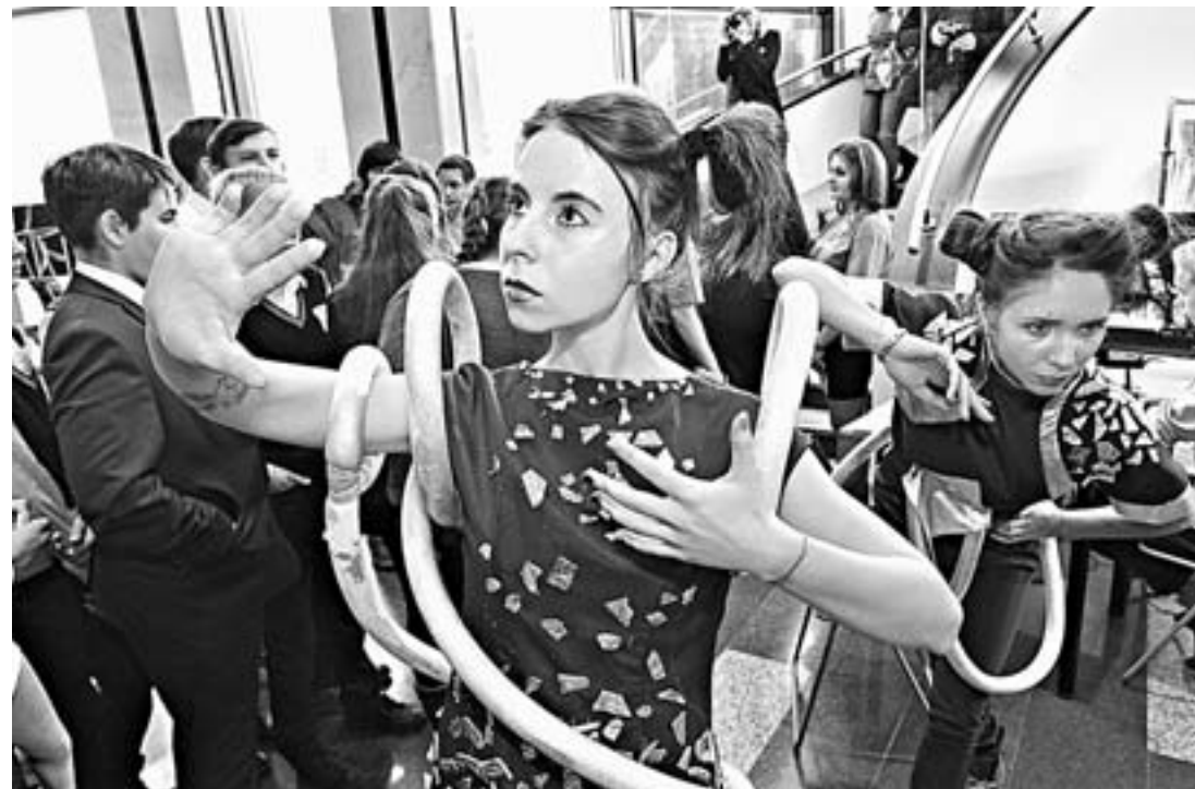
Живые космические фигуры украсили Фестиваль науки на Алтае.