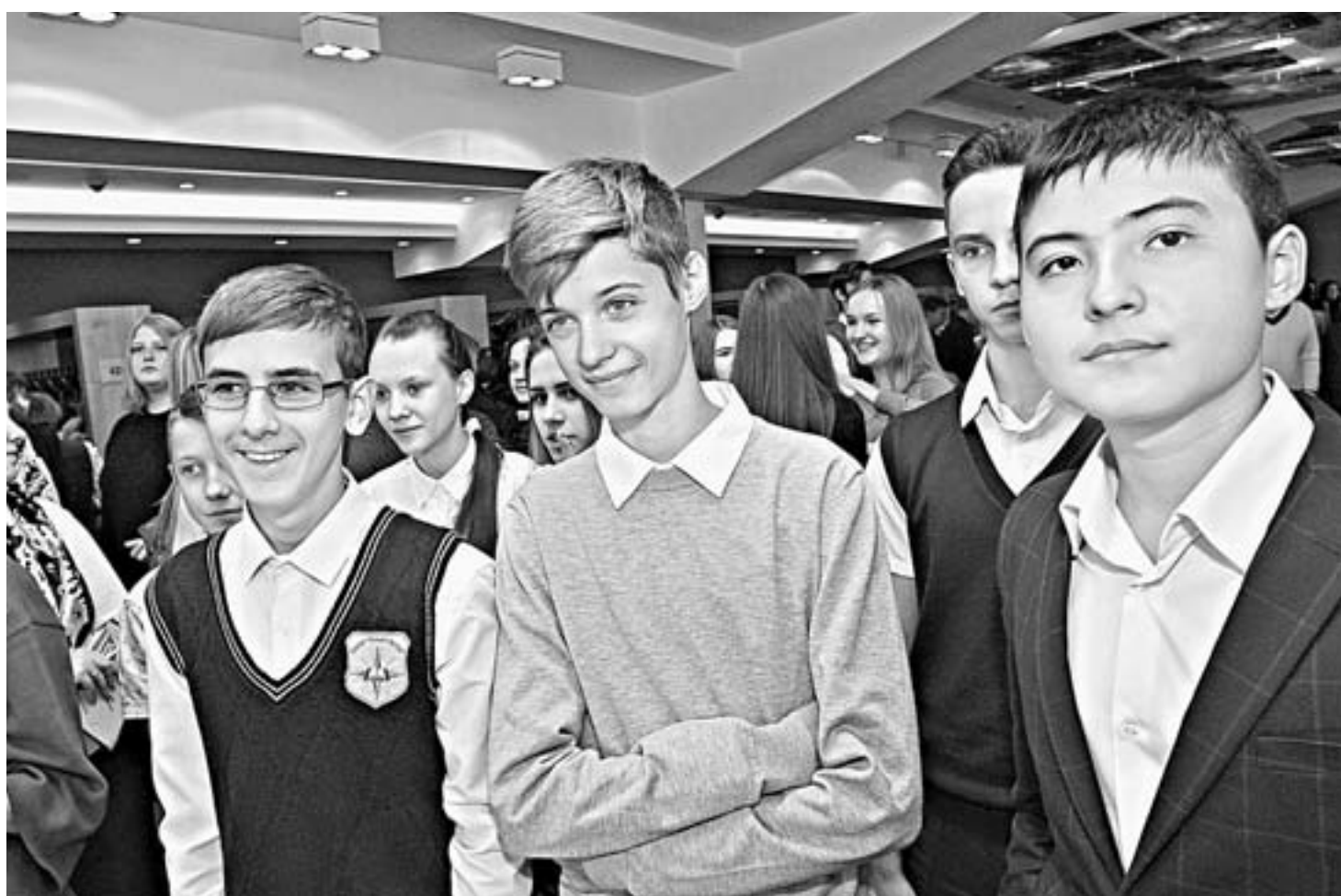
Школьники – главные участники научного праздника.

На протяжении дня в фойе концертного зала действовали различные интерактивные