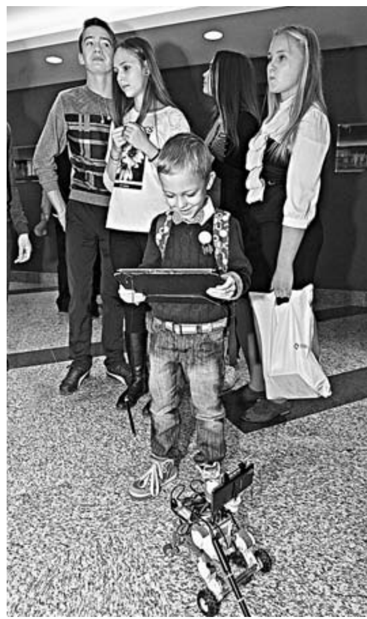
Младшеклассники с удовольствием изучали, как работают современные роботы.

– Быть хорошим оратором – это не только талант. Важно работать над собой каждый день. В старших классах знания, касающиеся речевой манипуляции, просто не-