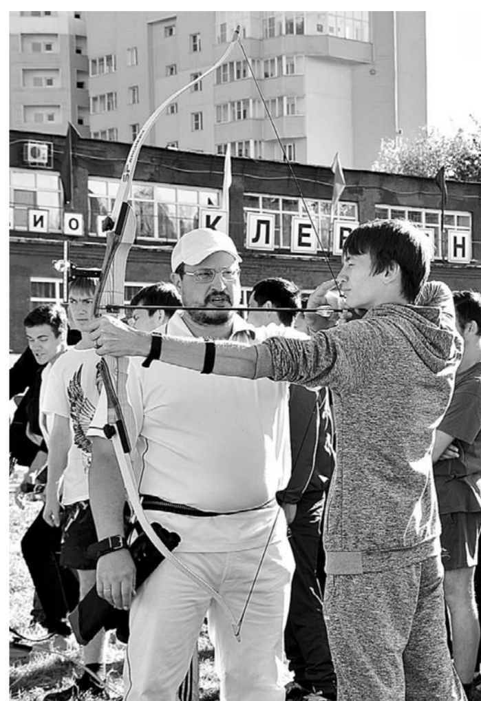
Мастер-класс по стрельбе из лука.

товки спортивного резерва и развития студенческого спорта управления спорта и молодежной политики