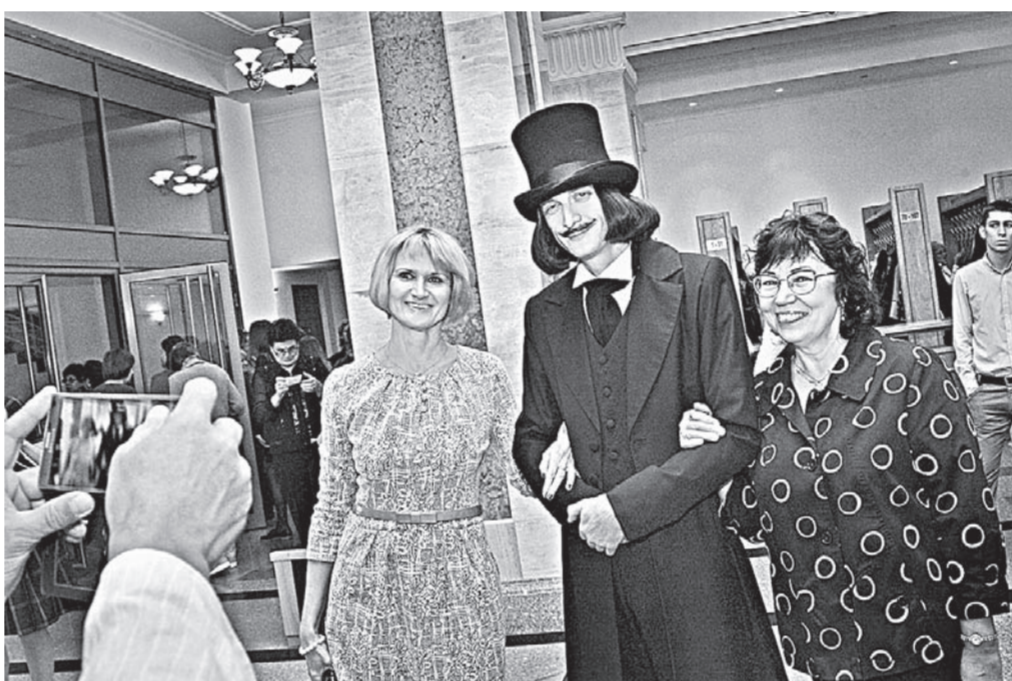
Гоголь сам стал героем спектакля «Ревизор» Новосибирского городского драмтеатра, а еще встречал публику в фойе.