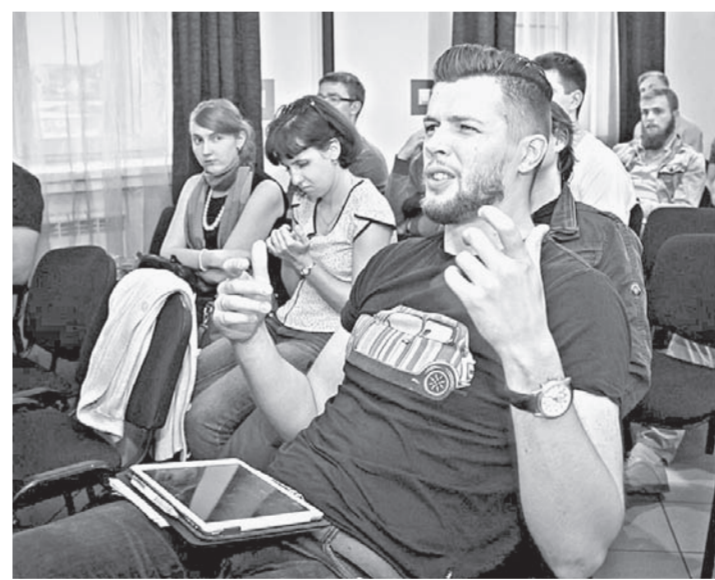
Идет обсуждение проектов на стартап-вечеринке.

В АПИ не только говорят, но и уже делают: сформирована исполнительная дирекция ассоциации, подготовлен план мероприятий на год. Пара из них уже прошла. Так, 14 – 15 мая в Барнауле непрерывно в течение 48 часов 46 программистов, дизайнеров и менеджеров создавали ИТ-проекты при поддержке экспертов в сфере ИТ и бизнеса. 14 сентября состоялся стартап-вечеринка, на которой начинающие предприниматели представляли свои проекты на суд руководителей ИТ-компаний.