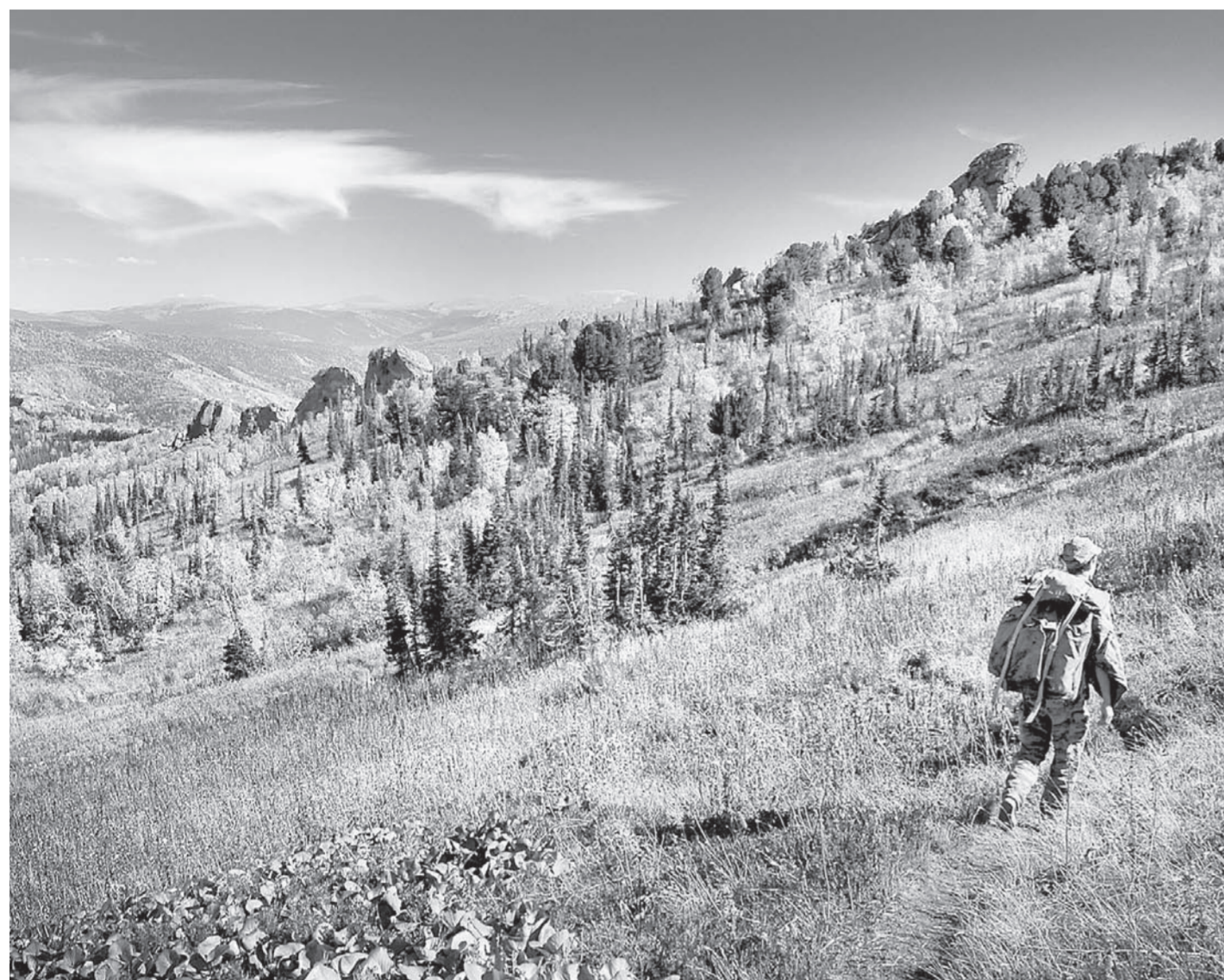
Алтайский край – мекка для тех, кто любит природные красоты.