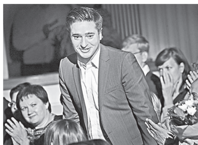
Известный актер Иван Стебунов вошел в состав фестивального жюри.

Открывшийся аншлагом II Всероссийский молодежный театральный фестиваль им. В.С. Золотухина и проходит при полных залах. Он собрал участников из Москвы, Архангельска, Кемерово, Тюмени, Магнитогорска, Бийска, Алеймовска и Новосибирска.