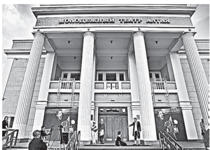
Гостей Всероссийского театрального форума встречали на крыльце МТА.