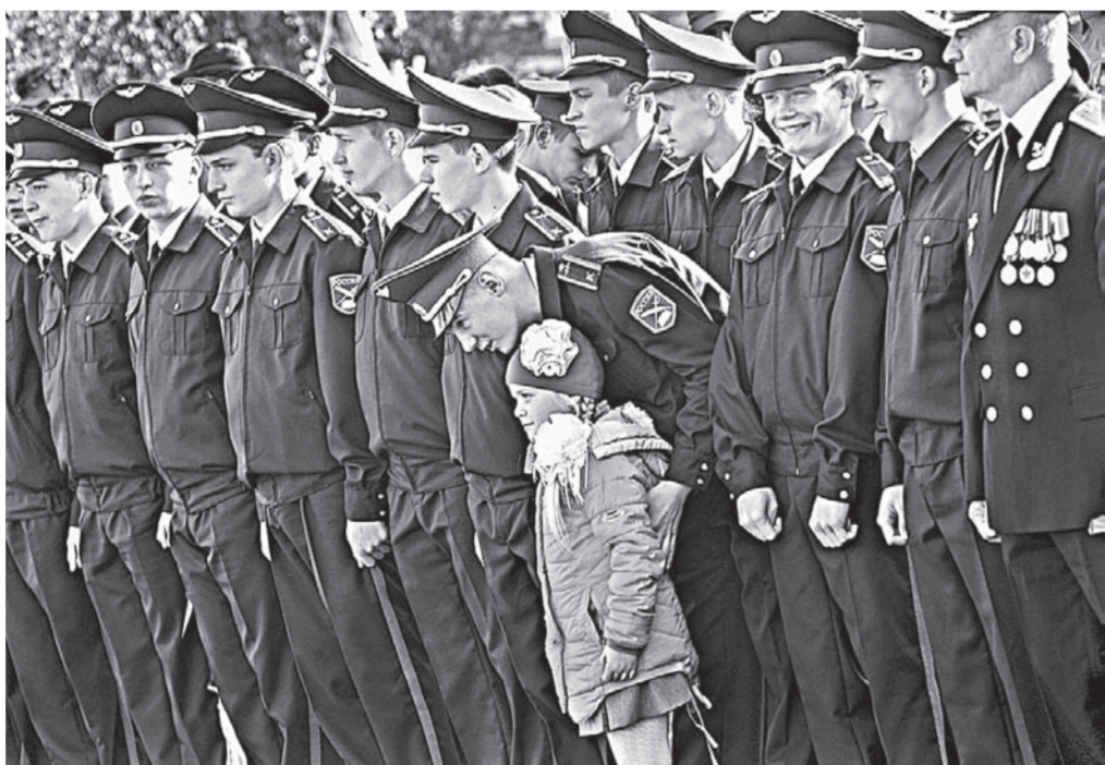
Первокурсников пришли поддержать родные.