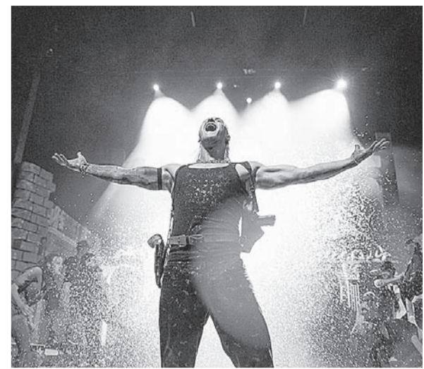
«Ромео &amp; Джульетта» (Тюменский драматический театр).

Завтра открывается II Всероссийский молодежный театральный фестиваль им. В.С. Золотухина. Спектакли можно будет увидеть на сцене Молодежного театра Алтай, а также краевого театра драмы им. В.М. Шукшина и театра музыкальной комедии.