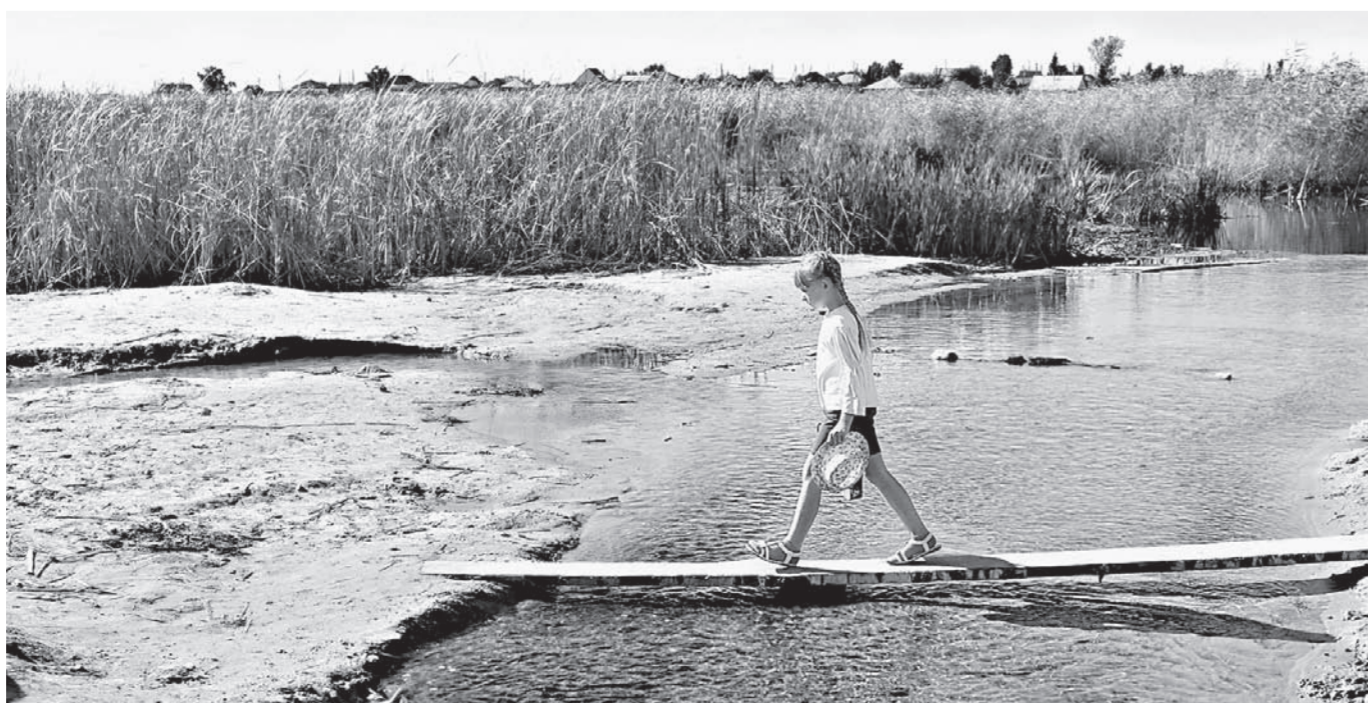
Пока по досточке, потом – по мостовому тротуару.

До конца 2016 года дорожники Алтайского края закончат работы на 616 км автомобильных дорог и 14 мостах, общая протяженность которых составляет 727 погонных метров. В 2017 году усиления наших дорожников также будут направлены на реконструкцию, ремонт и капитальный ремонт важных дорог края. В целом за год планируется отремонтировать 429 километров дорог и девять мостов.