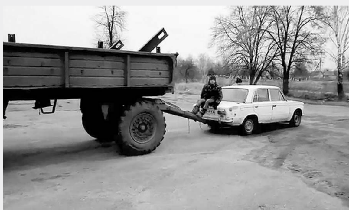
За такой прицеп, видимо, придется заплатить штраф.

Чтобы разобраться в этой теме, мы позвонили в краевую ГИБДД и выяснили, что 1 января 2015 года в России вступил в силу Технический регламент Таможенного союза «О безопасности колесных транспортных средств». В этом документе говорится, в частности, и о тягово-сцепных устройствах, прицепах, багажниках. Суть простая: в целях безопасности к автомобилю можно крепить только заводские фаркопы, прицепы, багажники, а все модели попадают под запрет, так как на них нет документов, они не проходят испытания. По правилам если водитель выезжает с таким