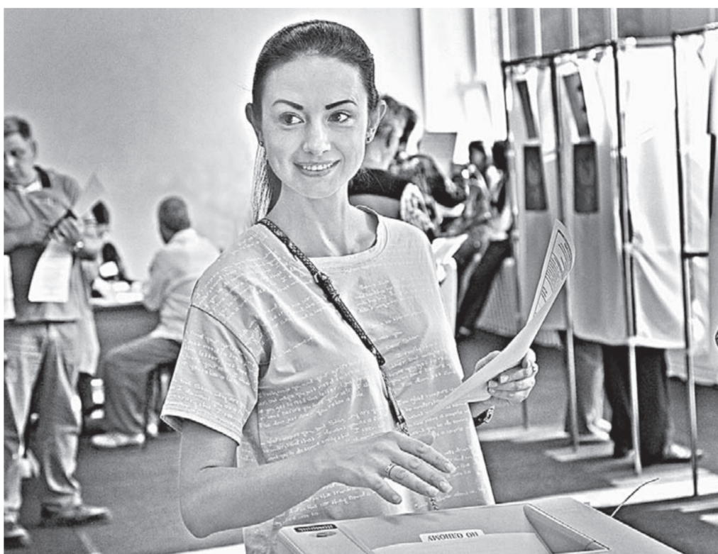
Вот такие красивые избиратели голосуют в Барнауле.