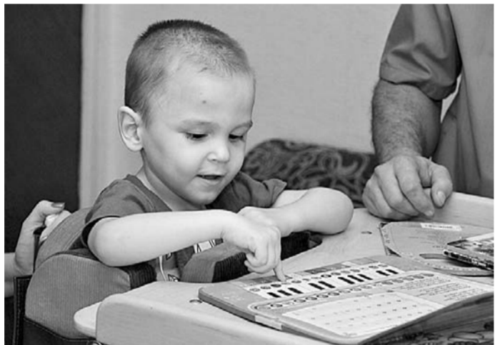
Кирыша уже освоил новый тренажер.

Барнаульская семья получила для малышей-близнецов тренажер для ортопедической коррекции.