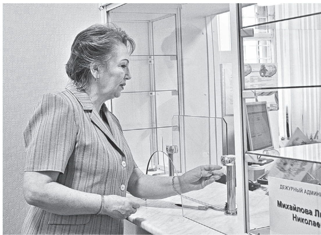
За получением льготных лекарств очереди в аптеке нет.

— Программа обеспечения необходимыми лекарствен-