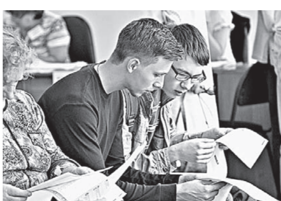
Нуда поставить галочку?