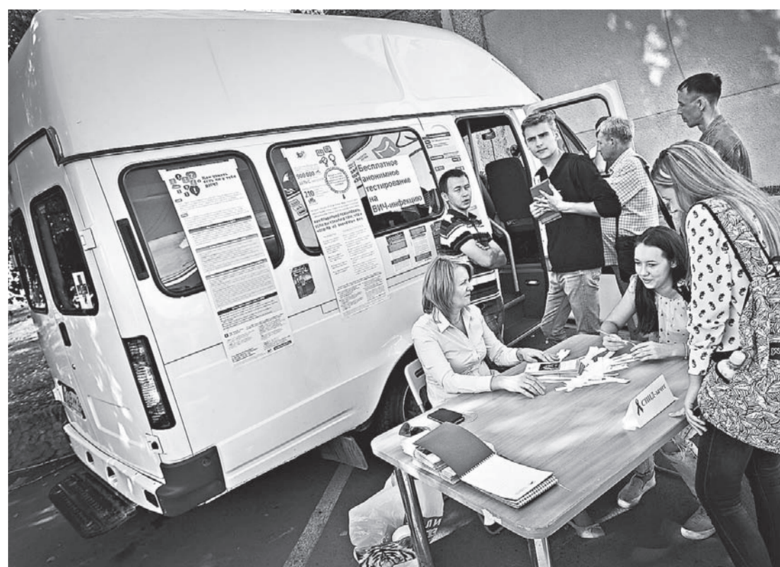
Желающие отвечали на вопросы медиков и получали сладкие призы.

Доктора краевого центра по профилактике и борьбе со СПИДом и инфекционными заболеваниями предлагали сдать зачет на знания о путях заражения ВИЧ-инфекцией, анонимно школьники и студенты сдавали тест на это заболевание. Очередь, кстати, выстроилась