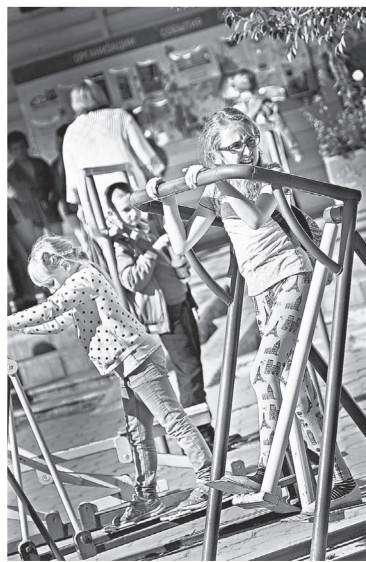
Уличные тренажеры пользуются популярностью у детей.