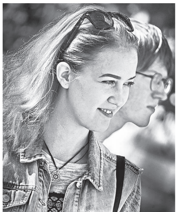
Участником фестиваля мог стать каждый барнаулец.

— Сегодня существует много сайтов, где людям рассказыва-