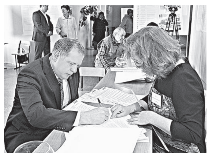
Спикер АКЗС Иван Лоор проголосовал одним из первых.