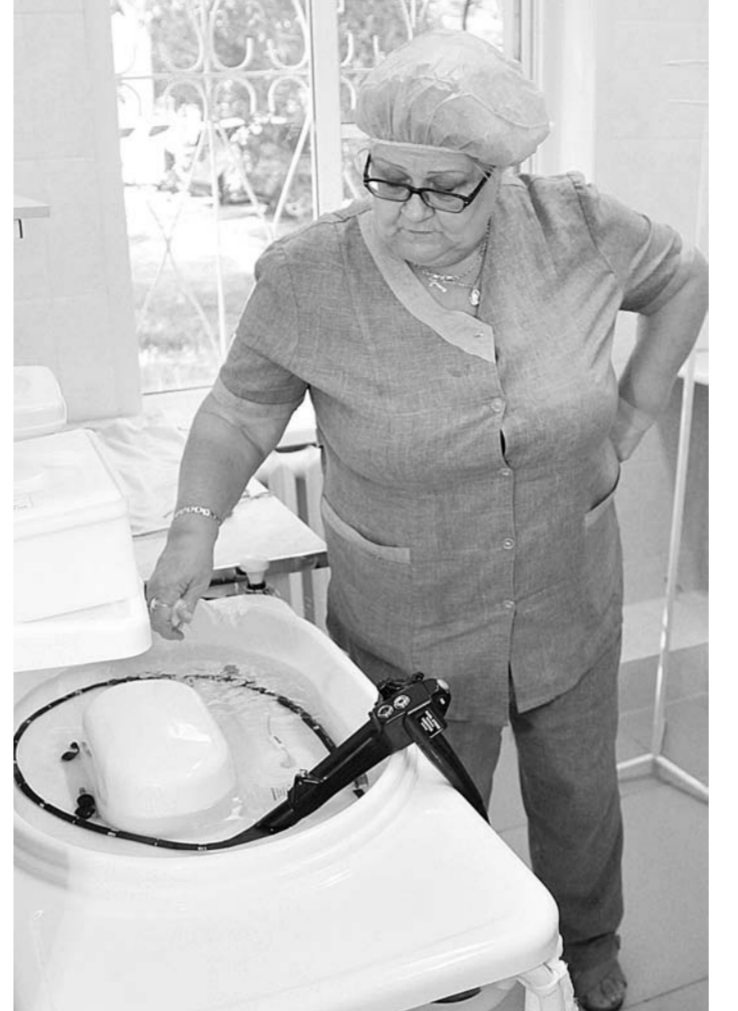
Оборудование идеально обрабатывается в специальной моечной.

В планах руководства больницы — развитие и оказание помощи не только своим пациентам.