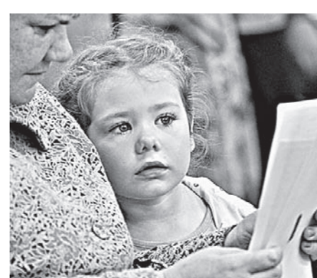
Многие пришли на выборы с детьми.