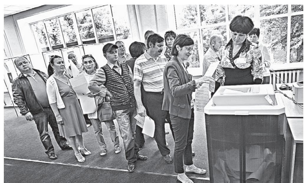
Более 400 тысяч избирателей края могли проголосовать с помощью комплексов обработки избирательных бюллетеней.