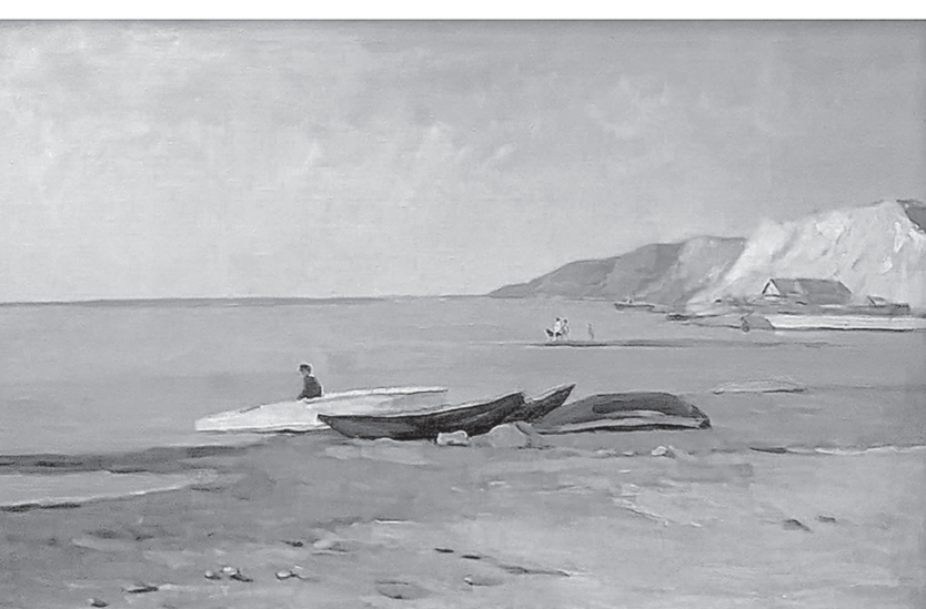
Валентин Курзин. «На Оби» (Павильон современного искусства «Открытое небо»).

Музей истории литературы, искусства и культуры Алтайа, ул. Л. Толстого, 2, тел. 24-47-61. До 30 сентября. «Вертикаль красоты. Классики алтайской живописи» — выставка из собрания музея (0+).