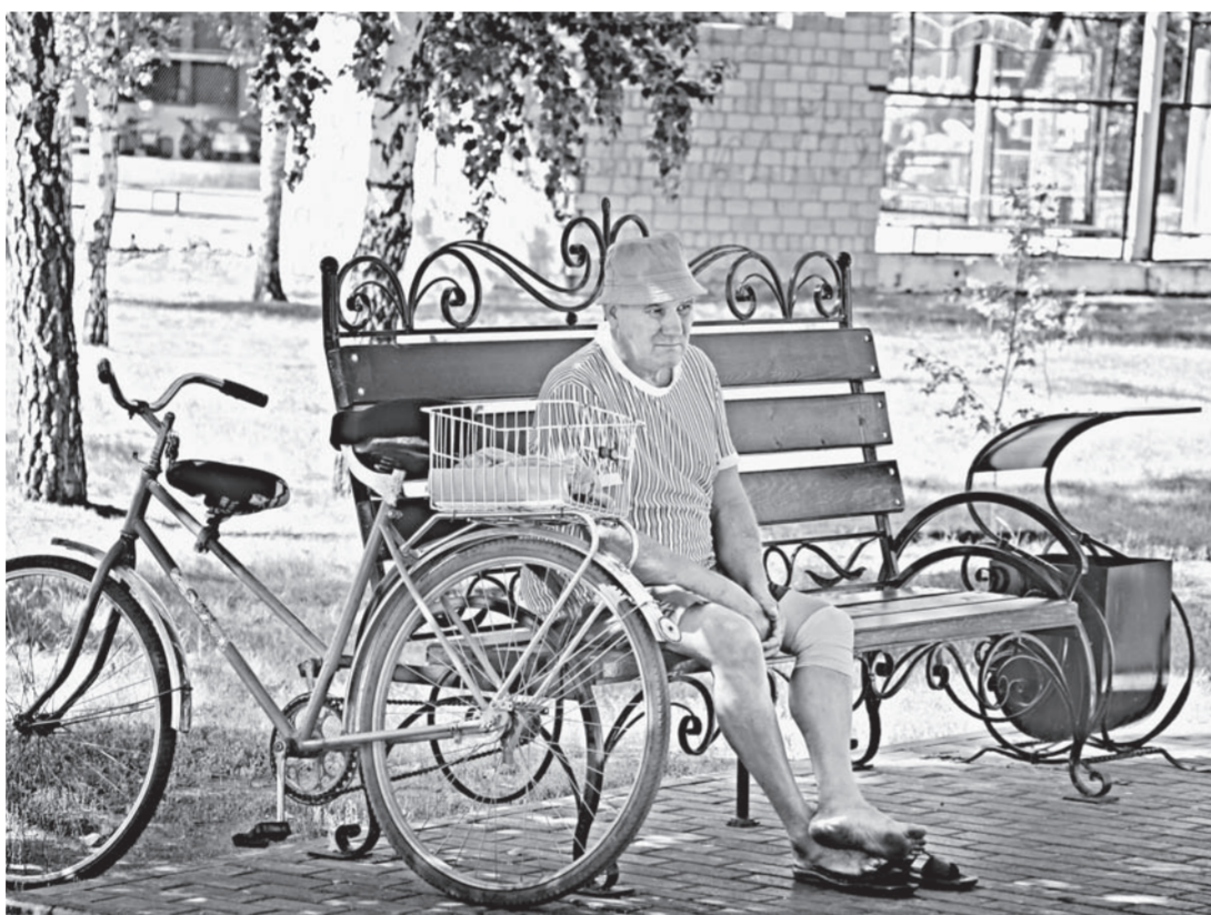
Почти половина средств на благоустройство этого парка в р.п. Благовещенка пошла из внебюджетных источников.

Межрегиональный семинар, посвященный реализации инициатив граждан, прошел 6 сентября в новеньком Доме культуры районного центра Шипуново. Здание построили по просьбе жителей района в рамках губернаторской программы «80х80».