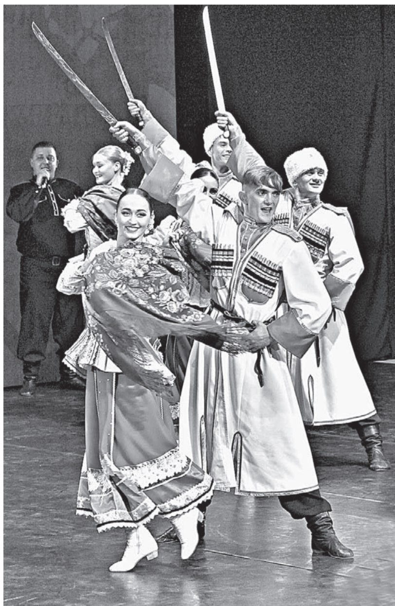
«Алтай» в своих программах отражает культуру и обычаи народностей.