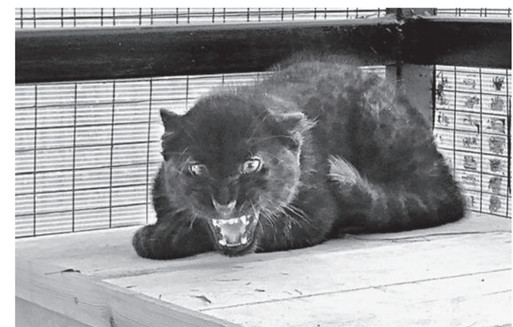
Котенку – три месяца.

В Барнаульском зоопарке новый обитатель – детеныш черной пантеры.