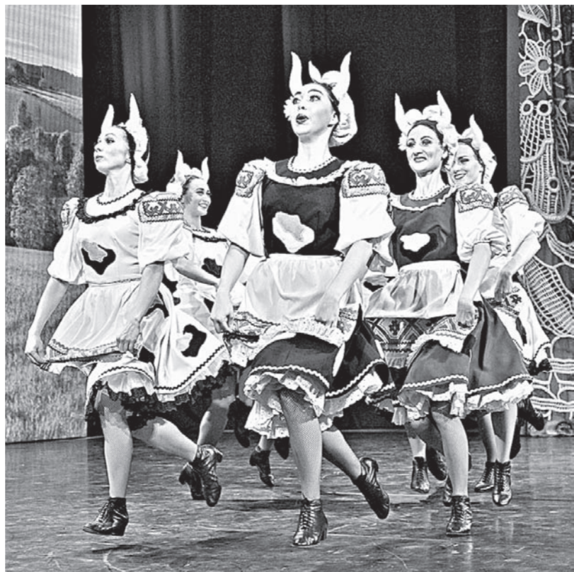
Номера коллектива – яркие и запоминающиеся.

выпустил пять концертных программ. Ни один профессиональный коллектив страны не имеет в своем репертуаре такого количества национальных номеров.