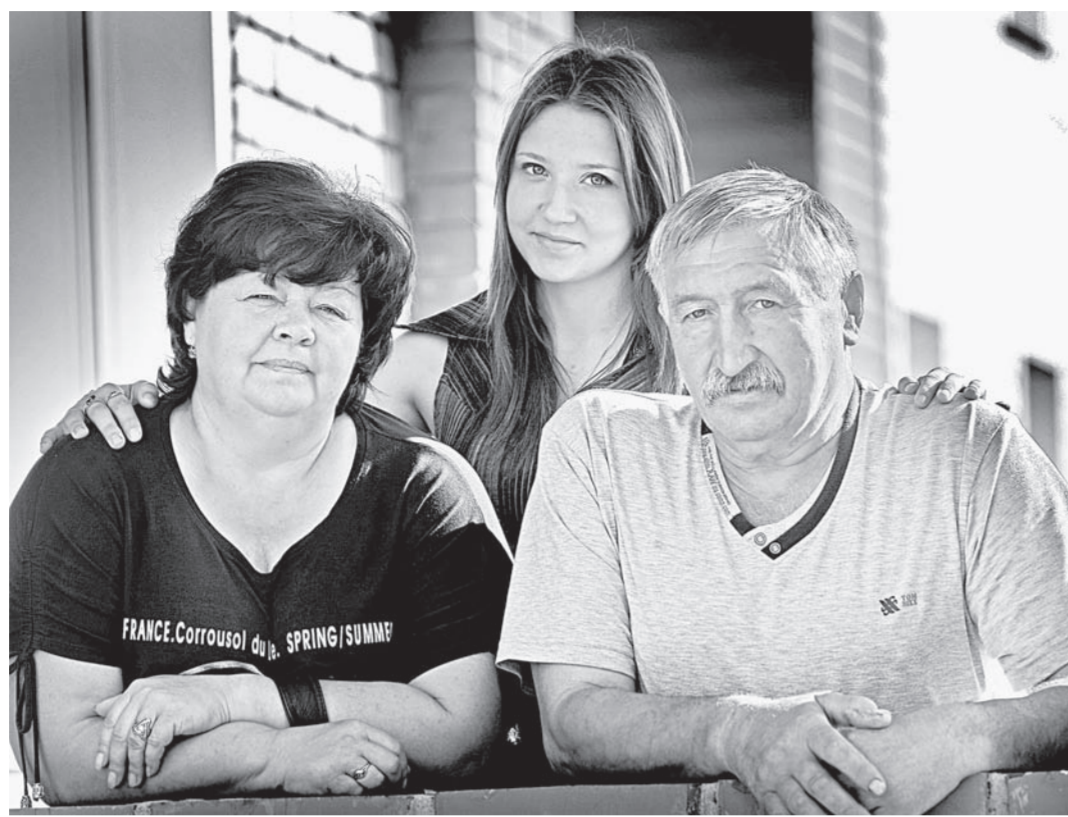
Супруги Джуз и их внучка.

– Торговлей. Я много лет проработала в строительной фирме главным экономистом, когда в 1996 году наше пред-