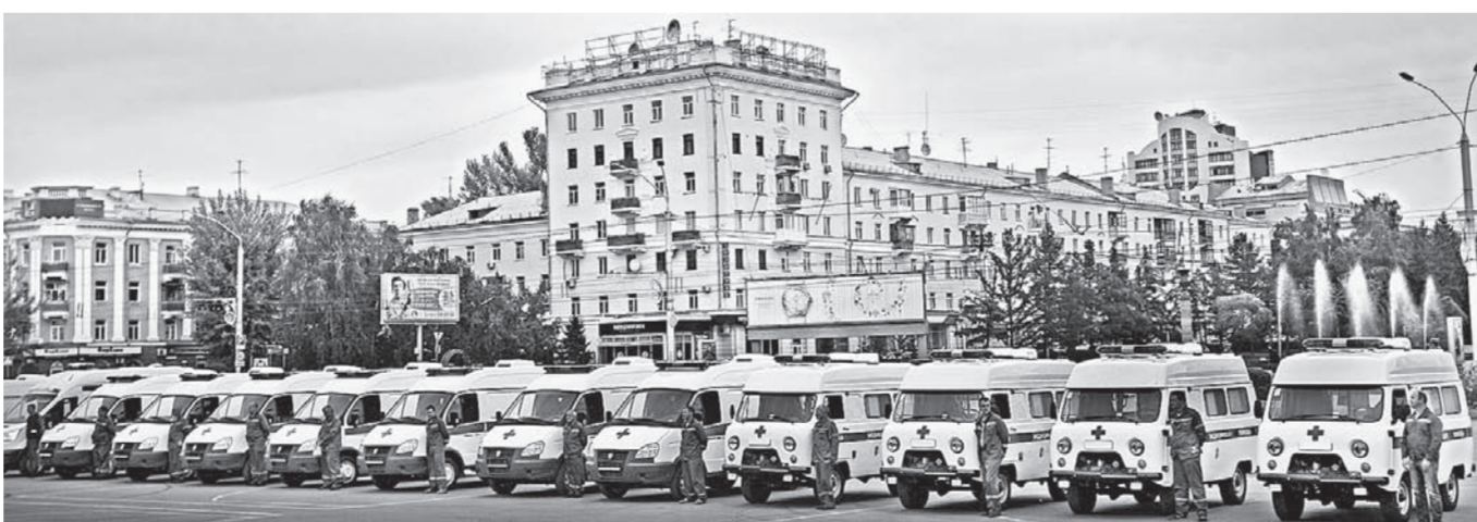
Общая стоимость поступивших автомобилей составила около 70 миллионов рублей.

- Это действительно большое событие для районов, и мы тоже хотим в нем поучаствовать, - говорит Ирина. -