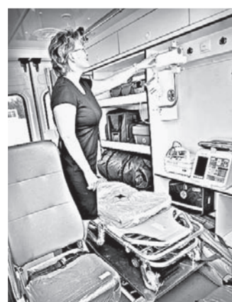
«Неотложки» оборудованы самой современной медицинской техникой.

Больницы Алтайского края получили 23 машины скорой помощи, оборудованные современной техникой. Ключи от автомобилей главврачам медучреждений вручил губернатор Александр Карлин.