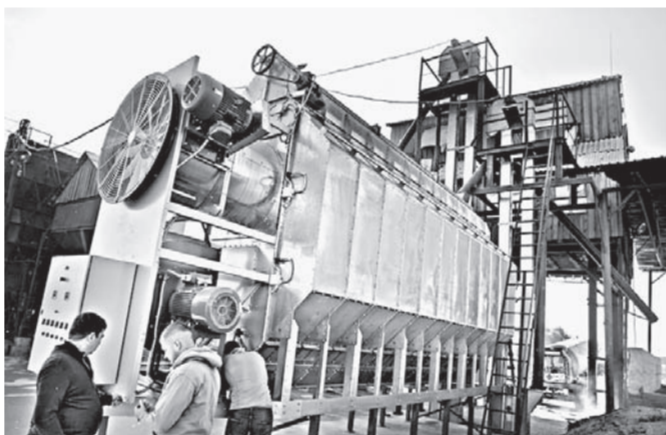
Новый сушильный комплекс мощностью 27 тонн зерна в час.