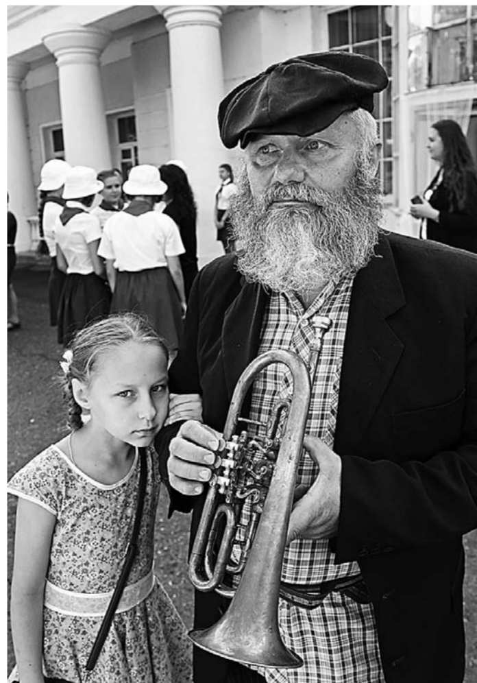
Жители Белокурихи постарались максимально вписаться в образ.

— Отдельной сценой мы сняли серпантин к «Белокурихе-2». Привлекла сама дорога. Она яркая, красивая. Понравилась и природа «Белокурихи-2», ее достопримечательности, которые мы тоже включим в фильм, чтобы привлечь зрителей. Возможно, после просмотра кто-то захочет приехать сюда.