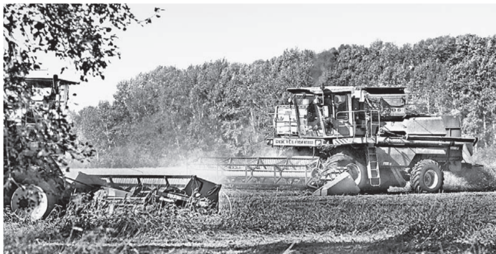
Уборка - в полном разгаре. Пшеница дает 32 ц/га, овес - 42!