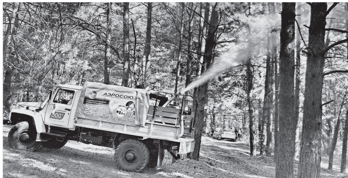
Так работает аэрозольный генератор, который распыляет биологический препарат, истребляющий опасных вредителей.

Из Первомайского губернатора направились в лес у села Буканского, где прошел выездной семинар, посвящен-