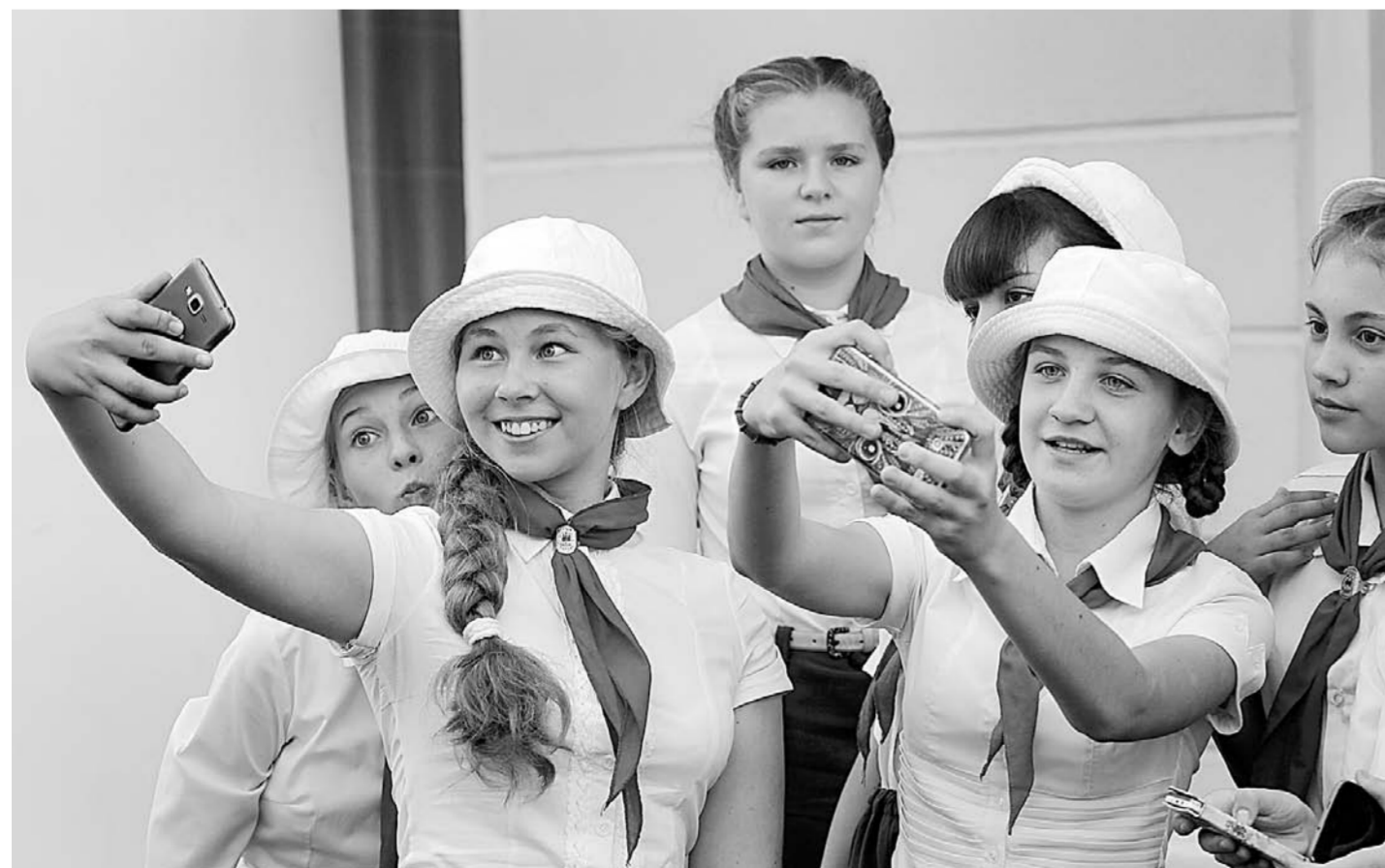
Селфи на память.