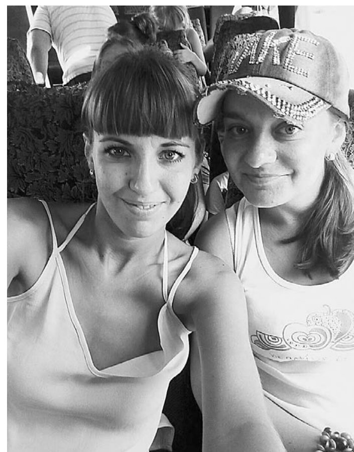
Селфи на память.

А еще туристы обязательно берут на пляж палку для селфи, иногда даже две (вдруг одно сломается). Вместо того чтобы слушать шум воды, принимать солнечные ванны и любоваться видами, устраивают фотосессии на несколько часов. А потом снимки в Интернет надо выложить да все лайки посмотреть. Другими словами, туристы на курорте становятся еще более активными пользо-