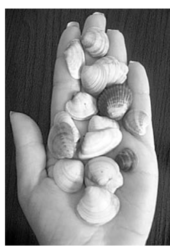
Ранушки со дна морского.

Городской пляж в Анапе большой. Но чтобы занять место у воды, люди приходят на рассвете, причем часто с одинаковыми сумками и палками для отдыха. В десять утра картина напоминает сцену из знаменитого кинофильма «Будьте моим мужем», когда герои Андрея Миронова и