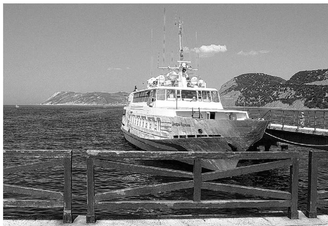
Желаете попасть в открытое море?

На перроне в любое время суток стоят люди с табличками: «Сдам жилье», а также таксисты, которые расхвывают вновь прибывших отдыхающих за считанные секунды. В общем, вднухнуть полной грудью морской воздух удается далеко не сразу. Оглядеться бы и не упустить из виду водите-