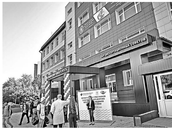
Во время открытия форума.

Мероприятие организовал Алтайский государственный медицинский университет при участии краевой организации профсоюза работников здравоохранения РФ. Вуз много лет работает в данном направлении и приобретает к делу максимальное количество студентов. В целом за год проходят обучение по специальным программам по