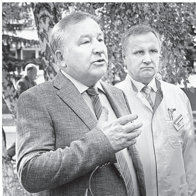
Глава региона отметил, что вопрос организации кластера будет решен до конца года.