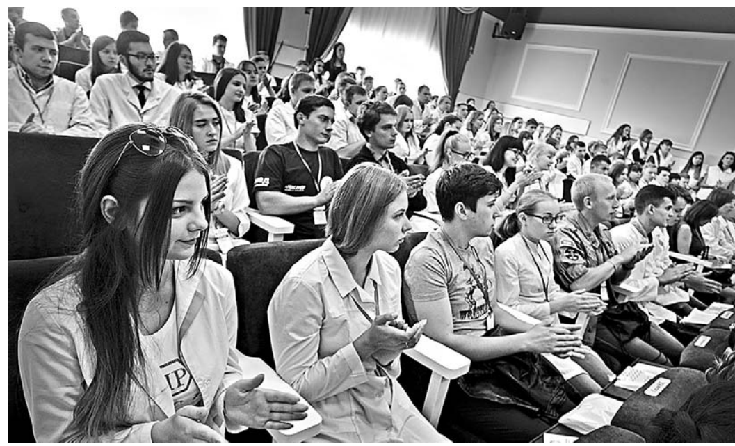
В АГМУ впервые прошел форум волонтеров-медиков региона.

рядка 300 – 400 человек. АГМУ ведет патронажную работу с детскими домами, домами престарелых и интернатами. Реализуются акции, направленные на пропаганду здорового образа жизни и профилактику