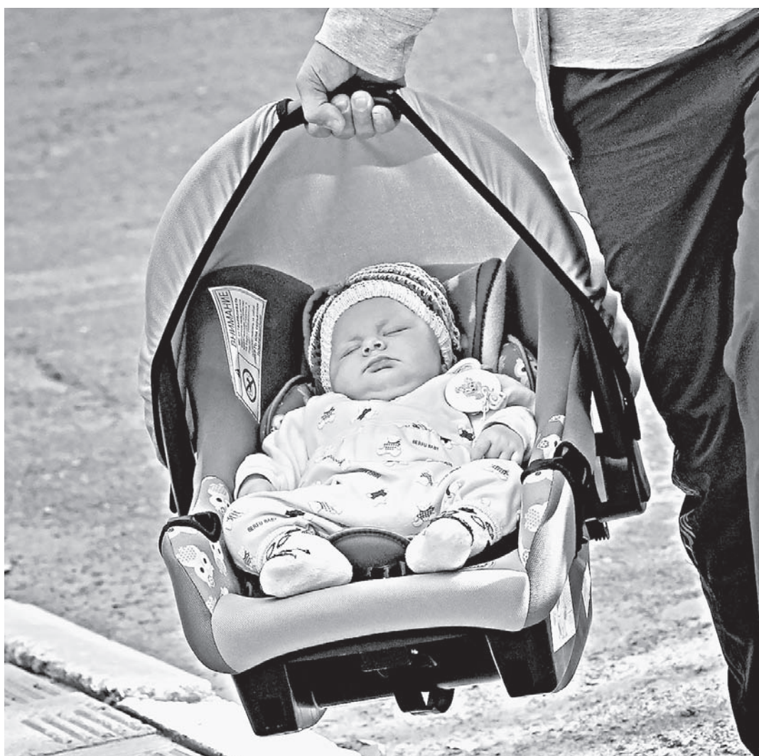
Детское здравоохранение находится в приоритете краевых властей.