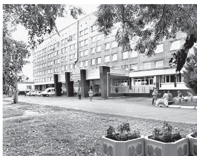
В состав кластера могут войти краевая детская клиническая больница, городская детская больница №2, краевой перинатальный центр.