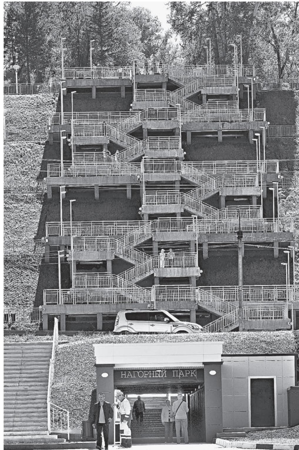
По этому переходу можно пройти от нового моста на проспекте Социалистическом к Нагорному парку.