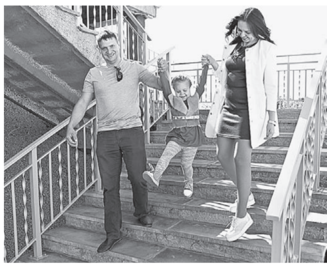
Жители Барнаула приходят на лестницу семьями. Всем здесь очень нравится.

Первые объекты туристско-рекреационного кластера «Барнаул – горнозаводской город» заметно меняют облик краевого центра в лучшую сторону. Накануне Дня города завершены реконструкция моста через Барнаулку на проспекте Социалистическом, террасирование склонов Нагорного парка и, конечно, появилась новая лестница.