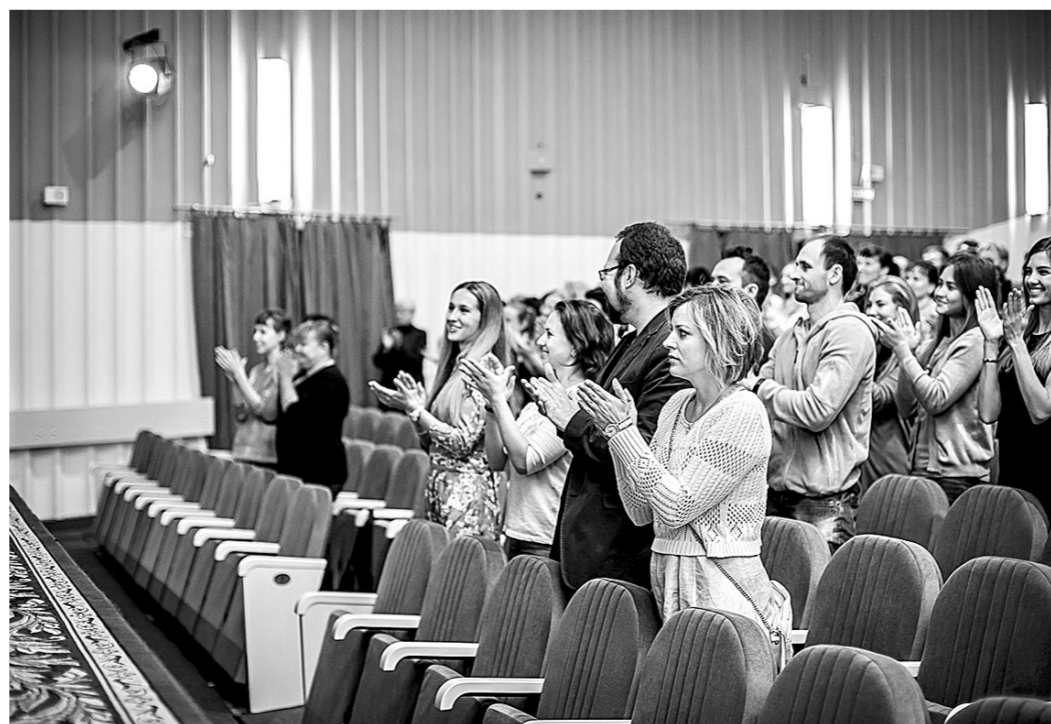
Сотрудники театра стоя устроили овацию своим зрителям, оказавшимся в этот день на сцене.