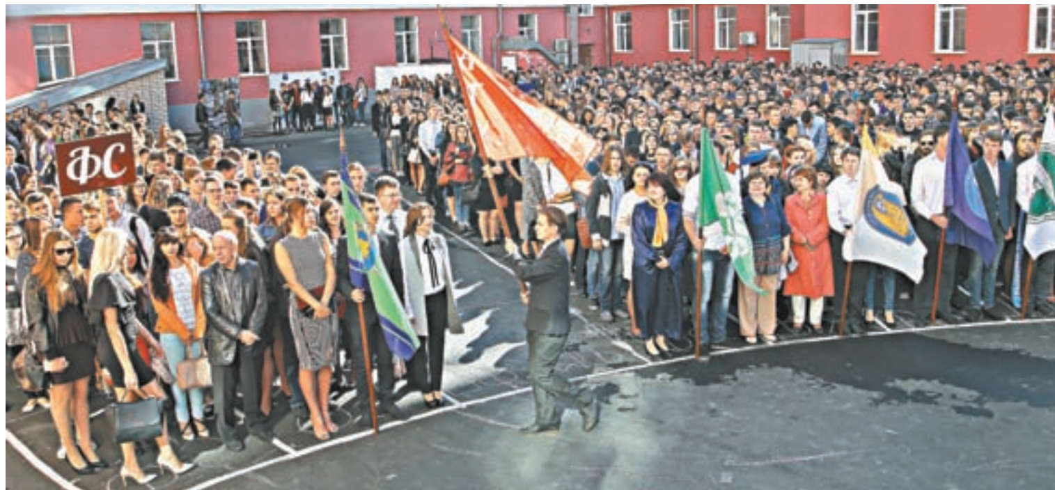
На торжественной линейке.