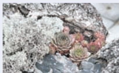
Клумба из бревна.

бишь несколько отверстий внутри, я посажу цветы». Принесли домой, он все сделал. Теперь у нас есть и такой элемент декорации сада.