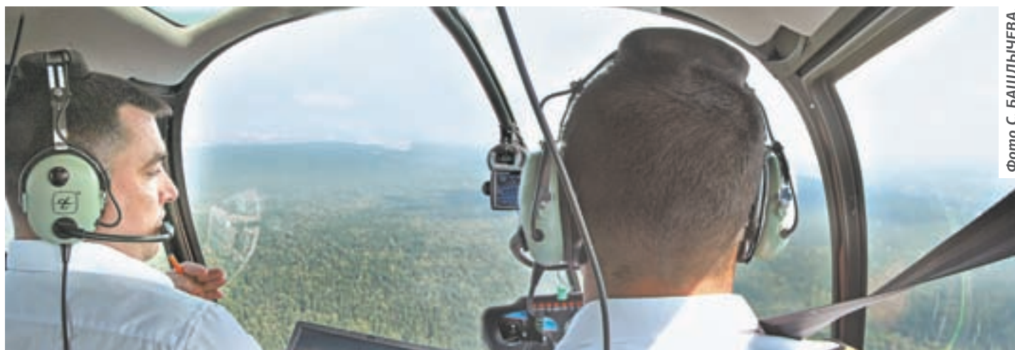
Экипаж за работой.

Сентябрь – начало осени и продолжение пожароопасного периода. По графику поднимаются в небо вертолёты «Робинсон». С воздуха ведётся патрулирование лесов. Всё идёт своим чередом и на базовой площадке Барнаульской авиаточки.