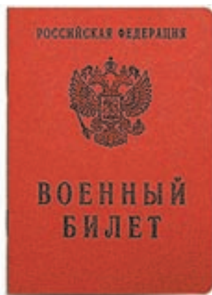
Военный билет нужно заслужить.

Студентам Алтайского государственного технического университета вручили военные билеты.