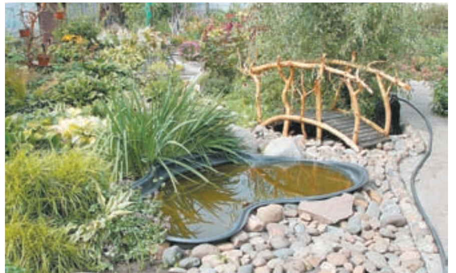
Искусственный пруд выполняет не только декоративные функции. Хозяйка берет в нем воду для полива.

Кроме всего перечисленного на участке есть 50 сортов очитков, боль-