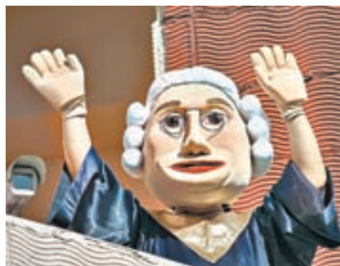
Михаил Ломоносов приветствует студентов.

В десять утра студенты собрались у главного корпуса АлтГУ. С флагами и праздни-