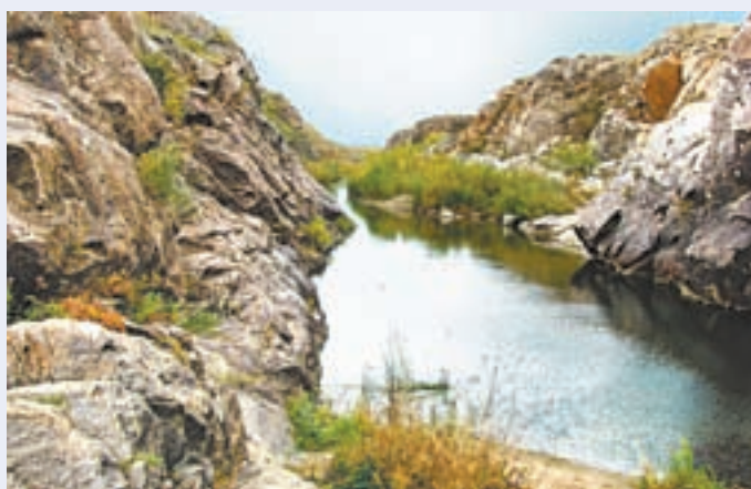
«Скальный каньон на реке Кизиха (Каменная речка) в Рубцовском районе».

В Кислухинском выделена зона особой охраны. Это необходимо для сохранения ценных сосновых и еловых лесов, водно-болотных комплексов, мест наибольшей концентрации редких и исчезающих видов растений и животных. В том числе гнездовых участков редких видов птиц, глухаринных токов,