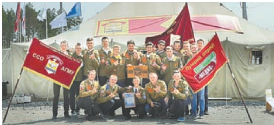
Студенческий строительный отряд «Товарищ».

Задач у бойцов было много. Они возводили укрепления на космодроме, заливали бетон, откачивали воду... Но, несмотря на большой объем работы, успевали прояв-