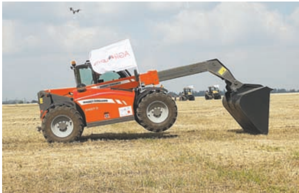
Погрузчик встает на дыбы.