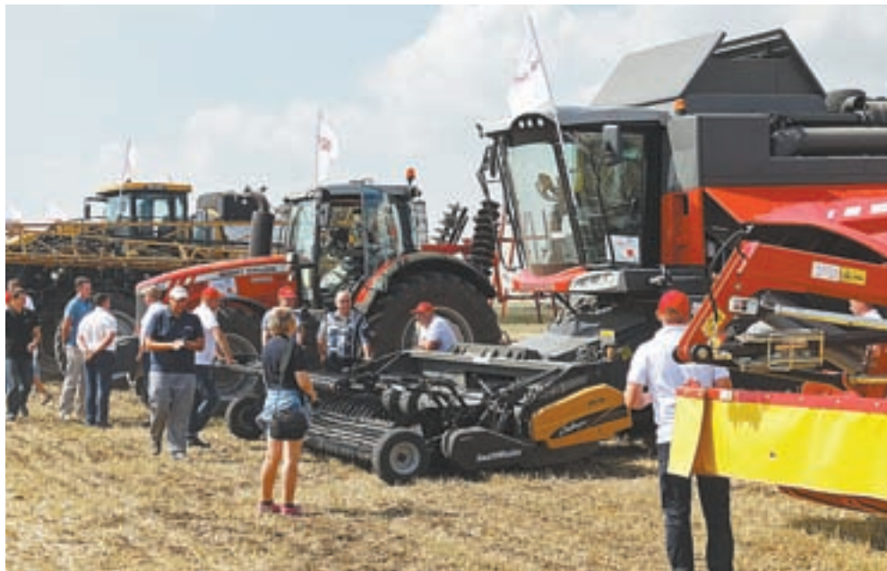
Участники проявили большой интерес к представленной технике.