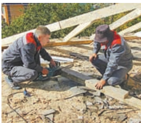
Ремонт кровли на ул. Ощепкова, 38.

– Этот дом строили, наверное, в 1960 годы, кровлю не капитализировали ни разу. Мы столько хлама отсюда вытащили! Люди латали дыры в кровле, чем могли: и фанерой,