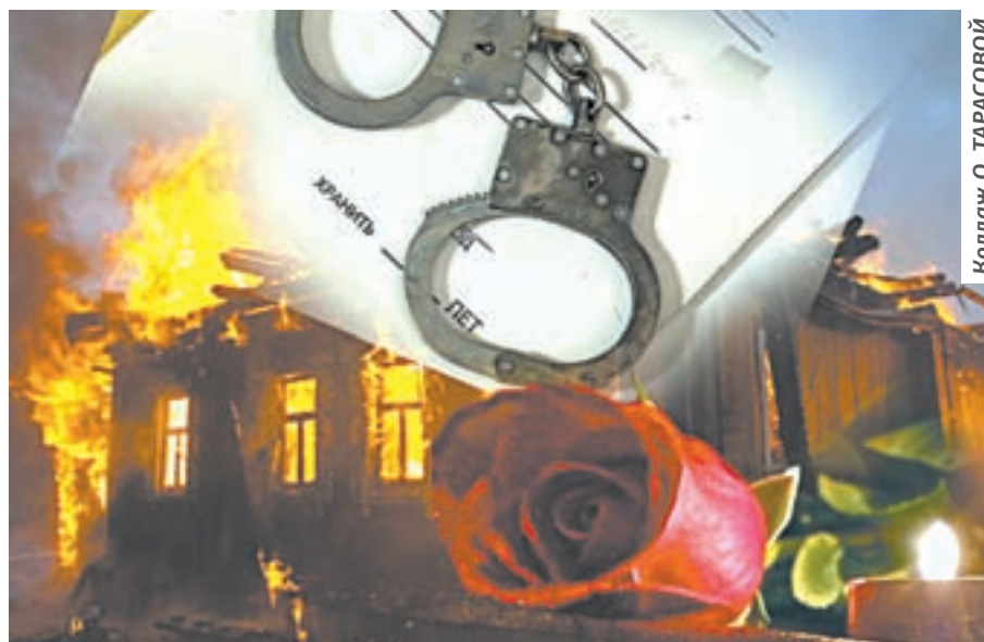
Коллаж О. ТАРАСОВОЙ.

Ночью 28 сентября 2015 года в квартире жильцов одного из домов на улице