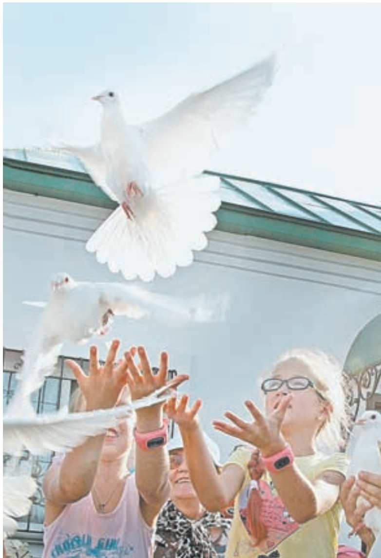
Отпускать голубей в небо – к счастью и добру.