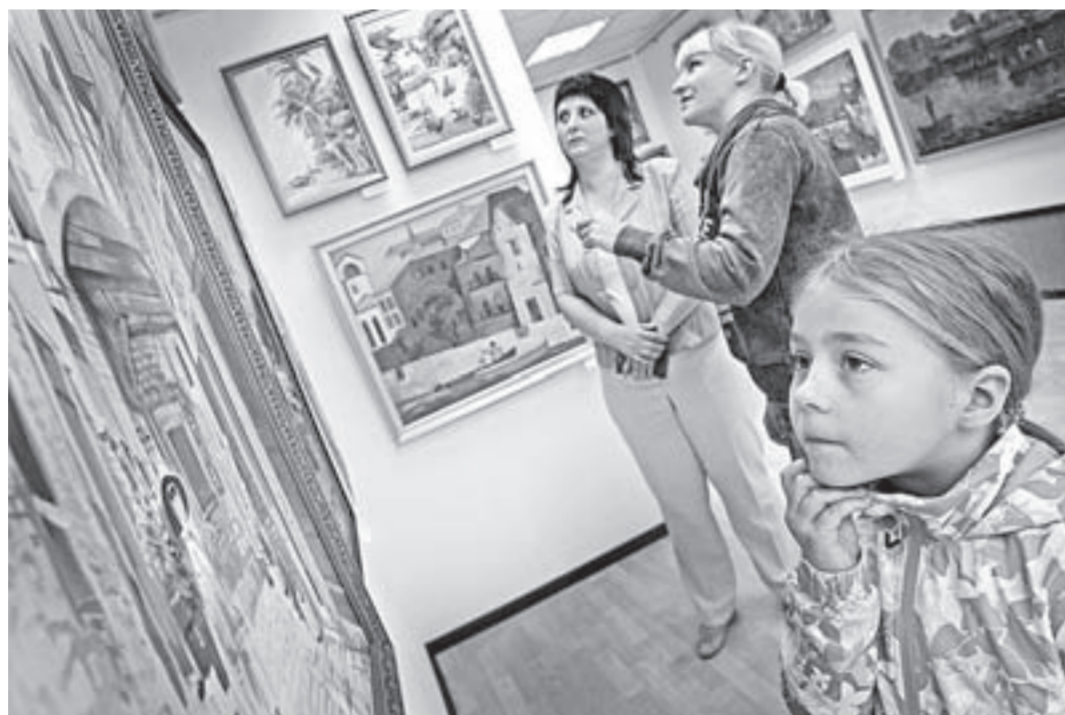
Художники приглашают в путешествие по странам мира.

Но вот наконец официальная выставка, притом традиционная: свои впечатления, привезенные из путешествий,