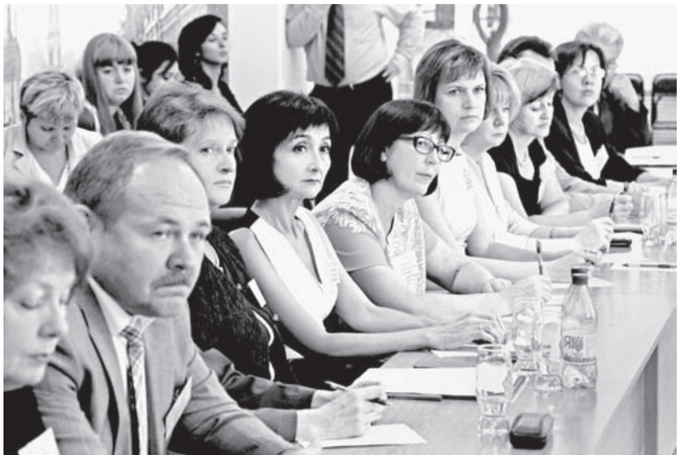
Педагоги могли задать губернатору любые вопросы.