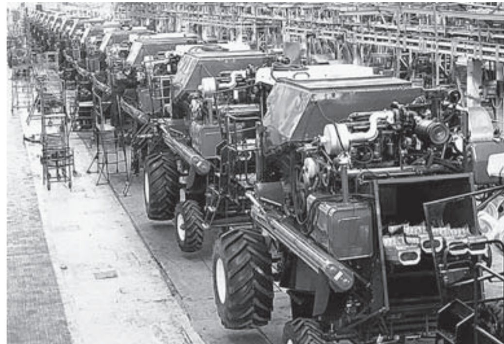
В сборочном цехе «Гомельмаш».

ОАО «Гомельмаш» планирует довести локализацию производства комбайнов на Алтае до 45%. До конца года будет выпущена первая пар-