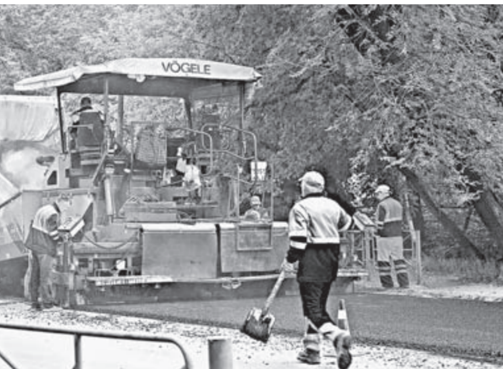
В дорожном ремонте задействован современный асфальтоукладчик.