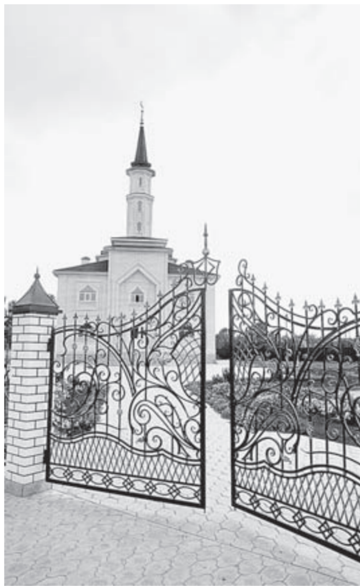
«Каждый храм добавляет близости человека к Богу...»