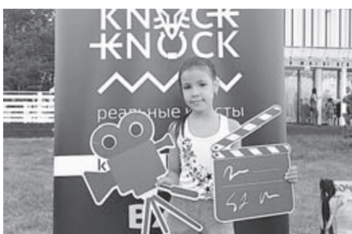
Дети фотографировались с символами киноиндустрии.

Эти фильмы были выбраны самими зрителями в ходе голосования на сайте Года российского кино. Кроме показов фильмов организаторы площадок подготовили для зрителей интересные сюрпризы. Так, кинотеатр «Премьера» на первом сеансе едва вместил всех желающих. Перед началом показа мультфильма «Смешарики. Легенда о золотом драконе» для юных зрителей был организован мультконцерт «Назови мультфильм». Ребята с удовольствием отвечали на вопросы ведущей и угадыва-