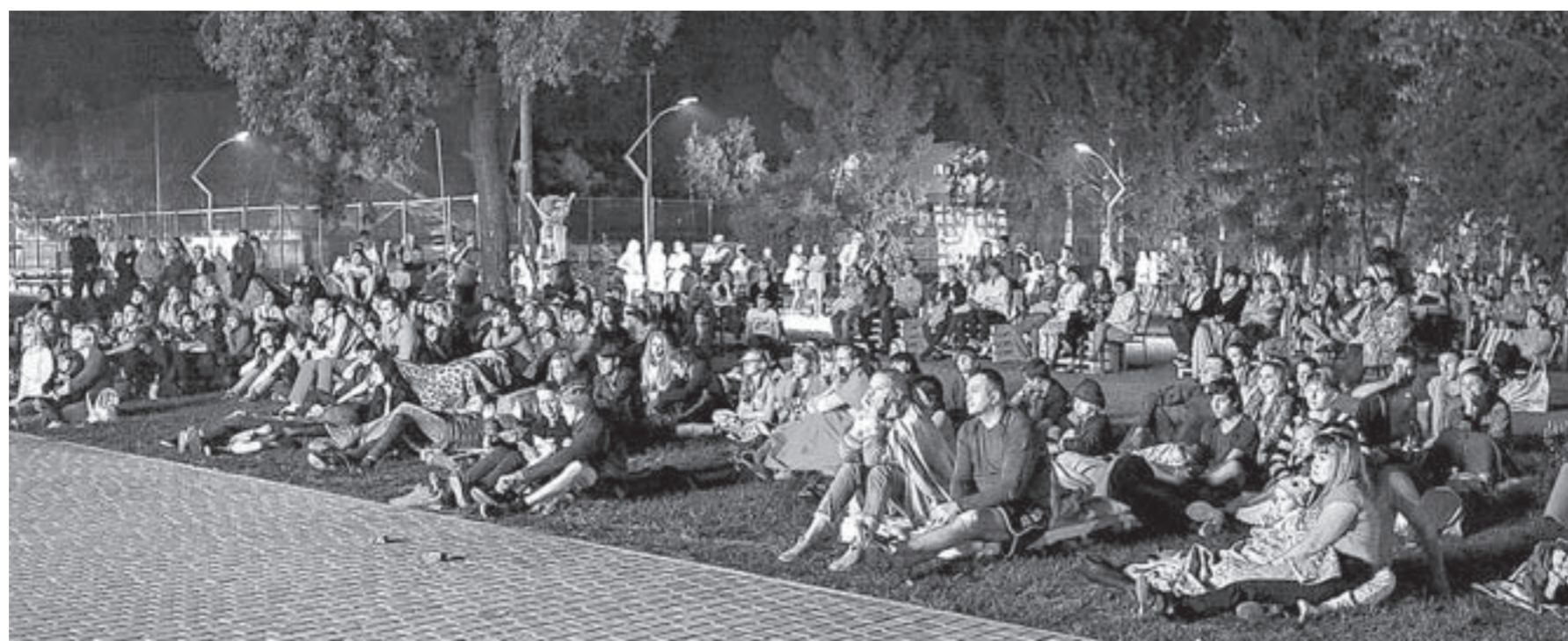
Посмотреть фильмы под открытым небом собралось почти 2000 человек.

Акцию поддержал не только Барнаул, но и Бийск, Рубцовск, Яровое, Белокуриха, Кулунда и Быстрый Исток. Так, например, в Быстром Истоке в мемориальном музее им. Валерия Золотухина состоялась познавательная музейная экскурсия по фильмам Валерия Сергеевича, а затем музыкальная гостиная, где прозвучали песни, которые Золотухин исполнял в кино. Многие композиции сельчане исполнили даже хором в караоке. Но, конечно, самая насыщенная программа была в Барнауле – там «Ночь кино» проходила сразу на четырех площадках: в самом большом кинотеатре города – «Мире», кинотеатре «Премьера», зрительном зале Алтайского института культуры, а также на открытой площадке спорт-парка Алексея Смертина. Зрители смогли бесплатно посмотреть российские фильмы «Легенда № 17» Николая Лебедева, «Батальон» Дмитрия Месхиева, анимационную ленту «Сме-