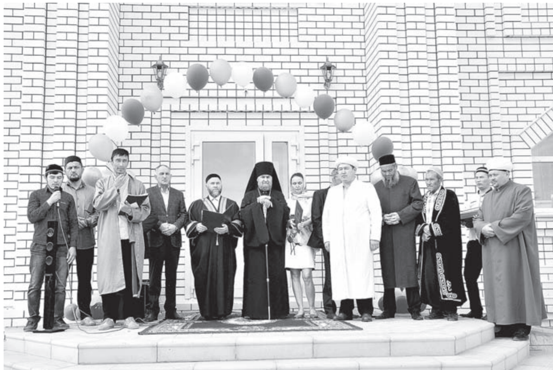
Преподобный епископ Славгородский и Каменский Всеволод и главный имам Соборной мечети Барнаула Фагим Ахметгалиев – на открытии Славгородской соборной мечети.

В минувшее воскресенье, 28 августа, десятки людей разных национальностей и религиозных конфессий из различных уголков Алтайского края, Республики Алтай и Казахстана съехались в Славгород, чтобы отпраздновать открытие нового духовного храма. В этот день для всех желающих впервые распахнула свои двери мусульманская соборная мечеть.