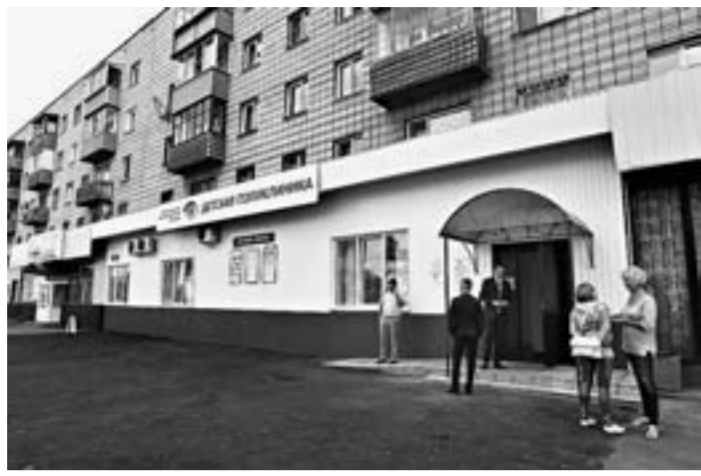
Здесь примут ребятшек от «нуля» до 18 лет.

— Я больше не знаю в стране таких служб, хотя очень хорошо ориентируюсь в этой сфере. Но для нашего края это необходимость. Ведь больше половины населения нашего