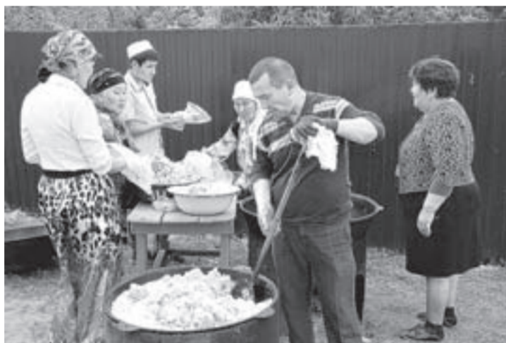
Хозяйка приглашала дорогих гостей к дастархану.

– Кто-то жертвовал деньги, кто-то – стройматериалы, кто-то приобретал ковры и люстры для внутреннего убранства мечети, а кто-то вносил вклад своим трудом, камень за камнем воздвигая дом молитвы мусульман, – вспоминает председатель культурной автономии