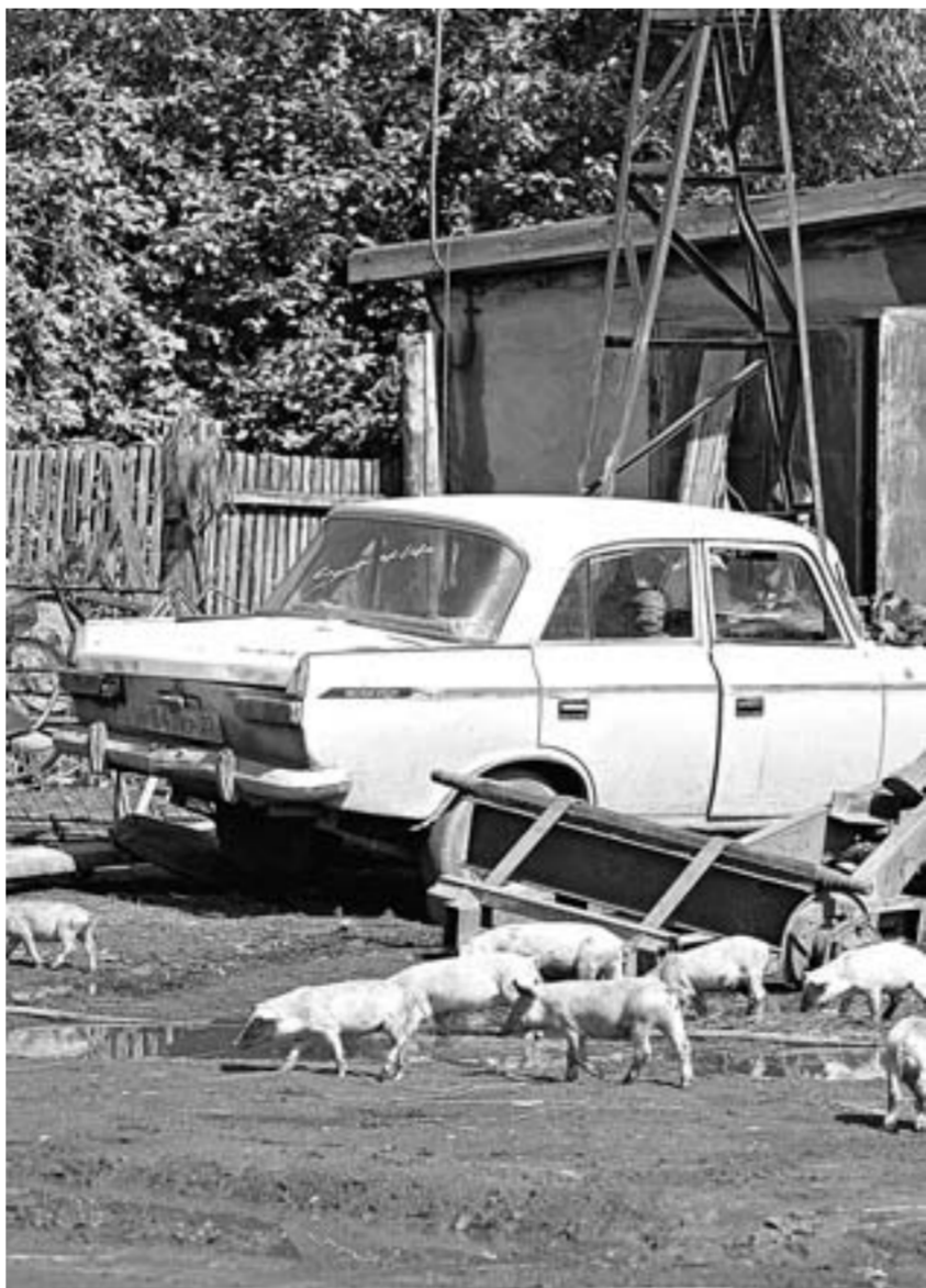
Такое – недопустимо.

Особое внимание – на бесконтрольный выпас животных. Посмотрим на ситуацию в Целинном районе. Там бродячих свиней насчитали более трёх тысяч голов. Это свыше половины поголовья свиней у населения. Также беспризорные животные выявляются на территории сельских поселений Ельцовского, Красногорского, Кытмановского районов. Зафиксировано свободное передвижение свиней в Поспелихинском, Тогульском, Третьяковском, Чарышском, Шипуновском районах.