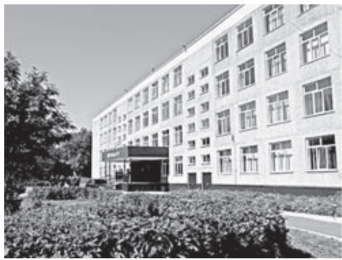
Барнаульская школа №126 – одна из лучших в крае.

получить информацию и непосредственное общение с родителями и педагогами. Мы очень волнуемся, собираясь в первый класс, потому что это во многом неожиданное решение – объединить три школы. Любой родитель очень хочет, чтобы его ребенок учился в нормальных условиях. Мы, конечно, обычные родители и поначалу тревожились. Сейчас видим, что школа получила значительные средства на ремонт и работа уже идет. Мы это увидели своими глазами, и