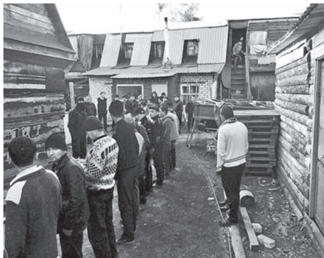
Только с мая по август текущего года правоохранители края совершили около 350 проверок мест компактного проживания мигрантов.

Результатом каждого такого выезда, как правило, становятся от двух до десяти выявленных нарушений миграционного законодательства. Среди них – незаконное пребывание на территории