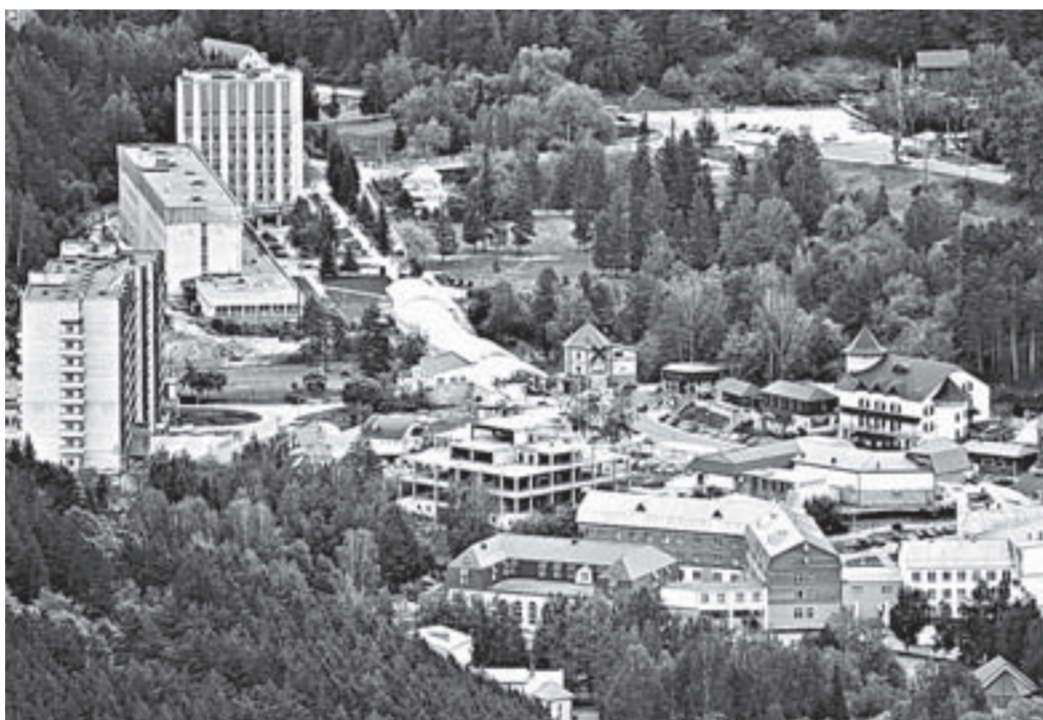
Город-курорт Белокуриха. Глава государства положительно оценил его развитие за последние годы.

в первую очередь необходимо реализовать меры по совершенствованию системы государственного управления и долгосрочного планирования в санаторно-курортном комплексе, созданию инструментов социально-экономического развития курортов.