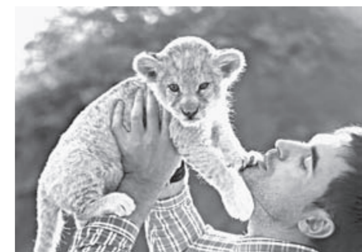
Пока маленькую львицу можно брать на руки.

В Барнаульском зоопарке новый питомец – очаровательная львица Ая.