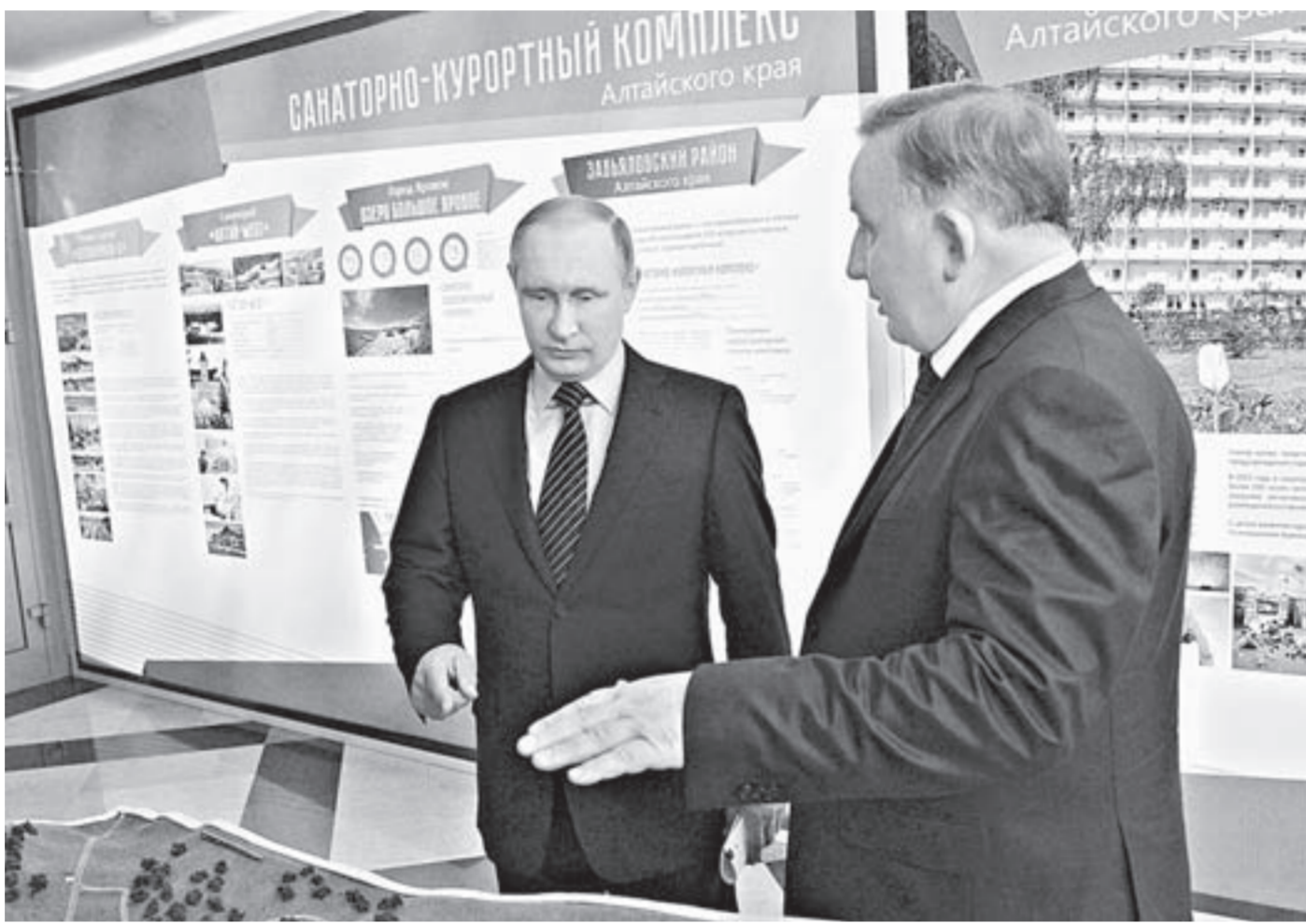
Александр Карлин рассказал Владимиру Путину о санаторно-курортном комплексе Алтайского края.

– Регулярное оздоровление в санаторно-курортных условиях позволяет увеличить продолжительность жизни от 3 до 15 лет, – подчеркнул Владимир Путин. – Больные, прошедшие санаторный этап реабилитации, в большинстве случаев возвращаются к труду. Необходимо развивать санаторно-курортный комплекс. Санатории могут стать основой для роста экономики, совершенствования транспортной инфраструктуры. Уникальная природа, методики – это колоссальная база для обеспечения кон-