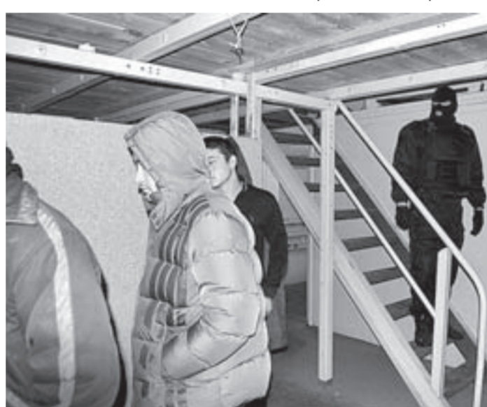
В каждом рейде выявляются нарушения миграционного законодательства.