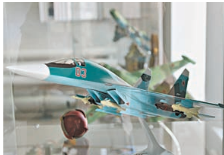
В экспозиции более 15 моделей самолетов.

150 РЕДКИХ ФОТОГРАФИЙ ПРЕДСТАВЛЕНО НА ВЫСТАВКЕ