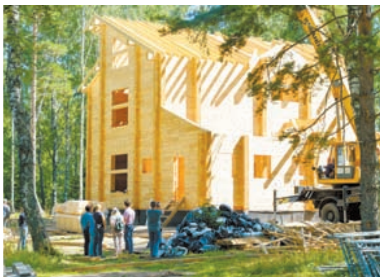
Эту гостиницу бийский инвестор сдаст в следующем году.

– Общее количество мест размещения в «Белокурихе-2» выросло, – продолжает Олег Акимов. – Первая очередь строительства даст нам 3 тысячи мест. Вторая увеличит курорт до 5 тысяч мест.