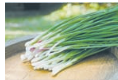
«Собериха-припасиха» – так называли последний месяц лета.

Другая хозяйка подсказывает: «Мне не очень фасованная в плёнку зелень нравится. Мягкая. А рассыпью когда, например, лучок продают – такой он бодренький».