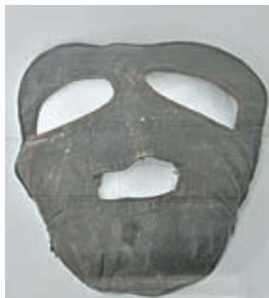
Маска летчика. В таких пилоты летали в зимнее время.

директора музея «Город», рассказывает «АП»: