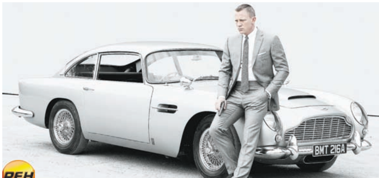
09.20 Х.ф. «007. Координаты «Скайфолл» (16+)

06.00 Интервью недели (12+) 06.50, 16.10, 02.00, 05.45 Рецепт дня (12+) 07.00 Интервью недели (12+) 08.00 Мультфильмы (6+) 10.00, 20.30 Новости, Итоги (12+) 10.20, 20.50, 01.50 Обзор «Российской газеты» (12+) 10.30, 19.30, 04.00 Хлебный край (12+) 11.00, 05.20 Былое (12+) 11.10 Х.ф. «Сокровища О.К.» (12+) 13.00 Доктор И... (0+) 14.30 Тайны советского кино (16+) 15.30 Док.ф. «Неизвестная планета. В поисках утерянного кода» (16+) 16.00, 20.00, 04.30, 05.50 Стратегия успеха (12+) 16.15, 00.40, 03.50, 05.10 Интервью дня (12+) 16.30 Сериал «Защитник» (16+) 18.00, 03.20 Ваша партия (12+) 18.30, 02.20 Ваш вопрос (12+) 20.15, 04.40 Время культуры (12+) 21.00 Х.ф. «Неадекватные люди» (16+) 22.50 Х.ф. «Принцесса Монако» (16+) 02.05, 04.50 Один день (12+) 05.00 Персона (12+) 05.30 Лекторий (12+)