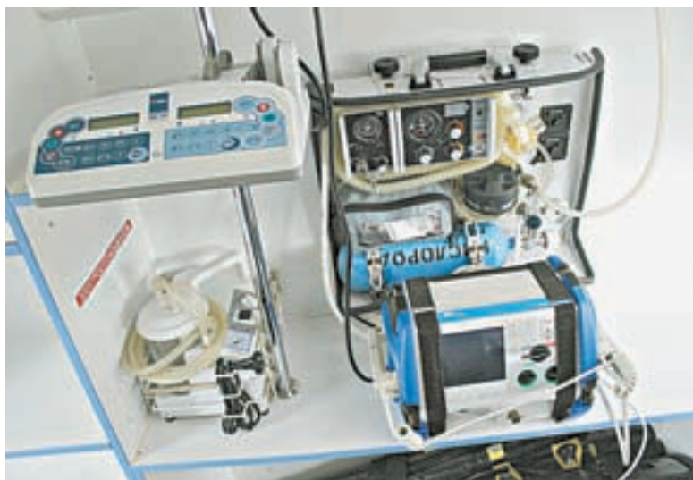
Медицинское оборудование в салоне реанимобиля.

тяжелом состоянии сможет перенести перегрузки «взлет-посадка». Например, очень опасно перевозить на вертолете новорожденных в тяжелых состояниях.