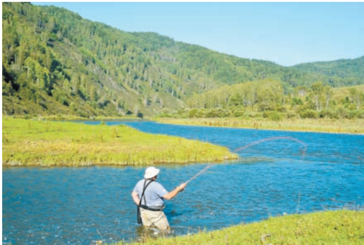
Маршруты проходят по живописным местам. Можно остановиться и порыбачить.

Что еще нового в «Белокурихе-2»? На въезде в санаторную зону появятся многоуровневая парковка и пункт проката электрокаров. То есть курорт будет закрыт для автомобилей. Там же расположится ресепшн, откуда пойдет распределение потока отдыхающих. По соседству – гостиницы на 3 – 4 звезды. Также запланировано строительство двух пятизвездочных гостиниц международных операторов. Примечательно, что в отличие от первоначального плана, который подразумевал многоэтажное строительство, сейчас все здания не выше пяти этажей. При этом максимальная вместимость даже самых крупных средств размещения будет в пределах 100 – 150 номеров.