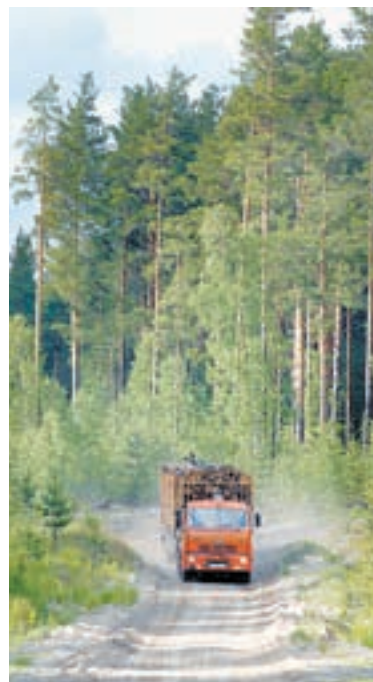
Лес везут на переработку.