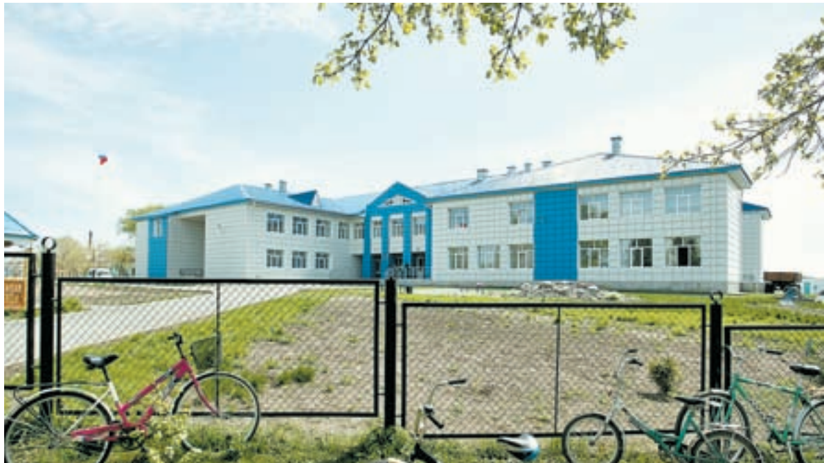
За последние годы много средств направлено на строительство и ремонт школ.

время это подтвердило. Мы вписывались в возможности текущего бюджета, заодно просчитывая, что будет завтра. Если прогноз был неблагоприятным, закон не принимался. Зачем вводить людей в заблуждение, принимая заведомо популистские, декларативные, нечестные, неработающие решения? Есть у края, увы, горький опыт, когда в начале двухтысячных непродуманно был принят закон о начислении пенсий тем, кто занимается личным подсобным хозяйством. Мы вынуждены были его отменить. Недоверие людей к власти как раз и возникает потому, что она допускает подобные промахи. Я с гордостью говорю, что не подписал ни одного закона, не подкрепленного финансами.