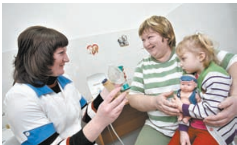
VI созыв АКЗС существенно расширил спектр действия программы «Земский доктор».

– Думаю, как минимум 50% действующего состава сохранит свой статус. Но при этом мы наверняка увидим новые лица. Курс парламента останется прежним – на стабильность общества. Мое желание новичкам: сохранить и развить традиции и приоритеты, складывавшиеся годами, передававшиеся, как знамя, из созыва в созыв. Во-первых, взаимодействовать с исполнительной властью не «в обнимку», а конструктивно, учитывая интересы жителей края. Во-вторых, работать с проблемами на местах, а не выбирать точки, где не задают неудобных вопросов. Так мы поднимаем статус депутатов уровня села и района, знающих местные проблемы не понаслышке. Таких проводников интересов народа более семи тысяч по краю. Против их доверия и авторитета, заработанного конкретными делами, бессилен даже самый черный пиар. Ну и, в-третьих, работать с молодежью, способствовать развитию общественных структур по примеру краевого Молодежного парламента, на наших глазах выросшего в мощную организацию, авторитетную настолько, что выездной Молодежный парламент Госдумы в этом году принимал Алтайский край. К слову, второй созыв «молодежки» на федеральном уровне также возглавляет представитель нашего региона.