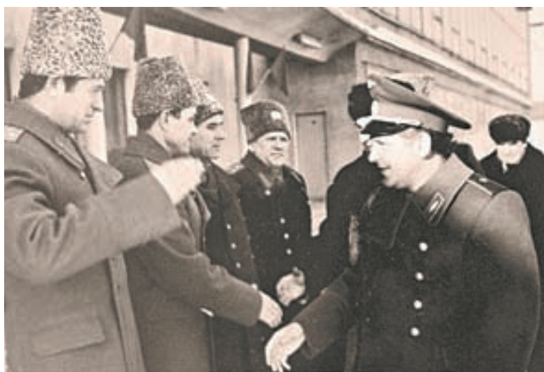
Одно из редких фото Германа Титова в Барнауле.

В музее «Город» к 50-летию основания Барнаульского летного училища открылась экспозиция «Небо для всех». Здесь можно посидеть за штурвалом настоящего самолета и сфотографироваться с парашютом.