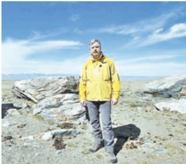
Для развития внутреннего туризма фильм Валдиса Пельша, несомненно, полезен.

На прошлой неделе общалось, что Первый канал покажет документальный фильм Валдиса Пельша про Алтай. Причем, кроме Горного Алтая, в «Путешествии к центру Земли» вроде бы собирались коснуться и нашего края. В субботу выяснилось, что авторов интесировала исключительно республика, причем не