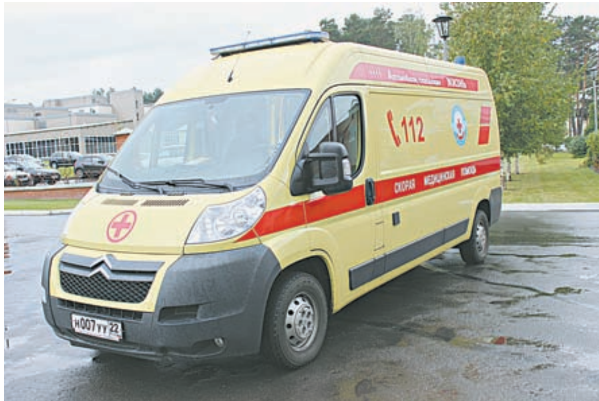
Автомобиль, который спасает жизни.

– Я уже больше 30 лет работаю в службе медицины катастроф и хочу сказать, что этот реанимобиль даже лучше и мобильнее вертолета. Бывают ситуации, что штормовая погода, «вертушку» просто не посадишь, а на этой машине мы можем добраться в любой район края. У нас были случаи, когда на реанимобиле мы проезжали в пургу по занесенной снегом дороге, двигались со скоростью 5 км в час, буквально на ощупь, но ведь добрались! И помощь была оказана. А на вертолете в такую погоду никто бы не рискнул даже в воздух подняться. И еще большой плюс автомобиля: не каждый пациент в