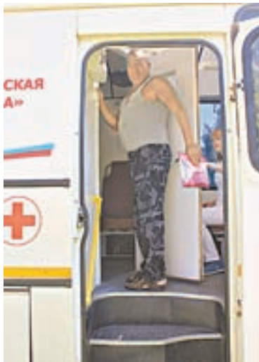
В село привезли УЗИ-аппарат.