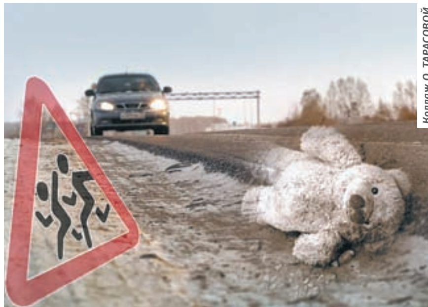
Коллаж О. ТАРАСОВОЙ.

Ее подруга отправилась посмотреть, сбила Татьяна кого-либо или нет. Через несколько минут вернулась и сообщила, что там кто-то лежит. Затем водитель «Газели» пошел по следам юза автомобиля «Тойота Марк 2». В кювете примерно в 4 метрах от дороги увидел мальчика-подростка. Он лежал на спине. Мужчина обмел его лицо, припорошенное снегом... Мальчик хрипел и был еще жив... Мужчина позвонил помощнику участкового в селе Ая и сообщил о случившемся. Кто-то вызвал «скорую помощь». Затем в месте ДТП стали собираться люди. Он