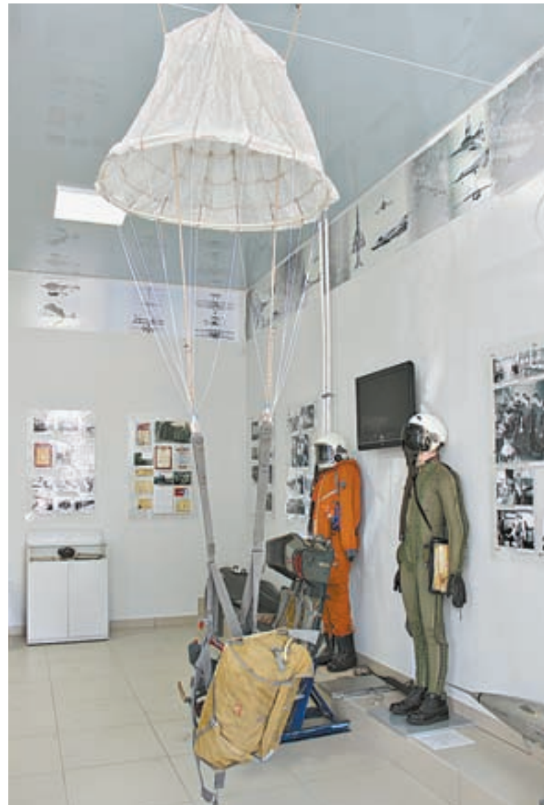
На выставке можно примерить парашют.

Целый раздел выставки посвящен космонавтике. Здесь можно