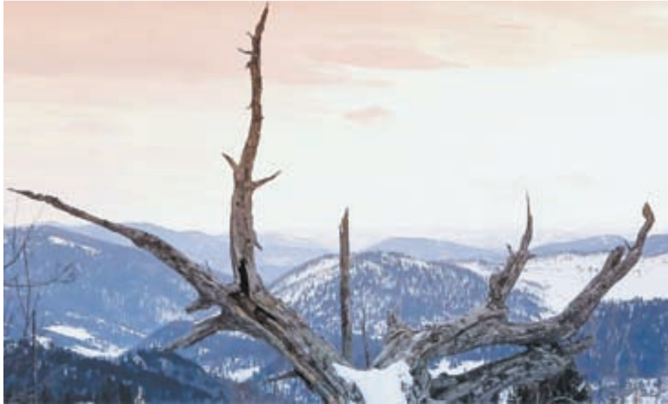
Такой Алтай увидит не всякий турист.

Закадровый голос уходит от однозначных оценок бывших партизан или советских карьеристов, стоявших во главе кинопроизводства. Но зрителю нетрудно составить свое мнение на основе эмоциональных воспоминаний маститых режиссеров, критиков, а также пожилых студийных редакторов. Последние, как водится, о механизме принятия решений знали куда больше, чем несчастные режиссеры, картины которых то не запускали в производство, то клали на полку. Доведенный до отчаяния режиссер Тарковский даже написал резкое письмо министру кино, в котором вопрошал, почему ему десятилетиями ставят палки в