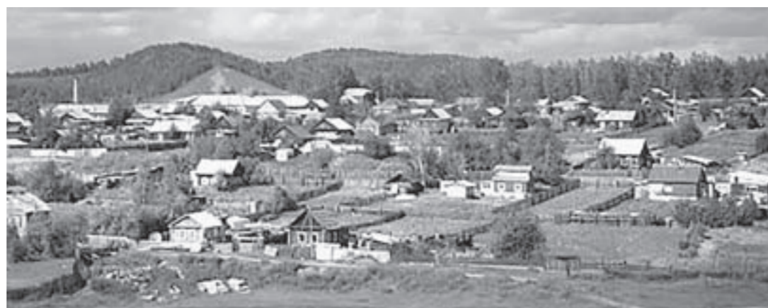
Село Краснощёново. Алтайский край.