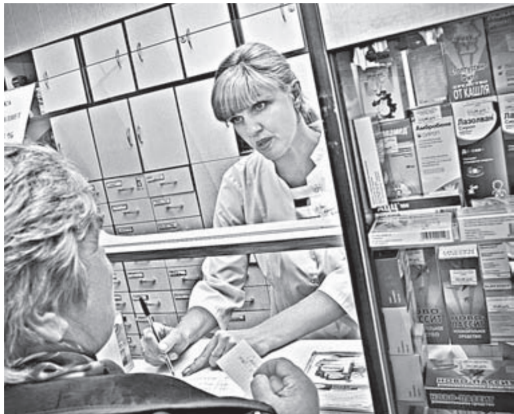
Провизор поможет посетителю выбрать более дешевый аналог дорогого лекарства.