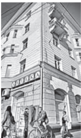
В Алтайском крае работает 987 аптек.

них обновляются несколько раз в день, что позволяет предоставлять самую оперативную информацию о ценах. Из перечня жизненно необходимых и важнейших лекарственных препаратов в 132-й аптеке представле-