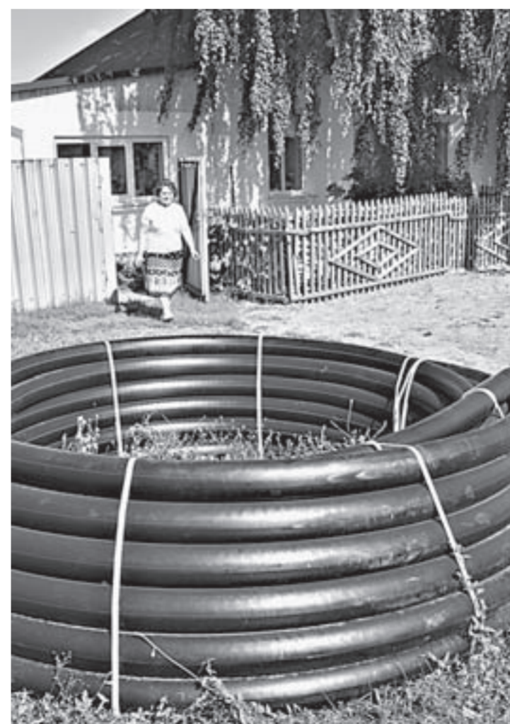
В следующем году по этим трубам пойдет газ.

Но эту зиму жители Старого Павловска – так называют этот микрорайон – еще проживут с углем и дровами. Газ пустят по