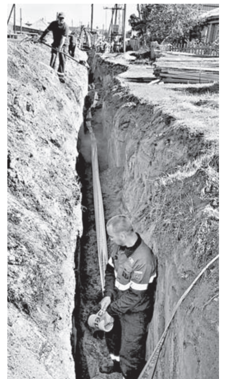
Лента внутри траншеи предупредит при раскопках, что газопровод близко.