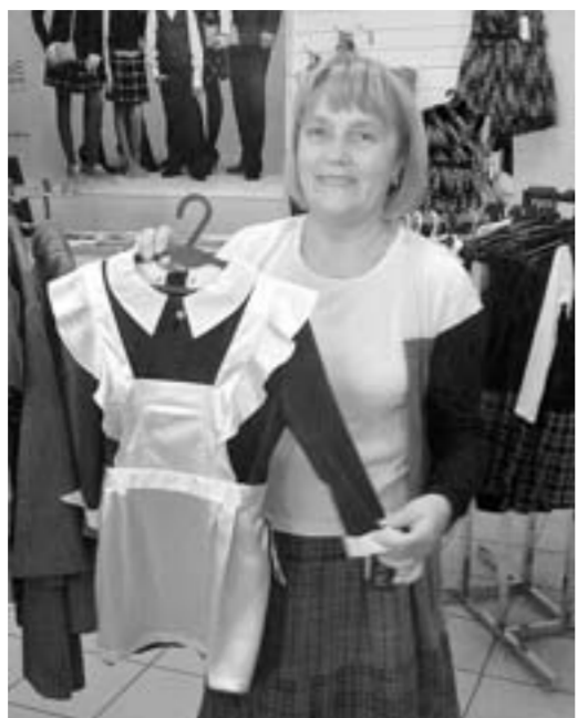
В оптово-розничном центре.