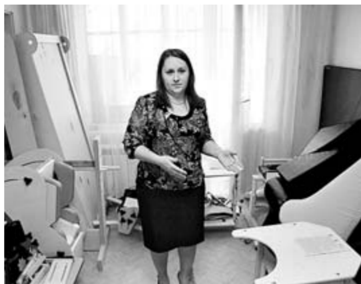
Выбор средств реабилитации достаточно велик.

Средства реабилитации выдаются людям с ограниченными возможностями – инвалидам, маломобильным, тем, кто восстанавливается после травмы, семьям с детьми-инвалидами. Работа пункта проката в первую очередь адресована людям с невысоким достатком, находящимся в трудной жиз-