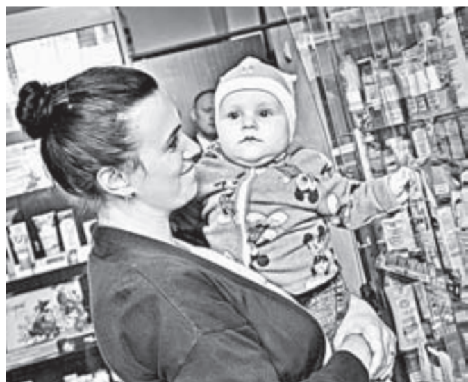
На прилавках – множество препаратов для самых маленьких.