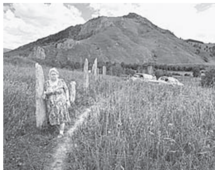
Экскурсия на Царском кургане.

После этого участники автопробега побывали в Покровке — ещё одном отдалённом селе, где заканчиваются дороги. Подняться на горное озеро из-за разведённых от дождей троп не удалось. Зато они смогли добраться до Царского кургана, осмотреть комплекс каменных столбов и повязать ленточки на священном дереве. Потом отправились ещё дальше — в Сентелек, Машенку, Абу. Если бы не дожди, сделавшие грунтовые дороги в горах труднопроходимыми, заехали бы ещё дальше.