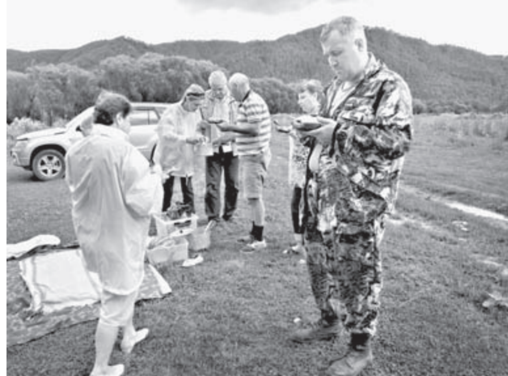
Полевой обед на берегу Чарыша.

По дороге участники автопробега заехали в Усть-Калманку, осмотрели райцентр, а когда пересекли границу Чарышского района, свернули с основной трассы и по грунтовке добрались до села Чайного, расположенного в тупике у подножия Башелакского хребта. Дальше дорог нет, лишь тянутся вершины, густо заросшие деревьями, кустарниками и травой. До ближайшего населённого пункта по горному серпантину с одной стороны 30 километров, с другой — все семьдесят. Горы, окружающие Чайное, местные жители называют Снегирюхой, Камехухой (у неё три вершины) и Рассыпухой (на карте последняя, самая высокая, обозначена как гора Рассыпная, издали кажется, что на её вершину кто-то высыпал гравий). Путешественники заранее планировали здесь восхождение на Камехуху, где растёт чай бадан и открывается прекрасный вид на цепочку окрестных зелёных гор. Но перед этим все посетили деревенское кладбище на горке, где покоится прах родственников большинства из них. Восхождение оказалось не лёгким. Снизу Камехуха не казалась такой высокой, и очень мешала высокая густая трава, в которой заплетались ноги. В