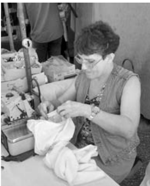
В производственном цехе «Интерлок»

гут обеспечить все объемы, которые требуются сегодня швейной индустрией.