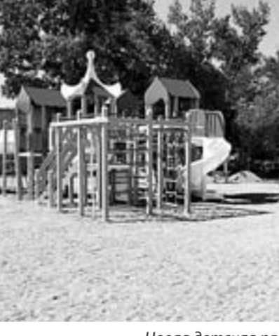
Новая детская площадка в Веселоярске.

Фондом разработана программа «Игра со смыслом». Через игру дети познают мир, приобретают навыки общения, развивают воображение, творческое мышление, физическую форму, уверенность. Именно игра помогает детям, пережившим трагедию, и детям в трудных ситуациях уйти от насилия и отчаяния, развить выносливость и позитивное мышление.