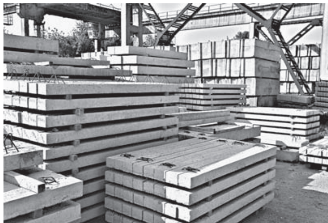
Склад готовой продукции.

ся гнуть и таскать арматуру диаметром 32 миллиметра), сколько вредная. Вентиляция не успевает вытягивать газы, образующиеся при сваривании металла, и в цехе стоит чад.