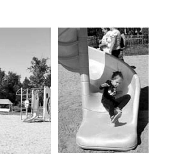
Катание с горки – одно из любимых развлечений ребятни.