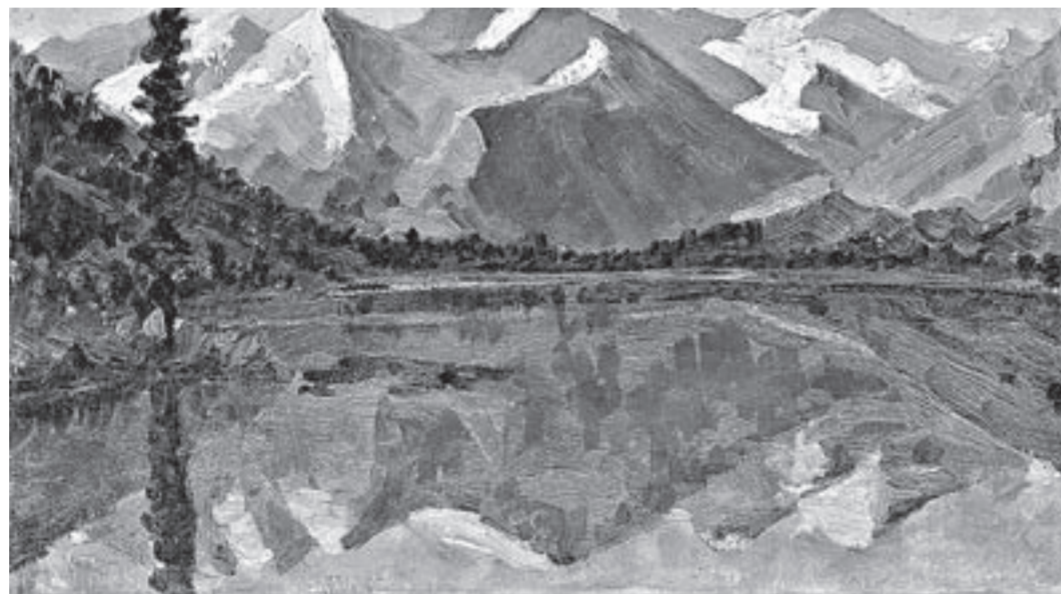
Прокопий Щетинин «Мультипное озеро» (1965). Арт-галерея Щетинных.

Выставки «Сибирский лес» (6+), «Алтай — перекресток культур» (6+), «Рожденная в огне» — из истории керамики Алтая (6+), «Чай пить — долго жить» — из истории чаепития в России (6+). Работают постоянные экспозиции. Экскурсии выходного дня для детей с родителями: