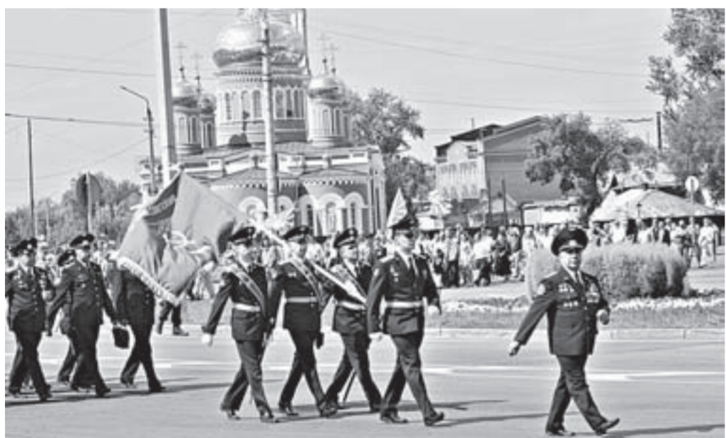
Парадное шествие летчиков.