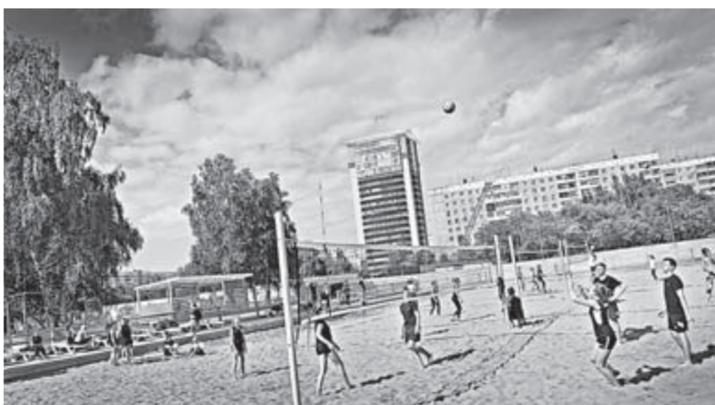
На Алтае возвращается мода на дворовый спорт.

Весь день спортивные площадки парка спорта имени Алексея Смертина были во власти детей. В фестивале дворового спорта участвовали 264 школьника не старше 16 лет из 13 команд Барнаула, Бийска, Павловска и Калманского района. От каждого микрорайона допускались команды по четырем возрастным группам, которые играли в стритбол, пионер-