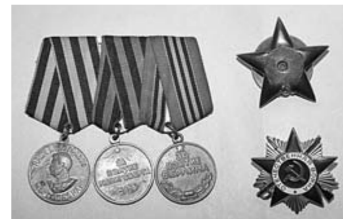
Награды, добытые в боях.