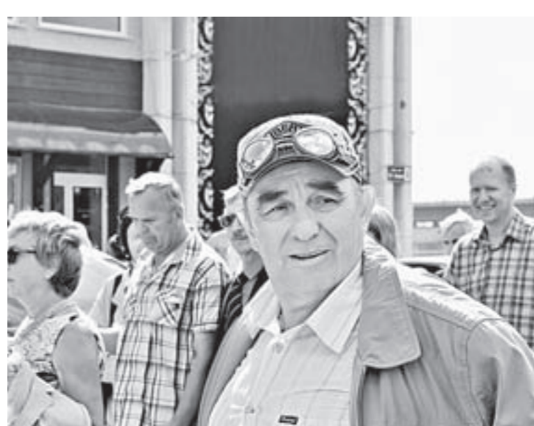
Бывших летчиков не бывает.