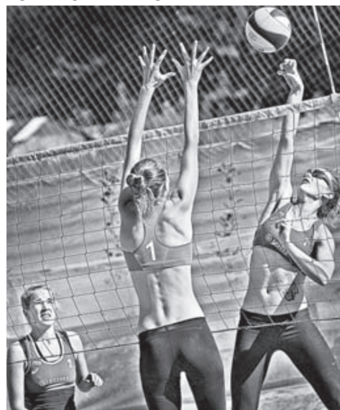
«Пляжка» во всей красе!

бол, мини-футбол. Также в программе были подтягивание, отжимание, перетягивание каната. На кону стояли путёвки в подмосковный город Химки, где пройдёт финал фестиваля, поэтому от желающих посостязаться не было отбоя.