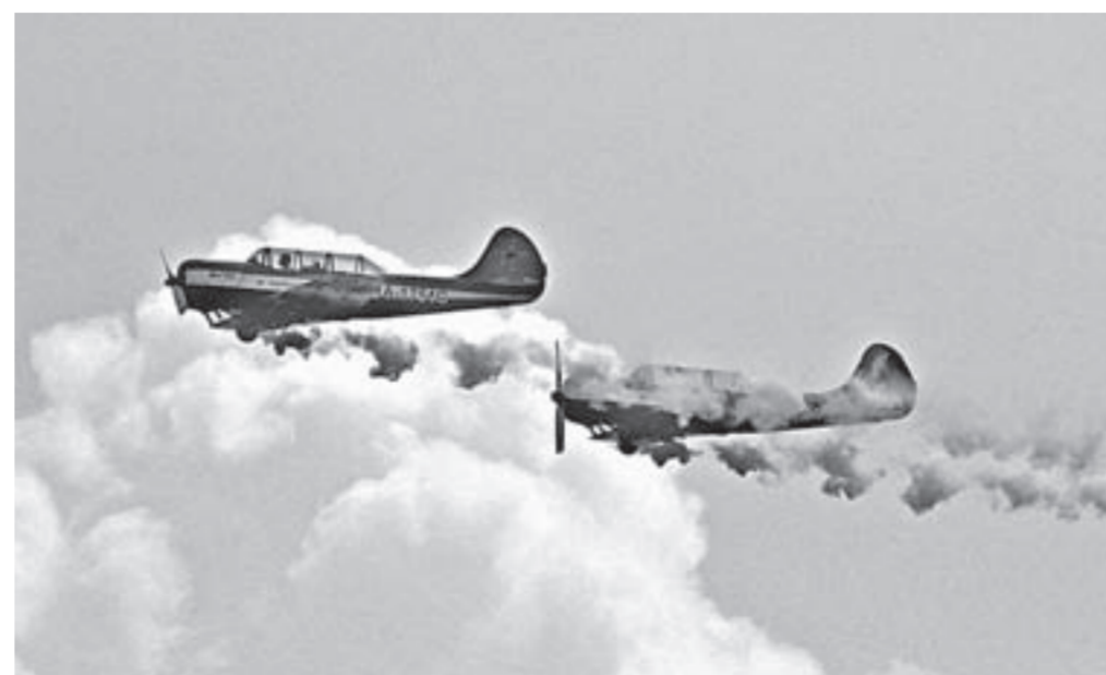
Авиашоу в небе над речным вокзалом.