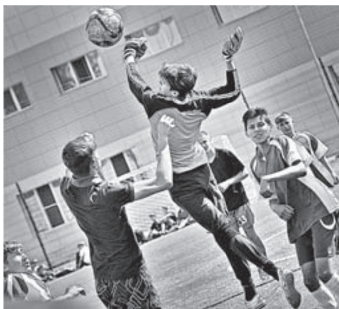
Градус спортивного азарта зашкаливал.