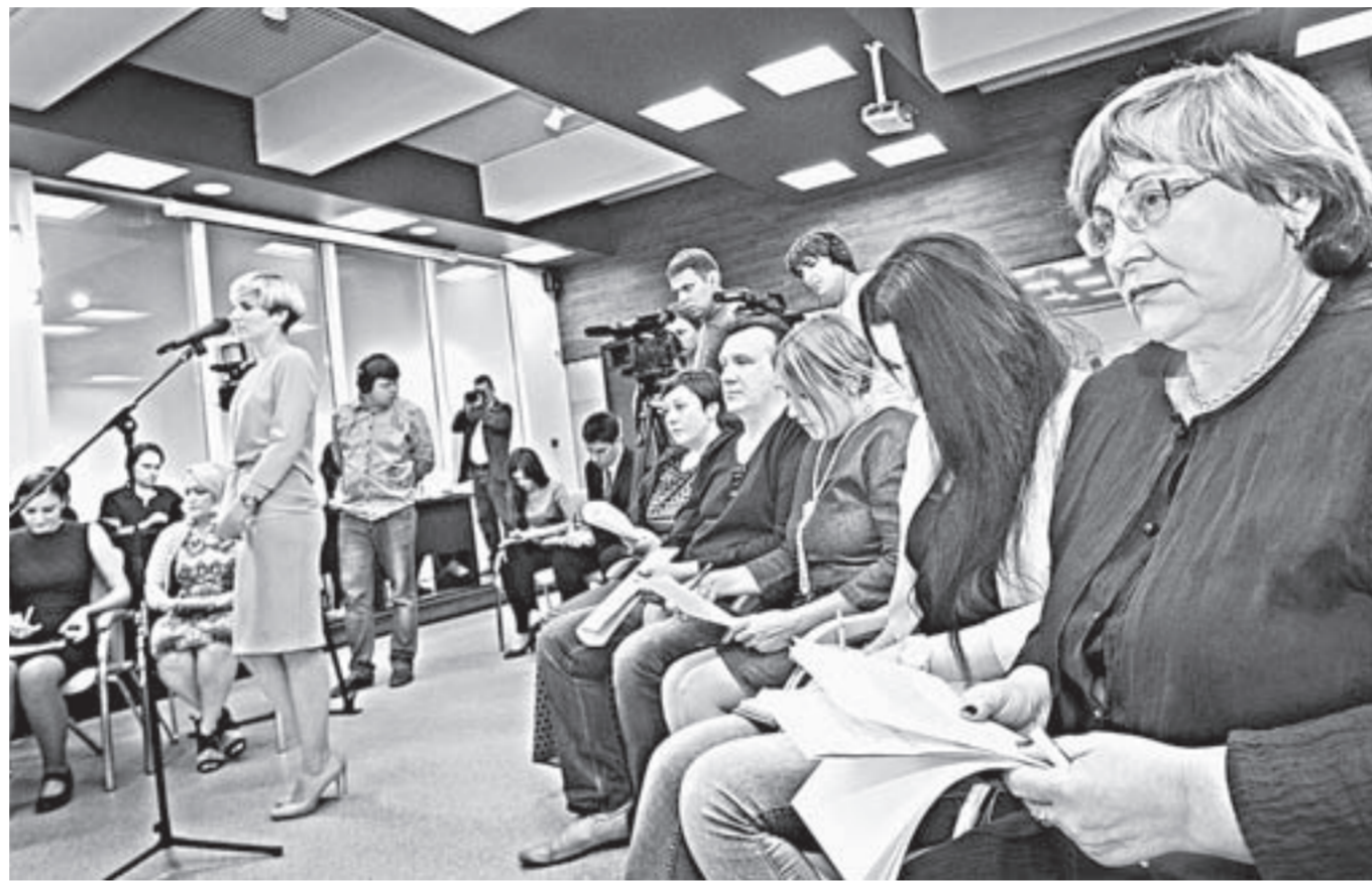
Вопросы задавали жители региона и журналисты.

долгом сделать все, чтобы в регионе вновь не возникла проблема с обманутыми дольщиками. Поэтому ситуация находится на его личном контроле.