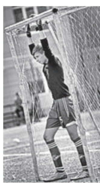
Вратарь – стена!

Теперь учащиеся 37-й школы, составившие костяк команды Железнодорожного