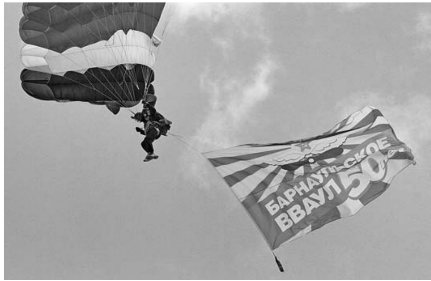
Парашиютист спустился на территорию речного вокзала с праздничным знаменем.