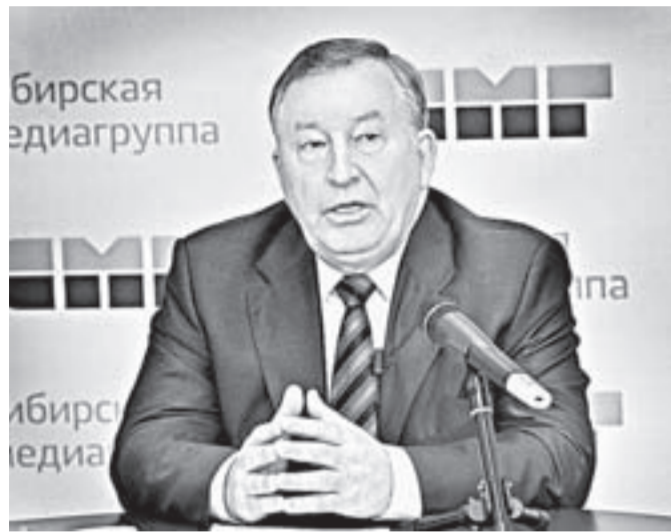
Губернатор считает своим долгом сделать все, чтобы в регионе вновь не возникла проблема с обманутыми дольщиками.

«Прямая линия» с Александром Карлиным: глава региона пообещал помочь с ремонтом детского сада в Суетском районе и взял ситуацию со строительством жилого комплекса «Демидов парк» на личный контроль.