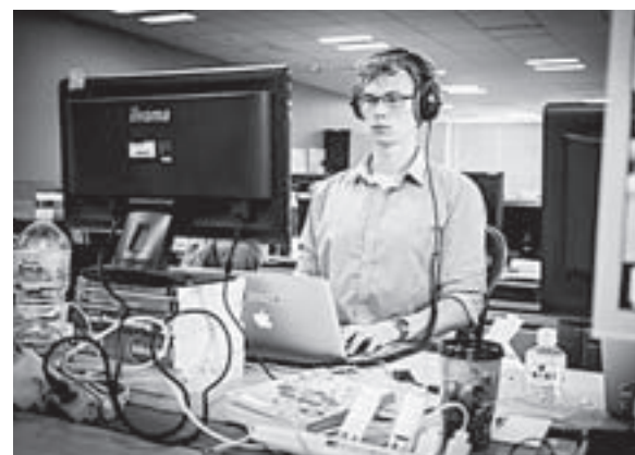
Образ работника в сельском хозяйстве: раньше и сейчас.

того, что происходит в экономике (и национальной, и мировой), мы будем искать пути выхода из кризиса, – сказал глава региона. – В ситуации, когда экономика Алтайского края постепенно выходит из рецессии, мы должны перегруппировать силы, определять дальнейшие направления развития».