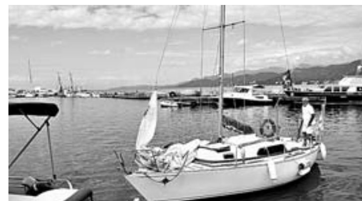
В порту есть место и для прогулочных яхт.

Внешний облик Батуми у человека, впервые увидевшего его, вызывает восхищение. Множество интересной, занимательной архитектуры зданий и сооружений. В основном они сосредоточены ближе к набережной, которая называется Батумский бульвар и также является местной достопримечательностью. Ее протяженность около семи километров. Вымощена плиткой, параллельно располагается гладкая бетонная дорожка, по которой туристы катаются на велосипедах (5 лари в час), электросамокатах и электромобилях. Кстати, периодически на велосипедных дорожках можно встретить электромобили, в которых разрезают следы за порядком полицейские. Деревья и газоны коммунальщики поддерживают в идеальном поряд-