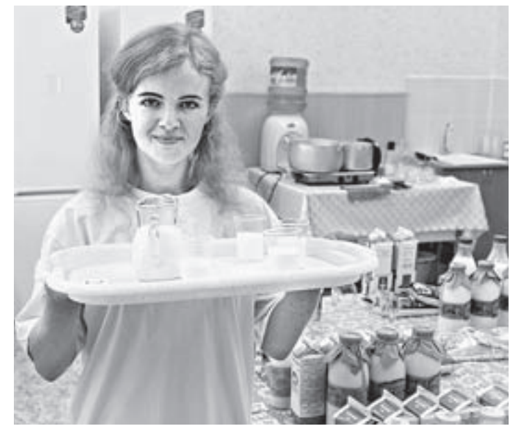
Молоко готово для испытания качества. Канов будет вердикт жюри?

В экспертную комиссию вошло 11 человек, все образцы были засекачены и подавались на дегустацию под номерами. На столе у жюри стояли стаканы с водой, по правилам дегустации требуется после каждого конкурсанта выпивать воду, чтобы оттенки вкуса не смешивались. Кроме вкусовых качеств жюри