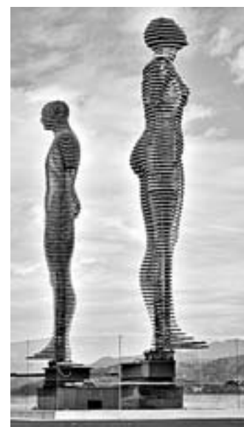
Движущиеся скульптуры Али и Нино.

ке. Стрижку ведут специальными машинами.