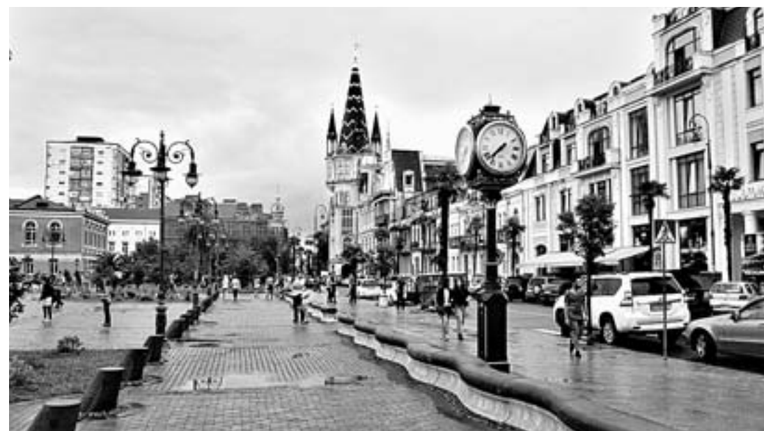
Площадь Европы в Батуми.

Батумский аэропорт меньше барнаульского, но туда летают самолеты больше 20 авиакомпаний из Европы и Азии, включая три российских. Аэропорт находится на краю города, и авиалайнеры