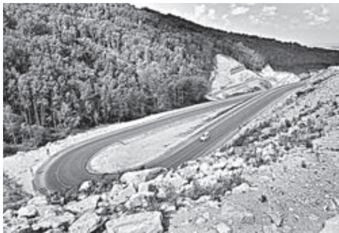
Вид из туристического кластера «Белокуриха-2».

Александр Карлин отметил, что в ходе совместной поездки постарался довести до Сергея Меньяло объективную, неприукрашенную информацию. «Мы намерены серьезно и честно работать с