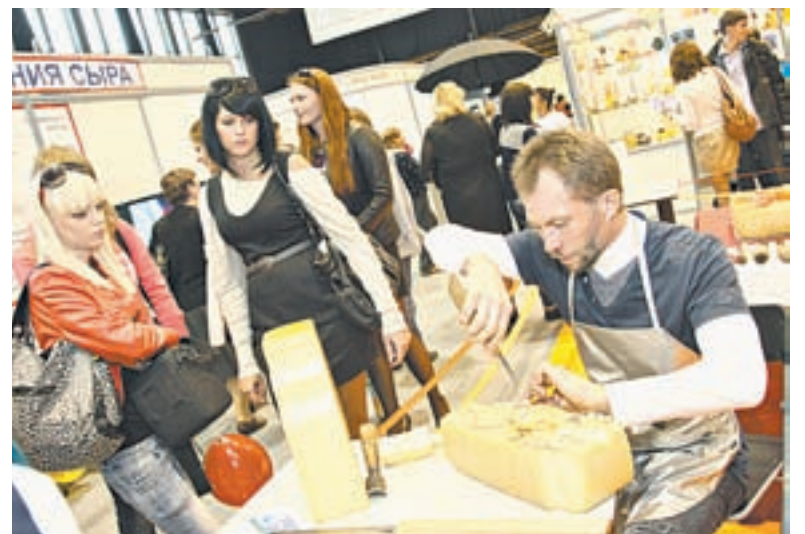
На «Праздник сыра» традиционно собираются и местные жители, и туристы.

служивания в Бийске. Каждый из названных проектов успешно реализуется.