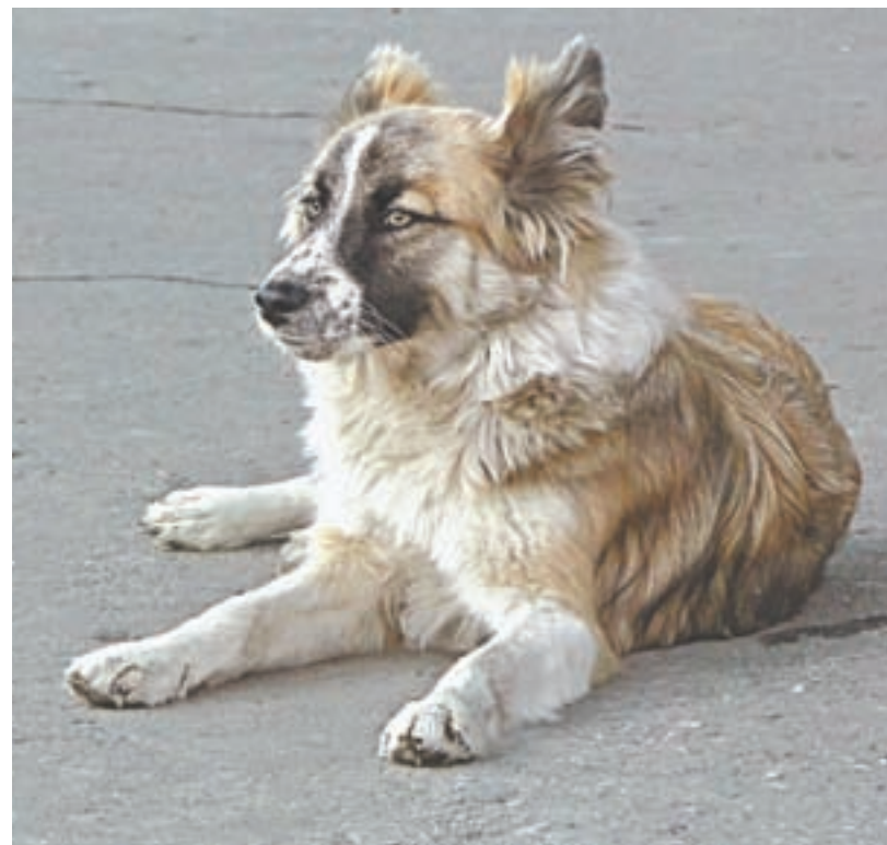
Хорошее отношение к собаке – не только не обидеть. Надо угостить вкусеньким и за ушком почесать.

Обратите внимание на него: голову опустил, хвостик поджал. Просто лапочка! Но вы не умиляйтесь. Вы справедливый, добрый учитель. Продолжайте воспитывать. Пёсик может и огрызнуться. Например, зарычит. Тогда вновь постройтесь. И делать это нужно, кстати, сразу после проступка собачонки, чтобы понятно было, за что ее ругает хозяин. Знающие люди говорят, что, если наказывать не сразу после лужи в коридоре или изгрызенного башмака, питомец вас просто будет бояться. Обратитесь внимание, встречаются, как мы говорим, злые собачонки. Лают, набрасываются. Они просто боятся.