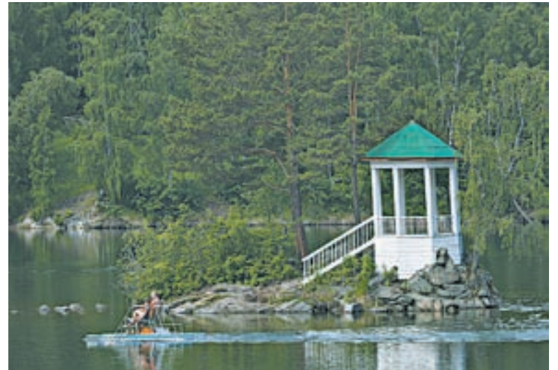
Озеро Ая – одно из самых посещаемых мест в регионе.

На территории игровой зоны «Сибирская монета» работает единственный в Сибири игрово-развлекательный комплекс Altai palace. «Бирюзовая Катунь» – единственная из созданных за Уралом туристско-рекреационных особых экономических зон, где уже сейчас отдыхающие могут воспользоваться широким спектром услуг. Создаваемый в рамках туристско-рекреационного кластера «Белокуриха-2» проект «Белокуриха-2» является уникальным для России. Впервые за последние 25 лет запланировано строительство санаторно-оздоровительного комплекса с нуля, что открывает широчайшие возможности инвестирования в развитие нового курорта. Задачей кластера «Барнаул – горнозаводской город» является расширение потенциала исторического наследия Алтайского края, появление нового сектора услуг. Кластер «Золотые ворота» направлен на повышение конкурентоспособности отечественного туристического рынка, удовлетворяющего потребности российских и иностранных граждан в качественных услугах, формирование современных стандартов об-