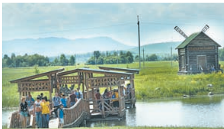
Туристический комплекс «Сибирское подворье» – главная точка событийного туризма.