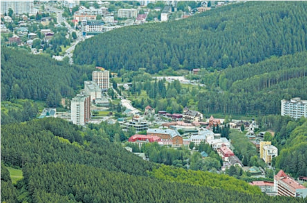
В санаториях Белокурихи летом не было свободных мест.