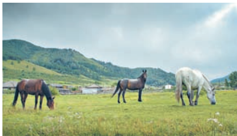
Алтайский край: простор и красота.

Наибольшей популярностью у жителей и гостей региона пользуется именно Яровое. За прошедшее десятилетие количество субъектов туристической инфраструктуры там увеличилось практически в три раза. В настоящее время в городе созданы все условия для комфортного пляжного отдыха. К услугам отдыхающих действуют большой современный аквапарк, пляжно-развлекательные комплексы с водными аттракционами, дельфинарием, прогулочными лодками, катамаранами, пунктами проката.