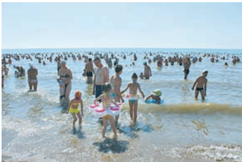
На Яровое с каждым годом приезжает все больше туристов.

Мероприятия Алтайского края вошли в Национальный календарь событий России. Он объединяет информацию о мероприятиях, проходящих во всех регионах страны, и представляет собой не просто путеводитель или базу данных, а полноценную систему обратной связи между организаторами событий, туристическими компаниями, путешественниками.