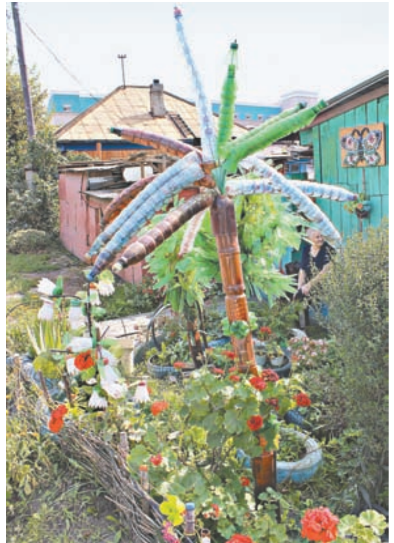
Экзотика переулка Радищева.

– Несколько лет я работала в литейном цехе, потом устроилась на Барнаульский меланжевый комбинат. Если бы не потеряла зрение, то ушла бы оттуда на пенсию. Но случилась у нас в семье трагедия с сыном, от горя зрение упало сильно, за маши-