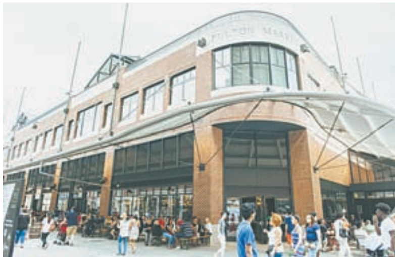
В 2005-м «Фултон Маркет» в связи с убытием отсюда рыбного базара в другой район мегаполиса был обустроен под фешенебельные рестораны и развлекательные заведения.