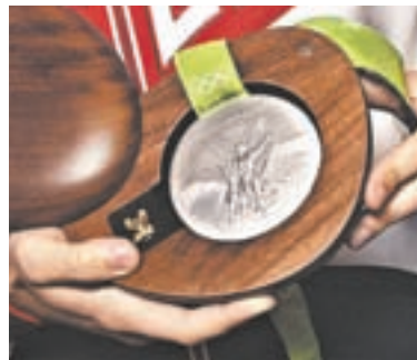
«Серебро» бийчанина стало первой медалью наших земляков в Рио.

Финал для нашего олимпийца получился тем ещё приключением. В стрельбе с колена он заставил понервничать болельщиков, опустившись на четвёртое место. Но всё изменилось в коронной для бийчанина лёжке, в которой он принялся штамповать одну «десятку» за другой и вскоре захватил лидерство, сравнявшись по очкам с Никколо Камприани, выигравшим в этом виде программы предыдущую Олимпиаду. Во время заключительного вида упражнения – стрельбы из положения стоя – ошибки стали возникать у всех финалистов без исключения. Первым напряжения не выдержал россиянин Фёдор Власов,