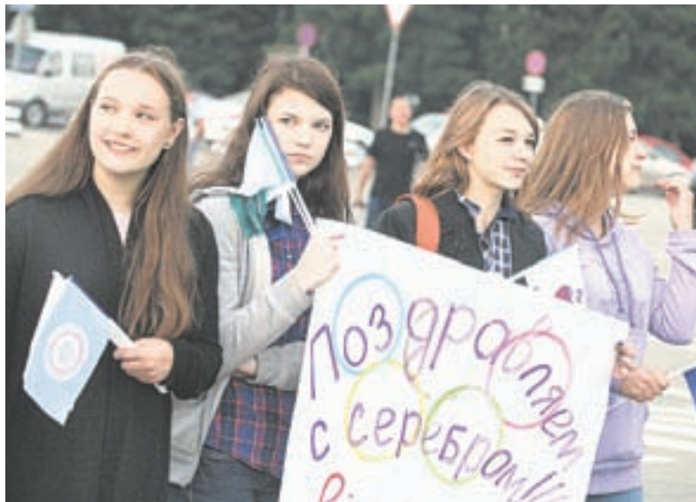
Теплая встреча с болельщицами.

О том, что Сергей может достойно выступить на Олимпиаде, заговорили буквально два года назад. Каменский-младший провёл тогда выдающийся сезон, сначала одержав первую в карьере победу на этапе Кубка мира, а затем став серебряным призёром