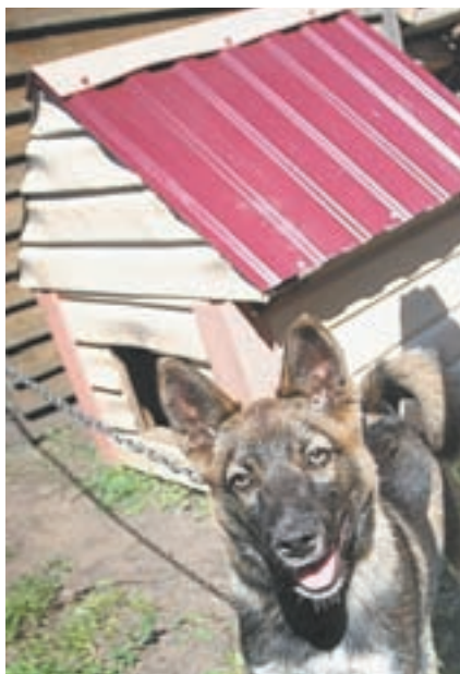
Гав! Я готов играть с вами.

В селе Ларичиха Тальменского района на заборе увидели предупреждающую табличку. В ней выдана характеристика собаке-охраннику. Захотелось хотя бы одним глазком посмотреть на хитрую, агрессивную и злопамятную собаку.