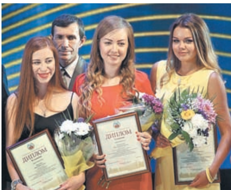
Молодые профессионалы гостиничного дела.