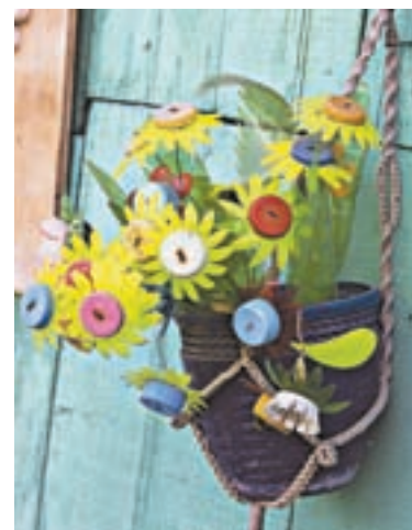
Цветы круглый год.