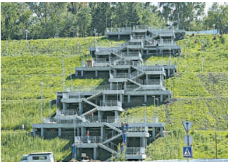
Монтаж лестницы в Нагорном парке завершён.

– Одним из первых объектов, который будет доступен для посещения в рамках кластера, станут террасы склона Нагорного парка. На сегодняшний день на объекте выполнено 90% работ. Установлен бортовой камень, завершена установка лестничных конструкций. Строители готовятся провести освещение на лестнице и террасах. В настоящее время начата разработка концепции благоустройства территории Нагорного парка. Предложено разместить в парке зоны отдыха, аллеи для прогулок, смотровые площадки. Проект будет реализован в 2017 году. Кроме того, в следующем году под буквами «БАРНАУЛ» появится новая набережная Оби. Ее протяженность составит свыше 500 метров. На месте проведут берегоукрепле-