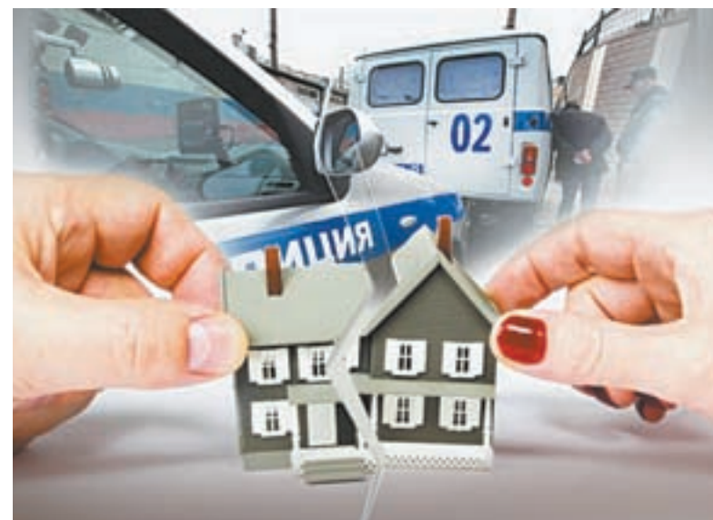
Мотивом убийства стала корысть.

В суде были оглашены показания матери, сделанные после ограбления. Женщина тогда рассказывала в полиции, что между ней и сыном отношения складывались не очень хорошие, они часто ругались из-за того, что тот нигде не работал, требовал от нее