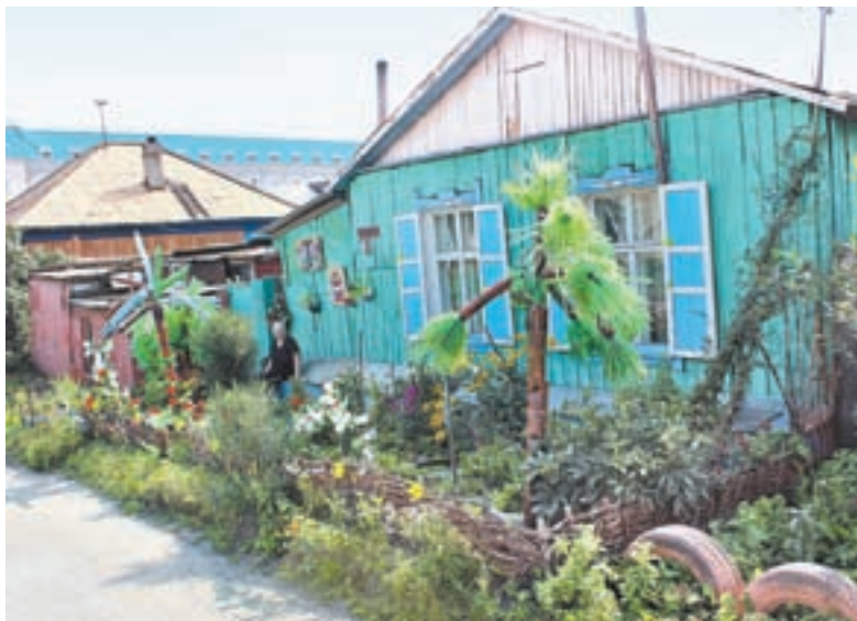
Домик с пальмами.

собирала, чтобы мусора на улице не было, а потом решила украсить ими ограду.